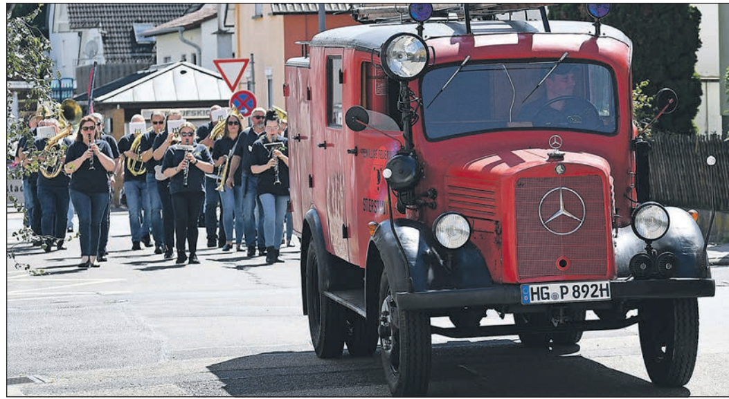
Das historische Fahrzeug der Freiwilligen Feuerwehr führt den traditionellen Umzug zur Stierstädter Kerb an. Hinter ihm folgt der Musikzug der Wehr.