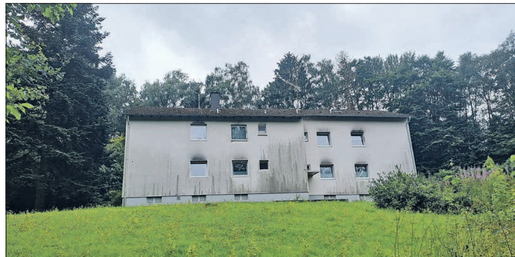
In der Altkönigstraße 176 befinden sich vier Wohnungen, um die sich der BSO kümmern soll, die aber in keinem guten Zustand sind.