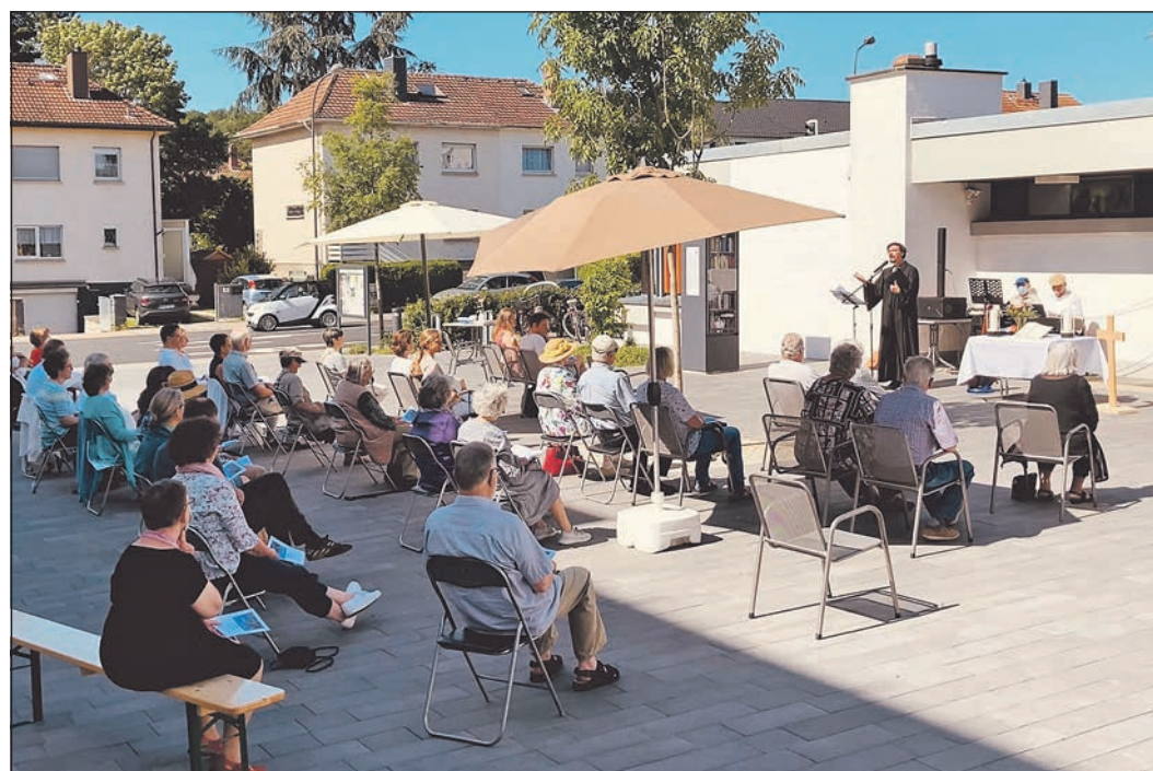
Wie spannend es sein kann, einen Gottesdienst unter freiem Himmel und an ungewöhnlichen Orten zu feiern, zeigt die Reihe „Sommerkirche“. Hier feiert die Gemeinde zusammen auf dem Kirchplatz von Heilig Geist.