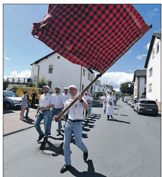
Die Fahne schwenkend dürfen natürlich auch die Kerbeburschen beim Umzug durch Stierstadt nicht fehlen.