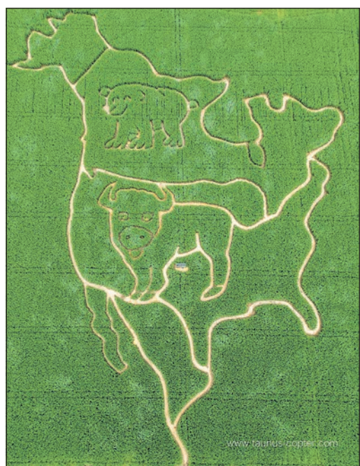
im Internet auf der Homepage www.maisgeister.de . Text/Foto: gt/taunus-copter

In diesem Jahr hat Familie Bickert in Weißkirchen das Thema „Nordamerika“ für ihr Maislabyrinth gewählt. Am Samstag, 20. Juli, geht es um 14 Uhr los. Nach der offiziellen Eröffnung durch Brunnenkönigin Janine I. darf das Labyrinth betreten und die Rätsel gelöst werden. Auf die kleinen Besucher warten außerdem die Ziegen im Streichelzoo, das Maisbad und der Sandspielplatz mit einer riesigen Strohburg. Für Essen und Getränke ist auch gesorgt, natürlich mit passenden Gerichten an den Thementagen. Vier Thementage sind geplant: Das Oldtimer Treffen am 1. September, der Kräutertag am 15. September, das Kartoffelfest am 22. September und das Kürbisfest mit dem beliebten Kürbisschnitzen am 29. September. Das Maislabyrinth ist samstags von 14 bis 19 Uhr und sonntags zwischen 11 und 19 Uhr geöffnet. Der Eintritt beträgt vier Euro für Kinder zwischen vier und neun Jahre, fünf Euro für Jugendliche ab zehn Jahre und sechs Euro für Erwachsene. Der Besuch für Kita- und Schulgruppen an anderen Tagen ist nach Absprache möglich. Weitere Infos und Kontaktmöglichkeiten finden Interessierte