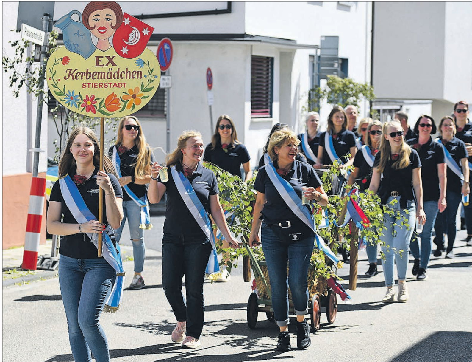
Mit guter Laune, strahlendem Lächeln und einem geschmückten Bollerwagen sind auch die Ex-Kerbmädchen beim großen Umzug durch den Ort mit dabei.