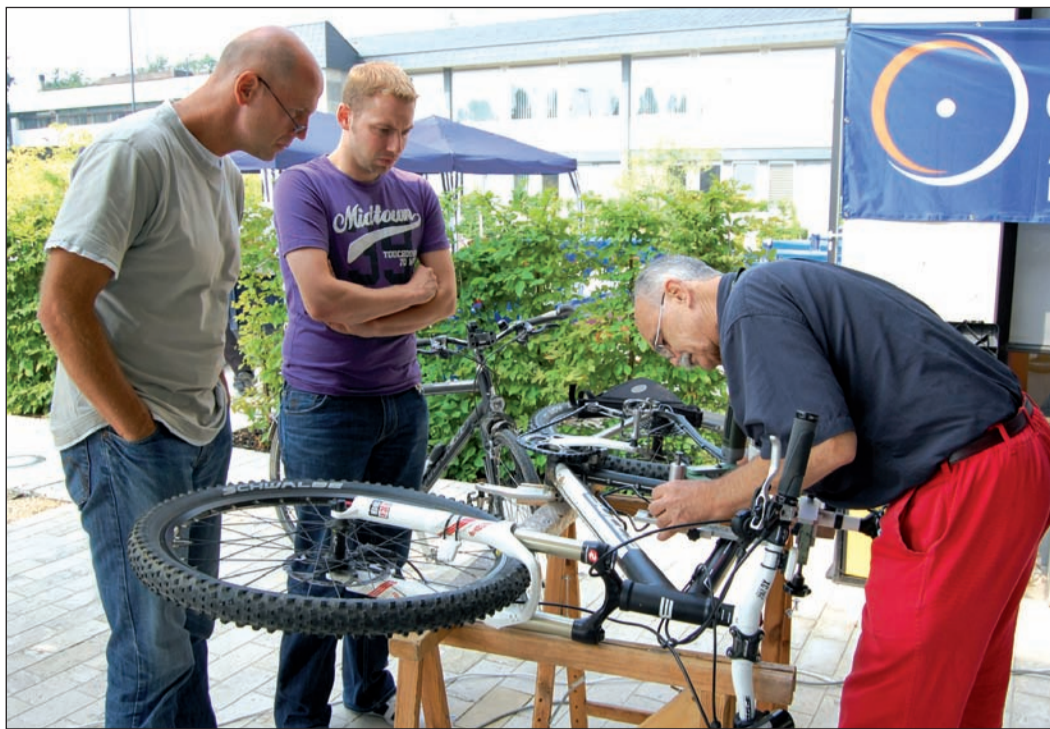
Viele Basler-Mitarbeiter nutzten die Gelegenheit, beim Stand des Allgemeinen Deutschen Fahrrad-Clubs (ADFC) Bad Homburg ihre Fahrräder codieren zu lassen.