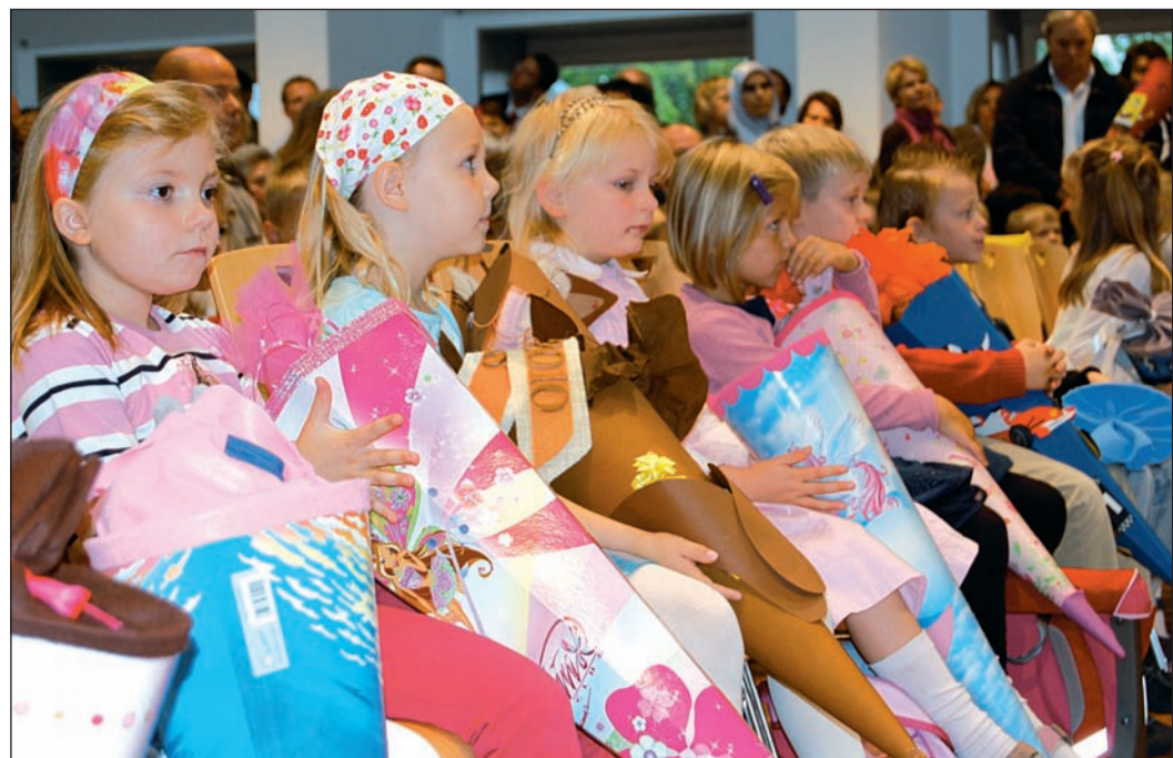
Gespannt erwarten die Mädchen und Jungen ihre erste Unterrichtsstunde in der Grundschule „Im Eschbachtal“. Danach dürfen endlich die großen Schultüten ausgepackt werden.