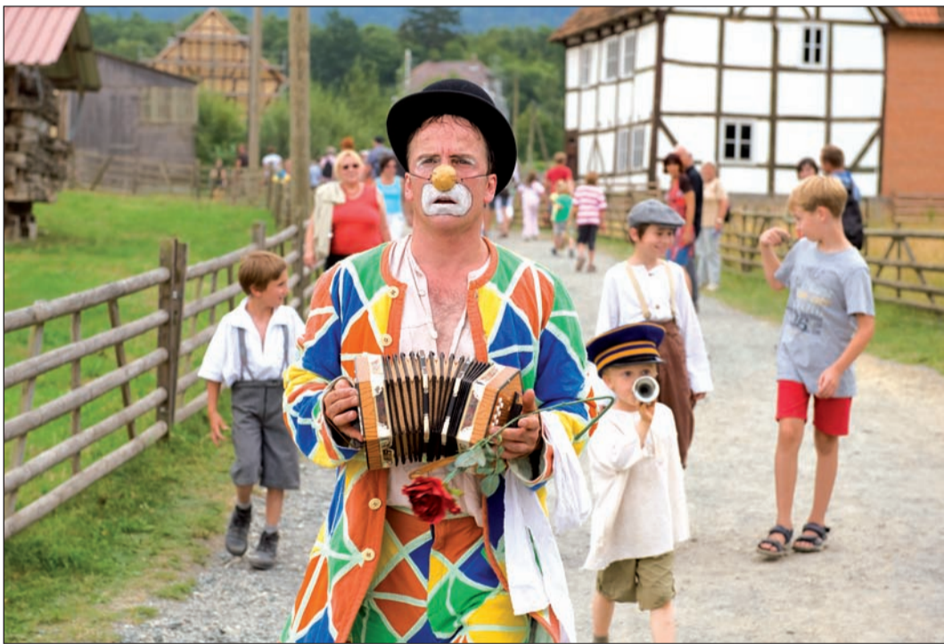
Freilichttheater im Hessenpark: Im Dorf „Nirgendwo“ ist im Sommer harte Erntearbeit angesagt, da bietet ein kleiner Zirkus eine willkommene Abwechslung.

Die Band „A Tribute to Johnny Cash“ erfüllt am Donnerstag, 26. August, um 20 Uhr den Hof des Instituts Garnier mit Klängen des legendären amerikanischen Sängers. Dabei sind Lieder vom frühen Rockabilly ebenso zu hören wie Country oder Folk. Mit Rock'n' Polka endet die diesjährige Sommerbrücke am Freitag, 27. August. Um 20 Uhr betritt das Quintett „HISS“ die Bühne auf dem Parkdeck am Rathaus und macht das Publikum zu Ohrenzeugen einer wilden Fahrt vom Mississippi-Delta zu den Karpaten, von der Donau in die Sierra Madre. Von jedem Stück Erde, das die Musiker betreten, haben sie Klänge und Rhythmen mitgebracht: Balkan-Blues und Texas-Tango, Quetschen-Ska, Ethno-Swing und Fast-Folk. Sie bilden die musikalische Grundlage für ihre Geschichten über die großen Themen Liebe, Leid und Lebenslust, Sünde, Sucht und Suppe.