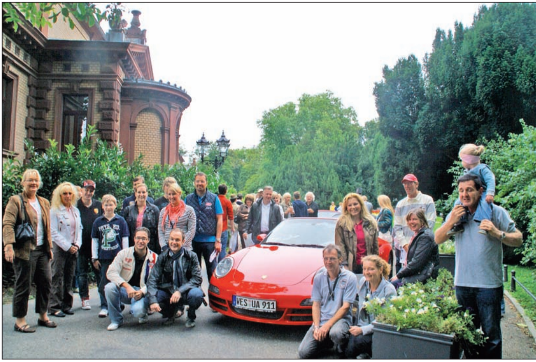
Am Kaiser-Wilhelms-Bad gingen die Mitglieder des Porsche-Clubs Rhein-Main auf die Reise.