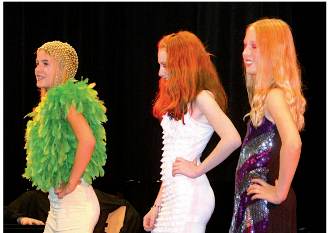
Fröhlich ging es zu bei der Casting-Show der Theatergruppe.

Seulberg (fw). Die Abteilung „Fitness und Gesundheit“ des TV Seulberg bietet ab dem 26. August einen neuen Kurs „Entspannung mit Yoga“ an. Der Kurs umfasst sieben Termine bis zum 7. Oktober und kostet 45 Euro (35 Euro für Vereinsmitglieder). Eine Mitgliedschaft im Verein ist nicht erforderlich. Der Kurs findet donnerstags von 9 bis 10.30 Uhr im Anbau der Hardtwaldhalle, Landwehrstraße 5a, statt. Die Mindestteilnehmerzahl beträgt acht Personen. Anmeldungen über die Geschäftsstelle des Vereins, Tel. 06172-764247, oder E-Mail info@tv-seulberg.de.