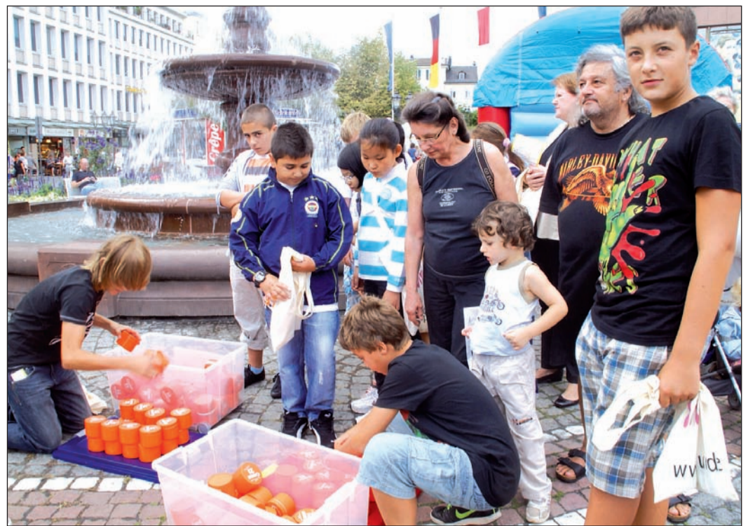
Geschicklichkeit war gefragt beim Cremedosen-Stapeln auf dem Kurhausplatz.

Für Cynthia war es bereits die dritte Olympiade, an der sie teilnahm. Entsprechend souverän erwies sie sich beim Cremedosen-Stapeln auf dem Kurhausplatz und beim Dosen-