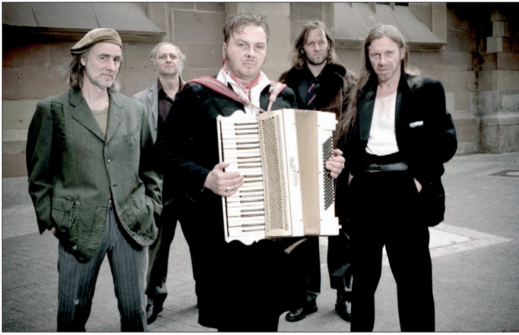
„Zeugen des Verfalls“ bringt das Quintett „HISS“ auf dem Parkdeck des Rathauses zu Gehör.