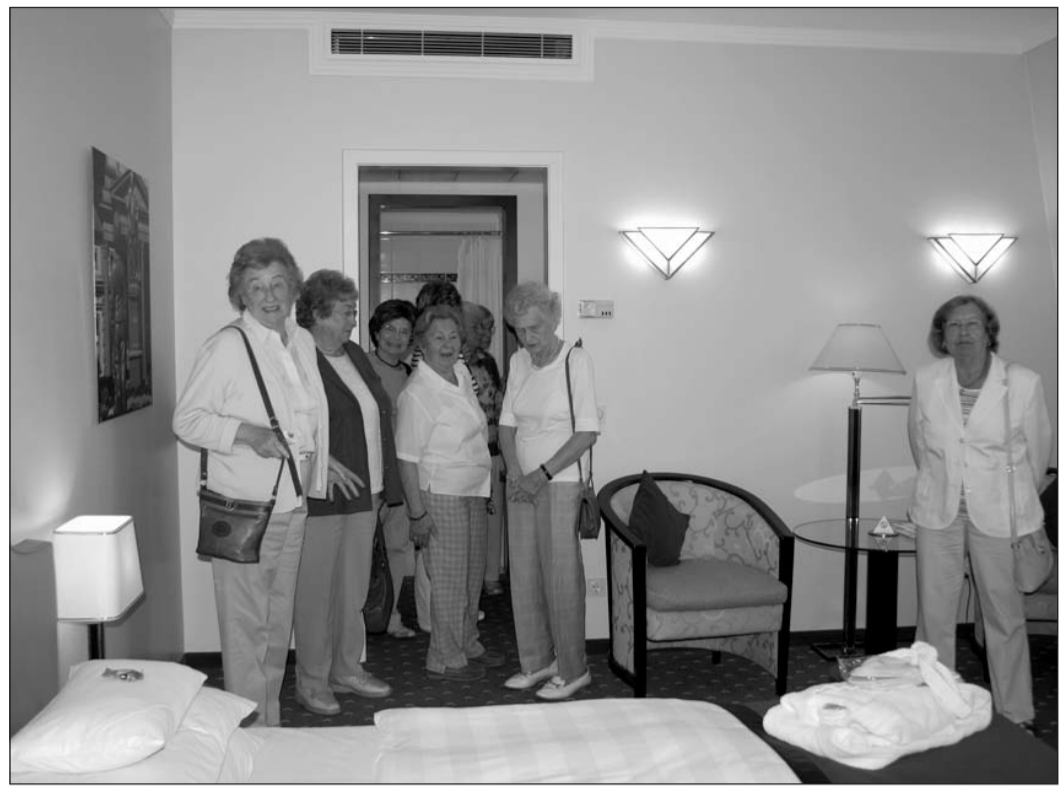
Im Hotel Steigenberger konnten sich die Teilnehmer des „Urlaubs ohne Koffer“ ein genaues Bild von den Übernachtungsmöglichkeiten machen.