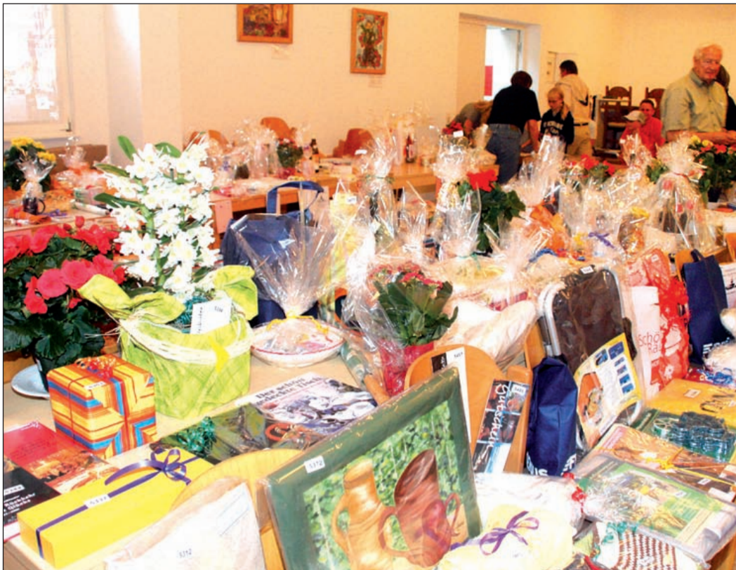
Im Saal des ev. Gemeindezentrums warteten über 600 Preise der Tobola auf die Gewinner.