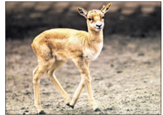
Im Januar sind drei Jungtiere zur Welt gekommen.

schwarz mit weißer Unterseite gefärbt und sie tragen etwa 70 Zentimeter lange, geschraubte Hörner mit Rillen. Die Ricken hingegen haben wie die Jungtiere eine hellbraune Felfarbe mit einem hellen Längsstreifen auf den Flanken. Sie tragen keine Hörner. Die bisher drei Kitze im Opel-Zoo, die im Januar 2025 geboren wurden, laufen mit der Herde mit und sind auf der Anlage im Südteil des Zoos gut zu beobachten.