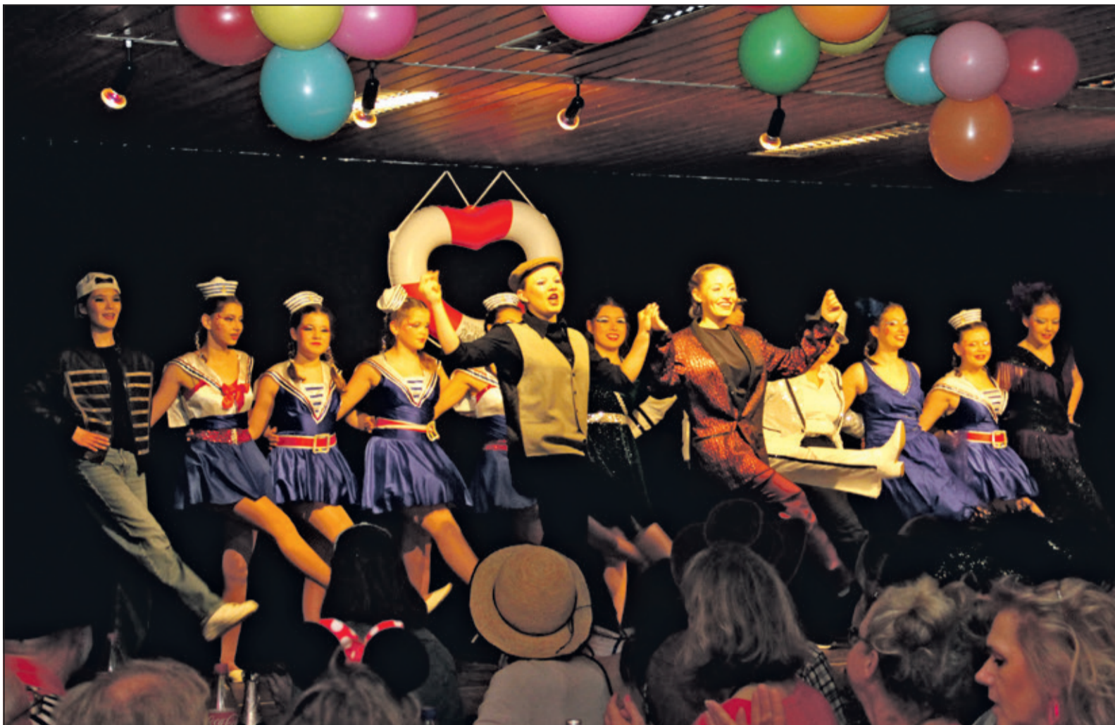
Die Tanzgruppe „Happy Dancers“ präsentieren den Gästen ihr Können auf der Bühne.

Telefon 06196 - 5602 300 willkommen@blumenauer-badsoden.de