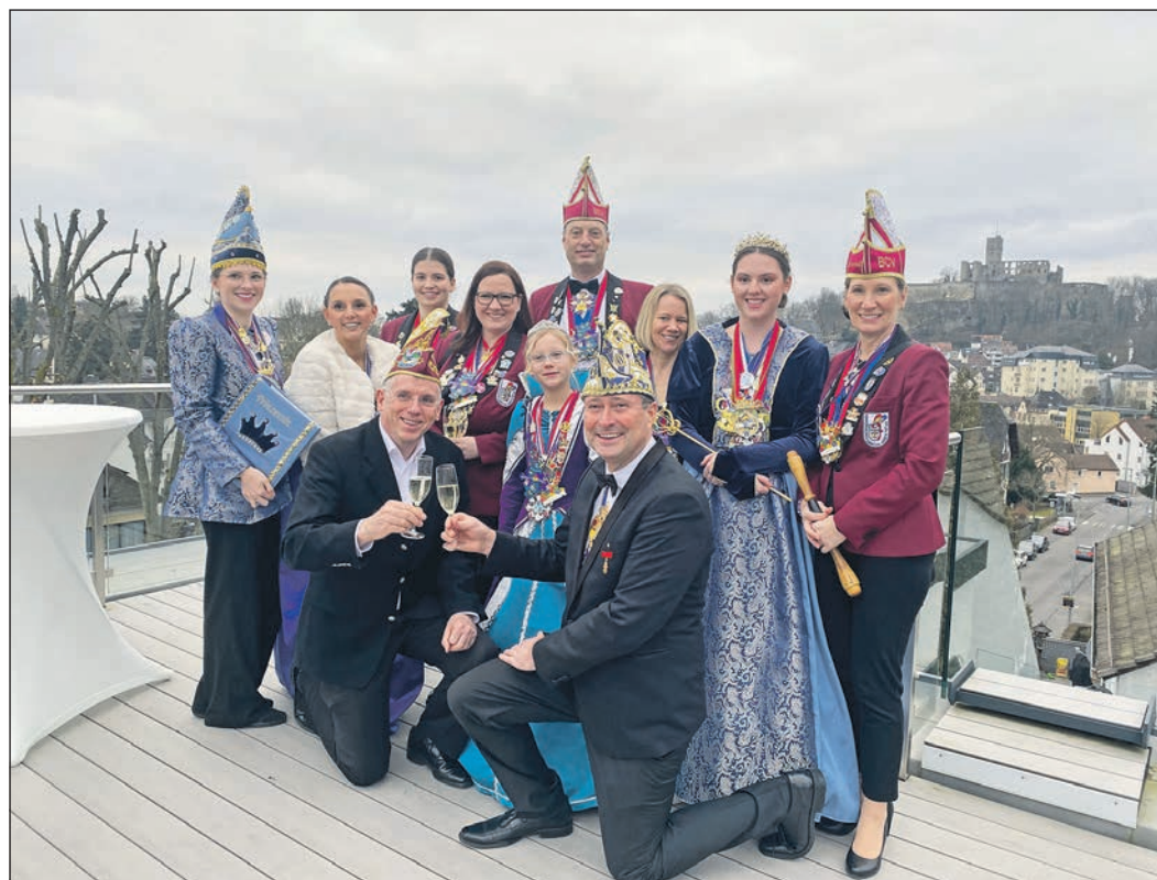
Mit Blick auf die Königsteiner Burg und einem Gläschen Sekt – natürlich nur für die Erwachsenen – stoßen die Tollitäten und Zeitungsmacher auf die fünfte Jahreszeit an.