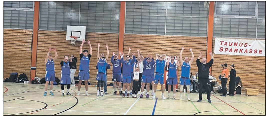
So jubelt die Mannschaft Herren 1 vom TSGO.

Anschließend folgt noch das Duell beim Fünften Weiterstadt 2. Die Triologie der TSGO Korbjäger um die Basketball Oberliga ist eröffnet!