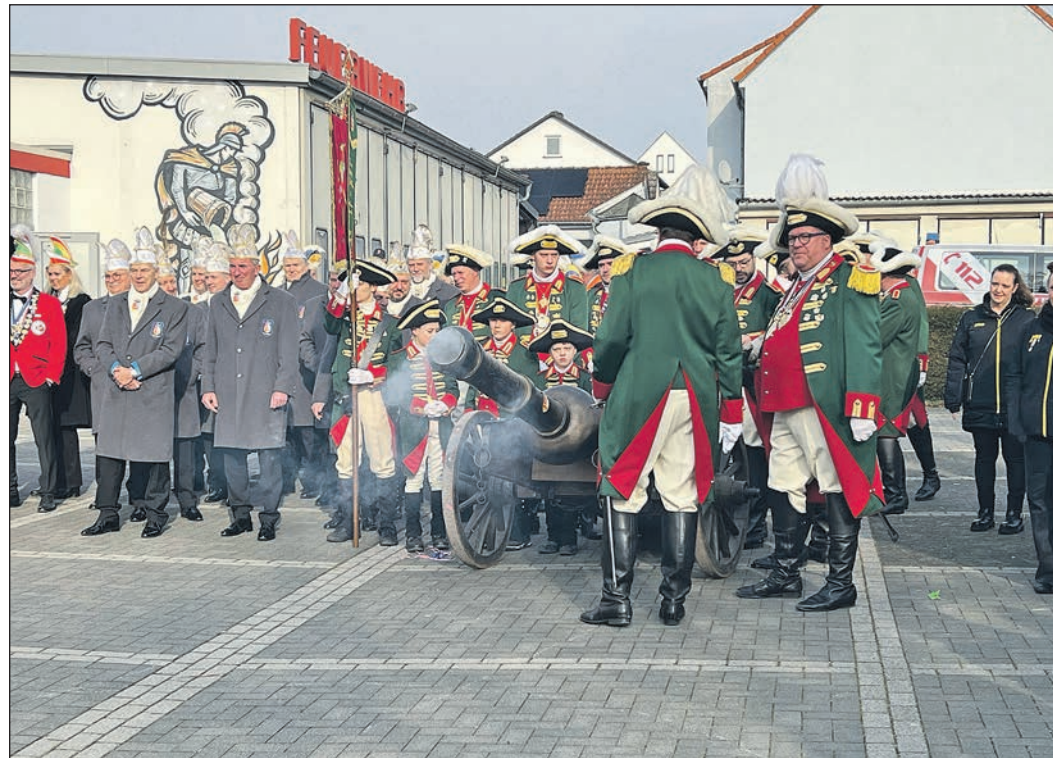
Auch in diesem Jahr „überzeugen“ die Jecken am Ende mit kanonendonnernden Argumenten und nehmen Rathauschlüssel sowie Stadtkasse an sich.

Um 14.25 schwang Knobloch die weiße Fahne, und der Rathauschlüssel und Stadtkasse wurden für die nächsten Tage übergeben – letztere als große Kiste und zum Glück nicht leer: gefüllt mit vielen Kreppeln zur großen Freude nicht nur der Kinder.