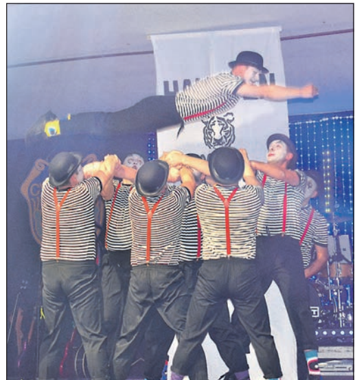
Die „Troubletigers“ vom SV Steinbach wollen mit dem Spiel „Hau den Lukas“ hoch hinaus und punkten nicht nur mit Kraft, sondern auch mit Sympathie.

Damit die Narrenschar auch mal das Tanzbein schwingen konnte, kam die Coverband „Secret Basement“ auf die Bühne. Die vierköpfige Band bietet Musik „von Stierstädtern für Stierstädter“, sowie sie es selbst beschreiben. Sie hätten schon immer das Publikum begeistert und seien unter anderem schon am Mainufer aufgetreten, „aber überzeugt euch selbst“, forderte der Sitzungspräsident auf.