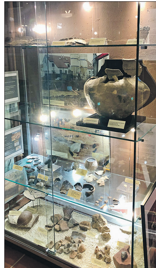
Vitrine mit Exponaten im Heimatmuseum.

Wer neugierig geworden ist, kann das Heimatmuseum gerne besuchen. Es hat jeden ersten Samstag von 11 bis 14 Uhr – letzter Einlass 13.30 Uhr – geöffnet. „Wir freuen uns, Sie am 1. März begrüßen zu dürfen“, so der Verein für Geschichte und Heimatkunde.