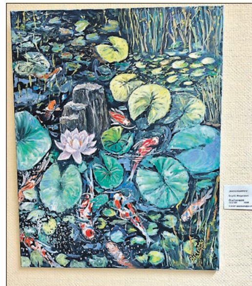
Hier ist ein Bild der Ausstellung, mit dem Titel „Wassergarten“ von Birgit C. Morgenstern, zu sehen.

den kann, das ihm gefällt, und das er vielleicht mit nach Hause nehmen möchte, denn alle Bilder sind auch käuflich zu erwerben. Knallgelbe Bilder mit Joker stechen sofort ins Auge, Wolken über dem Taunus und Goldfische im Teich, Porträts mit Damen und Katzen und idyllische Postkarten-Impressionen beeindrucken mit Farbe und Komposition. Die Ausstellung ist noch bis Freitag, 28. März, zu sehen, täglich von 10 bis 19 Uhr.