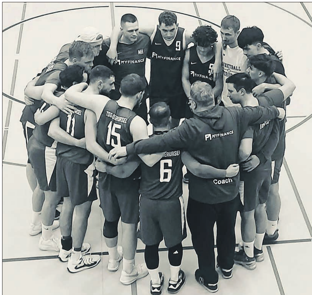
Für die Basketballer Herren 1 der TSG Oberursel steht am Samstag beim kommenden Heimspiel die Vorentscheidung um den Oberliga-Aufstieg an.