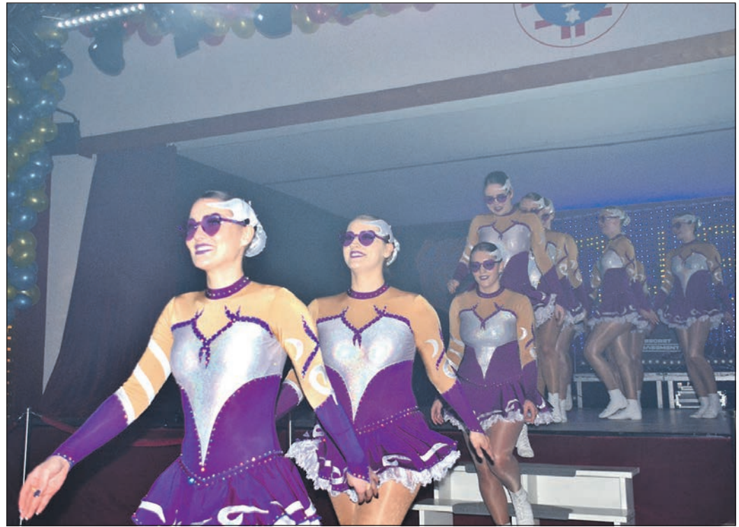
Die „Maxigarde“ des „CV-Stierstadt“ marschiert, nach einem hervorragenden Auftritt, zufrieden und in Begleitung von tobendem Applaus, von der Bühne. Ihre lila Herzbrillen stechen dabei besonders hervor.

Abschließend konnten sich die Zuschauer über einen weiteren Auftritt von „Secret Basement“ freuen, der dem Abend einen passenden Abschluss verlieh.