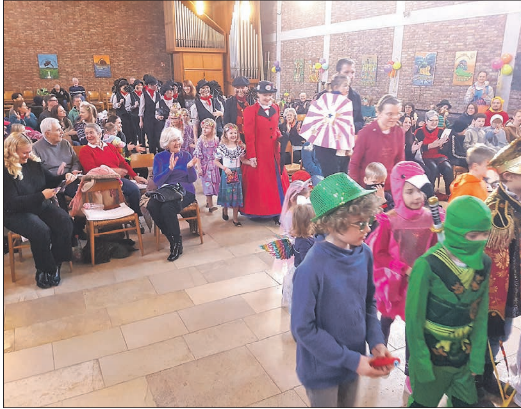
Bereits im letzten Jahr kam der Gottesdienst gut an.