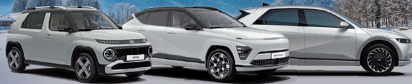
Abb. zeigen Sonderausstattung