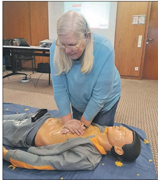
Klientin bei der Übung der Herzdruckmassage.