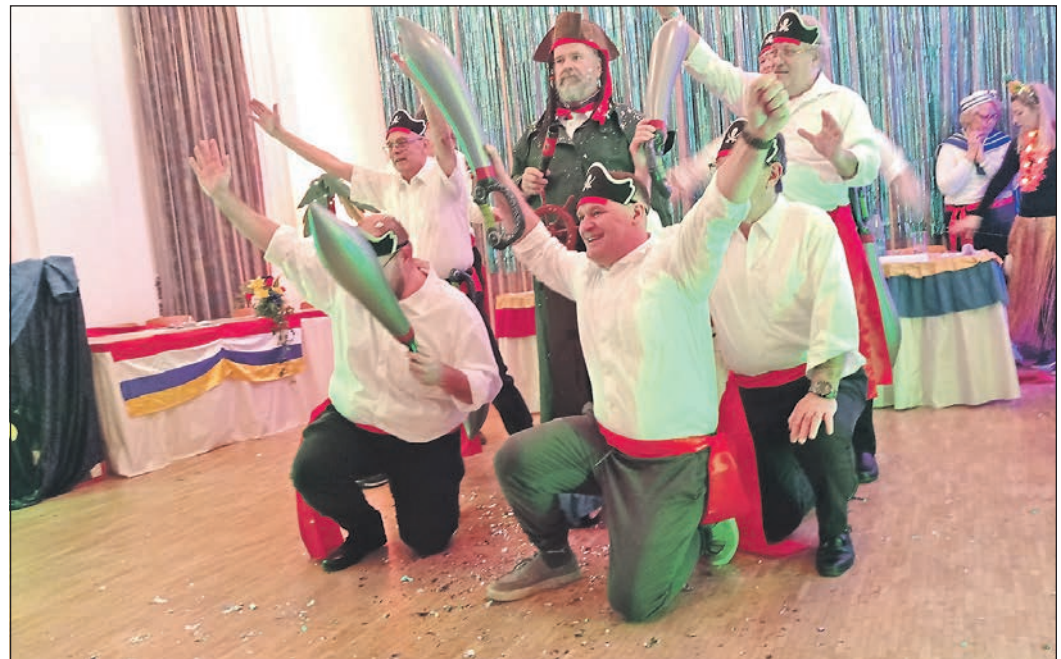
Der Piratentanz der „echten Bommersheimer Seebären“ bildet den krönenden Abschluss der närrischen Veranstaltung (fast) nur für Frauen.