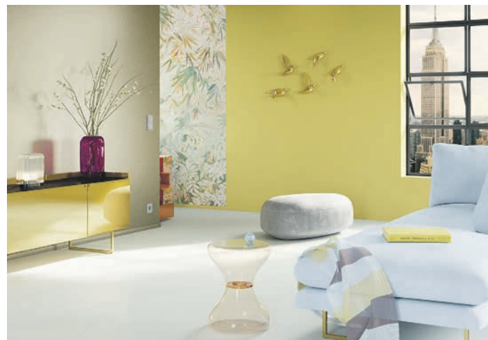
Neue Farben verändern im Handumdrehen die Wirkung eines Raum. Unter den angesagten Lieblingsfarben 2025 finden alle ihren persönlichen Favoriten.

Rot-Anteil ist somit passend für alle, die sich bewusst individuell abheben wollen und gerne in Szene setzen. Mit den Farbtrends 2025 dürfte es leichtfallen, Räumen einen neuen Charakter zu verleihen. Unter www.brillux.de/zuhaus etwa gibt es mehr Informationen und Adressen von Malerfachbetrieben, die individuelle Wohnträume verwirklichen.