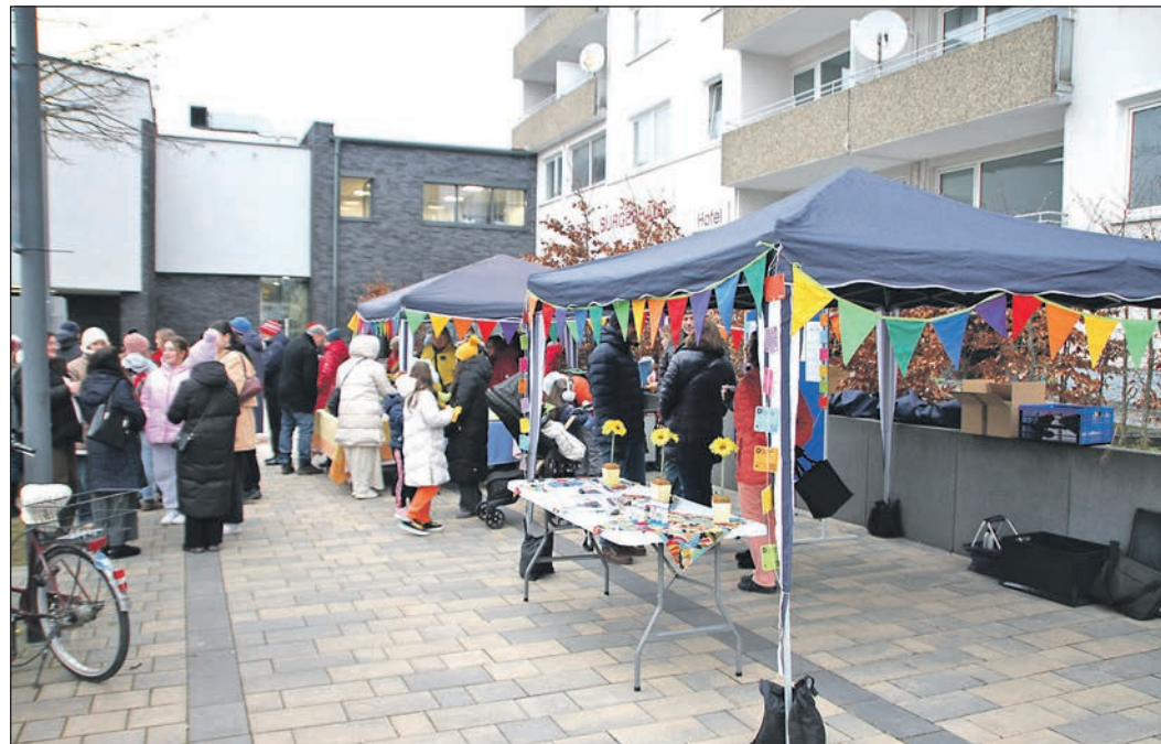
Zum Fest „Vielfalt feiern – Demokratie wählen!“ – ausgerichtet von „Buntes Steinbach“ – werden die zahlreichen Besucher mit einer Mischung aus Kultur, Musik und Kulinarik begrüßt.

Das nächste Netzwerktreffen von „Buntes Steinbach“ findet am 19. März von 19 bis etwa 21 Uhr in den Räumen von St. Bonifatius in der Untergasse 27 statt. Alle Interessierten sind herzlich eingeladen, sich zu vernetzen und an einem aktiven Austausch teilzunehmen. Kontakt können Interessierte per E-Mail an info@buntes-steinbach.de aufnehmen.