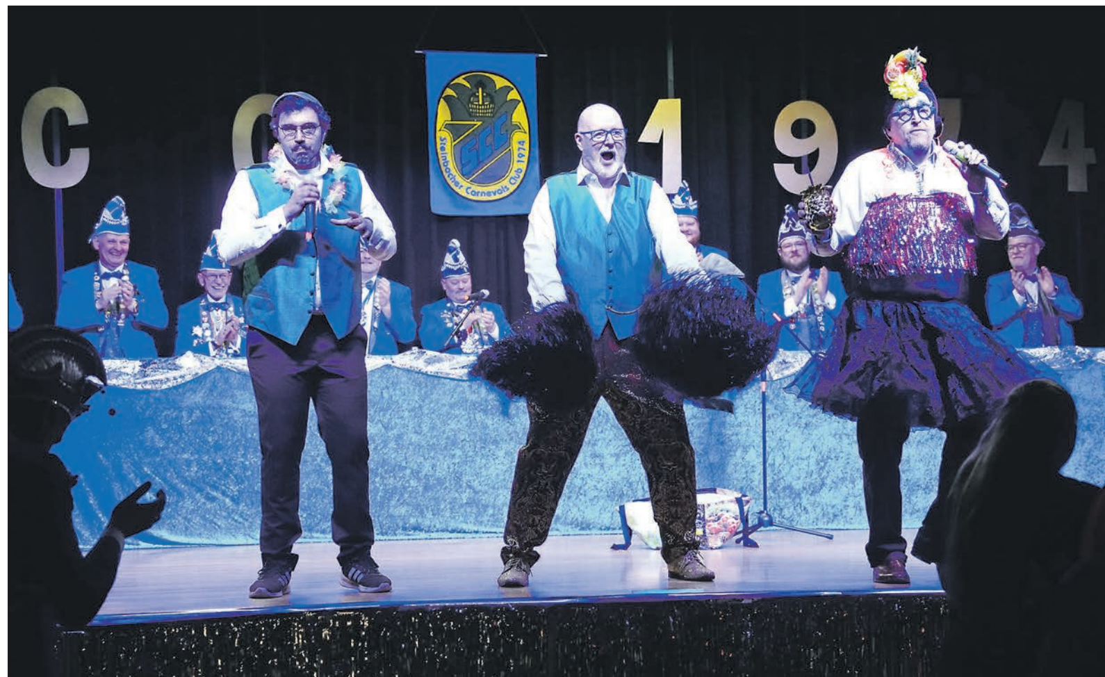
Bei der Prunksitzung des Steinbacher Carneval Clubs (SCC) heizt das „Hessebube Terzett“ die Stimmung im Saal an. Das Trio zeigt seine Vielseitigkeit mit Gesang und Cheerleading gepaart mit einer spritzigen Prise Hessencomedy pur.