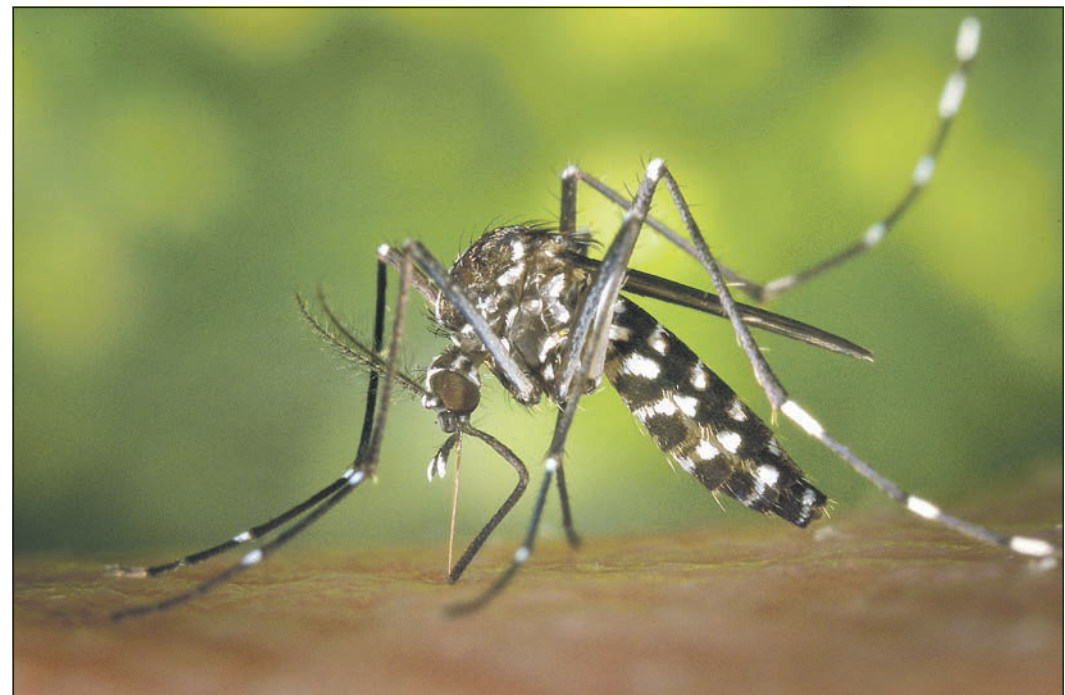
Besonders auffällig an der Asiatischen Tigermücke ist ihre weiße Zeichnung auf dem Rücken. Wer ein Exemplar sieht, sollte das melden.

Main-Taunus-Kreis (ew). Die Asiatische Tigermücke verbreitete sich als blinder Passagier in den vergangenen Jahrzehnten weltweit durch den globalen Handels- und Reiseverkehr und ist inzwischen auch im Main-Taunus-Kreis angekommen. Wer eine der Mücken sieht, sollte seine Beobachtung melden. Auffällig ist das schwarz-weiß gestreifte Muster am ganzen Körper und besonders gut sichtbar ist der weiße Streifen auf Hinterkopf und Rücken. Die Tigermücke misst etwa 0,5 bis 1 Zentimeter. Im Vergleich zu einheimischen Stechmücken ist sie daher eher klein. Das Dezernat Klimawandel und Gesundheit im Hessischen Landesamt für Gesundheit und Pflege (HLfGP) hat in Zusammenarbeit mit der Koordinierungsstelle im Hessischen Gesundheitsministerium ein Tigermücken-Monitoring in Hessen aufgebaut. Die Verbreitung der Tigermücke soll so im Blick behalten und Empfehlungen zum Gesundheitsschutz für zuständige Behörden und die Bevölkerung bereitgestellt werden. Sichtungen und Funde können gemeldet werden per E-Mail an klima@hlfgp.hessen.de. Meldungen per Foto sind insbesondere zielführend, wenn der arttypische weiße Streifen auf dem Rücken der Tigermücke darauf zu sehen ist. Eingefangene Exemplare sollten möglichst nicht zerquetscht werden und können nach Rücksprache mit dem HLfGP auch per Post eingeschickt werden.