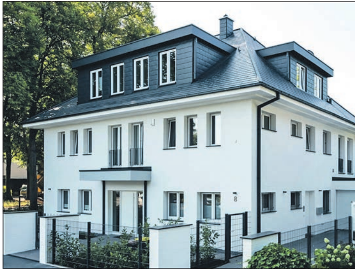
Kleine Elemente wie Dachrinnen und Fallrohre oder die Verkleidungen von Mauerabschlüssen beeinflussen die Gesamtwirkung einer Hausfassade.

Baumpflege, Baumkontrolle & Gutachten, Bäume fällen, schneiden & roden. Hecken roden & Gartenpflege Tel. 06171/69 41 543 www.oberurseler-forstdienstleistungen.de