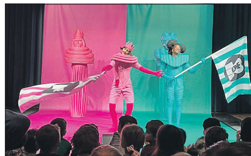
Das Stück „Bully Bully“ war sehr bunt.

Theatergruppen aus Berlin, Spanien und den Niederlanden waren zu Gast in Eschborn. Die außergewöhnlichen Stücke drehten sich um Wortakrobatik, eine fantastische Reise mit Wollfäden und um ein absurdes königliches Gerangel. „Das Programm war wieder einmal sehr sehenswert und brachte nicht nur das junge Publikum zum Staunen“, heißt es in einer Mitteilung der Stadtverwaltung.