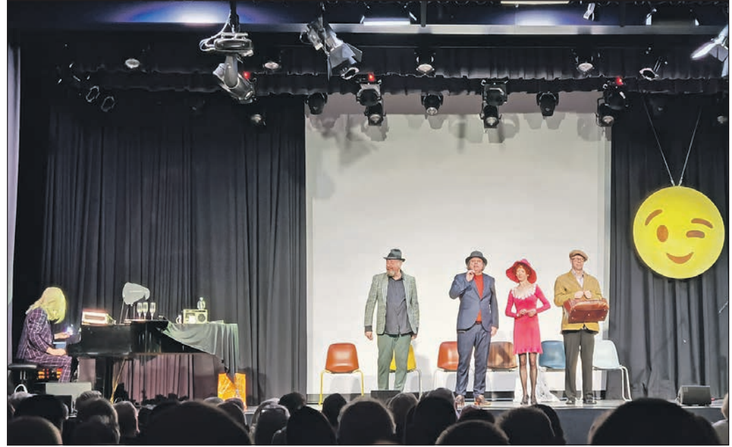
Mit ihren bissigen Pointen brachte die Kabarettgruppe „Distel“ das Publikum im Saal des Niederhöchstädter Bürgerzentrums zum Lachen und zum Nachdenken.