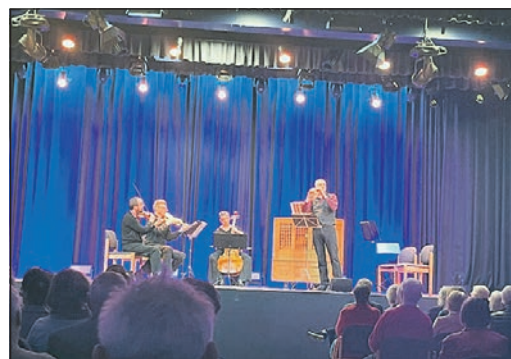
Instrumente des 18. Jahrhunderts waren beim letzten Konzert der Saison im Bürgerzentrum zu hören.

Mit versiertem Spiel beeindruckten die Musikerinnen und Musiker die begeistertsten Zuhörer. Am Ende gab es eine Einladung an das Publikum, auf die Bühne zu kommen, um die Instrumente näher kennenzulernen, was einige interessierte Zuhörer erfreut wahrnahmen. Insgesamt war es ein glanzvoller Abschluss der Konzertsaison des Echo-Klassik-Preissträgers mit wunderschöner Kammermusik.