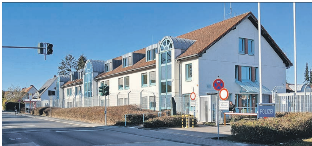
Offensichtlich große Probleme gab es in den Jahren 2022 und 2023 in der Polizeiinspektion Eschborn. Aufgrund von Personalengpässen blieben mehrere hundert Fälle liegen.

Warum in der Dienststelle in der Hauptstraße 200 im Jahr 2022 und teilweise auch 2023 so viele Fälle liegen blieben, ist nicht genau geklärt. Eine Sprecherin des Polizeipräsidentiums spricht von einem „Personalengpass, der mittlerweile behoben ist“. Hört man sich in Eschborn um, erfährt man, dass es in dieser Zeit wohl mehrere Dauerranke gegeben hat. Außerdem hielt vor drei Jahren eine Vielzahl von Raubüberfällen durch Jugendliche die Polizeiinspektion auf Trab, die dafür eine spezielle Arbeitsgruppe bilden musste. Diese hat weiteres Personal gebunden, das dann an anderer Stelle fehlte. Man habe „priorisieren“ müssen, erklärt die Polizeisprecherin. Genauer will sich das Polizeipräsidentium in Wiesbaden nicht äußern, auch nicht, warum die Eschborner Kolleginnen und Kollegen in der schwierigen Situation nicht aus anderen Dienststellen oder Abteilungen mit Personal unterstützt worden sind.