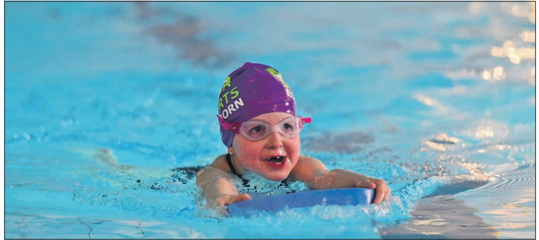
Beim ASE-Nachwuchspokal gingen viele erstmals an den Wettkampfstart.