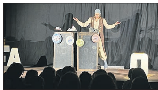
Auch der Pop-Up-Pirat begeisterte die Eschborner Kinder.