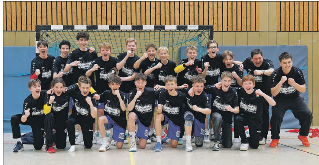
Die C-Jugend-Mannschaft der HSG Schwalbach/Niederhöhnstadt wurde Meister in der Handball-Berzirksoberliga.

Zum letzten Bezirksoberliga-Heimspiel der Saison begrüßte die mB1-Jugend der HSG die FTG Frankfurt in der Halle der Albert-