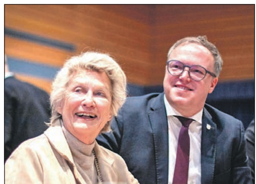
Petra Roth und Mario Voigt waren die „Stargäste“ beim jüngsten Schlachtfest der CDU.

Gleich zwei bekannte Gesichter der Christdemokraten hatten sich angesagt: Zum einen hielt mit Mario Voigt der thüringische Minis-