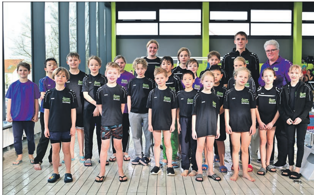
Sehr erfolgreich waren die Schwimmerinnen und Schwimmer von Aqua Sports Eschborn beim jüngsten Schwimmwettkampf in Bruchköbel.