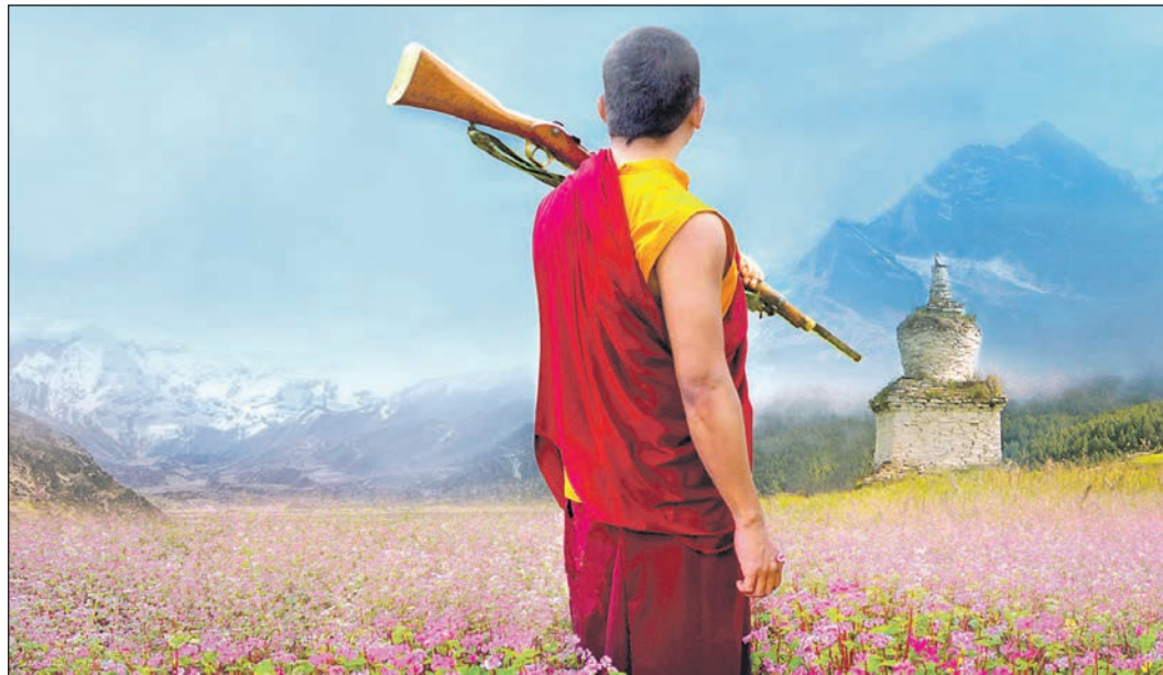
Warum der Lama im bhutanesischen Bergland ein Gewehr mit sich herumträgt, kann der gleichnamige Film auch nicht erklären.