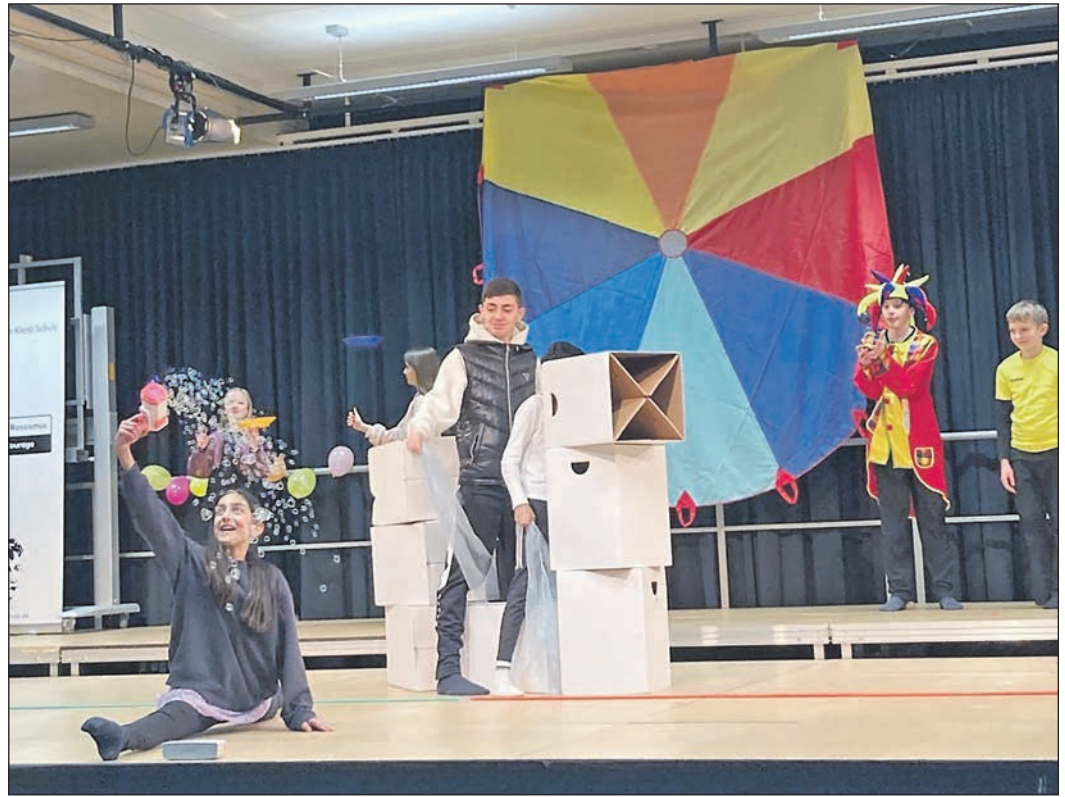
An verschiedenen Orten in der Heinrich-von-Kleist-Schule stellten am vergangenen Donnerstag insgesamt 200 Schülerinnen und Schüler der sechsten Klassen Gedichte szenisch dar.

Drei Unbekannte täuschten dem Heranwachsenden vor, in einer Notsituation zu sein und eine Rechnung eines Schnellrestaurants nicht begleichen zu können, da ihre Karte beim Bezahlen nicht funktioniert habe. Angeblich hätten sie dem jungen Mann bereits einen versehentlich viel zu hohen Betrag auf dessen Konto überwiesen und forderten ihn sodann auf, Geld bei einer Bank in der Hauptstraße abzuheben und ihnen die Differenz in bar auszuhandigen. Der 19-Jährige handigte dem Trio einen vierstelligen Bargeldbetrag aus. Der Fahrer soll etwa 1,80 Meter groß und von breiter, muskulöser Statur sein. Er hatte eine Glatze, auffällig breite Wangenknochen, einen Dreitagebart. Bekleidet war er mit einer grauen Strickjacke und blauen Jeans. Sein Komplize war 1,80 Meter groß und schlank. Er hatte schwarze kurze Haare, ein schlankes Gesicht und trug einen schwarzen Pullover sowie eine silberne Armbanduhr. Der Dritte wurde als etwa 1,80 Meter bis 1,85 Meter groß und schlank beschrieben, sein Basecap habe er mit dem Schirm nach hinten getragen. Wer in der Hauptstraße gegen 20.25 Uhr verdächtige Beobachtungen gemacht hat, sollte sich mit der Kripo unter der Nummer 06196-20730 in Verbindung setzen.