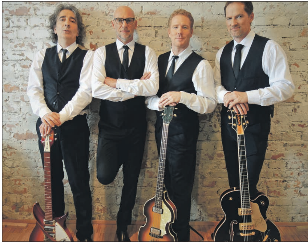
„The Barons“ erfüllen am 25. März musikalische Wünsche.