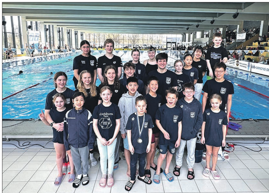
96 Podiumsplätze schafften die Schwimmerinnen und Schwimmer des SCW Eschborn bei den Wettkämpfen des Schwimmnachwuchses im Wetzlarer Europabad.

Nach der Halbzeitpause ging das Spiel genauso gleichförmig weiter. Mal ging die Heimmannschaft, mal die Gäste mit einem Tor in Führung. In der 49. Minute gelang es dann den Schwalbach/Niederhöhnstädtern, sich mit zwei Toren etwas abzusetzen. Doch wer beim Handball glaubt, dass dies ein sicherer Vorsprung für die letzten 35 Spielsekunden ist wurde eines Besseren belehrt. Nach zwei schnellen Toren der Gäste und etwas Pech beim eigenen Abschluss musste die mB2 die Punkteteilung mit dem Endstand von 31:31 hinnehmen.