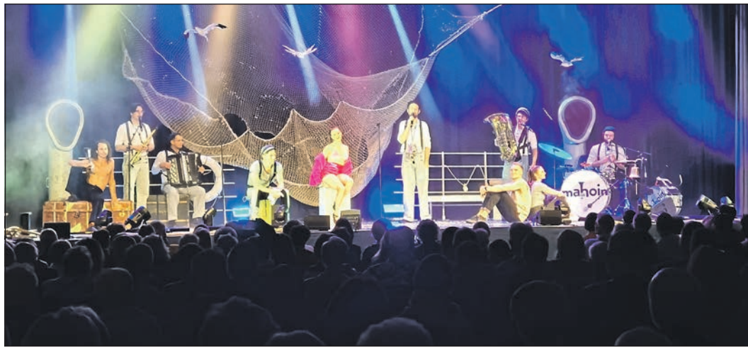
Mit spielerischer Leichtigkeit zeigten die Artisten von „Mahoin“ am vergangenen Wochenende zweimal ihre „Hamburger Hafenrevue“ im Bürgerzentrum Niederhöchst.

akrobatiknummer waren mit pffiffigen Ideen gewürzt, so dass es häufig Zwischenapplaus gab. Die mitreißende Musik tat ihr Übriges und begleitete die artistischen Einlagen auf harmonische Weise. Die meisten Zuschauer waren sich einig, dass die ästhetischen Darbietungen ein Genuss für Auge und Ohr waren. Am Ende gab es für die vielen Künstlerinnen und Künstler, die ihr Bestes an beiden Abenden gaben, langanhaltenden Applaus.