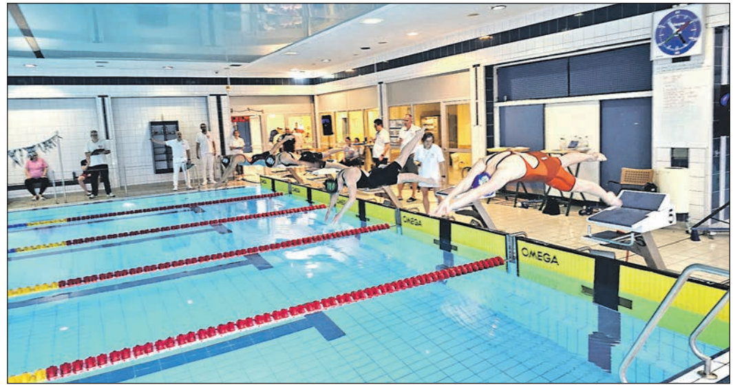
Mit 25 Schwimmerinnen und Schwimmern war Aqua Sports Eschborn beim ersten Wettkampf der Saison im Wiesenbad am Start.

derhöchststadt bis zum TuRa-Sportplatz an der Sportanlage Westerbach, dann noch ein Stück weit in Richtung Oberhöchststadt, rechts zur Westerbach-Brücke bis zu den TWE-Tennisplätzen. Am dortigen Parkplatz „splitet“ sich in der ersten Halbmarathon-Runde links in eine 1,1 Kilometer lange Schleife. Bei der zweiten Halbmarathon-Runde und auch beim Zehn-Kilometer-Lauf geht es direkt rechts in die Eichfeldstraße. Wie in den Vorjahren verläuft dann die Hauptstrecke über die Königsberger Straße und Feldbergstraße zum Bürgerzentrum in Richtung Eschborn. Nach Querung der Steinbacher Straße kommt dann neu ein letzter Anstieg Richtung Steinbach hinzu, der einen wunderschönen Skyline-Blick eröffnet. Zurück bei der Heinrich-von-Kleist-Schule (HvK) auf dem Dörnweg gibt es noch eine neue Schleife in die Brüder-Grimm-Straße hinein und zurück zum Dörnweg, anschließend folgt der Rundkurs wieder dem gewohnten Verlauf über die beiden Kreisel der Rödelheimer Straße und geht schon vor der Hanny-Franke-Anlage rechts auf die Kurt-Schumacher-Straße ins Ziel am Rathausplatz. Die Kurzstrecke über fünf Kilometer biegt jetzt auch erst am Westerbach hinter dem Traktorspielplatz bei der „Ruheoase“ nach rechts ab und mündet beim „HvK-Parkplatz“ am Dörnweg wieder in die Halbmarathonstrecke. Neu ist in diesem Jahr der Fünf-Kilometer-Fit-Walk, der um 11 Uhr gestartet wird. Hier dürfen auch schmale Sportbuggys mit den Allergikern mitgeführt werden, aber keine Walkingstöcke. Es handelt sich um ein Bewegungs-