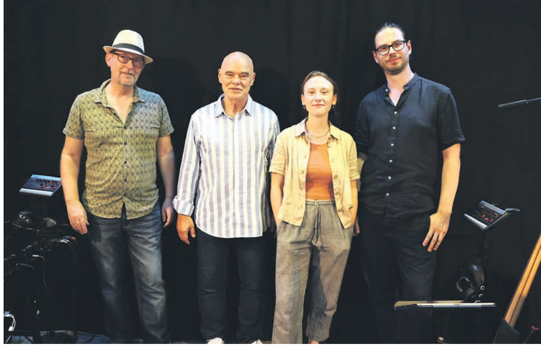
Die „Christoph Spindel Group“ kommt am Samstag ins „Eschborn K“.