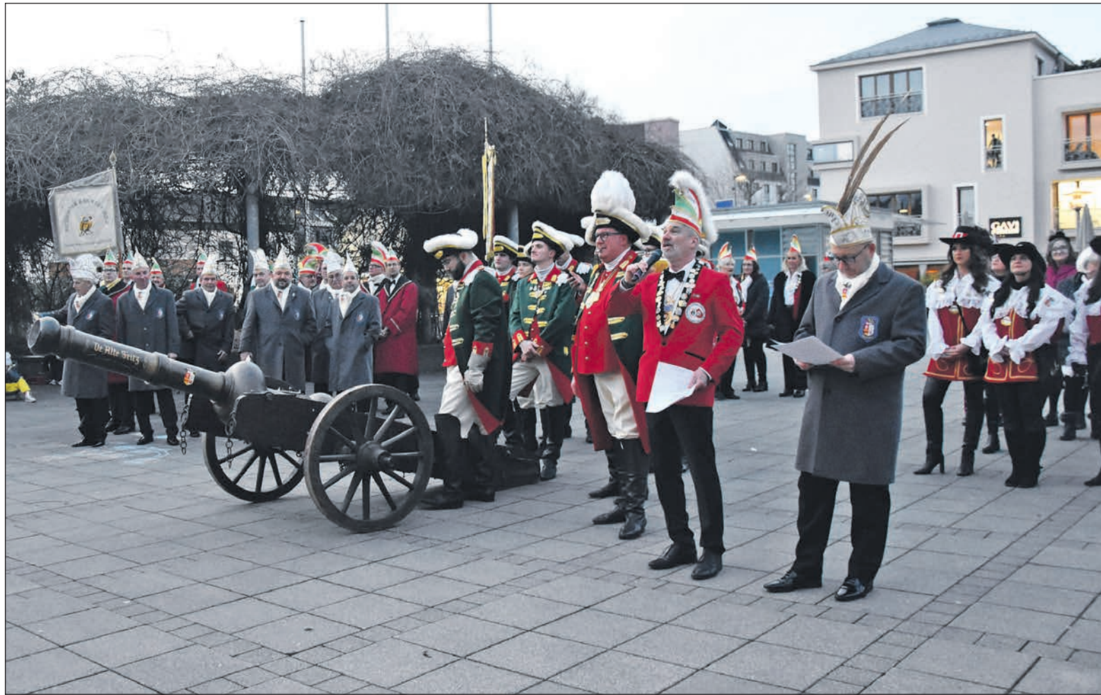
Mit ihrer Kanone und deftigen Worten zwangen die Narren den Bürgermeister zur Aufgabe.