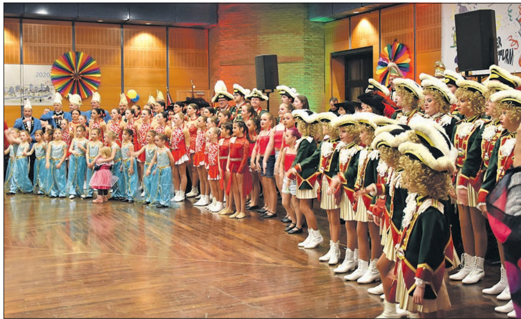
Nachdem der Saal nach einer Pfefferspray-Attacke gelüftet werden musste, konnte das närrische Programm mit zahlreichen Garden weitergehen.

Zwei Jugendliche wurden als etwa 14 Jahre alt, circa 1,50 Meter groß und von normaler bis schlanker Statur beschrieben. Bekleidet waren sie mit schwarzen Jacken und dunklen Hosen. Inwieweit der Vorfall mit dem Einsatz am Rathausplatz in Verbindung steht, ist zurzeit Gegenstand der Ermittlungen. Hinweise nimmt in beiden Fällen die Polizeistation Eschborn unter der Rufnummer 06196-96950 entgegen.