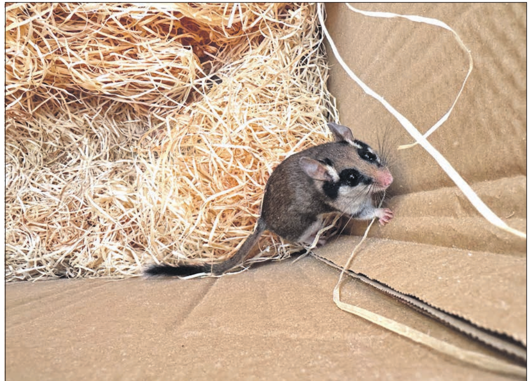
Grundsätzlich ist der Gartenschläfer vom Aussterben bedroht. In Eschborn scheint es aber besonders viele Exemplare der Bilch-Art zu geben.