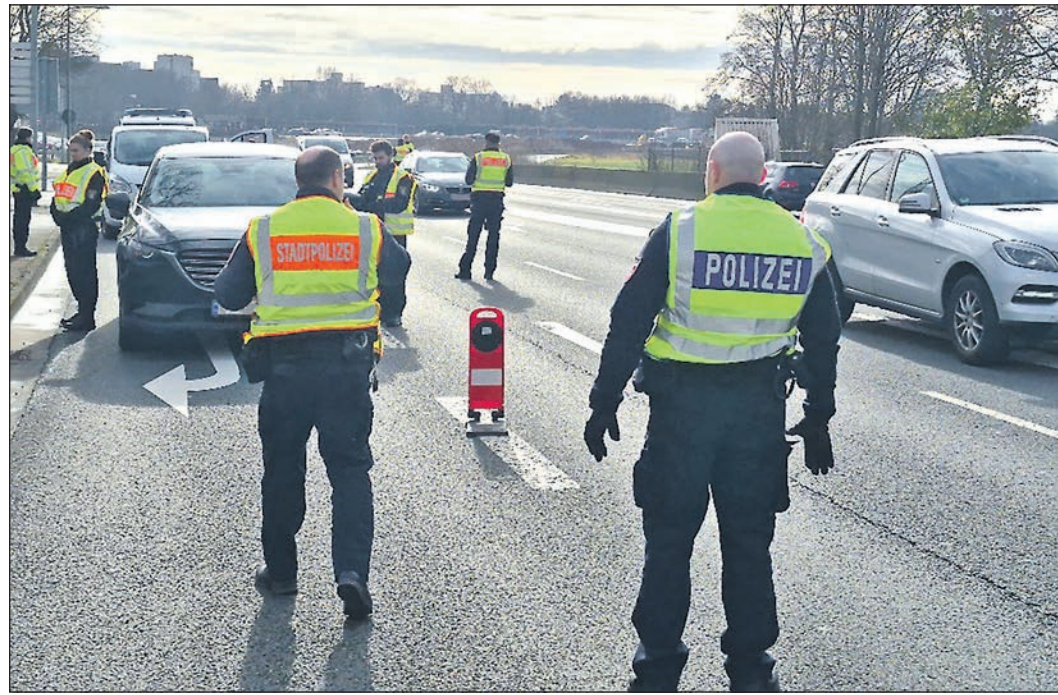
Gemeinsam kontrollierten Landes- und Stadtpolizei am vergangenen Donnerstag Fahrzeuge und Personen in der Sossenheimer Straße.