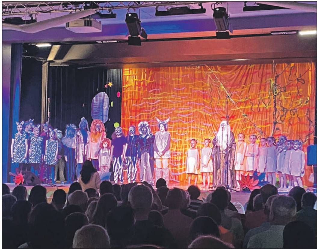
Die Tiere der Savanne drohen zu verdursten und haben eine Konferenz einberufen, um ihr Schicksal abzuwenden. Wer hätte gedacht, dass ausgerechnet ein Außenseiter die Lösung sein könnte? Vom Mut, anders zu sein, handelt das Musical „Kwela, Kwela“.