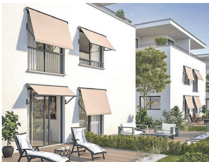
Fallarmmarkisen laufen nicht senkrecht, sondern können in einem variablen Neigungswinkel ausgestellt werden.

(DJD). Die Anzahl der „heißen Tage“ mit Lufttemperaturen von mindestens 30 Grad hat sich in Deutschland von etwa drei Tagen in den 1950er-Jahren auf rund neun Tage jährlich verdreifacht. In vielen Eigenheimen wird deshalb der Hitzeschutz zu einem Thema. Eine Klimaanlage verursacht hohe Stromkosten, ökologischer und wirtschaftlicher ist deshalb ein guter Wärmeschutz fürs Haus. Besonders eignen sich hierfür außen liegende Beschattungen der Fensterflächen. Textile Markisen etwa von Herstellern wie Lewens Markisen halten 75 bis 90 Prozent der Wärmestrahlung ab und sind damit innen liegendem Sonnenschutz überlegen, dessen Schutzwirkung nur bei 15 bis 20 Prozent liegt. Unter www.lewens-markisen.de gibt es eine große Auswahl an Fallarm- und Senkrechtmarkisen sowie Markisioletten.