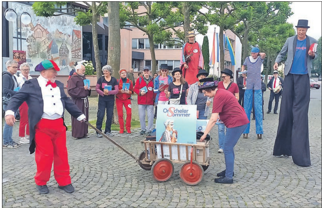
Gleich setzt sich die „Kunstgriff“-Karawane in Bewegung und lässt den Orscheler Sommer beginnen.