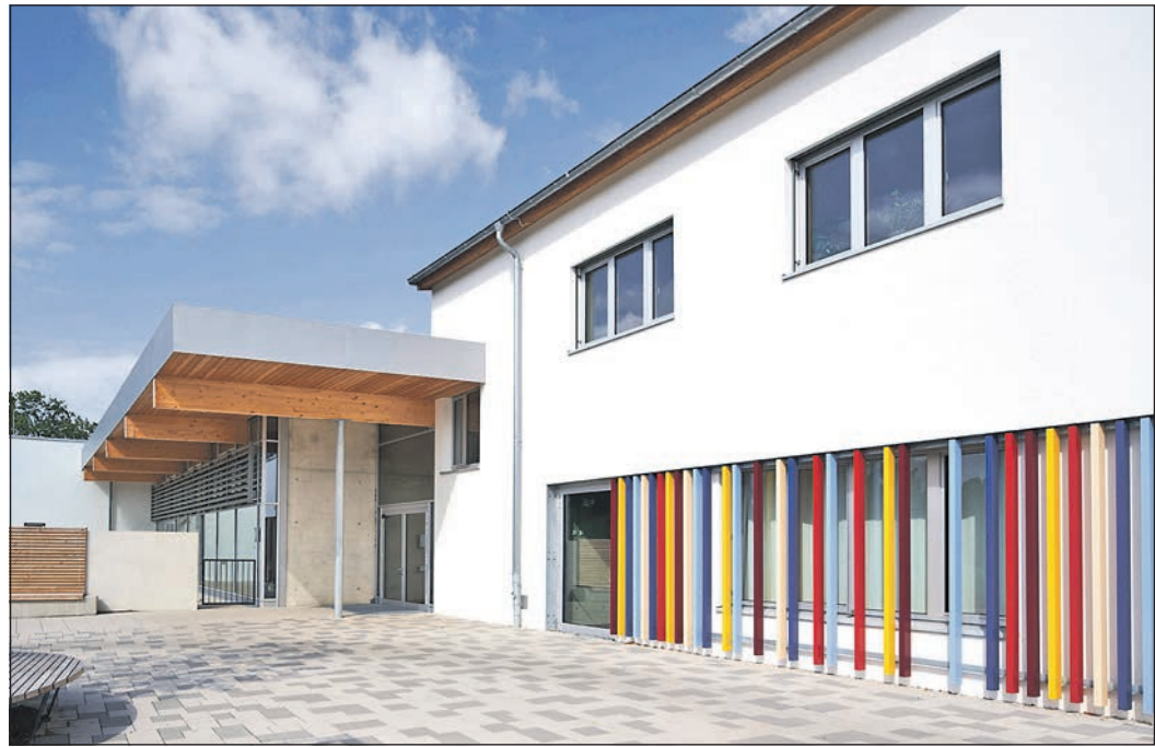
Auch der Erweiterungsbau der Hans-Magiera-Schule in der Straße Im Portugall 15 in Oberursel findet sich im Booklet des Tags der Architektur.