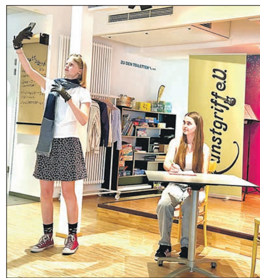
Wer jetzt denkt, typisch junge Mädels, ist völlig schief gewickelt. Hier bittet die Mutter ihre Tochter um Tipps für ein „scharfes“ Foto für Tinder.

sich als „Instagram-Celebrity mit 20 000 Followern“ entpuppt, dann doch hoch willkommen. Die Direktorin lässt sich zu einem (selbst-)zufriedenen „I am famous-Seufzer“ hinreißen.