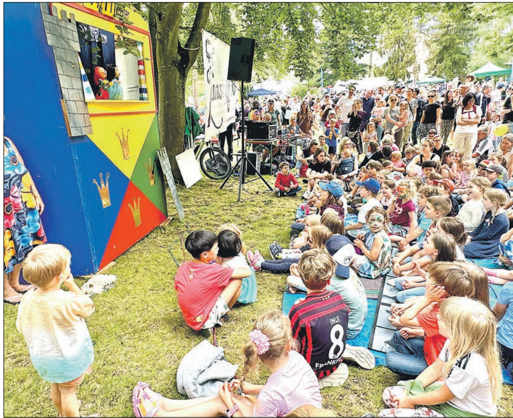
In Zeiten von Instagram und TikTok ist es eine Freude, zu erleben, wie gespannt die Kinder im Rushmoor-Park vor dem Kasperletheater sitzen und andächtig lauschen.