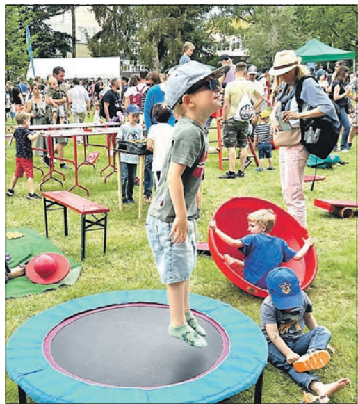
Auch Geschicklichkeit und Balance stehen auf dem Programm – und alle Kinder sind mit Spaß bei der Sache.

Es gehörte für die Kinder durchaus Mut dazu, sich eine Augenbinde anlegen zu lassen und sich anhand eines Blindenstock ein paar Meter geradeaus zu bewegen. Emily, Mutter von Zwillingen und einem Neugeborenen, freute sich über den Spaß, den die beiden Dreijährigen auf der Rollrutsche hatten und beim Parcours über verschieden hohe Planken und auf Polstern, die viel Gleichgewicht verlangten