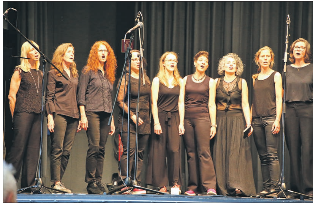
Die Chorsängerinnen der Musikschule Oberursel reißen von Beginn an das Publikum mit und werden mit brausendem Applaus gefeiert.

Am Mittwoch, 17. Juli, bleibt der Seniorentreff „Altes Hospital“ aufgrund der Theaterfahrt nach Fulda geschlossen. Anmeldung unter Telefon 06171-502192 montags bis freitags von 9.30 bis 12 Uhr und montags bis donnerstags von 14.30 bis 17 Uhr.