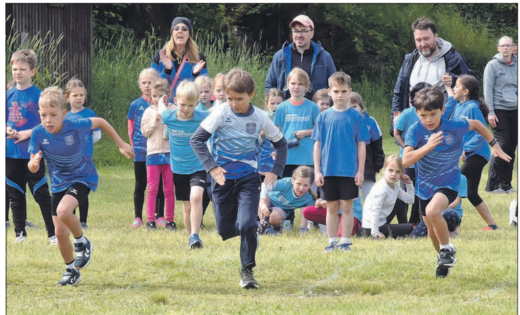
Rekordverdächtig: insgesamt 95 Jungen und Mädchen gehen beim 168. Feldbergfest an den Start.

Alle Ergebnisse vom 168. Feldbergfest sind im Internet unter www.feldbergfest.de abrufbar.