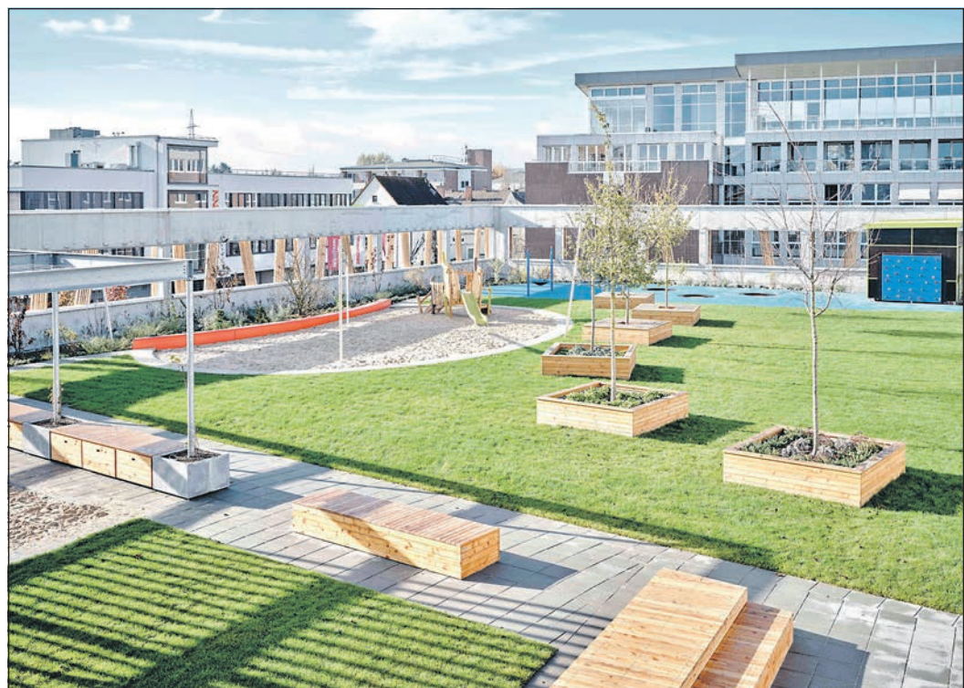
In Bad Homburg wird die Aufmerksamkeit vor allem auf das Vickers-Areal sowie die dazugehörigen Außenanlagen gerichtet.

Auch der Erweiterungsbau der Hans-Magiera-Schule in der Straße Im Portugall 15 in Oberursel findet sich im Booklet (Taunus Architektur plus bauplanung GmbH, Neckartenzlingen; Bauherrin Hans-Magiera-Stiftung). Die in die Jahre gekommene Hans-Magiera-Schule wurde um 16 Klassenzimmer ergänzt. Ein Erweiterungsbau beinhaltet außerdem Verwaltung, Mensa und Aula mit einem neuen Haupteingang. Die Ausformung des Daches ermöglicht Oberlichter für eine optimale Belichtung und Belüftung. Garderoben und Zugänge werden durch die Ausbildung von Nischen und Vorzonen geschickt untergebracht.