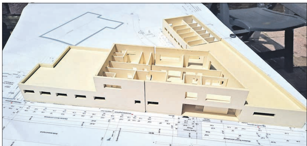
Das neue Hauptgebäude wird entlang des Forsthauswegs gebaut, im Hintergrund auf der Karte ist das Katzenhaus eingezeichnet.

Zur Vorbereitung der Bauarbeiten muss zunächst die Stallung auf der ehemaligen Ponyanlage, die derzeit als Hundauslauf genutzt wird, zurückgebaut werden. Hier müssen auch Zäune abgebaut und entfernt werden. Auch dafür werden Spenden gesammelt. Wer online spenden möchte, findet nähere Informationen im Internet unter obu.li/tierheim .