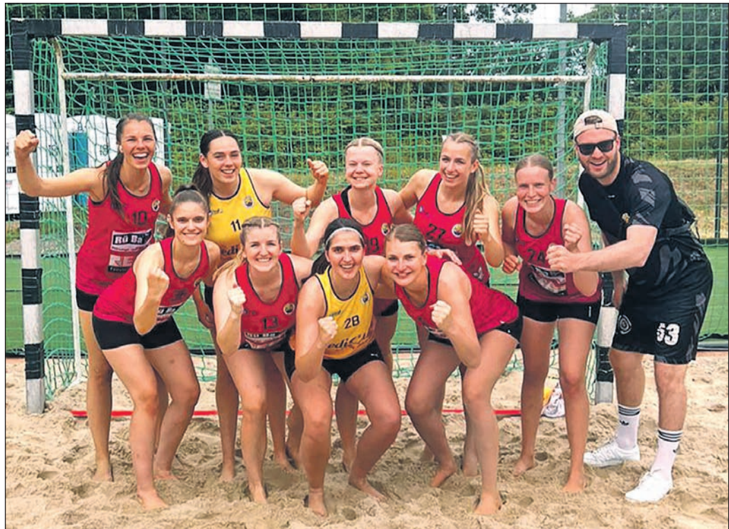
Die Beachhandballerinnen der TSGO steuern die Deutschen Meisterschaften an.