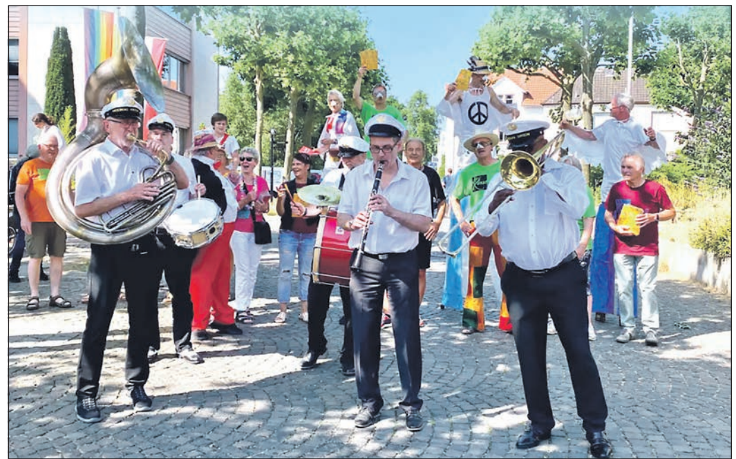
Mit Pauken und Trompeten zieht der „Kunstgriff“ am Samstag auf Stelzen durch die Innenstadt, um auf den Beginn des „Orscheler Sommers“ aufmerksam zu machen und die Programmhefte zu verteilen.

der von drei bis sieben Jahren mit dem Stück „Prinzessin Isluno Onulsi auf Paddeltour“. Am Wochenende darauf gibt es das erste große OSO-Konzert, wenn am Freitag, 28. Juni, um 19.30 Uhr „Ferien auf der Ratiofarm“, Svenvalenta und „Das Actionteam“ auf die Bühne im Rushmoor-Park kommen. Für Sonntag, 30. Juni, ist die große Gaudi beim Fischerstechen