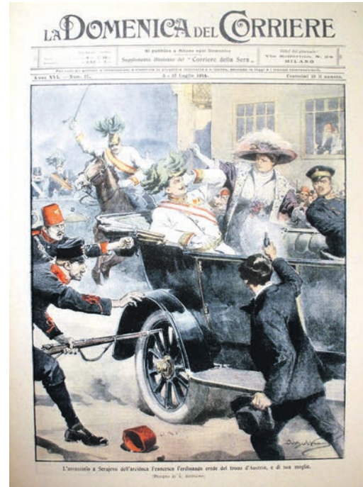
Das Titelblatt der Sonntagsbeilage des Corriere della Sera vom 5. Juli 1914 zeigt eine kolorierte Zeichnung vom Attentat von Sarajewo.