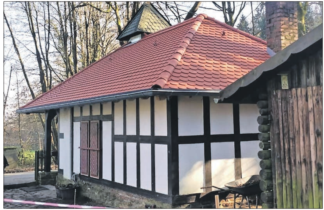
Das Dach ist wieder in Ordnung, doch im Haus wurden neue Schäden entdeckt.

Die Mitglieder des Vereins zum Erhalt der Johanniskirche werden die Gäste wie gewohnt mit Kaltgetränken und Brezeln versorgen. Eintritt wird nicht erhoben, aber um eine Spende wird gebeten.