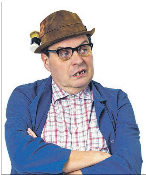
Der Begge Peder ist am 16. und 17. August im „Alt Orschel“.