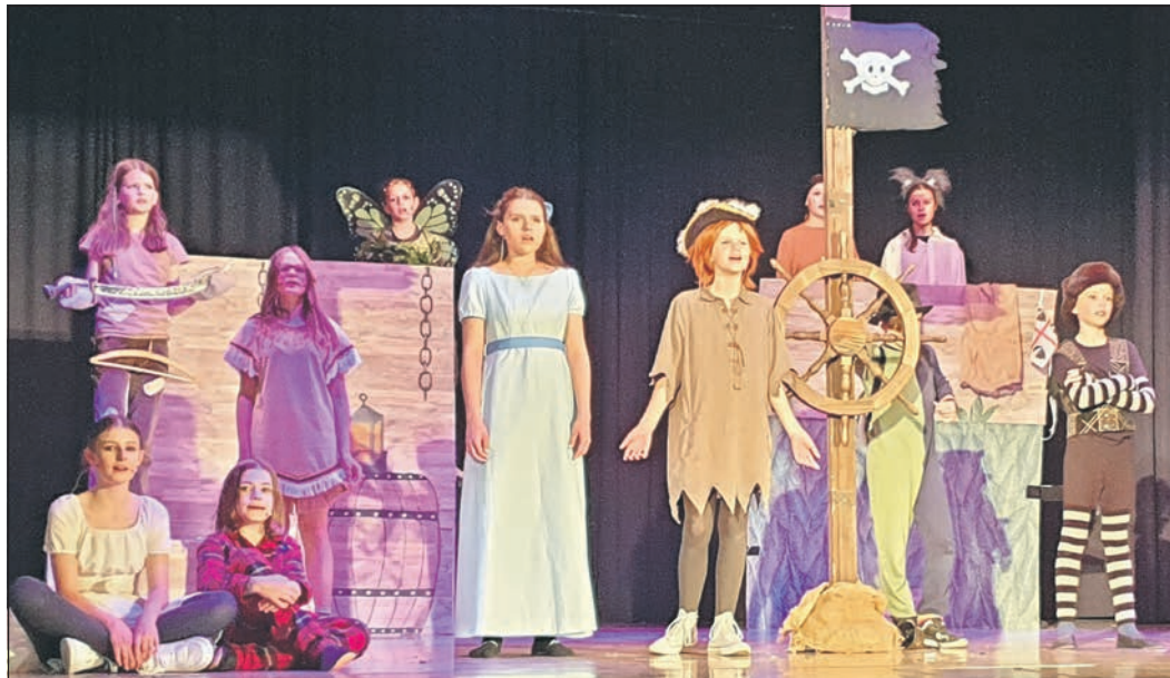
Auf hoher See steuert die Besatzung zielsicher die Insel „Nimmerland“ an.

Tickets zum Preis von zehn Euro für Kinder und 13 Euro für Erwachsene zuzüglich Vorverkaufsgeldern sind im Ticketshop Oberursel, Kumeliusstraße 8, oder an der Tageskasse erhältlich.