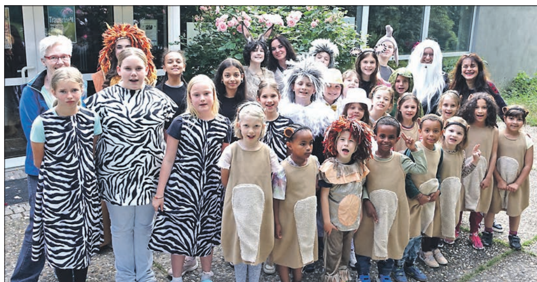
Zwei Monate lang haben die Jungs und Mädchen geübt, und bereits in der Generalprobe für das Musical „Kwela, Kwela“ ihr Können gezeigt. Jetzt freuen sich die jungen Künstler auf ihren Auftritt und die Eröffnung von „Steinbach Open Air“.