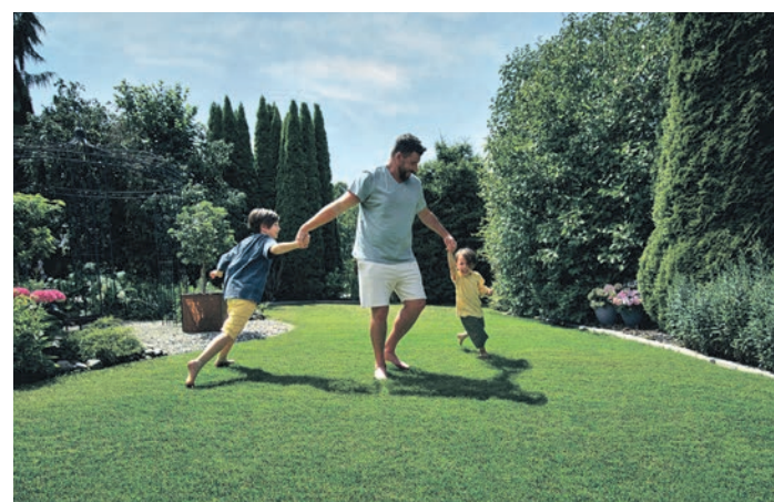
Wenn der Rasen besonders beansprucht wird, sollte der Rasen erneut mit Nährstoffen versorgt werden.

Vorbereitung auf die kalte Jahreszeit empfiehlt es sich, den Rasen im Herbst noch einmal zu düngen. Bei ausreichend feuchten Bodenbedingungen wird mineralischer Rasendünger sofort von den Pflanzen aufgenommen, sodass sich die Wirkung schon nach wenigen Tagen zeigt. Organischer Dünger muss zunächst von den Mikroorganismen im Boden mineralisiert werden. Dieser Prozess ist abhängig von der Bodentemperatur und -feuchtigkeit. Organischer Dünger wirkt etwas zeitverzögerter, ist allerdings nachhaltiger, was seine Ausgangsstoffe angeht.