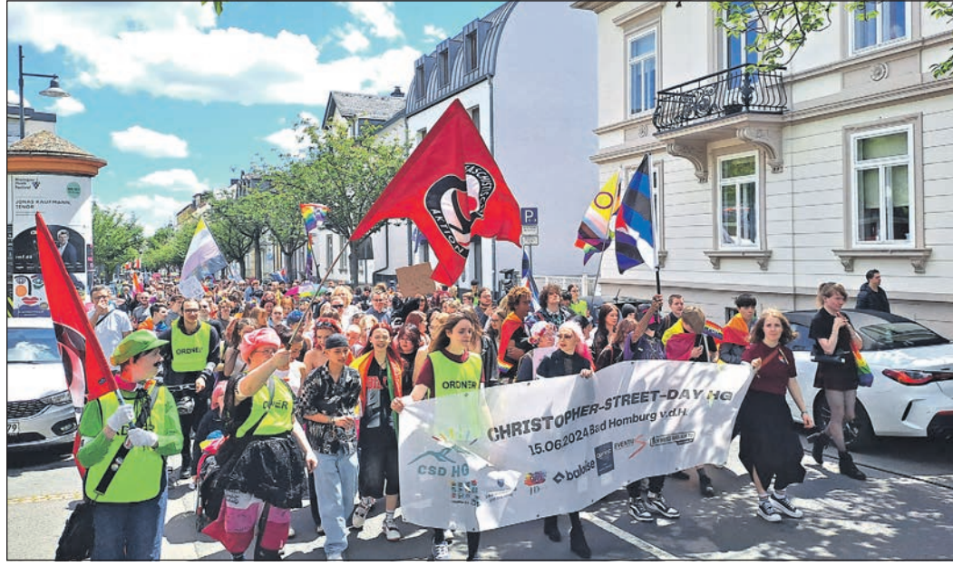
Mit bunten Fahnen und Transparenten zieht die Demo vom Europa-Kreisel die Louisenstraße hinauf in Richtung Kurhaus.