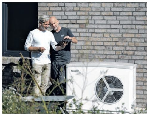
Experteninfos zur Wärmepumpe gibt es beim MVV-Infoabend im Showroom in Schwalbach.