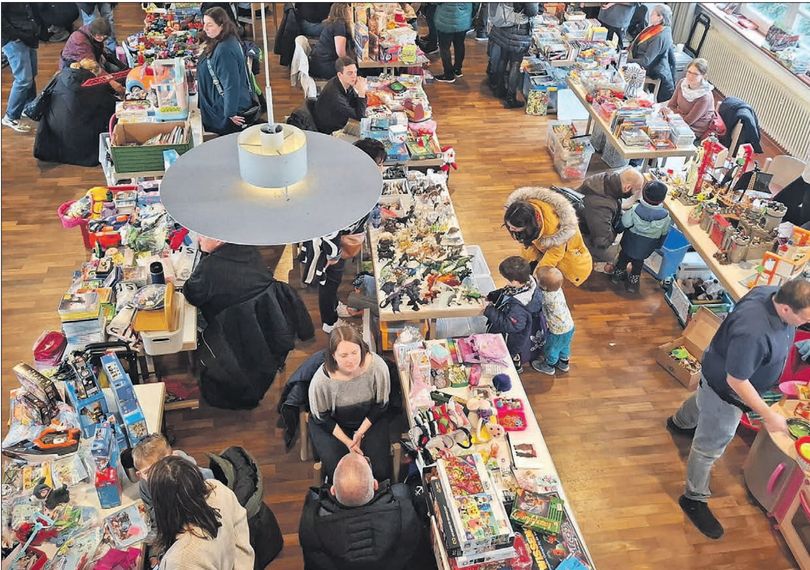
Eine große Auswahl an Spielzeug aller Art gab es am vergangenen Samstag beim jüngsten Spielzeugbasar der katholischen Pfarrei Heilig Geist am Taunus im Gemeindezentrum in Alt-Schwalbach. Die Spenden aus dem Erlös gehen in diesem Jahr an das Bethanien Kinderdorf in Eltville, die Krippe St. Martin, das Schulkinderhaus an der Geschwister-Scholl-Schule und viele mehr. Die Erlöse aus den Standgebühren sollen für neue Kleidung der Krippenfiguren in der St.-Pankratius-Kirche gespendet werden.