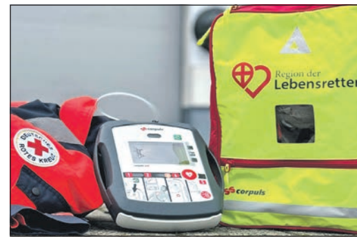
So genannte automatische externe Defibrilatoren können Leben retten, wenn die Retter wissen, wo sie die Geräte finden können.