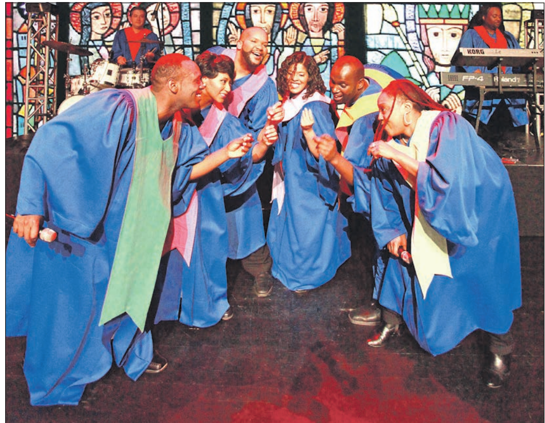
Tolle Stimmen sind beim Adventskonzert im Bürgerhaus zu hören.

Mehr Informationen finden Sie auch im Internet unter www.nak-schwalbach.de