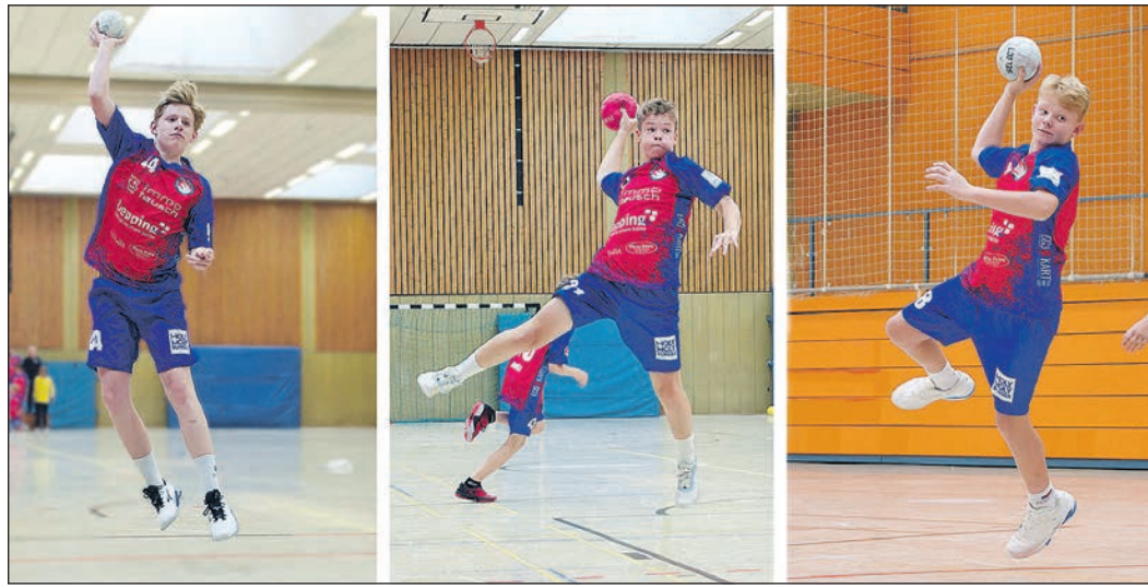
Die C1-Jugend zeigte gegen Eppstein/Langenhain eine starke Leistung.