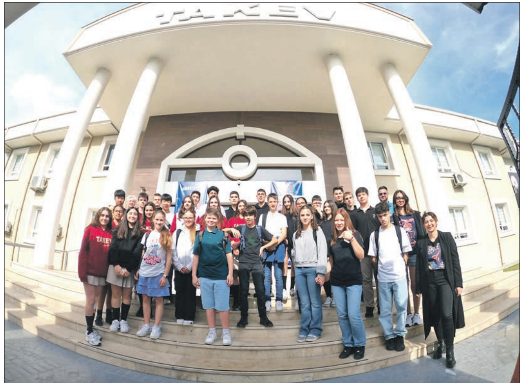
Schülerinnen und Schüler der FES tauschen sich zurzeit in Izmir mit einheimischen Jugendlichen der Takev-Schule in der türkischen Hafenstadt aus.

www.kronberger-lichtspiele.de klimatisiert 06173 / 7 93 85