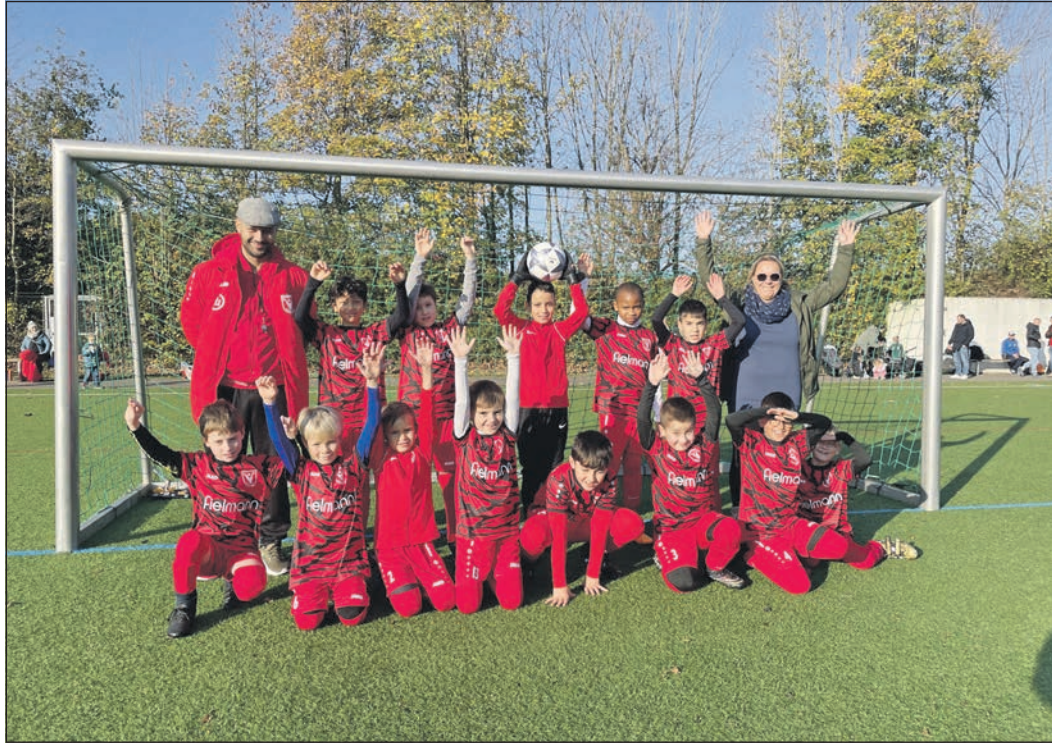
Die F-Jugend des 1. FC freut sich über ihre neuen Trikots