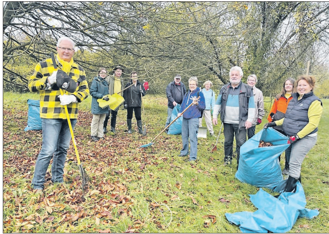
Zahlreiche Helferinnen und Helfer sammelten am Samstag im Arboretum Kastanien-Laub ein, um die Ausbreitung der Miniermotte zu verhindern.