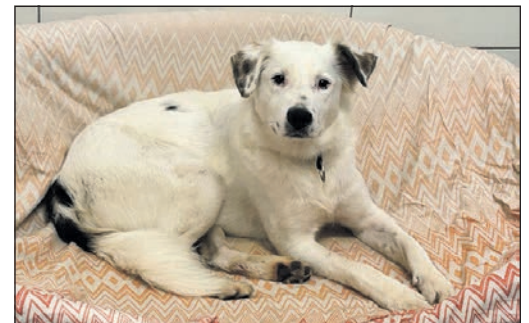
Auch Chico aus dem Tierheim am Arboretum sucht ein neues Zuhause.

Soden/Sulzbach und wahrscheinlich in vielen weiteren haben Sie die Möglichkeit, in Ruhe Ihr neues Familienmitglied bei ersten gemeinsamen Spaziergängen kennen zu lernen. Sollte Ihnen dann die Prinzessin oder der Prinz, in den sie sich spontan verliebten, auf einmal mehr wie ein Frosch vorkommen, wird niemandem ein Schaden zugefügt.“ Zusätzlich erhalten Tier-Interessenten vor und während des Probewohnens sowie nach der Adoption bei auftretenden Fragen und Unsicherheiten stets Unterstützung durch die Mitarbeiterinnen des Tierheims. So könne sich aus dem ersten Verliebtsein eine Partnerschaft zwischen Mensch und Tier entwickeln, die stabil ist und glücklich macht.