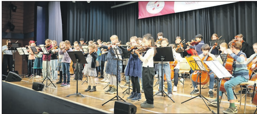
Kaum noch Platz war auf der Bühne des Niederhöhnstädter Bürgerzentrums beim Abschlussstück des diesjährigen Streichertags der Musikschule Taunus.

Zum Abschlusskonzert um 16 Uhr trudelten die Eltern und weitere Gäste dann nach und nach wieder ein. Da noch reichlich Kuchen übrig war, nutzten viele die Zeit vor und nach dem Konzert, um die Angehörigen der „Streicherfreunde“ der eigenen Kinder kennenzulernen. Beim Konzert selbst präsentierten die drei Gruppen auf großer Bühne ihre Arbeitsergebnisse: Jedes Ensemble spielte drei bis vier Stücke und konnte jeweils in seinem Schwierigkeitsgrad auch das Publikum überzeugen und begeistern. Und natürlich gab es auch beim krönenden gemeinsamen Musikstück am Ende viel Applaus.