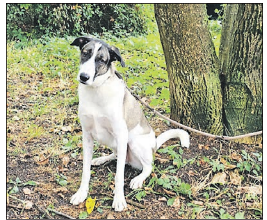
Lucky ist einer von zwei Hunden im Tierheim am Arboretum, deren Adoption gescheitert ist.

Hunde, die dem Tierheim aufgrund der bereits erfolgten, aber missglückten Adoption übergeben werden, gehören in der Regel in die Kategorie schwer vermittelbar, weil die Verhaltensauffälligkeiten so ausgeprägt sind, dass viel Geld und Arbeit investiert werden müssen und teilweise Jahre vergehen, bis sich für diese ein geeignetes Zuhause finden lässt. Peggy Knecht und Therese Knoll erklären den Unterschied zwischen einem Tierschutzhund, den man sich aufgrund von Bildern und Beschreibungen ausgesucht hat und einem Tierschutzhund aus dem Tierheim: „Im Tierheim Bad