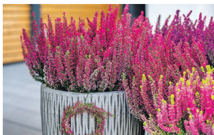
Neue Heide-Sorten fallen mit einer besonders intensiven Strahlkraft auf.

laubschönen farbigen Callunen ermöglicht zahlreiche Kombinationsmöglichkeiten.