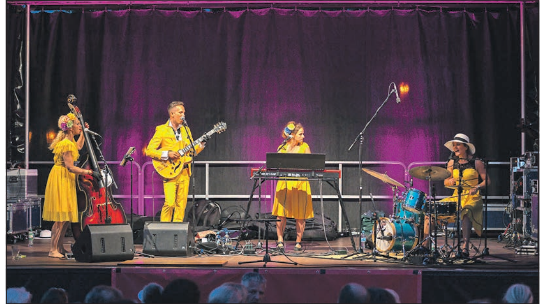
Die Band „Evas Apfel“ heizt beim „Summertime“-Programm der Stadt Eschborn dem Publikum kräftig ein.

Mehr zum Brauchtumsverein und seinen kinderpädagogischen Projekten gibt es im Internet unter www.brauchtumsverein-ndh.de .