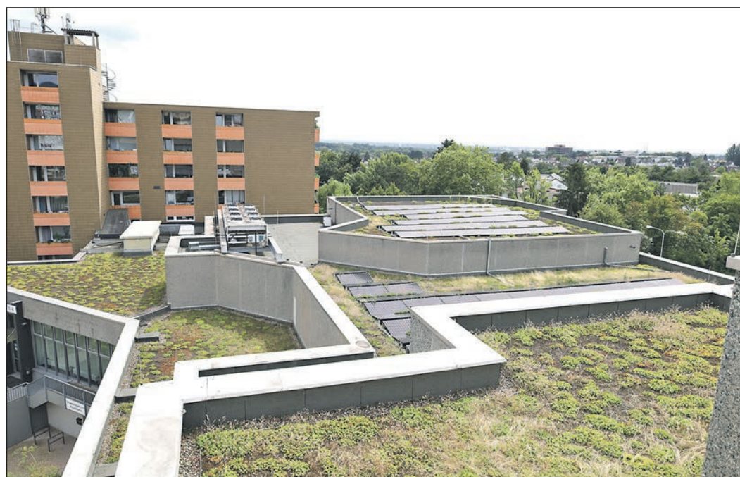
Seit April sind die Solarpaneele auf dem Bürgerhaus- und Rathausdach in Betrieb. Die begrünte Dachfläche wird zweimal jährlich gepflegt.

Im Zuge der Umsetzung der Doppelstockanlage wurden die Behindertenstellplätze am P+R-Parkplatz Niederhöhnstadt neu angelegt und zusätzliche Bordsteinabsenkungen vorgenommen.