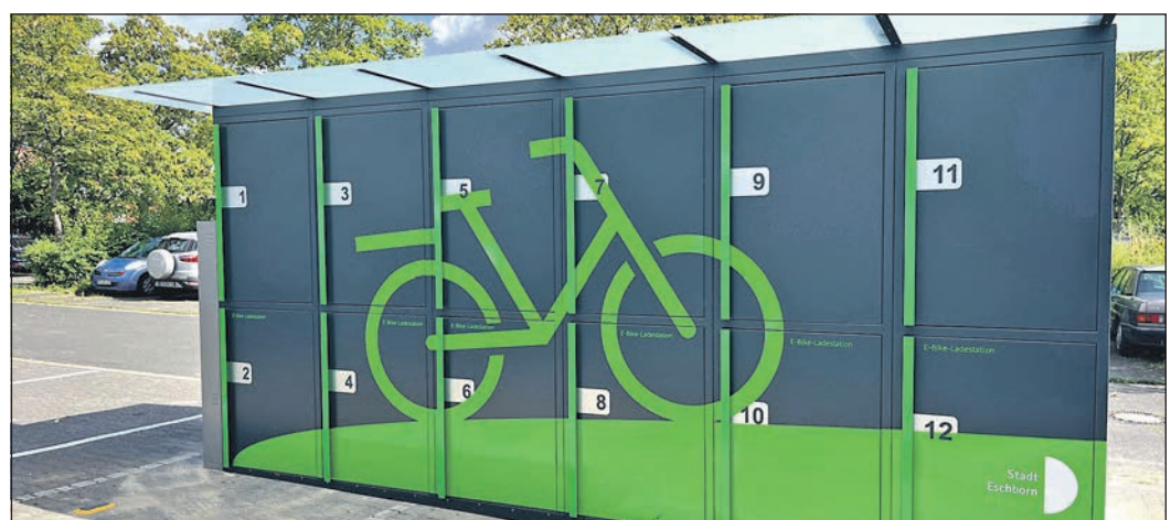
Für die zwölf Fahrradboxen ist als neuer Standort der Bahnhof Niederhöhnstadt ausgewählt worden.

Treffpunkt ist am Sonntag, 1. September, um 11 Uhr auf dem Parkplatz „Am Untertor“ in Hofheim. Der öffentliche Ausklang der Sommerradtour wird gegen 15.30 Uhr im Gimbacher Hof in Kelkheim stattfinden. Für Kaffee und Kuchen sowie leckere Snacks und erfrischende Getränke ist gesorgt. Dafür wird vor Ort ein Unkostenbeitrag von fünf Euro erbeten. Wer Fragen hat oder sich gleich anmelden möchte, kann dies gerne direkt per Mail an info@gruene-mtk.de tun. Kurzentschlossene ohne Anmeldung sind aber selbstverständlich auch herzlich willkommen.