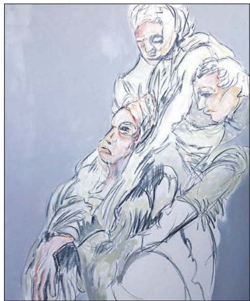
Das Museum der Stadt Eschborn zeigt eine Ausstellung der Künstlerin Ana Romero aus Póvoa de Varzim. Foto: Ana Romero

Ein Besuch der Ausstellung ist anschließend bis Sonntag, 3. November, zu den Öffnungszeiten des Museums möglich. Öffnungszeiten: Mittwoch 15 bis 18 Uhr, Samstag 15 bis 18 Uhr und Sonntag 14 bis 18 Uhr oder nach Vereinbarung.