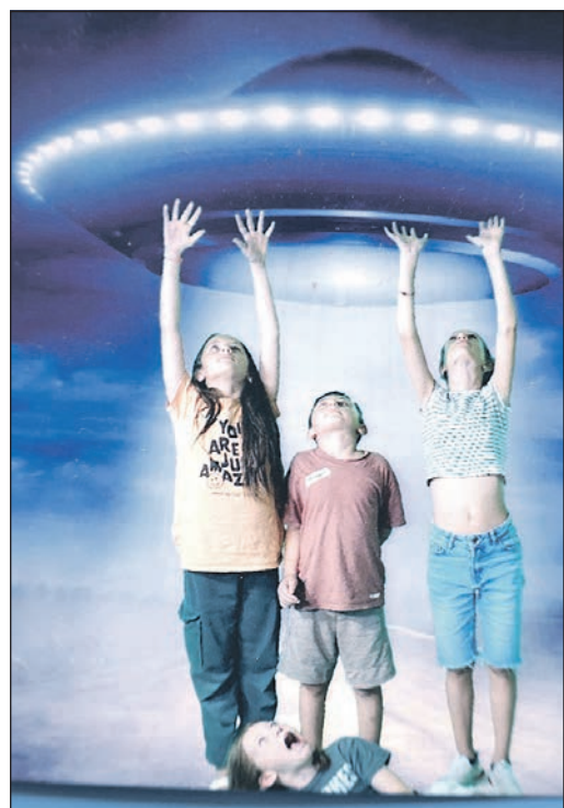
Beim Workshop des Jugendbildungswerks des Main-Taunus-Kreises inszenieren sich die Kinder in fantastischen Kulissen und schärfen dabei spielerisch ihr Bewusstsein für manipulierte Bilder.

Schwalbach (sbw). Die dritte und letzte Woche der städtischen Ferienspiele endete auch in diesem Jahr mit einer Abschlussfeier für Kinder und Eltern am Lagerfeuer und mit einer anschließenden Übernachtung auf dem Schiffspielplatz. Kai Kreuzinger von der städtischen Kinderprojektarbeit hatte mit seinem Team wieder ein vielseitiges Ferienangebot auf die Beine gestellt.