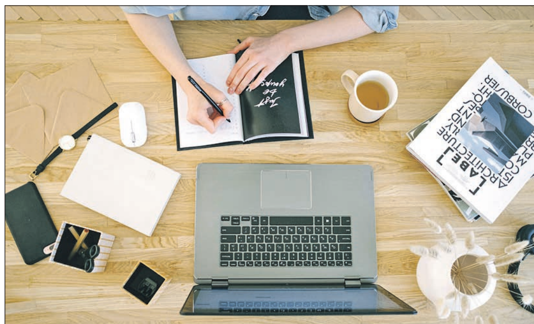
Das Herbstprogramm der Veranstaltungsreihe „Frau & Job“ startet im September. Es umfasst zahlreiche Angebote, darunter als Schwerpunktthema „Künstliche Intelligenz“ – wie Landrat Michael Cyriax mitteilt.

lichen Weiterentwicklung und einem Theaterstück zu den „Müttern des Grundgesetzes“. Das Programm „Frau & Job“ gibt es seit 2010. Es wird vom Büro für Chancengleichheit gemeinsam mit Kooperationspartnern zusammengestellt. Zur Zielgruppe der Weiterbildungsreihe gehören insbesondere Wiedereinsteigerinnen nach einer Familienpause. Wie der Landrat erläutert, ist die Weiterbildungsreihe ein wichtiges Element der Ausbildungs- und Arbeitsmarktstrategie des Main-Taunus-Kreises: „Wir möchten Frauen dabei unterstützen, durch unterschiedliche Lebensphasen erfolgreich im Berufsleben zu sein. Dies ist nicht nur wichtig für ihre gesellschaftliche Teilhabe. Auch vor dem Hintergrund des aktuellen Fachkräftemangels sind Frauen auf dem Arbeitsmarkt unverzichtbar.“ Das Herbstprogramm mit allen Details kann auf der Internetseite des Main-Taunus-Kreises unter www.mtk.org/frauundjob heruntergeladen werden. Informationen gibt es auch beim Büro für Chancengleichheit unter Telefon 06192-2011845 oder per E-Mail an chancengleichheit@mtk.org .