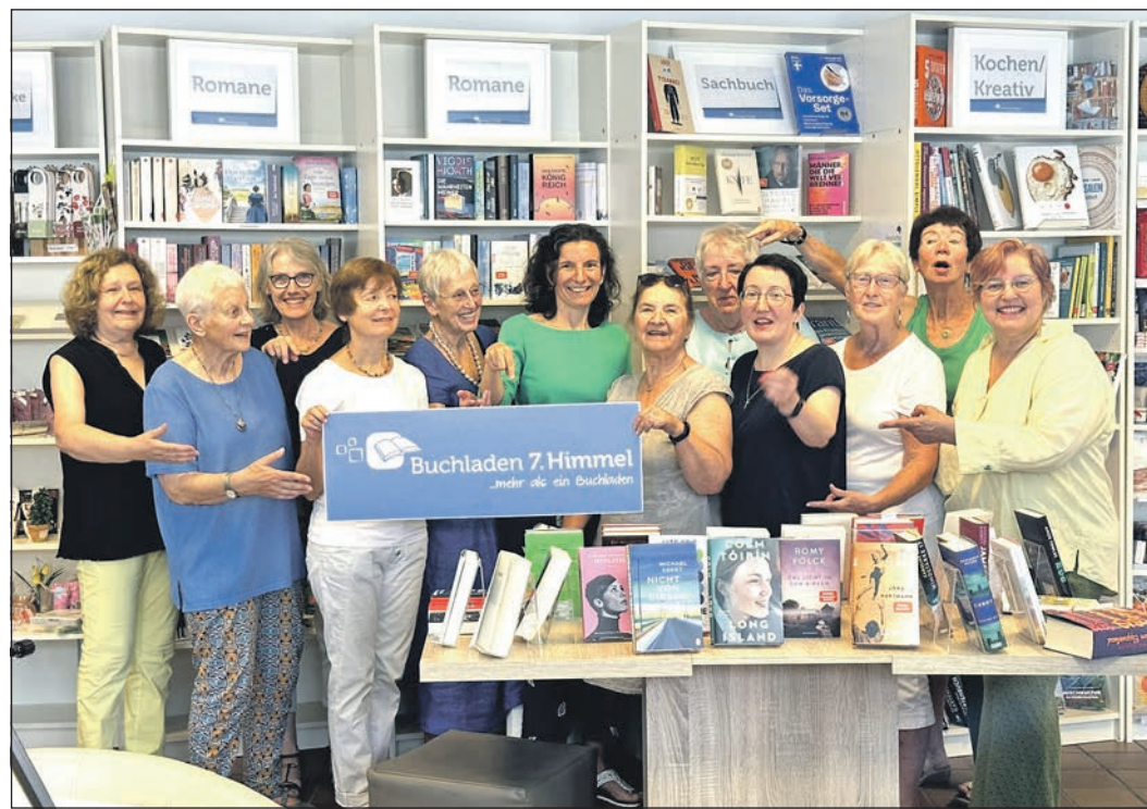
Das Team vom Buchladen „7. Himmel“ freut sich unter den Preisträgern des „Deutschen Buchhandlungspreises“ zu sein.

Im Rathaus selbst wurden über 21,5 Prozent Büroflächen gegenüber der bisherigen Fläche eingespart. Zudem bringt ein New-Work-Konzept eine deutlich höhere Flächeneffizienz und den Gewinn an Flexibilität. Zusätzlich wurden für die Beschlussfassung im Juli 2024 weitere Einsparungspotentiale in Höhe von knapp zehn Millionen Euro aufgezeigt, wovon jedoch keines durch die politischen Entscheider als sinnvoll angesehen wurde, weil es auf den Lebenszyklus betrachtet höhere Kosten mit sich bringen würde. Für das Projekt wird eine DGNB-Nachhaltigkeitszertifizierung angestrebt. Eines der wesentlichen Ziele der Zertifizierung liegt auf niedrigen Betriebskosten. Dies betrifft sowohl einen möglichst geringen Energieverbrauch wie auch die Reinigung und Pflege. So sollen die laufenden Kosten in den nächsten Jahrzehnten deutlich geringer sein als heute. Interessierte Bürger können weitere Fragen und Antworten sowie Informationen zu diesem Großbauprojekt, aber auch zur Alten Mühle und zum Wiesenbad, unter dem Link https://bauprojekte-eschborn.de einsehen.