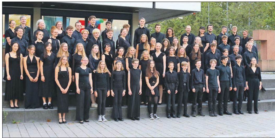
Das Jugendsinfonieorchester des Main-Taunus-Kreises spielt in diesem Jahr das Konzert unter dem Motto „Von Menschen und Helden“ – hier ein Archivbild des Jugendsinfonieorchesters des vergangenen Jahres.

Die kompakte Übersicht der Post- und Paketdienstleistungen ist ein Service der Wirtschaftsförderung.