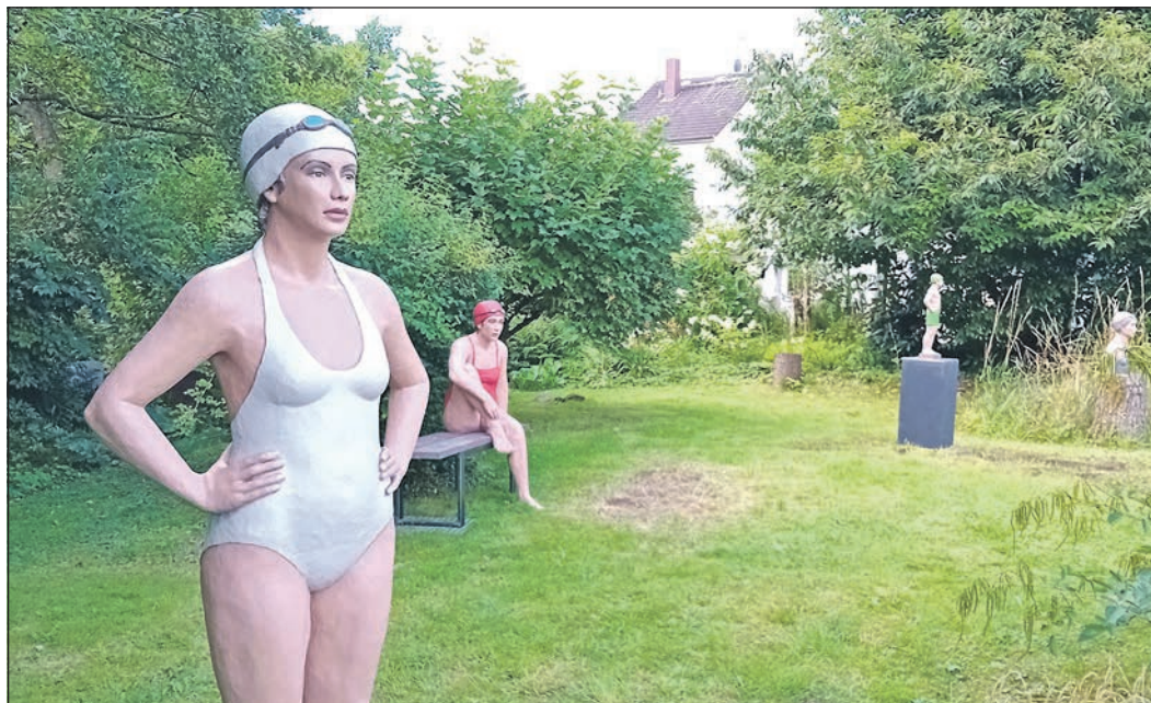
Zur Sommerausstellung „Frisch aufgestellt“ mit neuen Werken von Gabriele Köbler lädt die Galerie Elzenheimer Kunstinteressierte ein.

Die „Offene Gartenpforte“ findet immer samstags und sonntags von 14.30 bis 18 Uhr statt. Besichtigungen außerhalb dieser Zeiten gerne nach Vereinbarung unter Telefon 0176-80128356 oder per E-Mail an info@galerie-elzenheimer.de , alternativ auch im Showroom II, Zum Quellenpark 22 b in 65812 Bad Soden. Interessierte können sich auch den Kunstblog ansehen: https://galerieelzenheimer.blogspot.com/ oder www.galerie-elzenheimer.de .