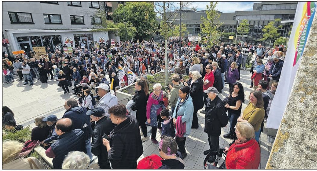
Viele Teilnehmer sind zur Demonstration und Kundgebung „Schwalbach steht auf für Demokratie und Vielfalt“ gekommen, zu der über 30 Vereine, Gruppen und Initiativen aufgerufen haben.