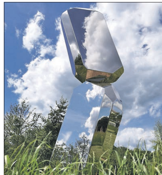
Neue Audioguide-Beiträge gibt es zu Arik Levys „RockFormation Tower 324“ und weiteren Skulpturen.