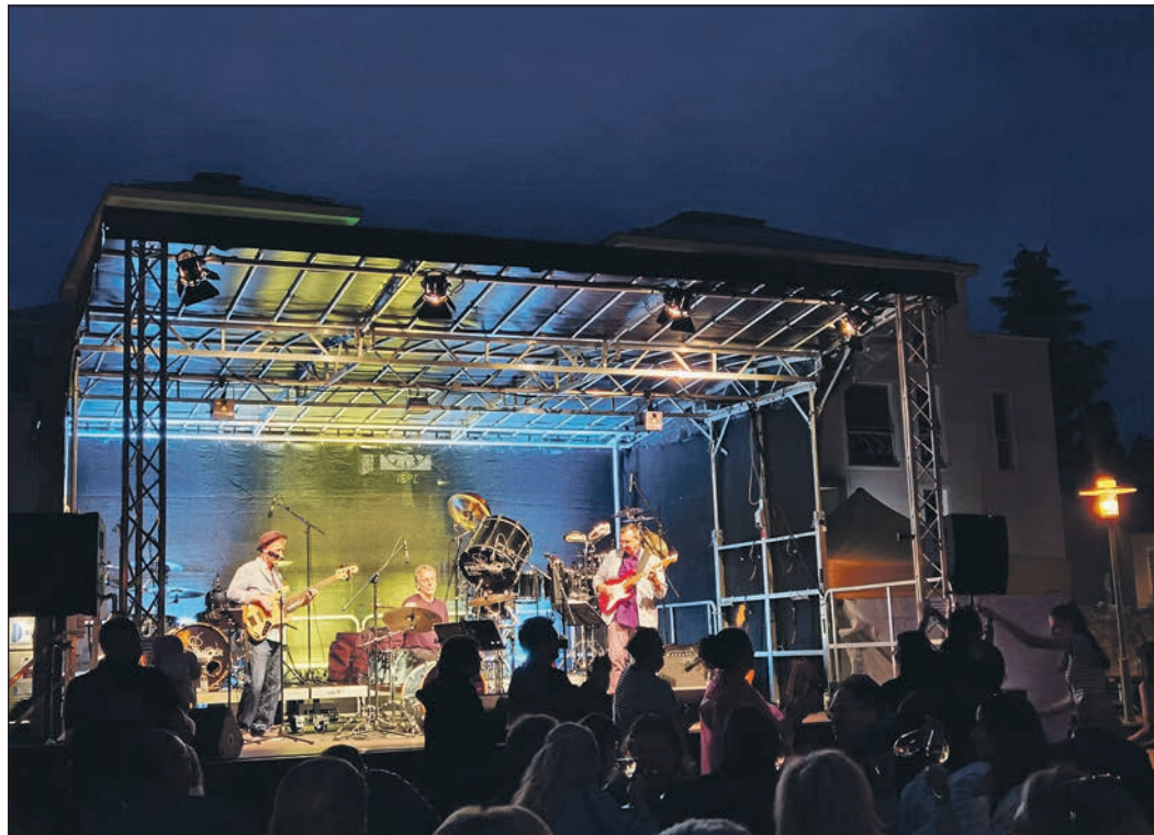
Das Eschenfest haben Groß und Klein ausgiebig gefeiert – ob tagsüber beim abwechslungsreichen Bühnenprogramm und den Walkacts oder abends bei viel Musik.

Auch internationale Gäste besuchten das Eschenfest. Zwei Delegationen aus den Eschborner Partnerstädten Zabbar in Malta und Póvoa de Varzim in Portugal waren angereist, um mitzufeiern. Ob beim traditionellen Fasanstich auf dem Eschenplatz, bei der Lasershow am Samstagabend auf dem Rathausplatz oder mit einer Bratwurst in der Hand mitten in der Menge – die Gäste freuten sich sichtlich, viele neue und bekannte Gesichter zu sehen und die Traditionen des Eschenfestes zu erleben.