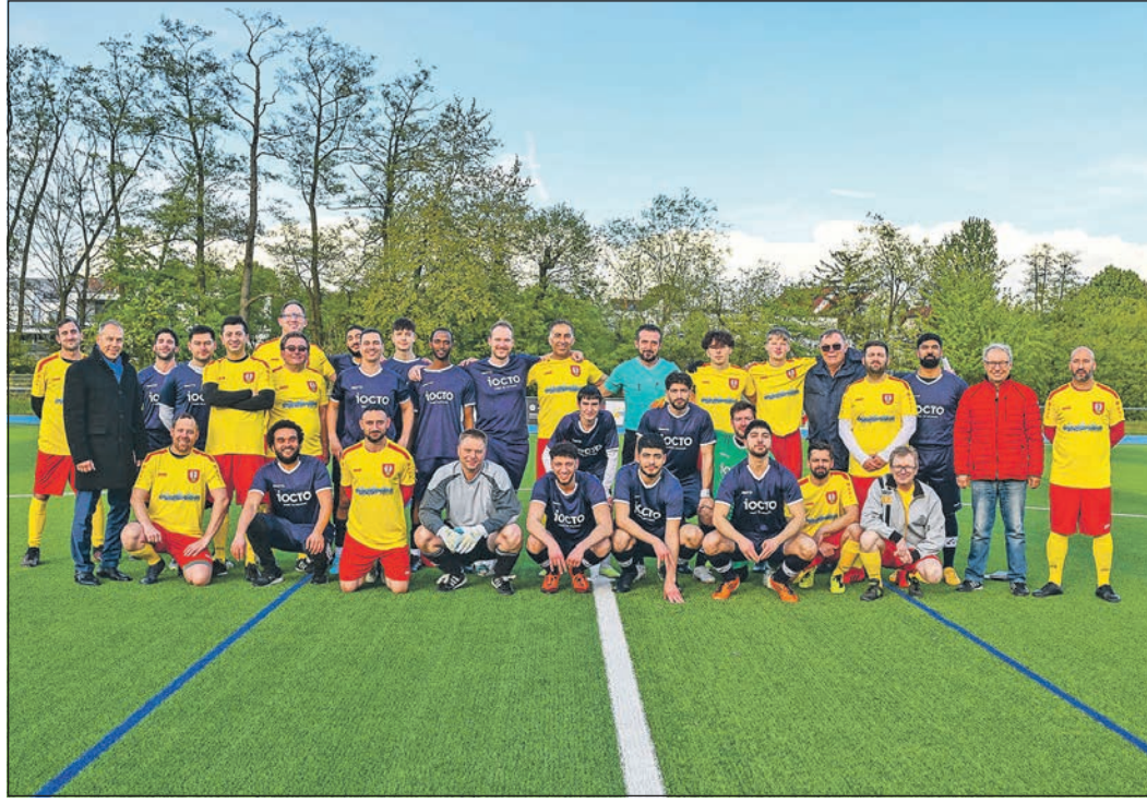
Zum Auftakt der Fußballsaison spielen die städtischen Körperschaften Eschborn gegen die Betriebssportgruppe der Firma Iocto.