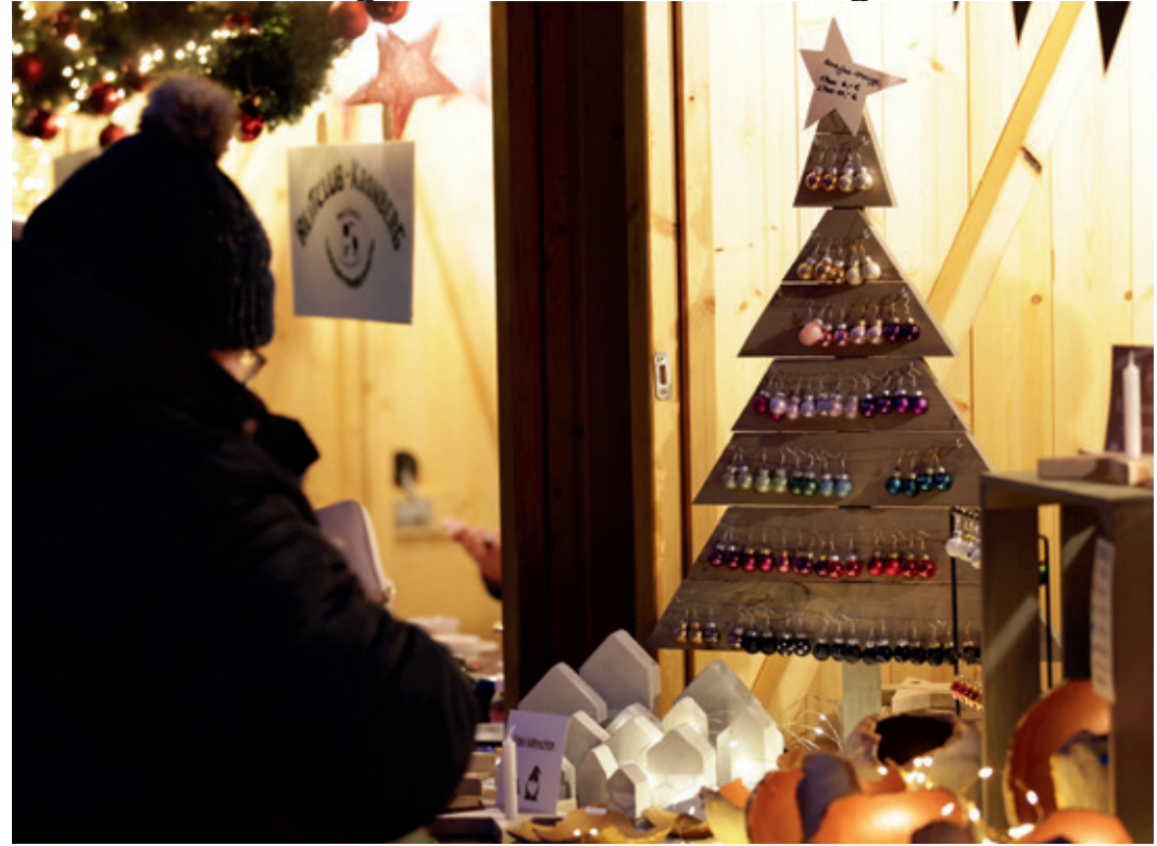
Ob Kunsthandwerk oder Kulinarik - auf den Weihnachtsmärkten in Kronberg und Oberhöchstadt findet alles in großer Vielfalt seinen Platz.

Wichtige Eckpfeiler sind zudem seit eh und je die Kronberger Partnerschaftsvereine.