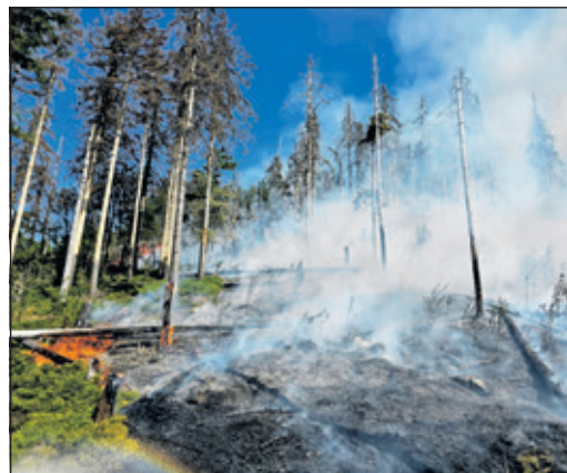
Löscharbeiten zum Großbrand auf dem Altkönig

Wir suchen nach konkreten Alternativen, und auch diese sind ein hartes Brett.“ Zudem müssten auch die Belange des DRK im Blick behalten werden.