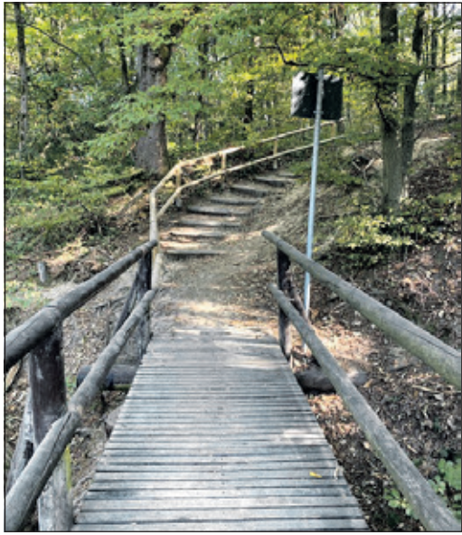
Der Zustand des Weges vorher...