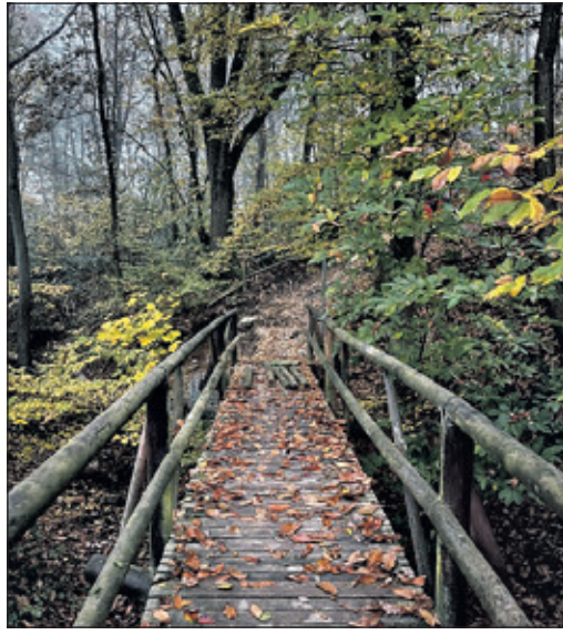
Der Weg soll in Abschnitten wieder hergerichtet werden.

Oberhöchststadt (kb) – Schon lange vor der Corona-Pandemie wurde der Wunsch vieler Bürgerinnen und Bürger aus dem Ortsteil Oberhöchststadt an den Verein Heckstadt Freunde Oberhöchststadts e.V. herangetragen, sich des beliebten Spazierwegs „In den Fichten“ anzunehmen. Dieser Weg, der unter anderem das Altkönigstift mit weiteren Spazierwegen und Bänken – aufgestellt vom Verein – verbindet, führt zu wichtigen Anlaufpunkten wie dem Tennisverein, dem Kindergarten und der Grundschule. Zudem ist er ein verstecktes Naherholungsgebiet, das viel Ruhe und Natur bietet und ideal zum Verweilen ist. Da sich der Verein Heckstadt stets für die Heimatpflege und den Ortskern einsetzt, wurde frühzeitig Kontakt mit der Stadt Kronberg aufgenommen. In mehreren Vor-Ort-Terminen wurde die Situation erläutert und der Wunsch, den Weg instand zu setzen, traf auf Zustimmung. Doch dann kam Corona, und das Vorhaben musste zunächst auf Eis gelegt werden. Nach der Pandemie nahm der Verein das Projekt wieder auf und setzte sich