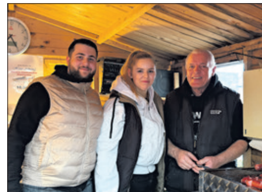
Der Duft von frisch geräucherten Fisch lockte die Gäste auf die Terrasse des Hauses Altkönig: Das Team räuchernte und verkaufte Forellen vom Forellengut Herzberger.

Ein weiteres Highlight des Tages war der Duft von frisch geräucherten Taunus-Forellen vom Forellengut Herzberger, der die Gäste auf die Terrasse des Hauses Altkönig lockte. Das Team des Hauses Altkönig räuchernte und verkaufte den Fisch direkt vor Ort. Auch gab es Rinds- und Bratwürste und heißen, duftenden Glühwein. „Man spürt, dass dieser Markt nicht nur eine Veranstaltung ist, sondern eine