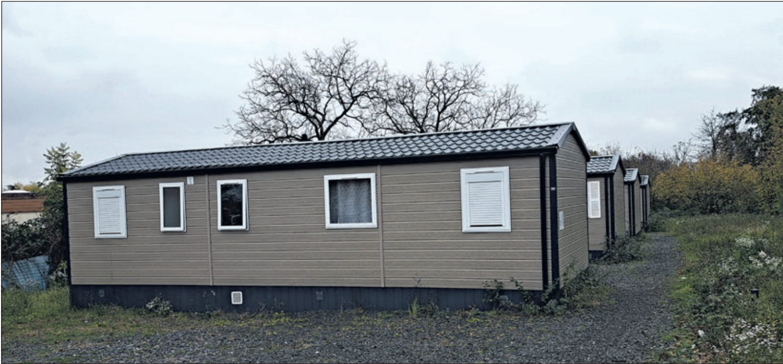
Die Mobile Homes in der Frankfurter Straße müssen an einen anderen Standort verlegt werden. Eine Herausforderung für Kronbergs Kommunalpolitik.