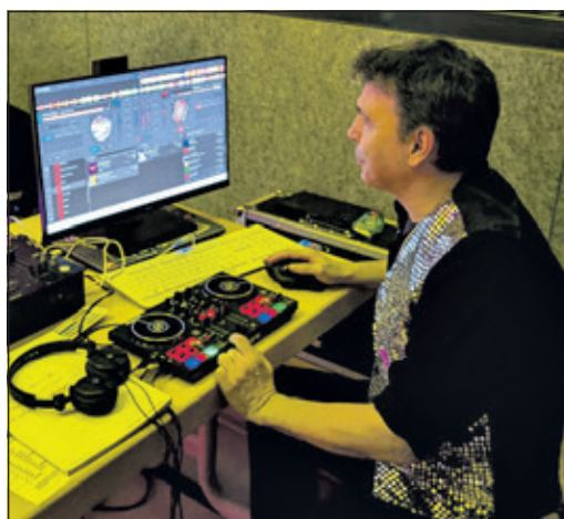
Das Rätsel ist gelöst: Bernd Pscheiden ist der Urheber des Kronberg Songs.