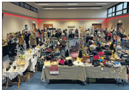
An den weihnachtlich geschmückten Ständen des Oberhöchstädter Martinsmarkts war für jeden Geschmack etwas dabei.