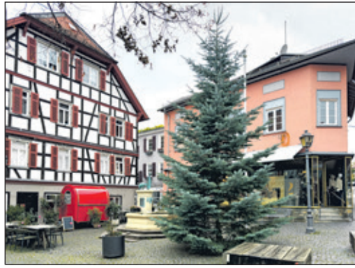
Der prächtige Weihnachtsbaum auf der Kronberger Schirn: Das gute Stück stammt aus einem Oberhöchstädter Garten und wurde von seiner Besitzerin der Stadt gespendet.