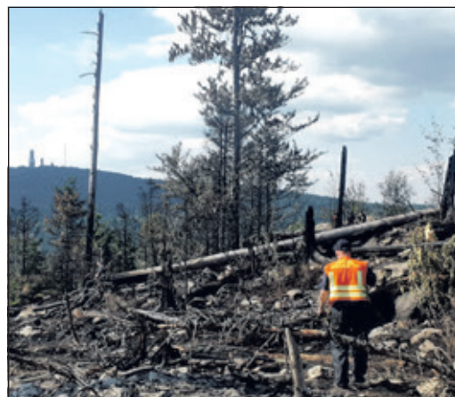
Ein Bild der Verwüstung nach dem verheerenden Feuer