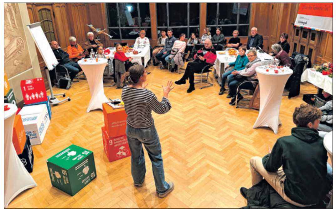
Gelungener Auftakt: Rund 40 Gäste waren der Einladung zum ersten Kaffee-Nachmittag ins Rathaus gefolgt.

Ob sich für einen solchen „Fairteiler“ auch in Kronberg ein Platz finden ließe? Das war eine der Fragen, die im Anschluss an den Vortrag unter den Café-Gästen rege diskutiert wurden. Die von Schülerinnen und Schülern der Kronberger Altkönigschule getragenen SDG-AG und die Organisation „foodsharing“ wol-