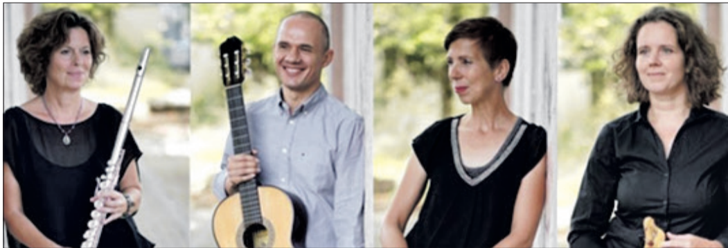
Das Cuarteto Mosaico gibt am 31. Augustkonzert im Park des Altkönig-Stifts.