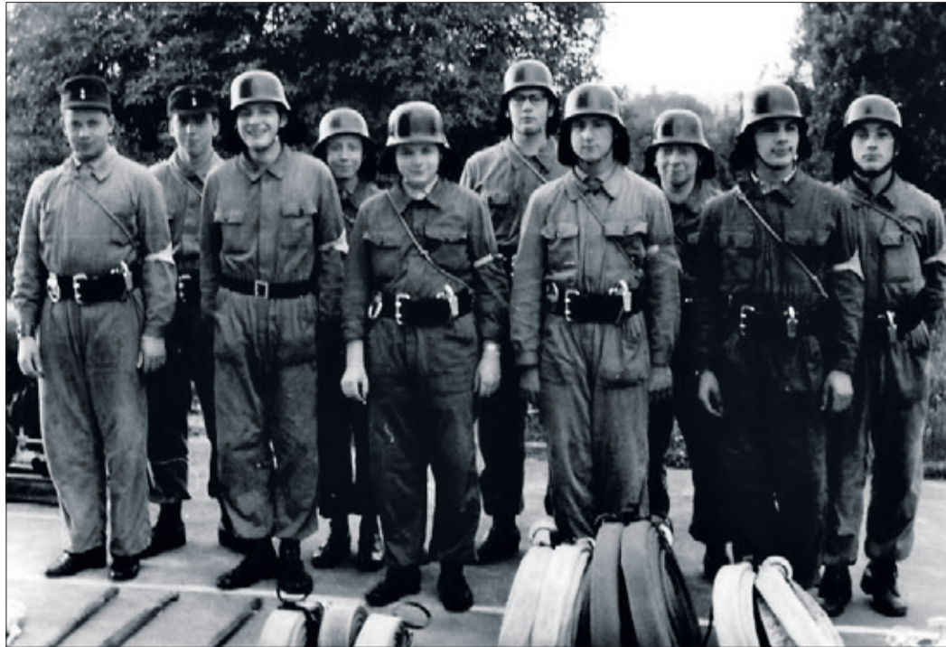
Grundlehrgang der Jugendfeuerwehr Kronberg im Jahr 1961