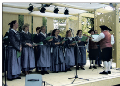
Der Chor der 1. Kronberger Laienspielschar in Aktion

Gerne können Picknickdecken, Getränke und Speisen mitgebracht werden. Es wartet ein fröhlicher, musikalischer Abend im Kreise musikbegeisterter Menschen. Das sollte Motivation genug sein. Natürlich wird das vielseitige und abwechslungsreiche Liedgut zur Verfügung gestellt. Bei „schlechtem Wetter“ findet die Veranstaltung nicht statt.