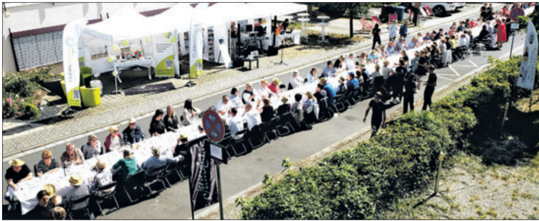
Beindruckendes Bild von der ersten Oberhöchstädter Genussstafel

Oberhöchststadt (kb) – Am Sonntag, 25. August, fand die erste Oberhöchststädter Genussstafel bei schönstem Wetter unter freiem Himmel statt.