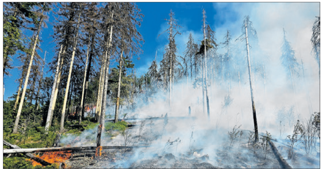
Der Brand auf dem Altkönig beschäftigte zahlreiche Feuerwehren aus dem Hochtaunuskreis für mehrere Tage im Jahr 2023.

dung wird beispielsweise immer ausgeklügelter. Wärmebildkamera und automatisierte Atemschutzüberwachung sind heute Stand der Technik. Hinzu kommen permanente Schulungen und regelmäßiger Besuch von Lehrgängen. Das „reine Löschen“ von Bränden rückt dabei immer mehr in den Hintergrund. Im Gegenzug ist der Einsatz