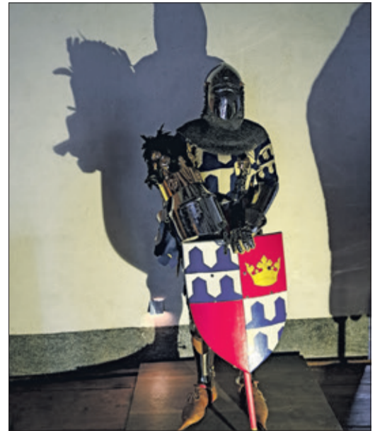
Die Ritterrüstung vermittelt einen Eindruck von der damaligen Körpergröße der Menschen.

Die zahlreichen Führungen sind es allerdings nicht alleine. Zu den Aufgabenbereichen des Arbeitskreises Museum zählen zudem die Betreuung des Vereinsarchivs, die Aufsicht im Stadtmuseum in Zusammenarbeit mit dem Burgverein und dem Geschichtsverein, die Führung der Burgkasse und die Besucherbetreuung. „Aufgrund der vielfältigen Einsätze treffen wir uns jeden ersten Montag im Monat, um entsprechende Pläne zu erstellen und