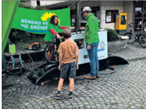
Eine Fahrradwaschanlage in Aktion

Kronberg (kb) – Verkehrspolitik ist ein wichtiger Aspekt der Lokalpolitik der Grünen. In diesem Zusammenhang bewerben die kommunalpolitischen Kräfte auch das diesjährige Stadtradeln, das ebenfalls im Programm der „Taunus Klimatage“ enthalten ist. Beim Stadtradeln handelt es sich um einen bundesweiten Wettbewerb zwischen dem 1. und 21. September, bei dem es darum geht, wer die meisten Kilometer mit dem Fahrrad zurücklegt. Die Grünen finden diese Idee unterstützenswert. Deshalb rufen die Grünen die Bürgerschaft auf, beim diesjährigen Stadtradeln mitzumachen. Beim durchaus auch sportlichen Wettbewerb geht es darum, binnen 21 Tagen möglichst viele Alltagswege mit dem Fahrrad – also klimafreundlich – zurückzulegen. Dabei kommt es allein auf die Summe an – egal, wie viel Kilometer am einzelnen Tag „erradelt“ werden. Innerhalb der Stadt konkurrieren verschiedene Teams miteinander, und die Grünen werben jetzt dafür, ihr Team zu stärken, welches unter der Bezeichnung „Kronberg: Grün radelt“ antritt. Näheres un-