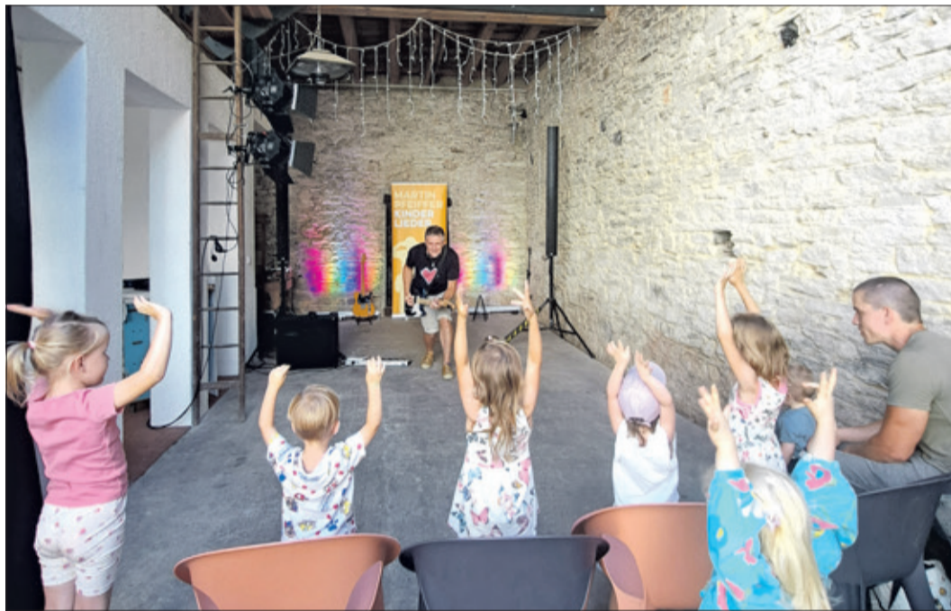
Die kleinen Gäste nahmen im Hof vor der Dingeldein-Scheune Platz.

live unterwegs und absolviert jährlich etwa 80 Auftritte im gesamten deutschsprachigen Raum. Eine Herzensangelegenheit für ihn sind die UNICEF-Kinderrechte. In Zu-