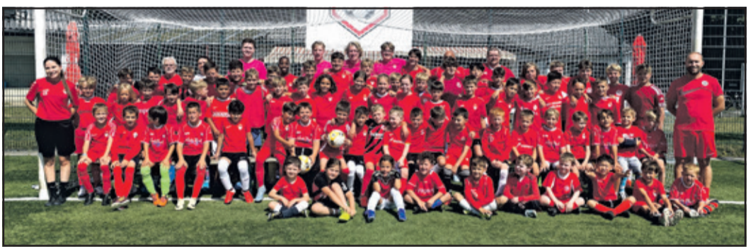
Fußballbegeisterte Kinder und Trainer im EFC-Kronberg Sommercamp