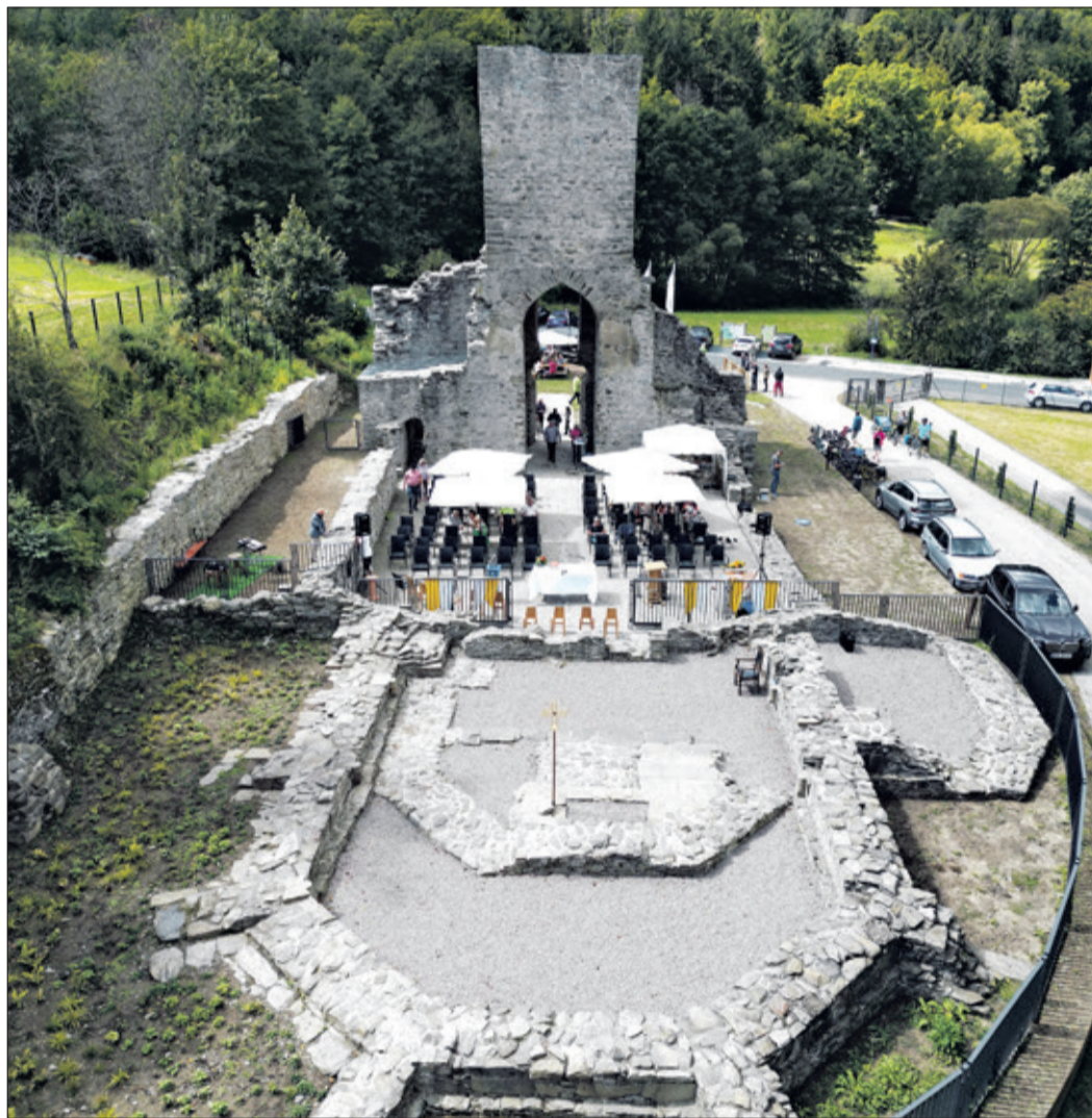
Kaum wiederzuerkennen: So präsentierte sich die sanierte Wallfahrtskirche nach sechsjährigen Ausgrabungen und Arbeiten am Festwochenende.

zige Wermutstropfen an diesem Wochenende bleiben.