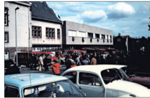
Der Feuerwehrstandort im Jahr 1974

1928 bestand, mit der von Kronberg. Seit 1986 bilden die Stadtteilwehren von Kronberg und Schönberg eine Einheit. Anfängliche Animositäten sind längst Geschichte, nicht zuletzt, weil die jüngeren Feuerwehrleute nur noch eine Wehr kennen. Bis zur 125-Jahr-Feier im Jahr 1999 konnte der Fuhrpark weitgehend durch neue Fahrzeuge optimiert werden. Ferner wird bis heute stets darauf geachtet, die Ausrüstung auf aktuellem Stand zu halten. Die Schutzklei-