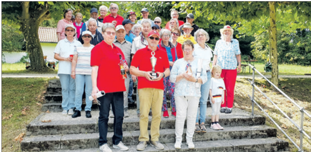
Teilnehmerinnen und Teilnehmer des Bouleturniers des Städtepartnerschaftsvereins Kronberg-Le Lavandou

Kronberg (kb) – Der Partnerschaftsverein Kronberg-Le Lavandou veranstaltete am Sonntag, 25. August, sein jährliches Bouleturnier, bei dem bereits seit dem Jahr 1994 in drei Runden mit jeweils neu ausgelosten Partnern und Gegnern um den Vereinspokal gespielt wird.