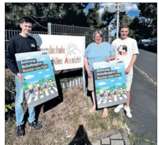
JU und CDU vereint bei der Plakataktion zum Schulbeginn