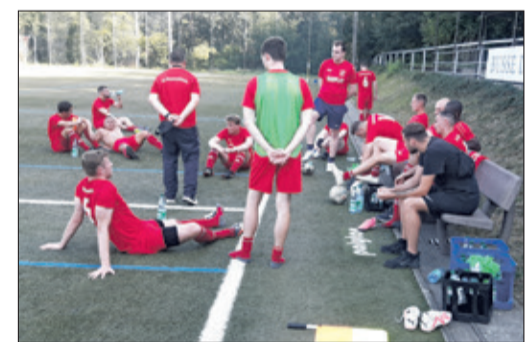
Sprachlosigkeit, aber keine Vorwürfe: das Mammolshainer Team nach dem Abpfiff.

Grund zur Panik besteht beim FCM trotz der verschenkten Punkte nicht, obwohl jetzt zwei Auswärtsspiele hintereinander folgen. Was die Verantwortlichen und die Mannschaft aber in den Griff bekommen sollten, ist der Leistungsabfall nach der Pause.