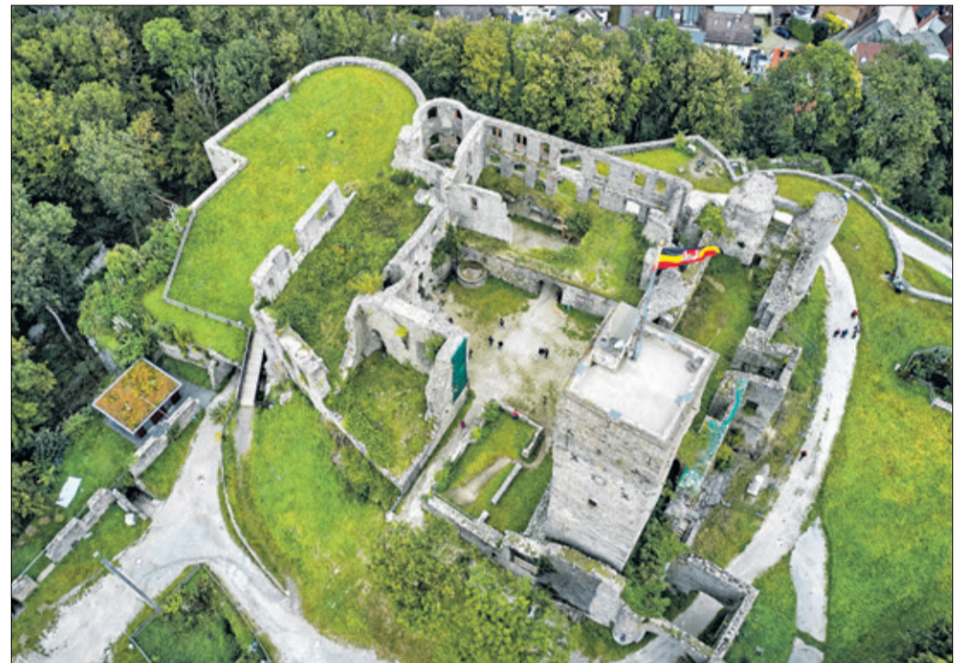
So sehen ein Vogel oder eine Drohne Königsteins größtes Denkmal.

Das Motto der Veranstaltungsreihe „Tag des offenen Denkmals“ ist in diesem Jahr „Wahr-Zeichen. Zeitzegen der Geschichte“. Keine andere Bezeichnung für Königsteins große Burgruine ist treffender als dieses Motto: Als Wahrzeichen thront sie erhaben und immer sichtbar über der Stadt und als Zeitzeuge verwahrt sie Geschichte(n) aus vielen Jahrhunderten in ihrem Gemäuer.