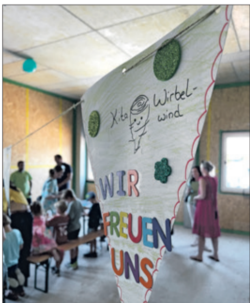
Die Kinder bastelten während des Festakts eine Wimpelkette, die die Kita bald zieren soll.