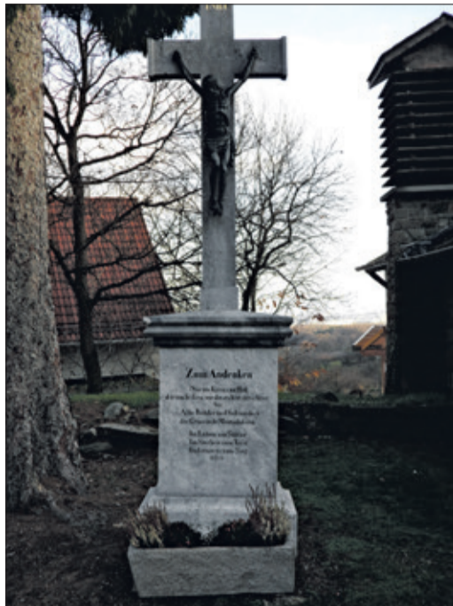
Am Tag des Denkmals zeigt der Heimatverein eine Fotoausstellung zu Denkmälern im Ort.

Ein früher Besuch in der Dorfstube lässt sich an diesem Sonntag gut mit dem Konzert des MGV Heiterkeit verbinden, das um 16 Uhr in der Schulturnhalle beginnt (Artikel dazu siehe unten).