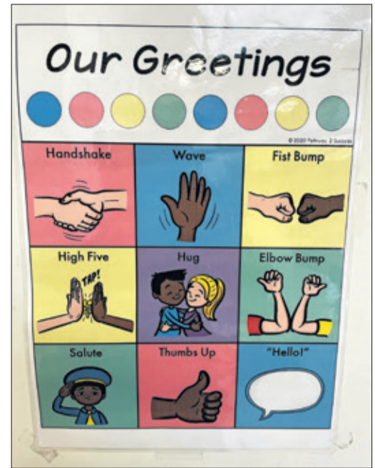
Die Kinder erlernen die unterschiedlichen Begrüßungsformen auf spielerische Weise.

Mit Anny Apple, Bouncy Ben, Clever Cat und ihren Freunden im Letterland lernen die Kindergartenkinder spielerisch lesen und schreiben. Neben der zweisprachigen Förderung bietet das Kids Camp auch eine frühe MINT-Bildung im Kindertagesstätten- und Grundschulalter in Mathematik, Informatik, Naturwissenschaften und Technik an. Im „Zahlenland“ erhalten die Kindergartenkinder einen ersten Zugang zur Mathematik. Mit Unterstützung der „Stiftung Kinder forschen“, besser bekannt als das „Haus der kleinen Forscher“, setzt das Kids Camp eine gute MINT-Bildung schon mit den Jüngsten um. Highlight dieser Zusammenarbeit war der Kita-Wettbewerb „Forschergeist“ im Jahr 2020, bei dem 651 Kitas aus ganz Deutschland ihre Projekte aus den MINT-Bereichen einreichen und sich das Kids Camp mit dem