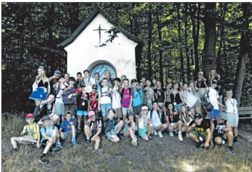
Man sieht es: Die Kinder hatten Spaß in ihrem Königreich „TWTopia“ in Kronach.

Schloßborn (kw) – Sommerferienzeit bedeuten neun unvergessliche Tage auf der Kinderfreizeit des Vereins TWTuwas für Kinder und Jugendliche e.V. – Schloßborn. Für 39 Kinder und acht Betreuer und Betreuerinnen ging es am 10. August in das Schullandheim Kronach. Das Motto der diesjährigen Freizeit war „TWTopia“ – Besuche ein fantasievolles Königreich.