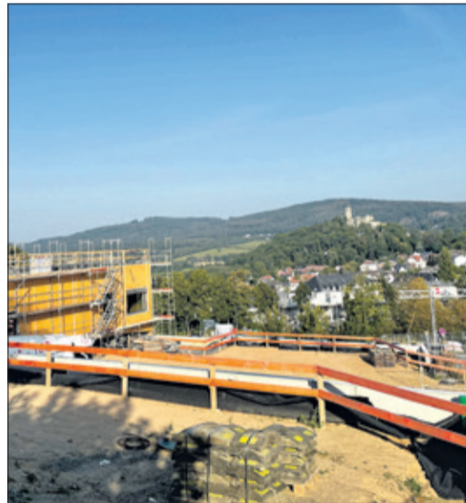
Weitsichtig ist der Neubau – vom Ausblick bis hin zu den verwendeten Baumaterialien.