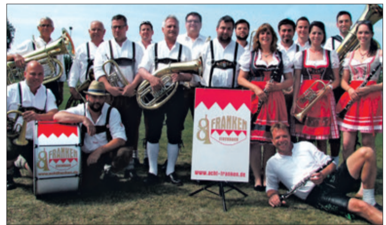
Die „8 Franken“ werden beim Oktoberfest der Mandoliner als Hauptgruppe des Abends für bayerische Bierzeltstimmung sorgen.

Ab 18 Uhr öffnet das Bürgerhaus Falkenstein im natürlich ganz in bayerischem Ambiente geschmückten Saal seine Pforten, bevor dann pünktlich um 19 Uhr mit dem Einzug der Festwirte und dem Fassanstich der offizielle Startschuss des Festes erfolgt. Für die perfekte musikalische Stimmung konnten erneut die beliebten „8 Franken“ verpflichtet werden, zu späterer Stunde heizen „Extrem“ bei Königsteins höchstgelegener Hüttenparty ein. Und als festen Programmpunkt gibt es natürlich auch wieder die inoffizielle Stadtmeisterschaft im Wettsägen mit der Trummsäge, für die sich nach unbestätigten Meldungen diverse Teams bereits seit Wochen in schweißtreibenden Trainingslagern befinden ... Für das leibliche Wohl sorgen allerlei bayerische Schmankerl, von der Brezn über Weiß-