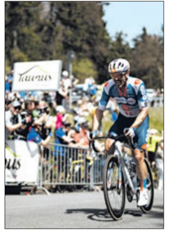
Unter den Teilnehmenden der Sternfahrt wird ein Trikot von John Degenkolb verlost.

Frankfurt. Das Jersey ist übrigens „match worn“ – es wurde während eines Rennens getragen. Gefahren wird zumeist auf Fahrradwegen und gut befahrbaren Feld- und Forstwegen. Wer ab Bad Homburg startet, darf sich gleich zu Beginn auf eine kleine „Berge-tappe“ zur Saalburg hoch gefasst machen. Eine sportliche Grundausrüstung oder ein E-Bike sind erforderlich. Die Teilnahme ist kostenlos und erfolgt auf eigene Gefahr. Aus organisatorischen Gründen wird um Anmeldung gebeten per E-Mail an mobiltaet@hochtaunuskreis.de .