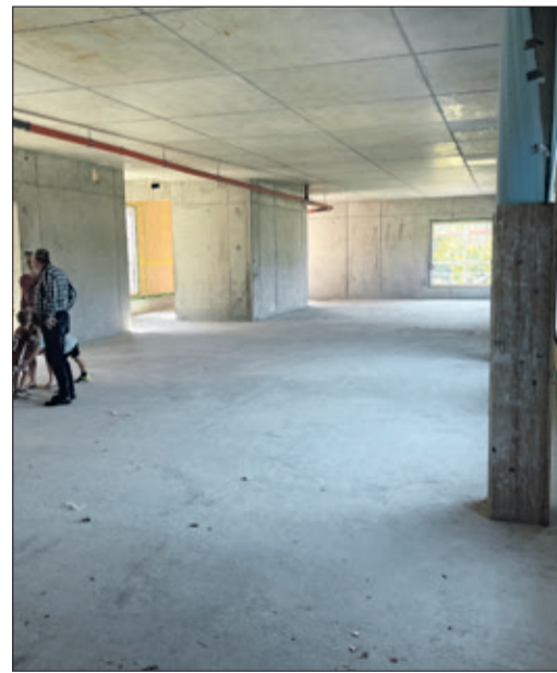
Wird noch schöner: Der Bewegungsraum besticht aber allein schon durch seine Größe.