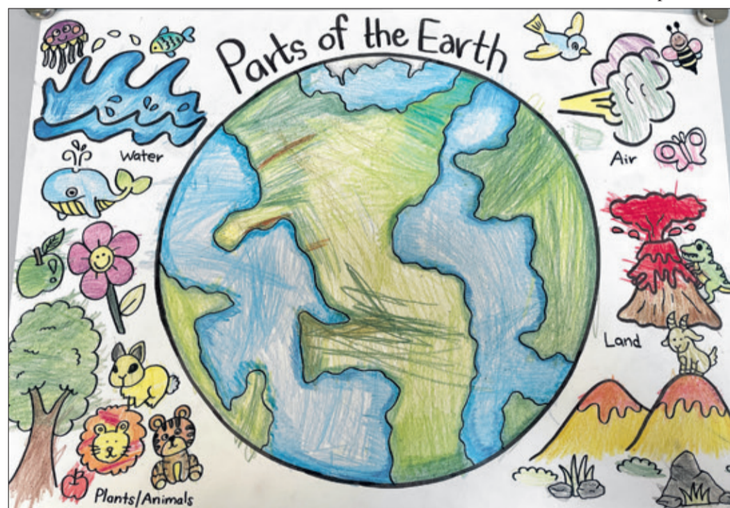
Alles ist spielerisch aufgebaut, aber bereits im Kindergarten des Kids Camp in Heuhohlweg, werden Natur, Flora und Fauna mit englischen Bezeichnungen in Verbindung gebracht.

Weitere Informationen: Kids Camp Bilinguale Grund- und Vorschule Königstein, Sekretariat 06174 9987500; Kids Camp Königstein – Bilinguale Tagesstätte 06174 2556135; Krippe, Kids Camp Schneidhain 06174 9357880. www.kidscamp-ggmbh.de