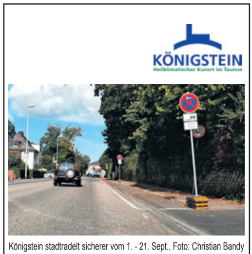
Königstein stadtradelst sicherer vom 1. - 21. Sept., Foto: Christian Bandy

Für unverlangt eingesandte Manuskripte und Fotos wird keine Haftung übernommen.