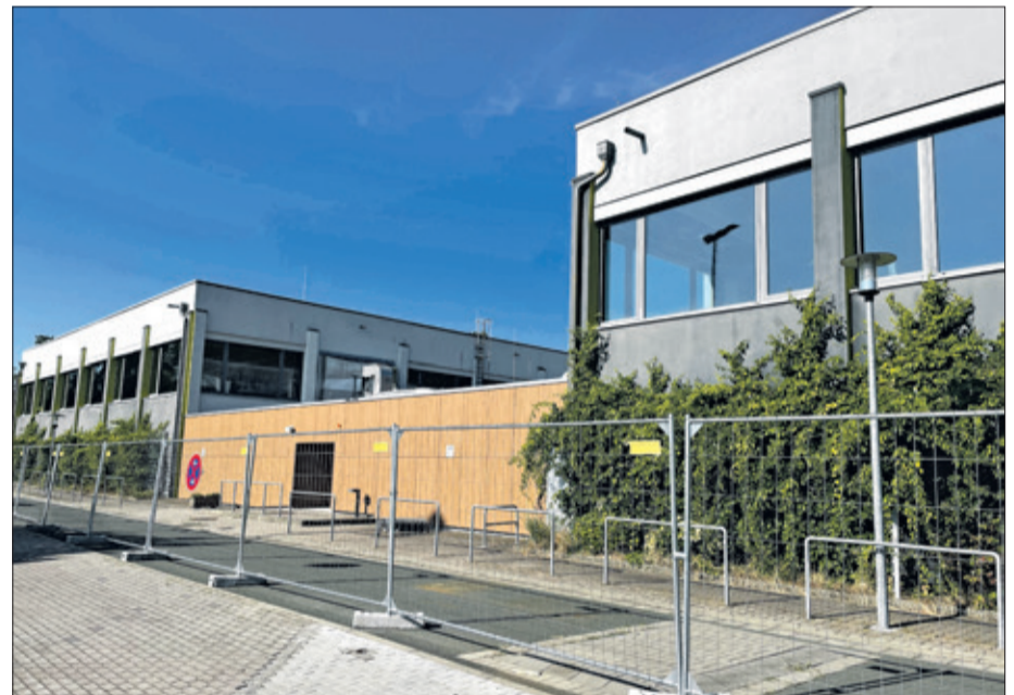
Der Bauzaun zeigt es deutlich: Die Doppelsporthalle am Taunusgymnasium ist noch immer gesperrt. Ab Ende September, so die aktuellen Hoffnungen, soll die rechte Halle wieder genutzt werden können.

Königstein (as) – In dieser Woche hat die Schule wieder begonnen, im Taunusgymnasium allerdings weiterhin ohne Sportunterricht unter dem Hallendach. „Leider wird sich die erhoffte Öffnung für den Sport- und Trainingsbetrieb nach den Sommerferien in der kleinen Halle nicht halten lassen“, hat der Hochtaunuskreis jetzt mitgeteilt. Damit ist die Situation für die Schüler wie auch für die betroffenen Vereine die gleiche wie vor einem Jahr, als die Halle für das Schul- und Trainingsjahr nach den Sommerferien Anfang September vom Hochtaunuskreis als Schulträger geschlossen wurden. „Vertiefte Untersuchungen“ hätten Mängel zum Vorschein gebracht, die aus Sicherheitsgründen keine weitere Nutzung mehr zuließen. Sorgen bereiteten insbesondere die Auslagerpunkte der Dachkonstruktion. Bereits von Juni 2021 bis Frühjahr 2022 war das Gebäude für die Reparatur von Schädstellen am Dach gesperrt gewesen. Bei der aktuellen Reparatur sollte die Doppelsporthalle bis Ende des Jahres für eine Freigabe ertüchtigt werden. Doch auch acht Monate später ist es noch nicht so weit. Aktuell wird in der kleinen Halle der Sportboden installiert. In der Tribünensporthalle werden noch die für die Vergrößerung der Fundamente geöffneten Bodenflächen wieder geschlossen und ergänzt sowie die Pfeilervorlagen beziehungsweise die zur Unterstützung ergänzten Stahlstützen mit einer Brandschutzverkleidung versehen. Die Rohbau- und Stahlbauarbeiten inklusive der Brandschutzverkleidung gestalteten sich umfangreicher und