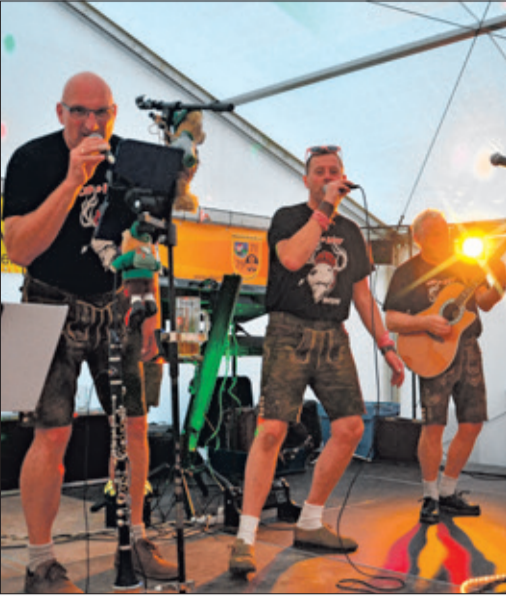
Die Lorcher Schlossbergmusikanten werden mit einer neuen Bühnenshow bei der Wiesn-Gaudi am Königsteiner Oktoberfest-Samstag für Stimmung sorgen.