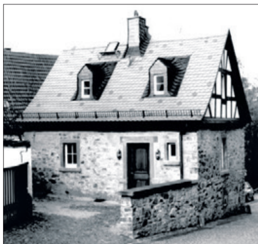
Die Mikwe in der Gerichtstraße

Auch am Freitag, 30. August, lädt die KuSi zur Teilnahme an einem kurzweiligen und belebenden Ausflug ins reizvolle Klima Königsteins ein: „Eine kleine Heilklima-Wanderung“ startet um 16 Uhr an der KuSi, Hauptstraße 13a. Die Wanderung führt auf einen der beiden Königsteiner Burgberge und dauert rund 90 Minuten – meist etwas