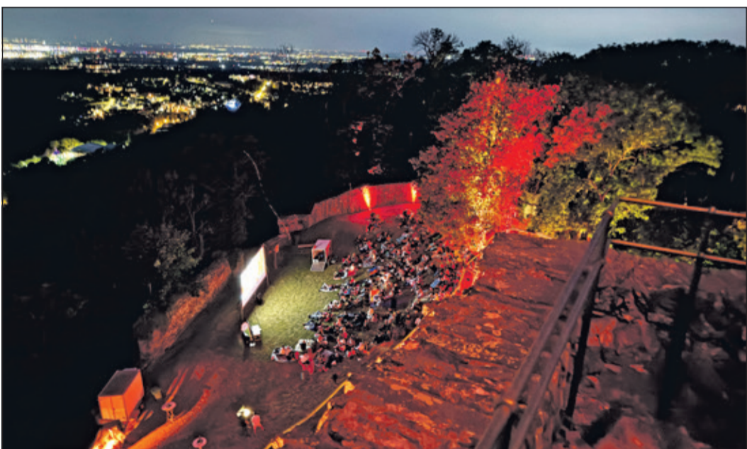
Vom Turm der Burg reichte der Blick weit über den Kinosaal unter Bäumen und über Kronberg hinweg bis zur Frankfurter Skyline.

Angesichts der durchweg positiven Resonanz planen die Veranstalter bereits weitere Events auf Burg Falkenstein, um die historische Stätte als lebendigen Kulturort zu etablieren. Viele Besucher hoffen bereits auf eine Wiederholung des Open-Air-Kinos im nächsten Jahr.