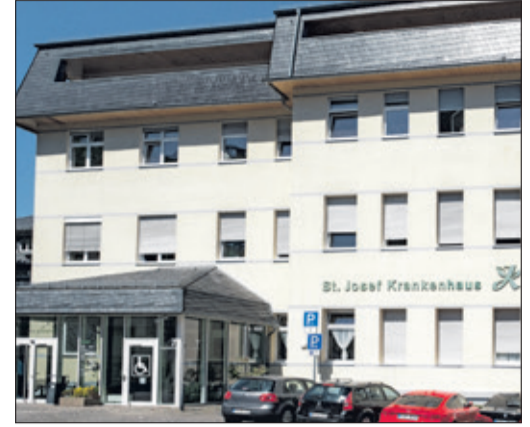
St. Josef: seit 112 Jahren am Ort.

stützt. Und natürlich kommen Naschkatzen ebenfalls nicht zu kurz: Die Grünen Damen servieren frischen Kaffee und leckeren Kuchen.