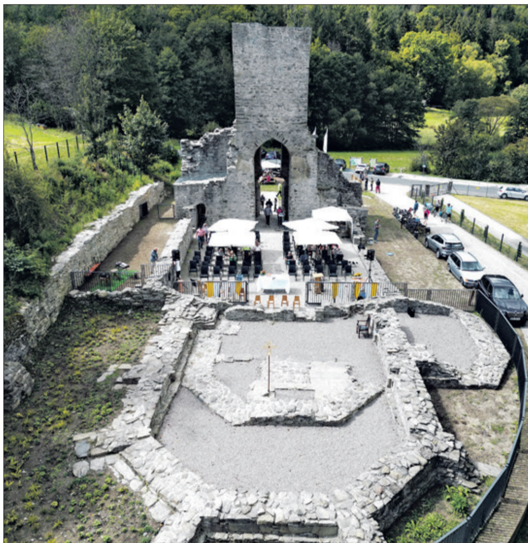
Kaum wiederzuerkennen: So präsentierte sich die sanierte Wallfahrtskirche nach sechsjähriger Ausgrabungen und Arbeiten am Festwochenende.