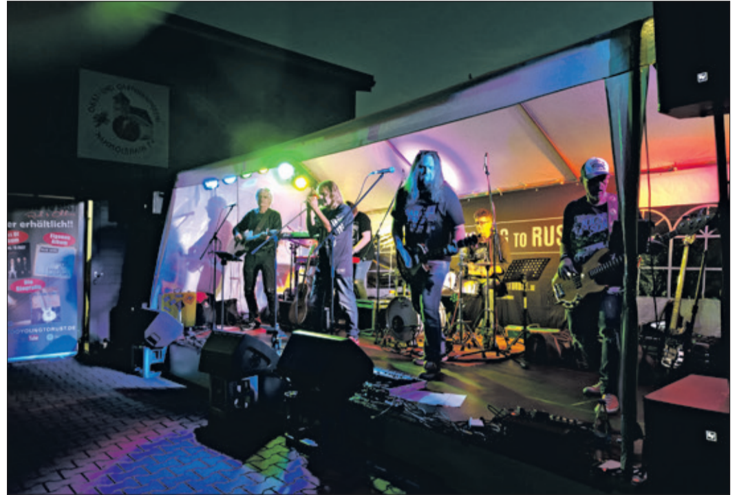
Zu jung zum Rosten. Das sagten sich auch die Jungs von „Too Young To Rust“ und bereiteten den Gästen des OGV beim traditionellen Hofkonzert einen schwungvollen Abend.

Mammolshain (kw) – Nach vielen verregneten Hofkonzerten in den vergangenen Jahren hat am vergangenen Freitag endlich mal wieder ein Open-Air-Konzert an einem lauen Sommerabend stattgefunden. Eine schöne Belohnung für den veranstaltenden Obst- und Gartenbauverein, der das Wagnis eingegangen war, mit „Too Young To Rust“ eine neue Band zu verpflichten. Die Bad Vilbeler Jungs haben ihr Versprechen, Mammolshain für einen Abend mit guter Musik zu unterhalten, mehr als eingelöst. Ein Lieblingssong nach dem anderen schallte durch die Streuobstwiesen – von Deutschrock bis zu Internationalem, von Balladen bis Hardrock. In der Spitze bis zu 300 Gäste, insgesamt bestimmt über 400, viele davon tanzwütig, belebten den Vorplatz der OGV-Halle am Stützpfel Mammolshains. Kinder, Jugendliche, Erwachsene und Senioren – alle hatten ihren Spaß. Der OGV bot Brat- und Wildschweinwürstchen, außerdem Handkäs mit Musik, perfekt