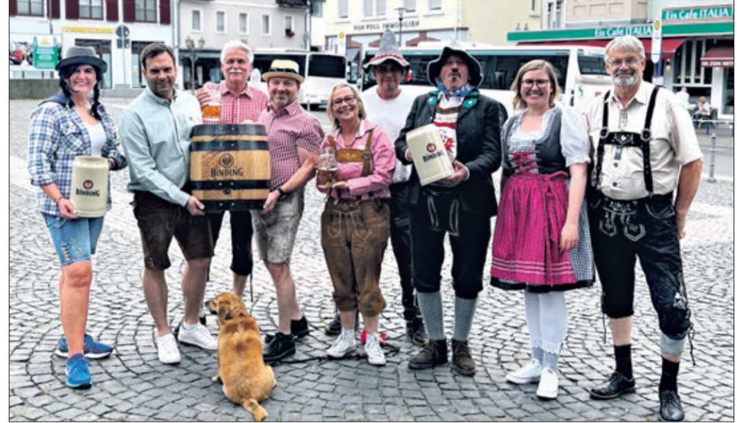
Das Oktoberfest-Team der Plaschis steckt schon mitten in den Vorbereitungen.

Am Samstag entfaltet sich die „Wiesn-Gaudi“ mit den Lorcher Schlossbergmusikanten. Die Besucher erwartet ein stimmungsvolles Programm, bei dem die vier Musiker aus Lorch am Rhein, diesmal mit einer neuen Bühnen-