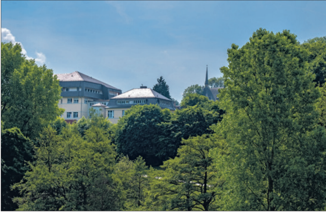
Das Königsteiner Krankenhaus punktet auch mit seiner Lage zwischen Altstadt, Burgberg und Woogtal.

Königstein (kw) – Hessens kleinste Klinik kommt ganz groß raus: Am Sonntag, 8. September, öffnet das St.-Josef-Krankenhaus in Königstein seine Tore und lädt alle Interessierten zum Tag der offenen Tür ein. Von 10 bis 17 Uhr haben Besucherinnen und Besucher die Möglichkeit, ihre Gesundheit checken lassen, sich über medizinische und pflegerische Angebote zu informieren, Spannendes zur Historie des traditionsreichen Hauses am Fuße der Königsteiner Burg zu erfahren oder auch den schattigen Garten zu genießen.