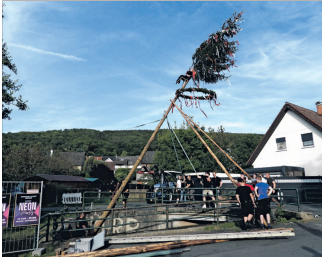
So wie früher: Die Kerbeborsch Oberems nutzen Stangen und ihre Muskelkraft, um die 15 Meter hohe Kerbfichte samt Schlagges in die Senkrechte zu bringen.

Angeführt wurde der Zug von den Fahnen-trägern mit den Fahnen in den Farben der Oberemser Kerb – rot und weiß. Von der Mühlstraße ging es über die Hauptstraße zum Kerbplatz im Heuweg. Dort angekommen, wurde der Baum zunächst geschmückt, ein großer Kranz daran befestigt und der Schlagges, also die Kerbepuppe, im Wipfel platziert. Vorsichtig wurde die große Fichte mit Muskelkraft und langen Stangen aufgerichtet und verankert. In Oberems ist das – anders als auf manch anderer Kerb – noch