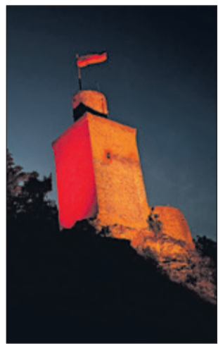
Toller Anblick: der Bergfried in besonderem Licht

Der Heimatverein Falkenstein e.V. dankt allen ehrenamtlichen Freunden, Mitgliedern und Unterstützern. Insbesondere die gute Zusammenarbeit mit der Stadt Königstein und die Unterstützung durch die Firma Bank, das Deutsche Rote Kreuz und die Beleuchtungs-