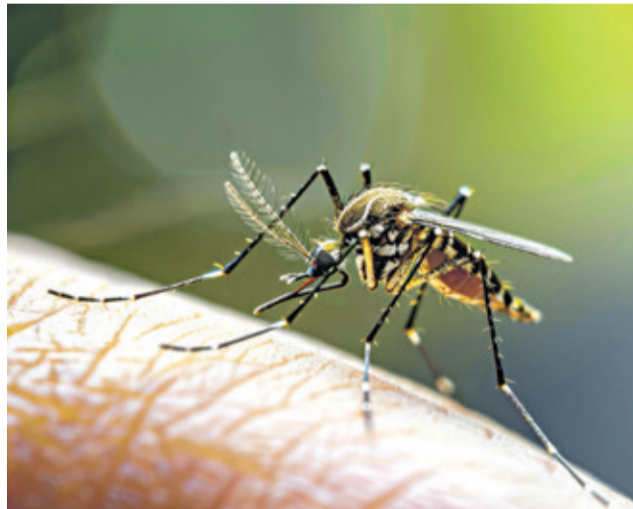
Sie können einem Angst einjagen.

Möchte man sich Stechmücken vom Leib halten, sollte man auf Alkohol lieber verzichten. Denn da trinken die Stechviecher gerne mit. Nicht nur die ausgeatmete „Fahne“ lockt sie an, sondern auch Ausdünstungen der Haut. „Süßes“ Blut von Menschen mit Diabetes interessiert Mücken dagegen nicht. Haben die Plagegeister doch zugestochen, dann gilt: auf keinen Fall kratzen! Den Juckreiz lindern elektrische Stichheiler aus der Apotheke. Sie zerstören durch Hitze den Botenstoff Histamin. Weitere Tipps und Infos zum Thema Mückenabwehr finden Sie unter www.a-u.de/11119881