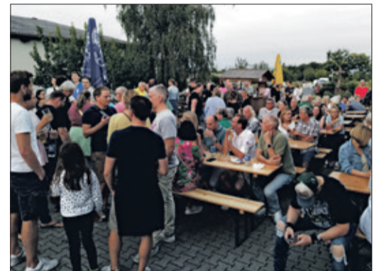
Vor der OGV-Scheune war schon vor Konzertbeginn allerhand los, insgesamt kamen gut 400 Gäste.

begleitet vom vereinseigenen Apfelwein. Erstmals am Start: Der Drinks-Stand mit Aperol Spritz und Jägermeister-Spezialitäten. Der OGV freut sich auf ein Wiedersehen im nächsten Jahr – immer am letzten Freitag in den Sommerferien!