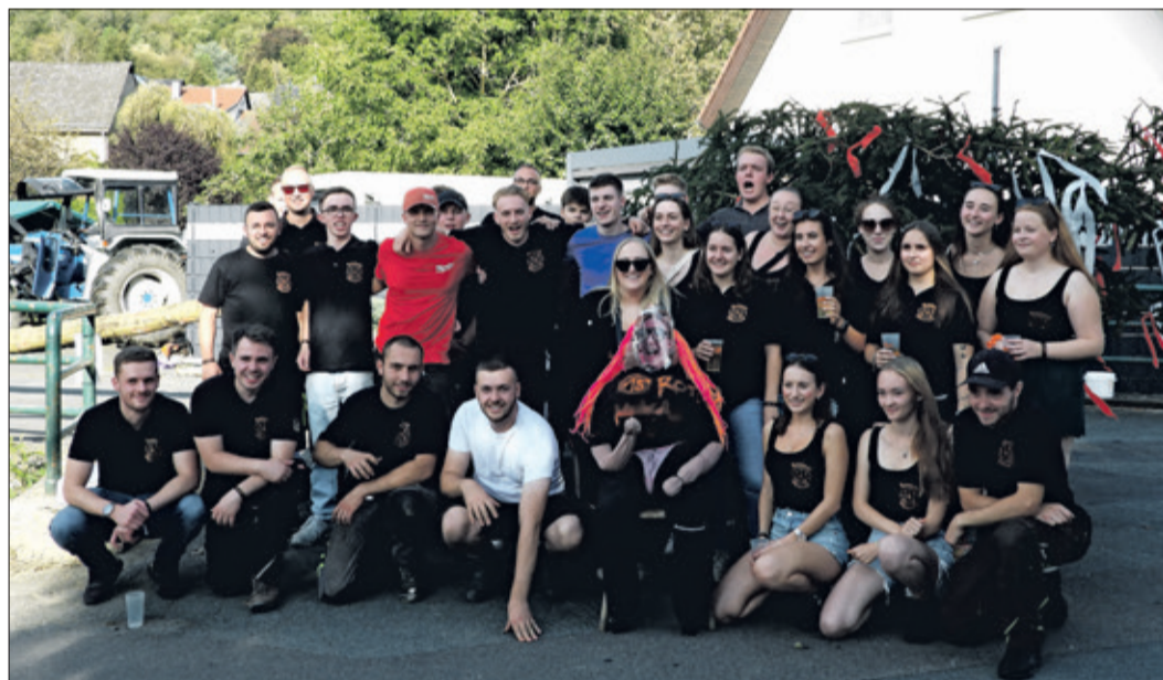
Oberems ist zwar ein kleines Dorf, hat aber einen sehr aktiven Kerbeverein und seit 15 Jahren auch wieder Kerbeborsch und -mädsche – hier noch mit dem Schlagges am Boden.