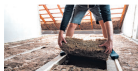
Die Dämmung des Dachbodens mit Mineralwolle, dazu gehören Glas- und Steinwolle, zählt mit wenig Aufwand zu den wirksamsten Einzelmaßnahmen am Haus, um wertvolle Energie einzusparen.

len oder Platten in zahlreichen Anwendungen rund ums Haus eingesetzt. Als Multifunktionsdämmstoff bringt Mineralwolle dabei Wärme- und Schallschutz zusammen, denn sowohl Glas- als auch Steinwolle können den Schall absorbieren und somit Lärm von innen und außen dämpfen. Mineralwolle ist außerdem von Natur aus nicht brennbar und verbessert daher auch den passiven Brandschutz. Kleinere Maßnahmen mit Mineralwolle wie die Dämmung der obersten Geschossdecke, der Rohrleitungen oder der Kellerdecke bis hin zur vollständigen Dach- und Fassadendämmung lohnen sich also. Mehr unter www.der-daemmstoff.de