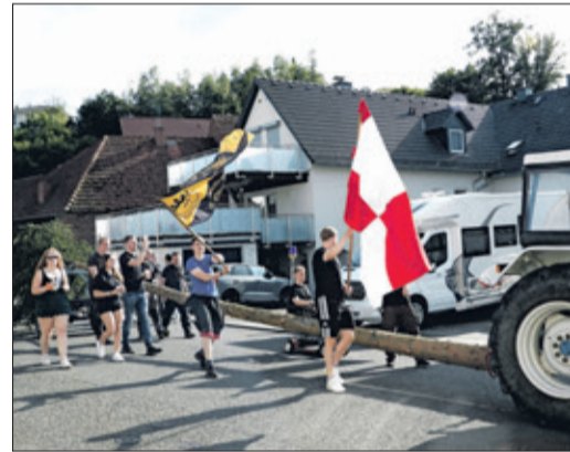
Fahnschwenkend sind die Kerbeborsch und -mädscher mit dem Baum auf dem Weg zum Kerbplatz.

• Auch die Polizei hatte auf der Kerb zu tun: Seite 16