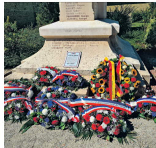
Gedenkkranze vor dem Denkmal

simultan ins Französische übersetzte, war es quasi bei ihrer ersten offiziellen Auslandsreise der „Antrittsbesuch“ in Le Mêle sur Sarthe. Angesichts der Bedeutung des Anlasses für den Besuch eine Geste, die die französischen Freunde mit großer Dankbarkeit registrierten und diese auch zum Ausdruck brachten. Die Bürgermeisterin wiederum genoss bei ihrem allerersten Aufenthalt in Le Mêle trotz des anstrengenden Besuchsprogramms die Gastfreundschaft und die ihr entgegengebrachte Herzlichkeit mit sichtlicher Bewegtheit und meinte, dass sie eigentlich als Fremde kam, aber binnen zwei Tagen neue Freunde gewonnen habe. So blieb dem Königsteiner Stadtoberhaupt neben einem obligatorischen „Fuße eintauchen“ in den wunderschön im Ortszentrum gelegenen Bade- und Freizeitsee in Le Mêle auch die Möglichkeit zu einem Kurzbesuch des in der Nähe befindlichen Nationalgestüts Haras du Pin, auch genannt das „Versailles der Pferde“, sodass sie nebenbei einige erste Eindrücke von der Schönheit und Attraktivität der Region mitnehmen durfte.