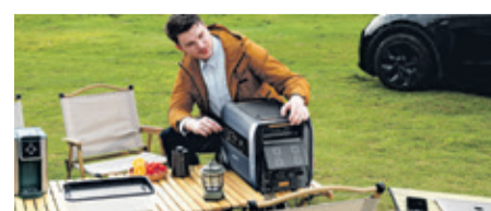
Von Kaffee kochen bis Akkus laden: Ausgestattet mit der mobilen Powerstation wird Camping schnell zum Glamping!

nen nötig. Die Speicherkapazität beträgt 2.400 Wh und lässt sich mit bis zu sieben Erweiterungsbatterien auf 19.200 Wh aufstocken. Mit einer App hat man Speicherstand und Verbrauch stets im Blick. Punktueller Verbrauch lässt sich mit Zubehör wie der intelligenten Steckdose von RUNHOOD, den Modi oder Smart Meter regulieren. Ausflug oder Campingtrip geplant? Einfach RUNHOOD F2400 aufladen, abstöpseln und einpacken. Komfortabel transportierbar, funktioniert sie unterwegs als mobile Powerstation. Mehr unter www.ademax-strom.de