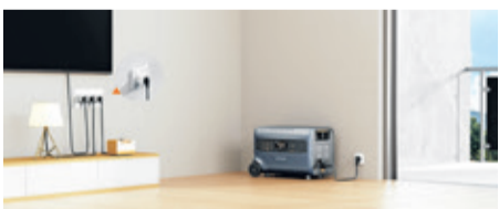
Solarenergie clever, effizient und ganz einfach mit einem 3 IN 1 Balkonkraftwerk nutzen: Powerstation, PV-Speicher und Home-Backup.

(epr) Photovoltaikanlagen, so weit das Auge reicht: Deutschland rüstet in Sachen solare Energiegewinnung auf, und das längst nicht mehr nur auf öffentlichen Gebäuden sowie Einfamilienhäusern. Auch der Installation kleiner Balkonkraftwerke in Mietwohnungen steht kein Vermieter seit Juli 2024 ohne triftigen Grund mehr im Weg. Ein positiver Trend, der im Alltag jedoch kleine Lücken aufweist. Denn hat die Sonne z. B. am Mittag ihren Höhepunkt erreicht und schenkt uns damit die volle Ladung Energie, ist häufig niemand zu Hause,