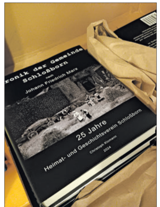
Druckfrisch eingetroffen: Die lange erwartete Schloßborner Gemeindechronik wird am 31. August präsentiert.

Vor den beiden Anlässen lädt der Heimat- und Geschichtsverein am kommenden Samstag,