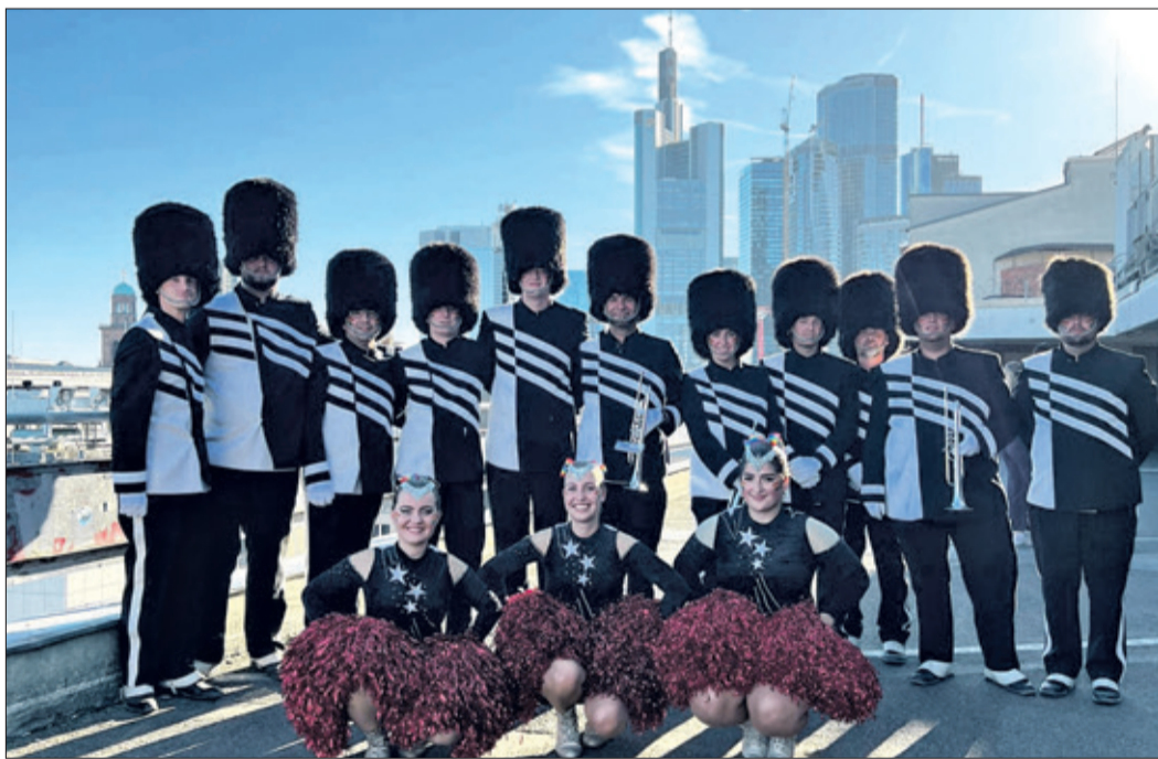
Über den Dächern Frankfurts, aber noch unter der Skyline legte die Musik- und Showband (MuShoBa) des Fanfarencorps Königstein einen besonderen Auftritt hin.