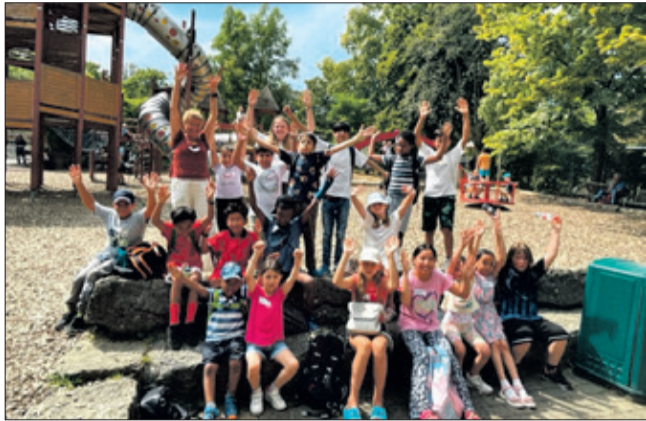
Die Kinder aus Flüchtlingsfamilien verbrachten einen tollen Ferientag im Opel-Zoo.