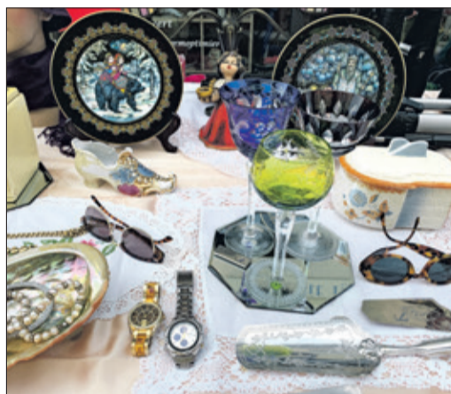
„Schätze“ finden ist möglich auf dem Antik- und Trödelmarkt.

Wer sich kurzfristig noch für einen eigenen Stand entscheiden möchten, meldet sich unter