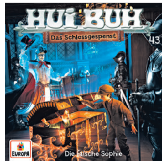
© Sony Music Entertainment Germany GmbH / Text: Joachim Ziebe / Illustration: Christian Bumba

“Fun for children from the age of six and, of course, for adults who are young at heart. Around 80 minutes of radio play joy,” Joachim Ziebe is sure. Despite the contemporary cover, the stories come across as wonderfully nostalgic, there are still carriages, gas lanterns, old inns, and rattling automobiles. It is to be hoped that the only officially approved ghost at Burgeck Castle, Hui Buh, will continue to haunt the children's rooms with his rusty rattle chain for a long time to come.