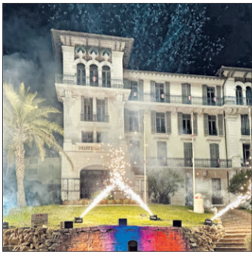
Feuerwerk über dem Cannetaner Rathaus zum 250. Jahrestag der Unabhängigkeit von Cannes.