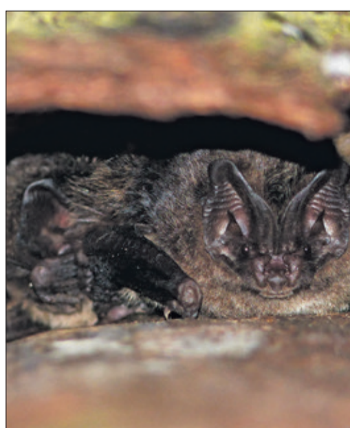
Mopsfledermäuse in ihrem Unterschlupf