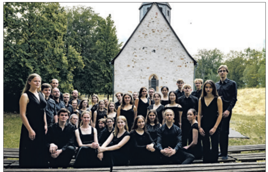
Der Jugendchor Hochtaunus hat eifrig geprobt und wird am Freitag und Samstag Konzerte in Kronberg und Usingen geben.

Der Jugendchor Hochtaunus steht in gemeinsamer Trägerschaft der Johann-Isaak-von-Gerning-Stiftung – Stiftung für Kunst und Kultur im Hochtaunuskries und des Sängerkreises Hochtaunus. Seit diesem Jahr steht er unter der musikalischen Leitung von Tristan Meister. Neben den traditionellen Sommerkonzerten konnte der Chor in den letzten Jahren unter anderem bereits auf den Deutschen Chorfesten in Stuttgart und Leipzig auftreten, im Jahr 2019 erschien seine erste CD-Einspielung „Nightfall – Sacred Romantic Part Songs“.