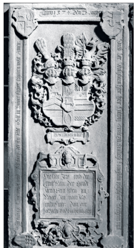
Das Königsteiner Epitaph

Gräfin Walburga zu Stolberg hatte in ihrem Testament festgelegt, an der Seite ihres Gat-