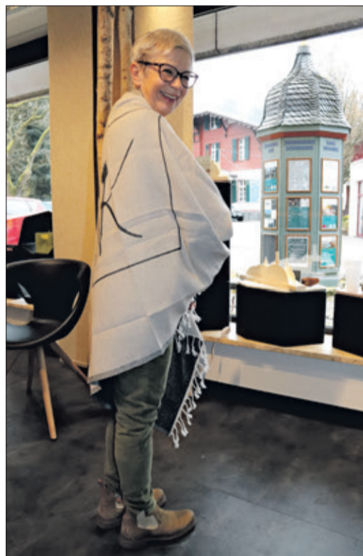
Das Zaubertuch