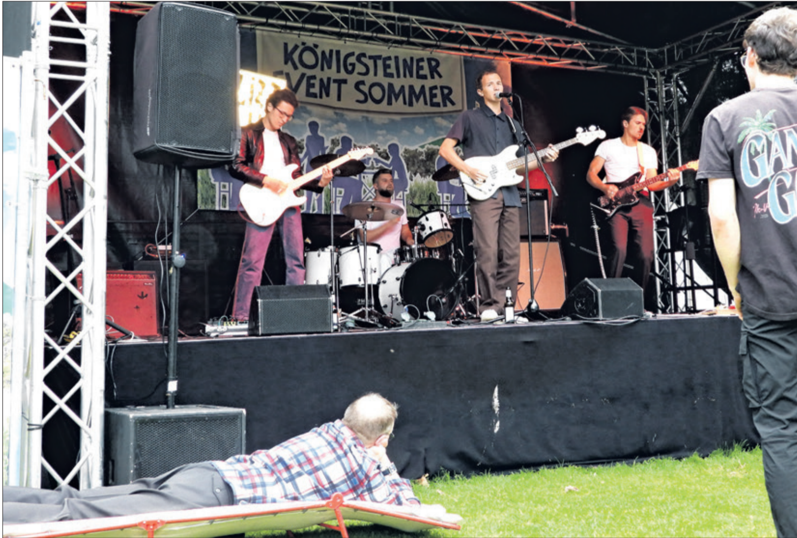
Blizz Club kam mit Rockmusik beim „Battle of the Bands“ super an, auch wenn es letztlich „nur“ zu Platz zwei reichte. Manche Zuhörer konnten bei der – natürlich lauten – Rockmusik gar nicht nah genug dran sein.

Königstein (nd) – Der „Battle of the Bands“ ist seit Jahren der Startschuss zu „Rock auf der Burg“. Am vergangenen Freitag lud die Rock AG, Veranstalter des Musikfestivals, zum Wettstreit der Bands in die Konrad-Adenauer-Anlage. Im Rahmen des Königsteiner Event Sommers fand der Wettkampf, bei dem topaktuelle Newcomer gegeneinander antreten, zum ersten Mal unter freiem Himmel statt – und die gesamte Königsteiner Innenstadt durfte mithören. Aus der nach Angaben des Veranstalters vierstelligen Zahl an Bewerbern hatten sich drei hervorragende Rockbands für den Wettbewerb qualifiziert. Dem Gewinner gebührt eine besondere Ehre, denn er wird das Eintagesfestival „Rock auf der Burg“ auf der Burgruine Königstein am 10. August eröffnen.