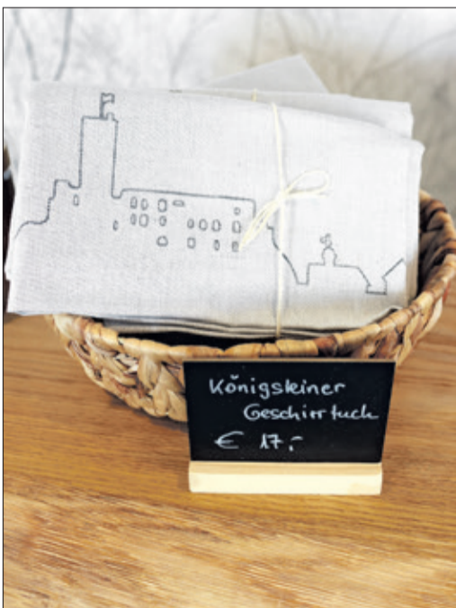
Das Königsteiner Geschirrtuch

Das Tuch ist aus Halbleinen gefertigt und hat die Größe 77 x 55 cm. Mit diesem Geschirrtuch, von der Hessischen Leinen-Industrie Driessen aus Schlitz im Vogelsberg hergestellt, macht nicht nur die Arbeit zu Hause, sondern auch das Verschenken oder Dekorieren viel Freude. In der Silhouette sind die beiden Burgruinen, der Hardtbergturm und weitere historische Gebäude aus Königstein und seinen Stadtteilen eingewebt. Stückpreis 17 Euro.