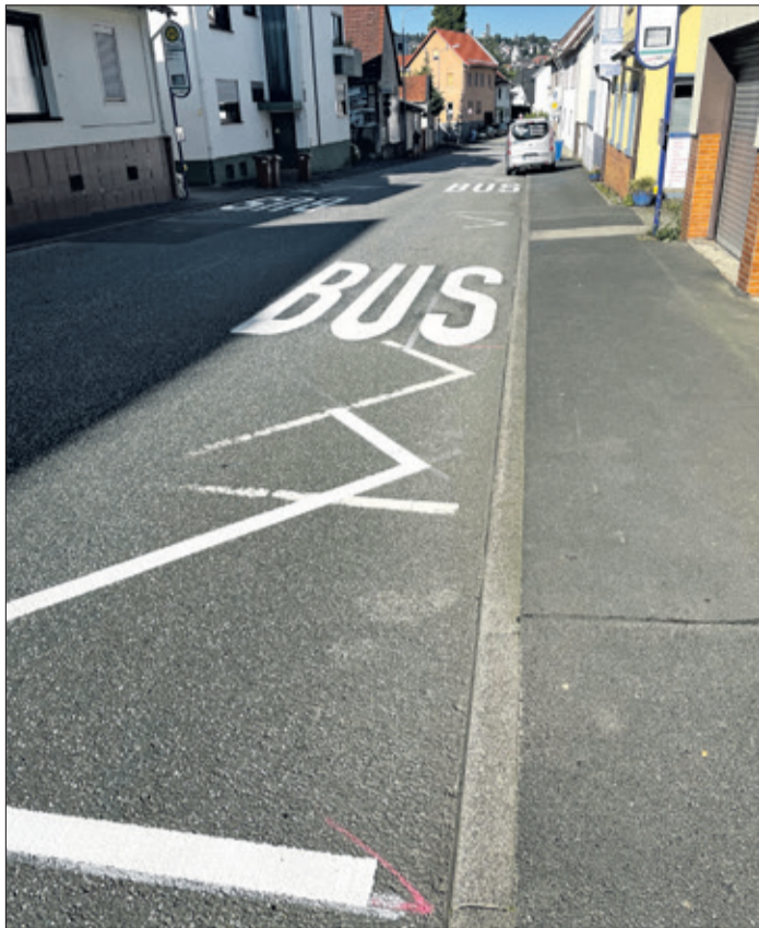
Die gewachsene Busspur auf der Wiesbadener Straße erhitzt die Gemüter. Das Parken auf dem Bürgersteig soll aber bald Vergangenheit sein.

Schneidhain (as) – In Schneidhain beschäftigen seit Ende der vergangenen Woche neue Markierungen der Bushaltestelle „Fliederbusch“ und der angrenzenden Parkplätze auf der Wiesbadener Straße die Anwohner und den Ortsbeirat. Der Ärger ist bei einigen Betroffenen groß (s. Leserbrief auf dieser Seite). Fakt ist, dass der markierte Bereich für den Halteplatz der Linienbusse in beide Fahrtrichtungen deutlich länger geworden ist und dadurch vorhandene Parkplätze entfallen sind. Zudem sind diese immer noch so angelegt, dass die Fahrzeuge bergab in Richtung Stadtmitte Königstein mit den rechten Rädern weiterhin auf dem nicht allzu breiten Bürgersteig parken.