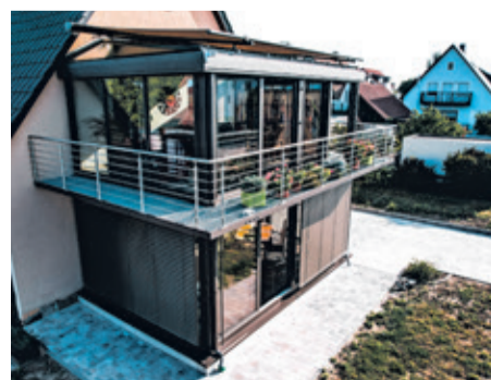
Lust auf einen Wintergarten? Mit dem Sunparadise Balkonverglasungssystem kann jeder Balkon auch nachträglich in einen geschützten Bonusraum verwandelt werden.

Die Elemente öffnen sich bequem nach innen, beide Seiten der Glasflächen sind leicht zugänglich und können einfach und sicher gereinigt werden. Eine Innenverriegelung verhindert ein unbefugtes Eindringen und schafft gleichzeitig einen ruhigen und individuellen Balkonraum, auf dem Kinder unbeaufsichtigt spielen und ältere oder gebrechliche Menschen mal eben einen Schritt ins Freie machen können. Mehr unter www.sunparadise.com