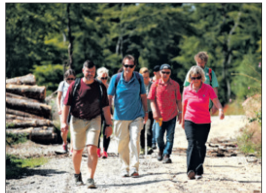
Wandern im Heilklima

Ebenfalls am 7. August lädt der ADFC Königstein gemeinsam zu einer Feierabend-Radtour rund um die Burgenstadt ein. Für etwa zwei Stunden werden Feld- und Waldwege, ruhige Seitenstraßen sowie sanfte Taunushügel und beschauliche Täler befahren. Die Teilnahme ist kostenlos, E-Biker und klassisch Radelnde sind gleichermaßen willkommen. Weitere Infos gibt: didier.hufner@adfc-hochtaunus.de. Treffpunkt ist um 18.30 Uhr die Kur- und Stadtinformation, Hauptstraße 13 a.