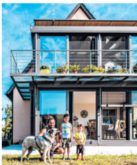
Mit dem Sunparadise Balkonverglasungssystem lässt sich jeder Balkon auch nachträglich zu einem geschützten Wintergarten umrüsten.

(epr) Glücklicherweise darf sich jeder, zu dessen Wohnung ein Balkon zählt. Die Aufenthaltzeiten unter freiem Himmel sind jedoch leider stark vom Wetter abhängig: Kälte, Hitze, Wind und Regen verhindern