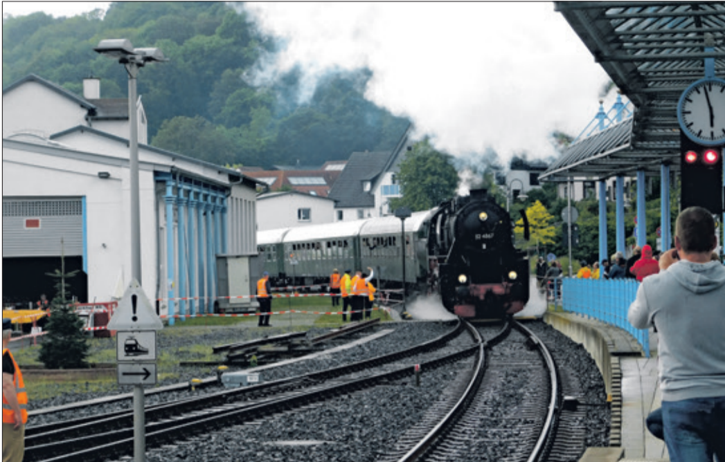
Augen- und Ohrenschaus nicht nur für Liebhaber: Die historische Dampflok 52 4867 fährt in den Königsteiner Bahnhof ein.

Königstein (nd) – Wasserdampf, der Geruch von brennender Kohle und das typische Geräusch einer Dampflok – beim 42. Bahnhofsfest am Pfingstsonntag und Pfingstmontag kamen auch in diesem Jahr die Fans und Liebhaber von historischen Eisenbahnen voll auf ihre Kosten. Von Groß bis Klein, von Alt bis Jung – bei der durchaus imposanten Einfahrt der Dampflok 52 4867 wurden nicht nur die Augen der Kinder immer größer. Diese Dampflok wie auch die Großdiesellok der Baureihe 218 MZE, die an diesem Tag ebenfalls fuhr, wird traditionell vom Verein Historische Eisenbahn Frankfurt e.V. bereitgestellt. Der Verein ermöglicht damit einen Einblick