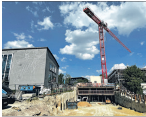
Die Einfahrt in die Tiefgarage von der Bischof-Kindermann-Straße erfolgt in Ebene U2.