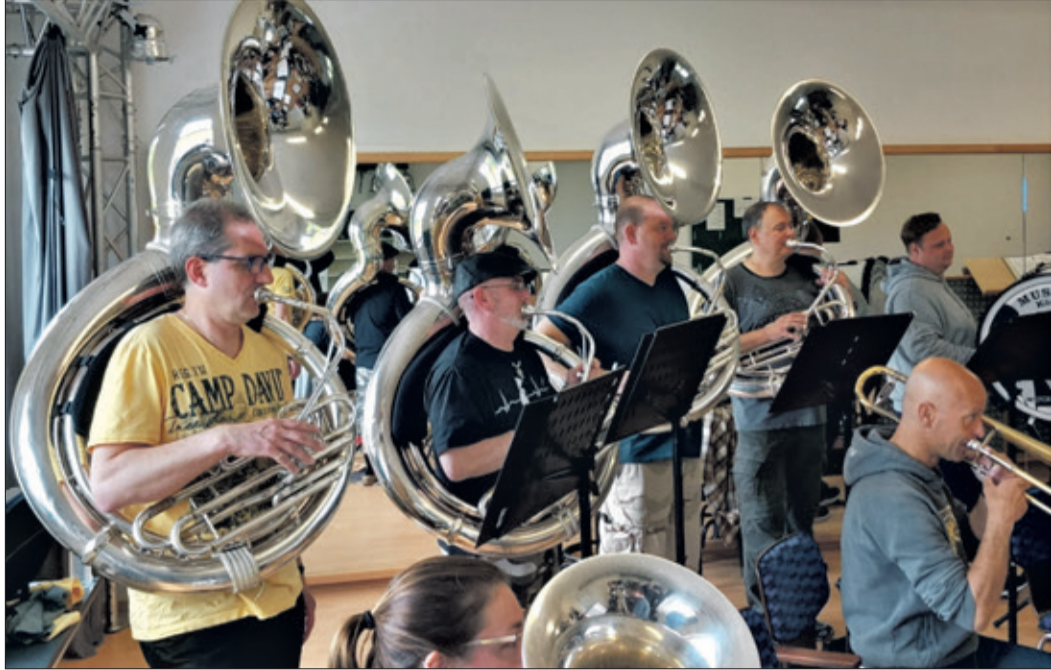
Riesige Instrumente, toller Sound: die Musik- und Showband bei der Probe

Schneidhain (kw) – Die Proben sind vielversprechend verlaufen – das große Konzert kann kommen. Wenn am Samstagnachmittag ab 16 Uhr das Fanfarencorps Königstein mit seinen eindrucksvollen Blasinstrumenten Einzug hält in die Heinrich-Dorn-Halle in Schneidhain, dann erleben die Zuhörer bei freiem Eintritt einen Querschnitt der musikalischen Bandbreite der bald 60-jährigen Vereinsgeschichte.