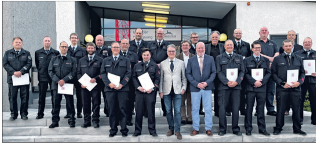
Die beförderten und geehrten Mitglieder der Freiwilligen Feuerwehren Königstein mit den beiden Stadtbrandinspektoren (hinten links) und den Stadtvertretern (in zivil).