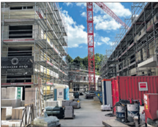
Der zentrale Innenhof. Hinten in Richtung Sodener Straße zieht im EG die Kita ein.

Bereits ca. 70 Prozent der Gewerbefläche von rund 3.000 Quadratmetern sind vermietet. Diese verteilen sich auf die beiden Seiten des Quartiers, während dazwischen die Wohngebäude und die begrünten Innenhöfe angesiedelt sein werden. Links von der Bischof-Kindermann-Straße aus gesehen und gegenüber des Hauses der Begegnung werden der Alnatura-Markt und ein Apothekenlabor seine Heimat finden, rechts eine Kita und eine Zahnarztpraxis. In diesem Bereich ist auch eine Anbindung für Fußgänger über eine Brücke zur Sodener Straße geplant. Freie Vermietungsflächen von 90 über 240 bis 700 Quadratmeter sind nach Angaben des Planungs- und Architekturbüros Horn noch verfügbar. Die Vermarktung der 75 Wohnungen, die ausschließlich vermietet werden und von denen auch ein Teil gefördert wird, übernimmt Quantum. „Wir freuen uns, damit einen Teil zur Stadtentwicklung in Königstein beitragen zu können“, so Geschäftsführer Arndt Buchwald. Die Größen der Wohnungen reichen von 70 bis 130 Quadratmeter. Von den grünen Höfen mit hoher Aufenthaltsqualität werden alle profitieren, die beste Aussicht ins Grüne, auf Burg, Feldberg und Altkönig gibt es freilich exklusiv von den Penthouse-Wohnungen.