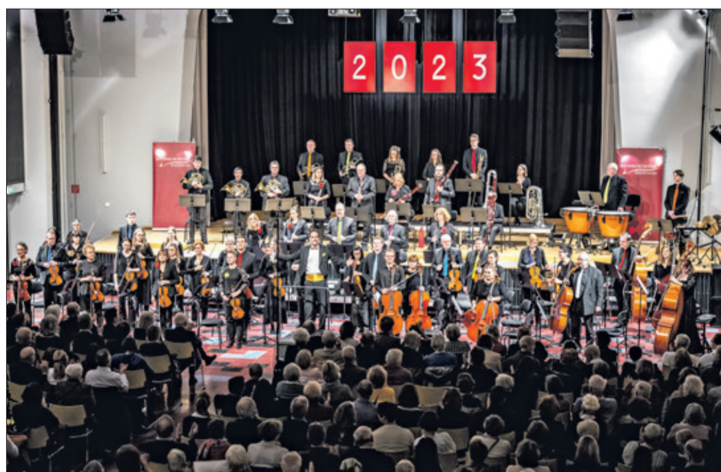
Das Sinfonieorchester Rhein-Main beim Neujahrskonzert 2023 im HdB

Karten zu 25 Euro (ermäßigt 20 Euro) gibt es in der Kur- und Stadtinformation und der Millennium Buchhandlung in Königstein so-