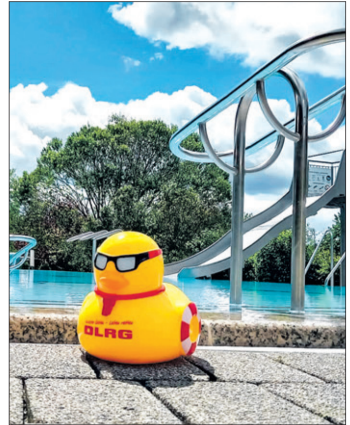
Die Bade-Ente im Freibad wartet auf Futter.