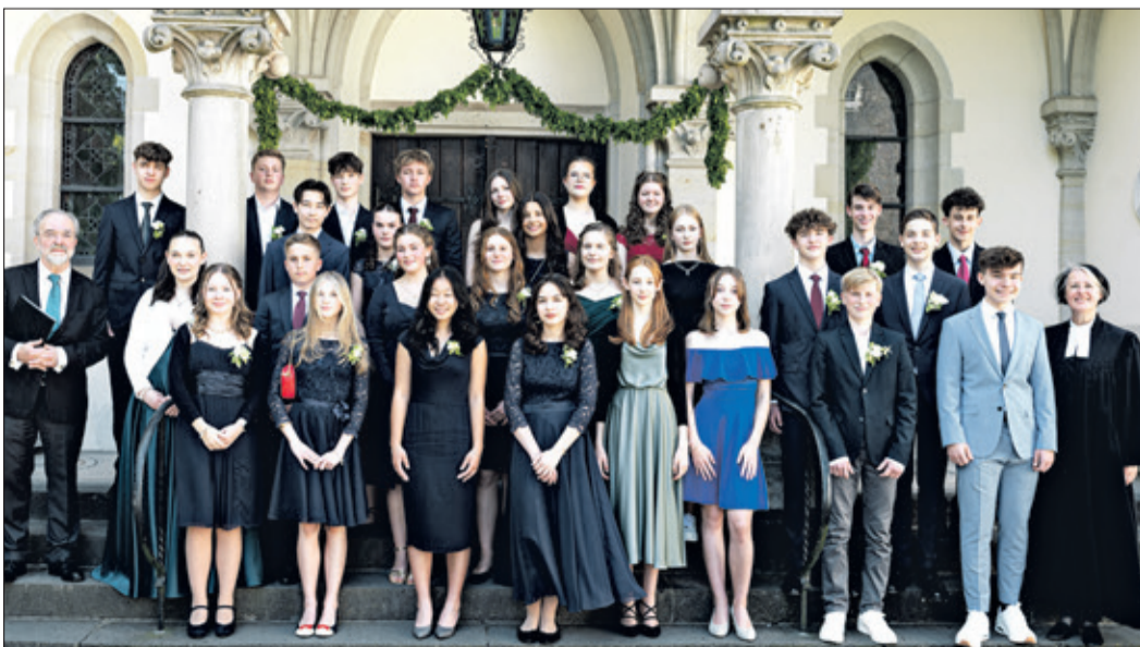
Die Königsteiner Konfirmandinnen und Konfirmanden des Jahrgangs 2024