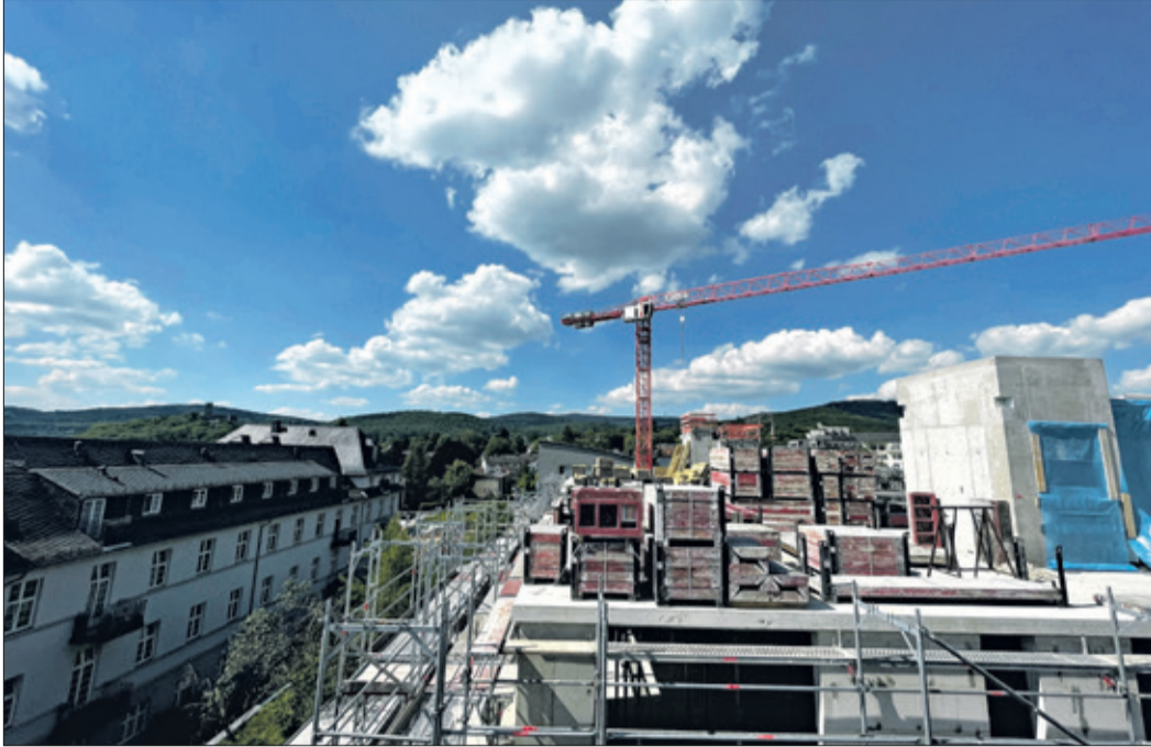
Der Traumblick von den Penthouse-Wohnungen reicht über die Burg zum Taunuskamm. Die Königsteiner Höfe erhalten die neue Adresse Ernst-Ludwig-Kirchner-Platz.

Königstein (as) – Die beiden größten Bauprojekte Königsteins befinden sich in Sichtweite auf beiden Seiten der Sodener Straße. Oberhalb der Kindergarten am Hardtberg, unterhalb die Königsteiner Höfe. Das neue Wohn- und Gewerbequartier zwischen der Bischof-Neumann-Schule und dem Haus der Begegnung wächst und man bekommt schon bei der Vorbeifahrt einen Eindruck, wie die Struktur des Mischgebiets einmal aussehen wird, denn der Rohbau ist weitgehend fertig, die sieben Gebäude haben ihre Endhöhe erreicht. Beim Richtfest gab es jetzt einen vertieften Einblick in das Projekt, mit etwas Vorstellungskraft konnte man sich zwischen den Gebäuden auch schon die Grünflächen und Sitznischen ausmalen, die für die selbstverständlich autofreien „Höfe“ einmal charakteristisch werden sollen.