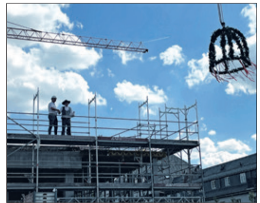
Ein Hoch auf die Standfestigkeit: der Polier grüßt vom Dach, der Richtbaum schwebt ein.