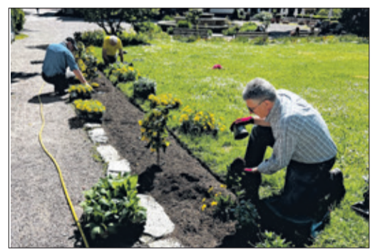
Die FDP-Mitglieder bei der Pflanzaktion ...