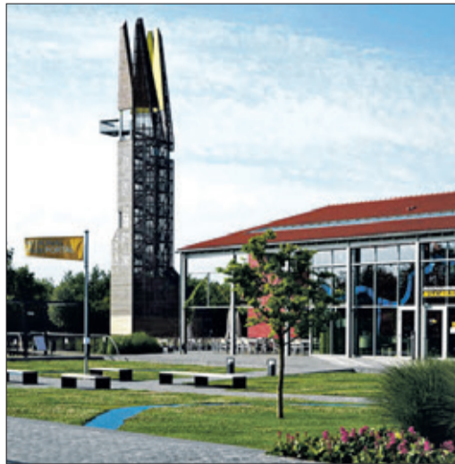
Regionalpark-Portal in Weilbach

Weiter geht es der Erlebnisroute folgend Richtung Westen und an einer Vielzahl von einzigartigen Installationen vorbei zum Ausflugsziel Flörheimer Warte (Lokal) mit grandiosem Ausblick auf die Rhein-Main-Ebene. Danach geht es hinab an den Main, dem die Route gemütlich flussaufwärts radelnd nach Frankfurt-Höchst (50 Tageskilometer) folgt, wo eine Abschlussrast auf dem historischen Schlossplatz geplant ist. Der Rückweg (17 km) erfolgt entlang des Lieberbachs bergauf nach Königstein oder alter-