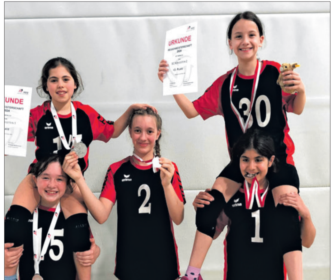
Freude beim U 11-Nachwuchs des SCK über Medaillen und Urkunden