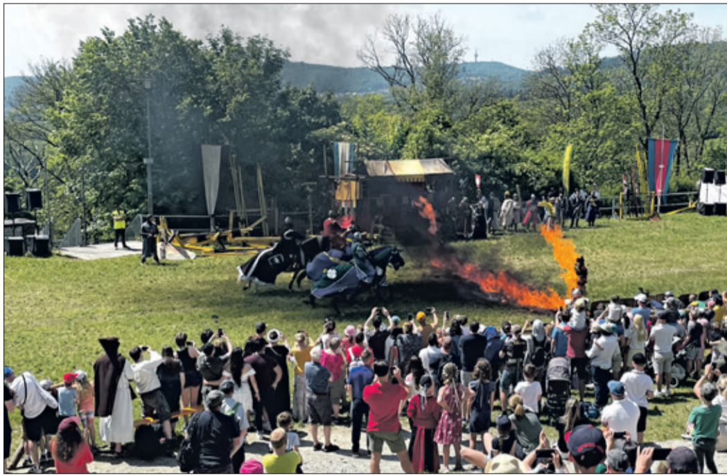
Der Ritt durch die Flammen bildete den Abschluss und optischen Höhepunkt des Ritterturniers.