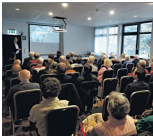
Der kleine Saal im Bürgerhaus Falkenstein war mit mehr als 50 Interessierten, darunter vielen ehemaligen „Rotfabrikern“, gut gefüllt.