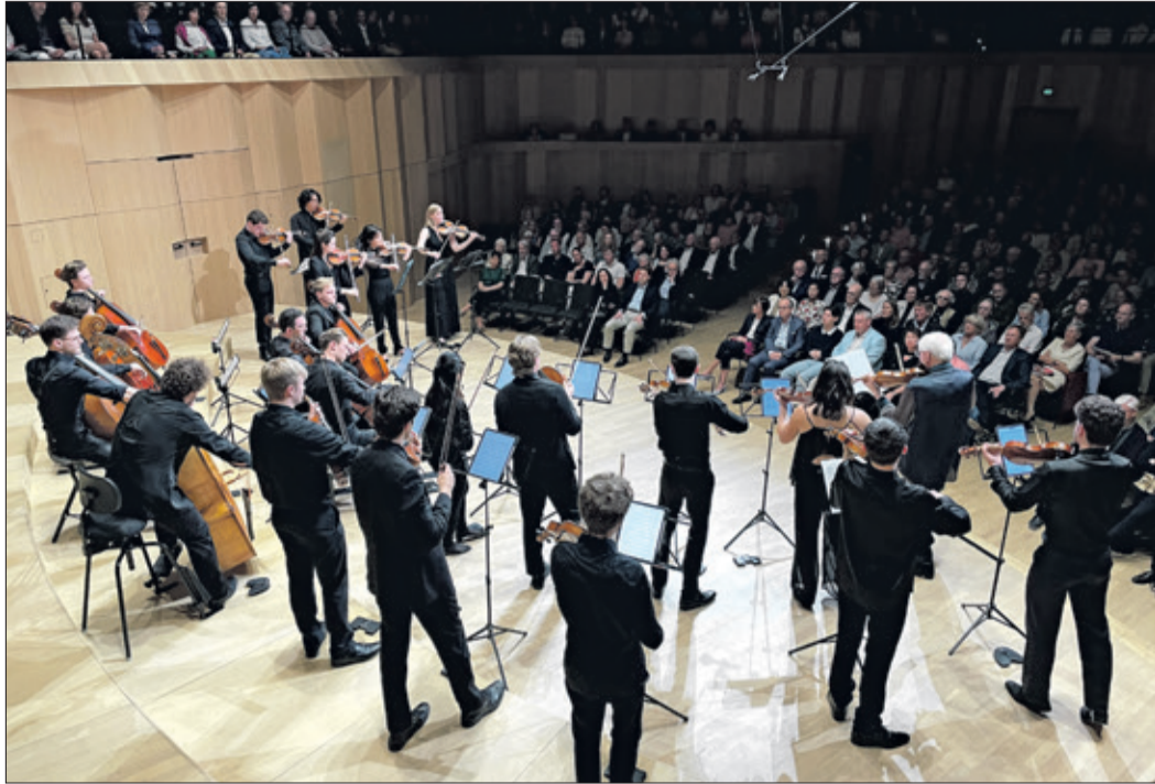
Schönheit und Schmerz von Mahlers 10. Sinfonie, zu Gehör gebracht von 21 Streichern und Senior Gidon Kremer (vorne rechts) beim Kammermusikfest im Casals Forum

Kronberg (as) – Das Konzept des Kammermusikfestes der Kronberg Academy verfängt immer wieder aufs Neue. „Chamber Music Connects The World“ heißt es seit dem Eröffnungskonzert am vergangenen Samstag wieder acht Tage lang im noch immer neuen und beeindruckenden Casals Forum am Victoria-park in Kronberg. Das Konzept besteht darin, dass junge Musikerinnen und Musiker, die Juniors, gemeinsam mit ihren Lehrmeistern an der bedeutenden Akademie für Streichinstrumente, den Seniors, gemeinsam in musikalische Welten eintauchen.