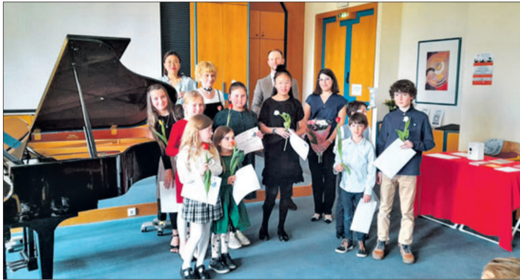
Die Mitwirkenden am Familienkonzert waren mit viel Freude am Werk.