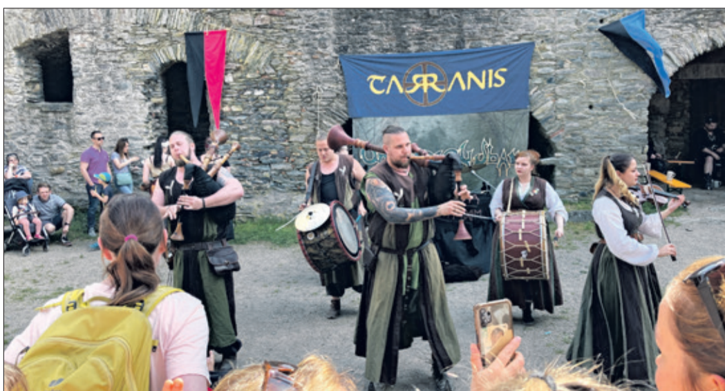
Historische Gewänder und Klangwelten: Die Gruppen Tarranis und hier Unvermeydbar sorgten am Sonntag im oberen Burghof für Atmosphäre und luden zum Mittanzen ein.