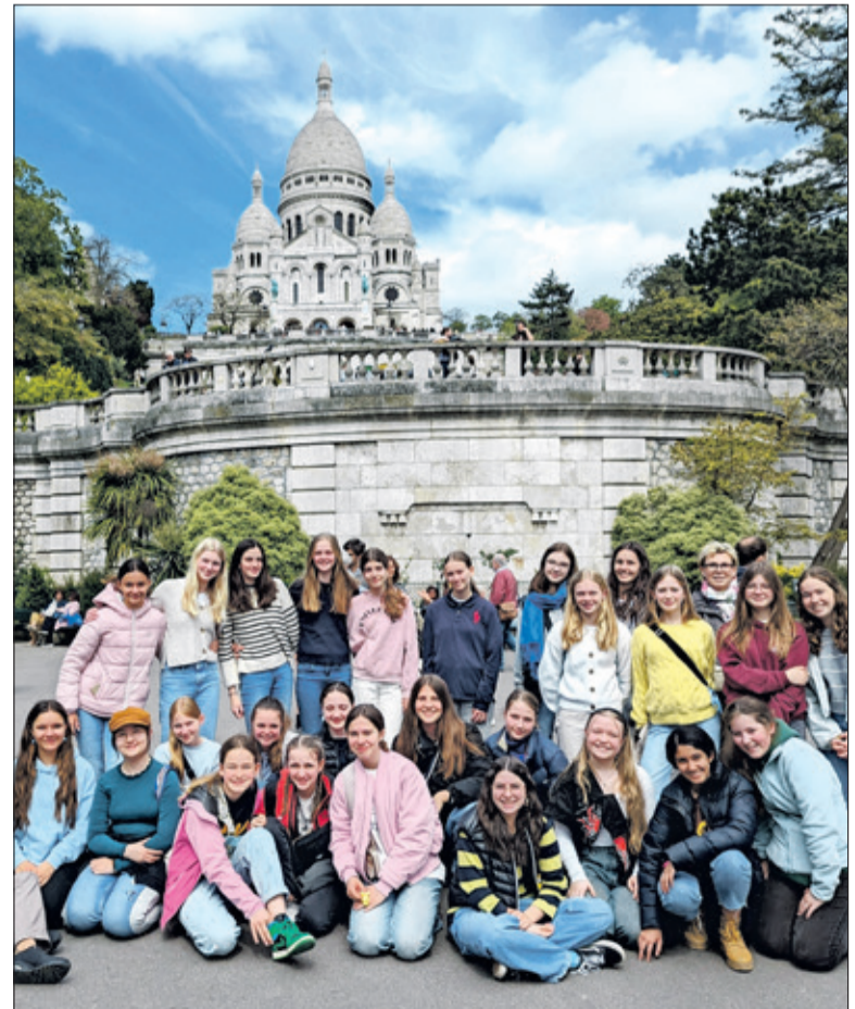
Eines der Paris-Highlights für die SAS-Schölerinnen: Sacré Cœur

Am Tag der Rückreise fiel der Abschied sichtlich schwer. Nach ihren Eindrücken der Woche befragt, nannten die Schölerinnen insbesondere die Gastfreundschaft, das Leben in den französischen Familien und ihre neu gewonnenen Eindrücke des Schullebens sowie die unterschiedlichen Gewohnheiten und Lebensweisen als große Bereicherung. Den Kopf voller neuer Vokabeln und die Taschen gefüllt mit Souvenirs, Macarons, französischem Käse und Baguette kehrte die Gruppe glücklich nach Königstein zurück.