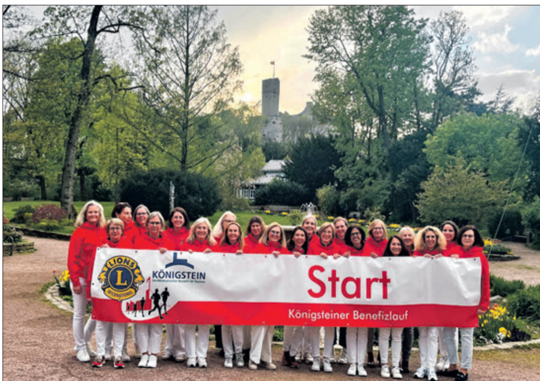
Die Damen des Lions Clubs Königstein Burg sagen danke und freuen sich bereits auf den nächsten Startschuss im Jahr 2025.