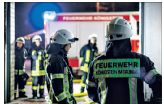
Während des FSJ begleitet man auch Einsätze.

Das Aufgabengebiet ist vielseitig und abwechslungsreich: Die Feuerwehrausrüstung und die Fahrzeuge müssen regelmäßig gepflegt, überprüft und instandgehalten werden. Mitarbeit in der Atemschutzwerkstatt ist gefragt, die Jugendfeuerwehren freuen sich auf Unterstützung und Hilfe bei Planungen der Ferienfreizeiten. Mitarbeit bei der Brandschutzerziehung und Brandschutzauflärung sowie bei der Öffentlichkeitsarbeit gehören ebenfalls dazu. Wenn es während