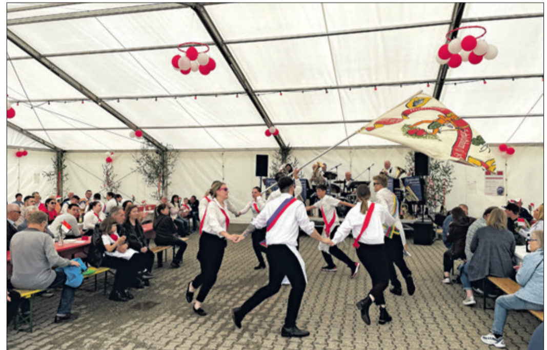
Einzug der Kerbeborsch und Kerbemädeln am Sonntagmittag ins Festzelt.

Und dann spielen die Egerländer auch schon wieder auf und das ganze Festzelt singt: „Wo ist denn der Johann, ist der Johann nicht zu Haus? ...“ Nein, ganz gewiss nicht. Es ist Kerb in Schloßborn!