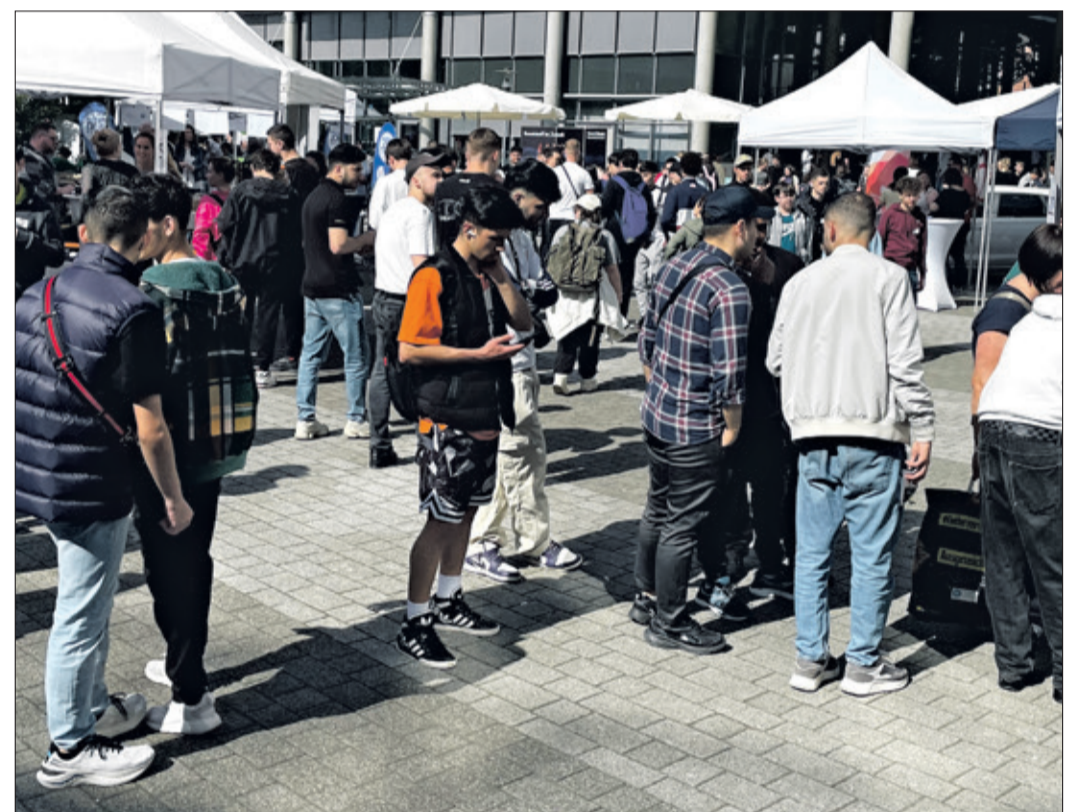
Großer Andrang herrschte im Hof des Landratsamtes beim Tag der Ausbildung, bei dem 90 Ausbildungsberufe vorgestellt wurden.

Hochtaunus (kw) – Der Andrang war riesig. Über 500 Schülerinnen und Schüler aus dem Hochtaunuskreis nutzten die Gelegenheit, sich am Tag der Ausbildung im Hof des Landratsamtes an knapp 50 Ständen über 90 verschiedene Ausbildungsberufe zu informieren. Neben vielen regionalen Firmen aus den Bereichen Handwerk, industrielle Fertigung, Soziales und Gesundheitsberufe, Einzelhandel sowie Verwaltung, die für die Schülerinnen und Schüler konkrete Ausbildungsberufe in petto hatten, stellten sich auch Unternehmen vor, die jungen Leuten, die noch nicht genau wissen, welcher Job zu ihnen passt, Unterstützung anbieten.