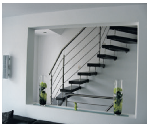
Der Wanddurchbruch setzt die Kenngott-Treppe mit rutschhemmenden Longlife-Stufen und Edelstahlgeländer gekonnt in Szene.

(epr) Zu kostspielig, zu zeitaufwendig, zu schmutzintensiv: Eine Treppenrenovierung wird meist erst dann in Angriff genommen,