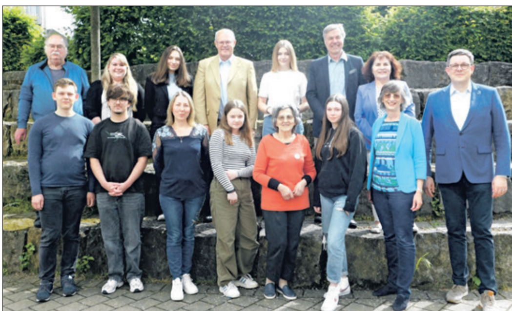
Die Schüler und Schülerinnen des Sprachkurses mit Sponsoren, Lehrkräften und Organisatoren.

Kelkheim (nd) - Am vergangenen Samstag kam die Sprachförderung für geflüchtete ukrainische Schülerinnen, Schüler und Studierende am Privatgymnasium Dr. Richter zu einem erfolgreichen Abschluss. Bei Kaffee und Kuchen nahmen alle Beteiligten voneinander Abschied und die Kursteilnehmer berichteten von ihren Plänen für die Zukunft.