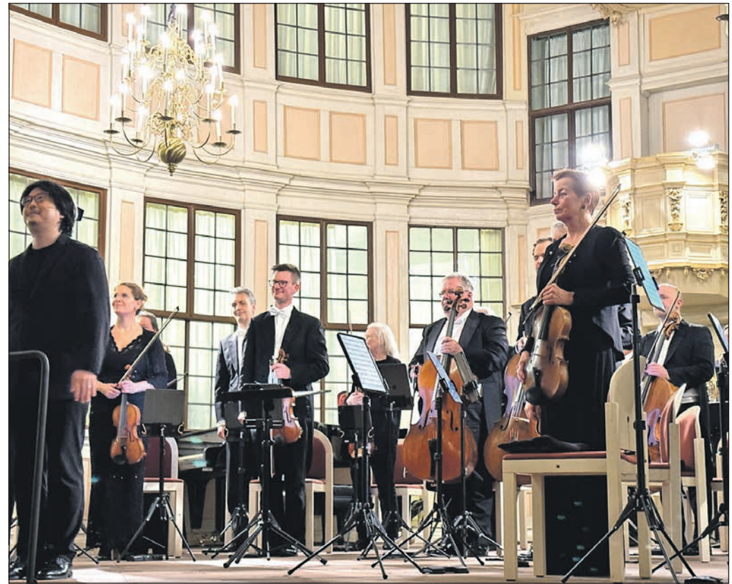
Die Wände in zartes Rosé getaucht, die tief hängenden Leuchter unterstreichen zusätzlich durch ein wundervoll klares Licht, einen beeindruckend schönen Abend mit der Musik des Württembergischen Kammerorchesters unter der Leitung von Kyohei Sorita (l.).