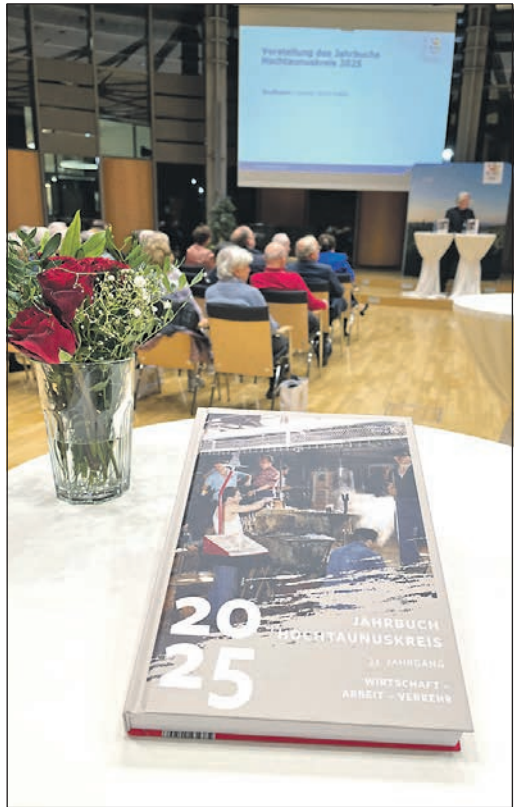
Eine spannende Lektüre bietet das Jahrbuch Hochtaunuskreis 2024.

Hochtaunus (how). Wie immer erscheint zum Jahresende der neue Band des „Jahrbuchs Hochtaunuskreis“. Der aktuelle, 33. Band der Reihe widmet sich dem Themenschwerpunkt „Wirtschaft – Arbeit – Verkehr“. Die Beiträge beleuchten unterschiedliche Facetten von Industrie und Wirtschaft, Arbeit und Beruf sowie Verkehr und Infrastruktur in Geschichte und Gegenwart des Taunus. Es geht um ländliches Handwerk, um die Industrialisierung im 19. und neue Impulse im 20. Jahrhundert, um Straßen- und Eisenbahnbau, um Design und zukunftsweisende Mobilitätskonzepte. Das Jahrbuch enthält insgesamt 24 Aufsätze zum Schwerpunktthema. Barbara Dölemeyer