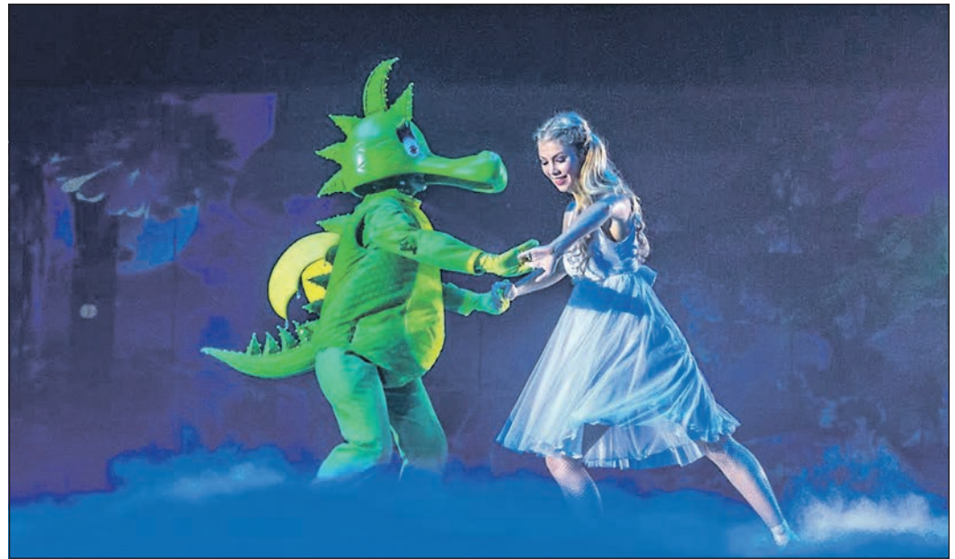
Der kleine Drache Tabaluga hat sich in das Mädchen Lilli verliebt. Alles könnte so schön sein, wenn der böse Arktos nicht seine Finger im Spiel hätte.

„Wir würden uns freuen, wenn möglichst viele Bürgerinnen und Bürger unseren gut ausgebauten öffentlichen Nahverkehr nutzen. Deshalb setzen wir mit diesem Angebot einen zusätzlichen Anreiz“, so Mobilitätsdezernent Dr. Oliver Jedynak.