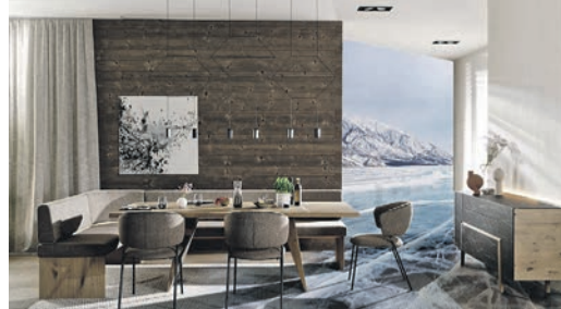
Einrichtung aus einem Guss: Sideboard, Esstisch, Bank und Stühle sind harmonisch aufeinander abgestimmt.

zeln der Möbelbauer und holt die Stimmung der Alpen ins Haus. Verwendet werden nur ausgewählte Hölzer aus nachhaltiger Forstwirtschaft, die nach traditionell-handwerklichen Methoden verarbeitet werden – für ein Leben und Wohnen im Einklang mit der Natur. Im Fachhandel vor Ort oder unter www.voglauer.com gibt es weitere Einblicke in die Vektura-Kollektion mit Wohnwänden, einem markanten Baumkantentisch, Sideboards, Vitrinen und mehr.