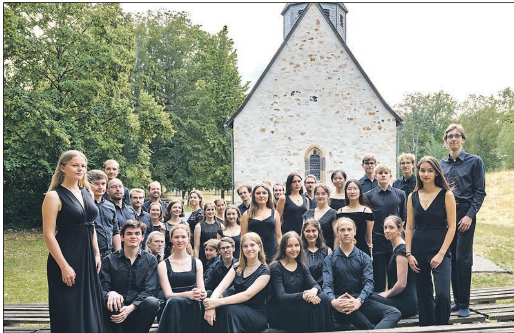
Der Jugendchor Hochtaunus lädt für den ersten Advent zum Benefizkonzert in die St.-Marien-Kirche ein.