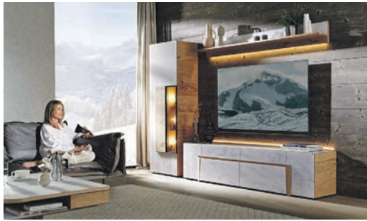
Hochwertige Massivholzmöbel fördern ein gesundes Raumklima und bringen eine natürliche Atmosphäre in jeden Raum.