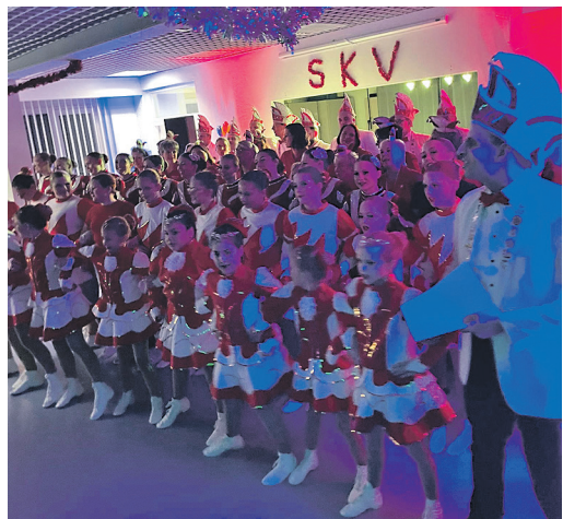
Die Garden der „Tanus Eulen“ sind bereit, in der eröffneten Faschings-Kampagne 2024/2025 alles zu geben.

! Mit dem gelungenen Start in die fünfte Jahreszeit ist nun auch der Ticketverkauf für die Fremdensitzung am Samstag, 1. Februar 2025, eröffnet. Reservierungen sind per E-Mail an vorverkauf@tanuseulen.de möglich, die Zahlung erfolgt per PayPal über dieselbe Adresse. Karten, die bis zum 23. Dezember nicht bezahlt wurden, gehen zurück in den Verkauf. Die „Tanus Eulen“ blicken voller Vorfreude auf eine bunte und mitreißende Kampagne.