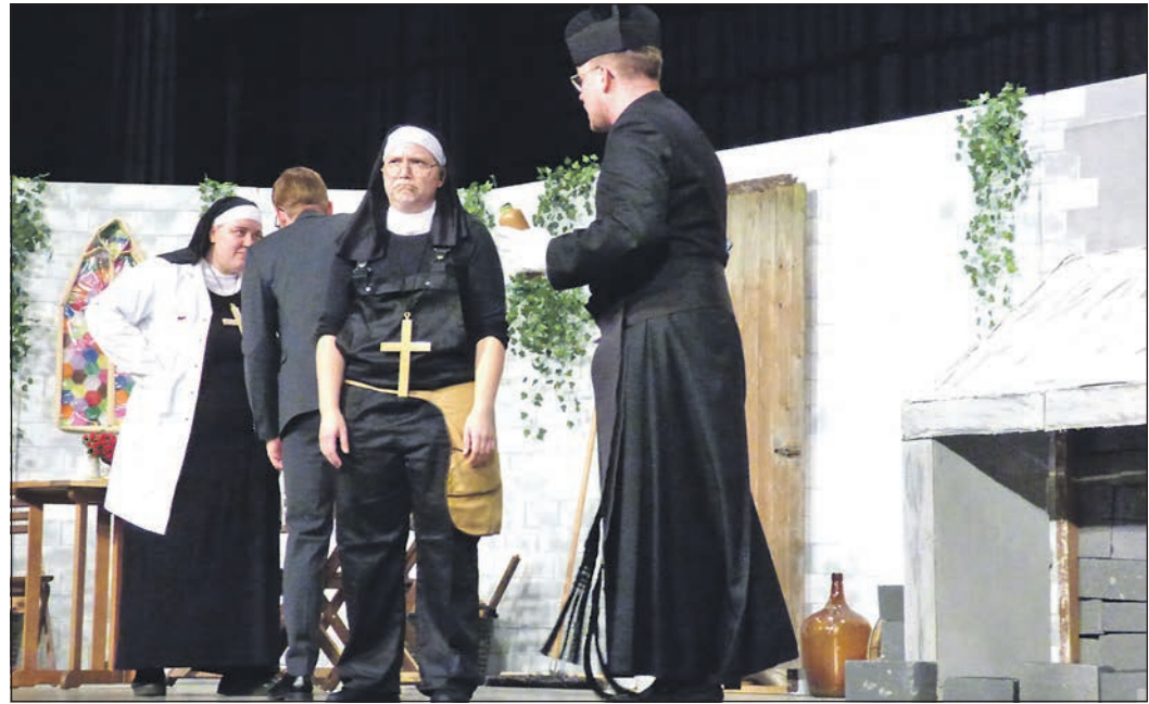
Auch wenn sie einen guten Draht „nach Oben“ haben, die Nonnen dieses Klosters haben's schwer und nehmen's leicht.

Fische Alle Ihnen gebotenen Möglichkeiten sollten Sie besonders gründlich unter die Lupe nehmen. Ein extrem günstiges Angebot könnte ein glatter Betrugsversuch sein. 20.2.–20.3.