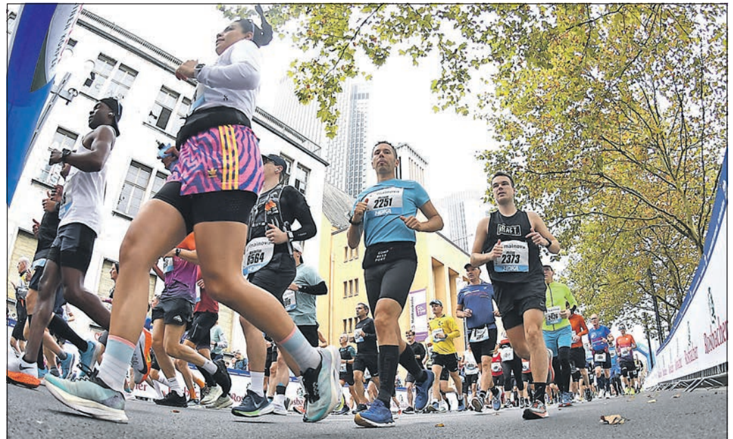
Los geht's: Rund 14 000 Teilnehmer nehmen die klassischen 42,195 Kilometer beim Frankfurt-Marathon in Angriff.