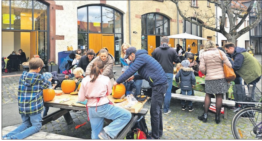
Viele Besucher sind der Einladung zum Kürbisfest im Oberhof gefolgt. Jetzt wird fleißig gesägt, gewerkelt, ausgehöhlt und verziert. Wer hat am Ende den gruseligsten Kürbis?