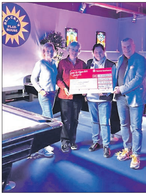
gewinner bei Olympia 1976 Ehrengäste waren – generiert wurden. Der Hessische Automatenverband stellte die Preise zur Verfügung.