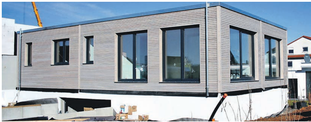
Holzhaus mit Terrasse, am Hang gelegen: Ein Modulhaus kann äußerst flexibel und an die Umgebung angepasst gestaltet werden.

Beim maßgeschneiderten Bauen geht es jedoch nicht nur darum, individuelle Wohnbedürfnisse mit architektonischen Vorlieben in Einklang zu bringen. Moderne Bauweisen und die Nachhaltigkeit spielen eine große Rolle. So sollten Bauherren heutzutage Wert darauf legen, ökologisch wertvolle Baustoffe wie Holz und energieeffiziente Anlagentechnik wie Wärmepumpen und Photovoltaik in ihre Planungen einzubringen, und zwar individuell auf das neue Haus und die Wohnsituation dort abgestimmt.