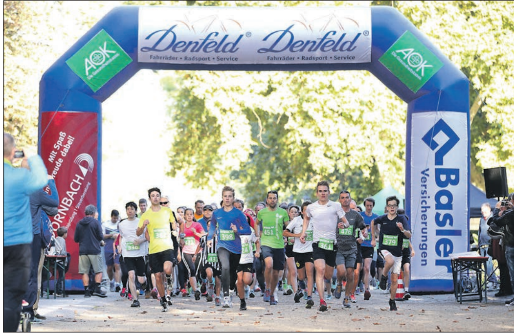
Gemeinsam Sport machen verbindet – und wenn die Kulisse dann auch noch so schön ist wie beim Kurparklauf, lohnt es sich doppelt.