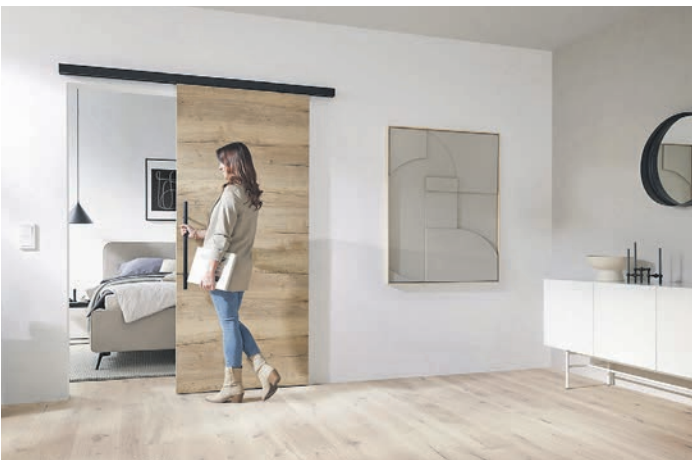
Eleganter Durchgang: Schiebetüren setzen in jedem Raum stilvolle Akzente.

Anzeigen Hotline Tel. 06171/62880 Wir stehen Ihnen mit Rat & Tat zur Seite.