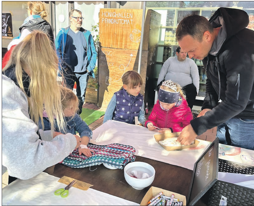
Schöne bunte Bildchen – hier fertigen Kinder coole Tattoos an.