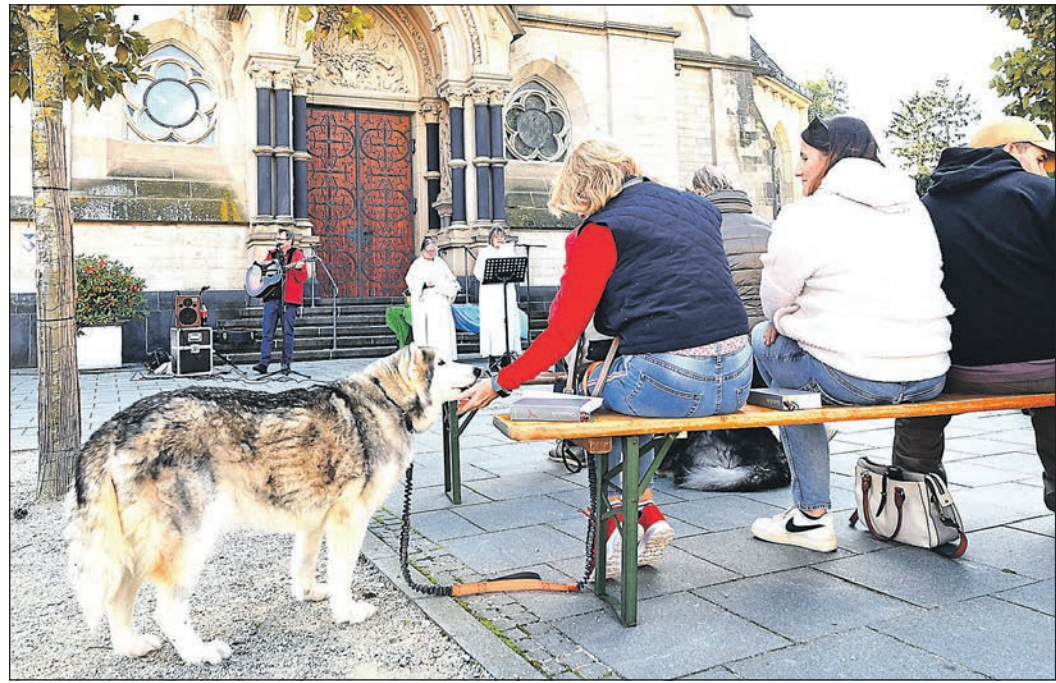
Auch dieser Husky wartet mit seinem Frauchen geduldig darauf nach dem Tiergottesdienst den Segen zu empfangen.