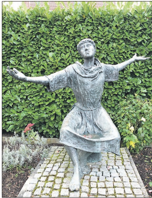
An den Schutzpatron der Gemeinde, Franz von Assisi, erinnert die Bronzeskulptur vor der Kirche.

Außerdem ist bis zum Zusammenschluss, welcher erst 2026 erfolgen soll, etwas Zeit. Doch selbst wenn es am Ende tatsächlich zu den Änderungen kommen sollte, fassen die Ausschüsse die zukünftige Lage der Heilig-Kreuz-Gemeinde Burgholzhausen wie folgt zusammen: „Wir kommen ziemlich unverseht davon.“