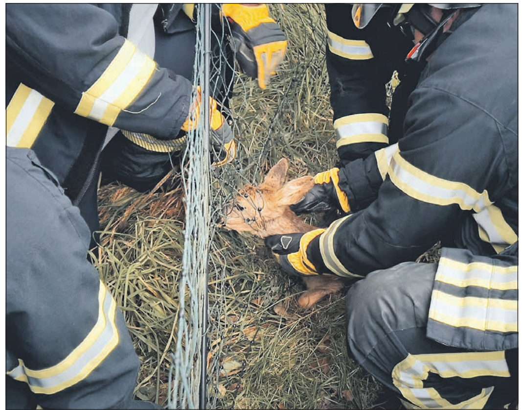
Vorsichtig befreien die Seulberger Feuerwehrmänner das erschöpfte Rehkitz aus dem Drahtzaun, in den es sich verheddert hat und nicht mehr hinauskommt.

Der Einsatz für die Feuerwehr Seulberg war nach rund 20 Minuten beendet. Zwei Fahrzeuge und acht Einsatzkräfte waren im Einsatz. Jetzt bleibt zu hoffen, dass das Rehkitz wirklich unverseht seine Mutter wiederfinden konnte, oder umgekehrt und dass beide nach der wunderbaren Rettung wieder fröhlich vereint durch Wald und Dickicht springen. Nur von Zäunen sollten sie sich besser fernhalten. Den aufmerksamen und geistesgegenwärtigen Spaziergängern und der tatkräftigen, hilfsbereiten Seulberger Wehr gebührt großer Dank. Nicht nur aus Wald und Flur.