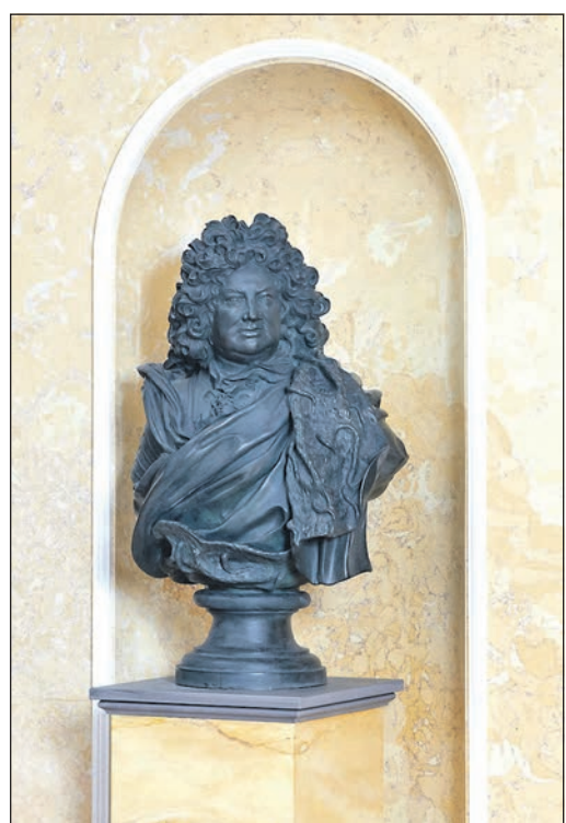
Überall im Schloss hat Friedrich II. Spuren hinterlassen. Die Büste ist in der Landgrafen-ausstellung „244ff. Von Friedrich bis Ferdinand“ zu bewundern.

Alle Informationen zu der Veranstaltung sowie zu dem gesamten Begleitprogramm finden Interessierte in der gemeinsamen Broschüre der SG und der Oper Frankfurt sowie im Internet unter www.schloesser-hessen.de oder auf www.oper-frankfurt.de . Tickets für die Veranstaltungen können online erworben werden.