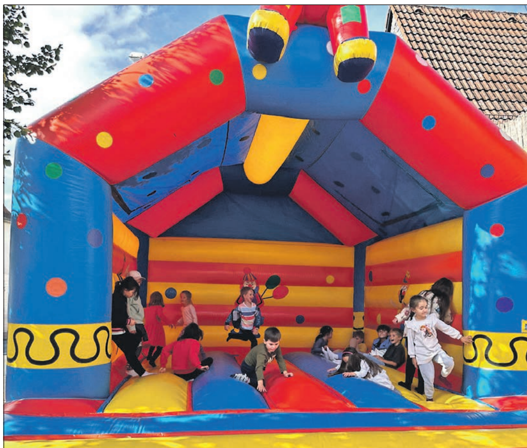
Die Hüpfburg gehört zu den Anziehungspunkten für Kinder auf der Geburtstagsparty zum fünfjährigen Bestehen der Honighalle in Köppern.