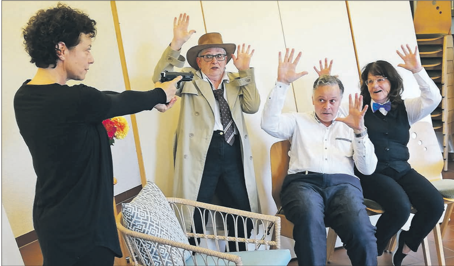
Beim Theaterensemble „Szenenwechsel“ aus Oberursel, das am 17. November zum ersten Mal in Garniers Keller auftritt, kann es schon einmal passieren, dass einige Protagonisten der Minikrimis, die unter dem Motto „Das Böse, nein, es ruht und rastet nicht“ stehen, in die Mündung einer Pistole schauen müssen.