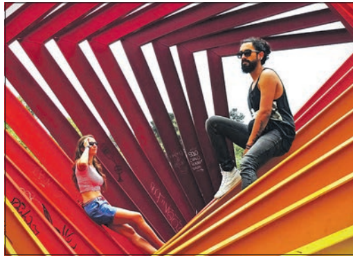
„SolyMar“ präsentieren Klänge aus ihrer Heimat Mexiko.