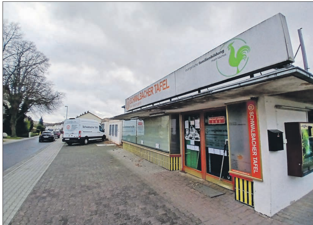
Dunkle Wolken über dem Laden der Schwalbacher Tafel in der Spechtstraße in Schwalbach. Die Vermieterin hat der gemeinnützigen Organisation, die Bedürftige aus Schwalbach, Eschborn, Bad Soden und Sulzbach versorgt, den Mietvertrag gekündigt.

Warum der Schwalbacher Tafel der Laden in der Spechtstraße gekündigt wurde, ist zurzeit noch offen. „Zum Kündigungsgrund können wir tatsächlich nichts sagen, da er uns nicht mitgeteilt wurde“, sagt Nora Hechler, die Pressesprecherin der Evangelischen Familienbildung auf Anfrage der Schwalbacher Zeitung. Der aktuelle Tafelladen gehört einer alteingesessenen Schwalbacher Familie. Die langjährigen Eigentümer haben das Areal, zu dem auch der benachbarte Parkplatz für Wohnmobile gehört, an ihre Tochter überschrieben und kennen nach eigenen Angaben den Grund für die Kündigung auch nicht. Von der Tochter lag bis Redaktionsschluss noch keine Stellungnahme vor, was aus dem Grundstück an der Ecke von Specht- und Adlerstraße werden soll.