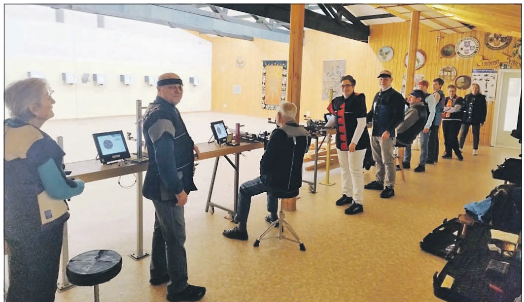
Unentschieden hieß es am Ende des Wettkampfes gegen Marxheim auf der Kronberger Schießanlage, die die Eschborner Schützen zurzeit nutzen.