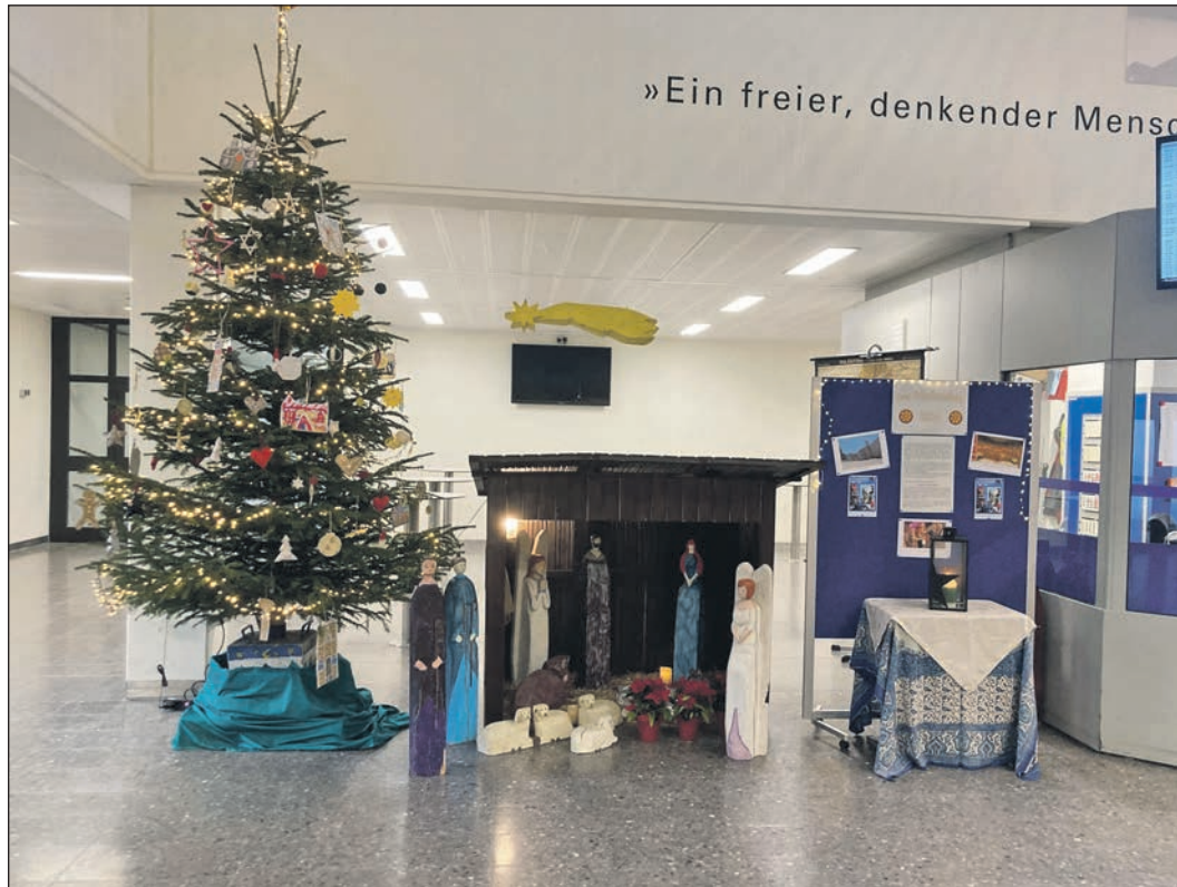
Im Atrium stehen wieder ein großer Weihnachtsbaum und die Schulkrippe.