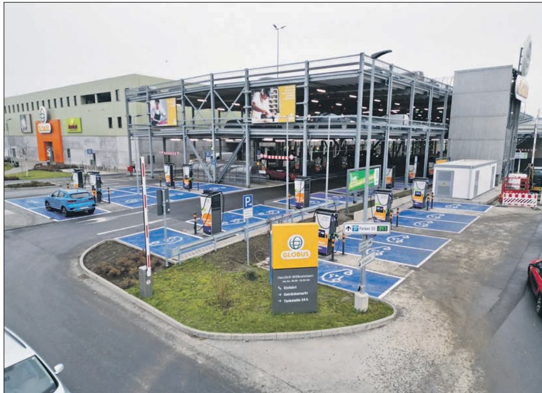
Seit Dienstag können Besitzer von Elektro-Autos schnell und bequem an 52 Ladesäulen vor dem Globus-Parkhaus in der Ginnheimer Straße Strom „tanken“