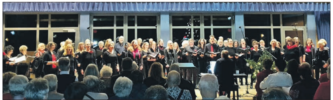
Chorwerke aus aller Welt waren beim Benefizkonzert zu hören.

als Symbol der Hoffnung, des Wandels und des Neubeginns näherzubringen. Dem entsprachen die mit Bedacht ausgewählten Chorwerke aus aller Welt. Die Musik und die Moderationstexte der Sängerinnen und Sänger führten thematisch aus der Dunkelheit ins Licht, auf dem Weg von Trauer und Schmerz hin zu Trost, Liebe und schließlich zur Freude. Diese hoffnungsvolle Weihnachtsbotschaft begleitete das Publikum nach gut zwei Stunden auf den Heimweg. Dank der Großzügigkeit der Gäste ergab das Konzert einen Reinerlös von über 1.200 Euro zugunsten der Schwalbacher Tafel. Der Gemischte Chor Eschborn dankt dafür allen Spenderinnen und Spendern.