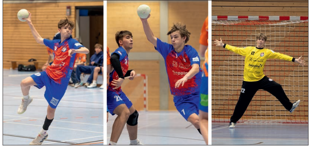
Die mB1-Jugend der HSG Schwalbach/Niederhöhnstadt setzte sich am Wochenende gegen den Nachwuchs aus Breckenheim, Wallau und Massenheim durch.