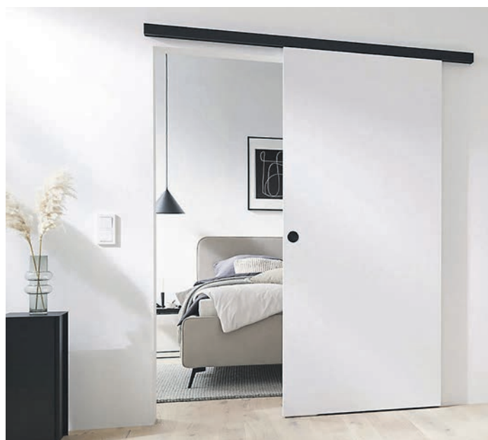
Eleganter Durchgang: Schiebetüren setzen in jedem Raum stilvolle Akzente.

(DJD). Schiebetüren sind heimliche Stars in der Inneneinrichtung: Sie ermöglichen platzsparende Durchgänge, unterstützen Barrierefreiheit und sind auch optisch ein Blickfang in jeder Wohnung. Da die Türflügel beim Öffnen keinen Stellplatz im Raum belegen, sondern lautlos an der Wand entlanggleiten, stellen sie eine smarte Lösung gerade bei begrenztem Platz dar. Die Schiebetüren etwa von Türenheld.de gibt es in zahlreichen Ausführungen, ob in klassischem Weißlack, aus Glas oder in Holzoptik. Gleich doppelt schön sind zweiflügelige Schiebetüren für den großen Auftritt. Unter www.türenheld.de etwa gibt es mehr Details, eine direkte Bestellmöglichkeit und eine nützliche Anleitung zum Einbau von Schiebetüren.