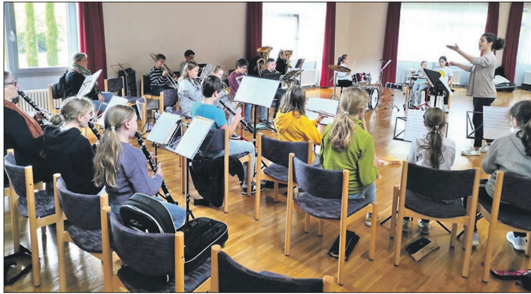
Mit viel Engagement und Begeisterung nehmen 50 engagierte Bläser aller Altersstufen in verschiedenen Ensembles am 5. Bläserntag der Musikschule teil.

Zum Abschluss spielten alle Jean Sibelius' „Finlandia“ – ein würdiger Abschluss für einen gelungenen Tag, der die Freude am Ensemblespiel in den Mittelpunkt stellte und sowohl die Mitwirkenden als auch das Publikum begeisterte.