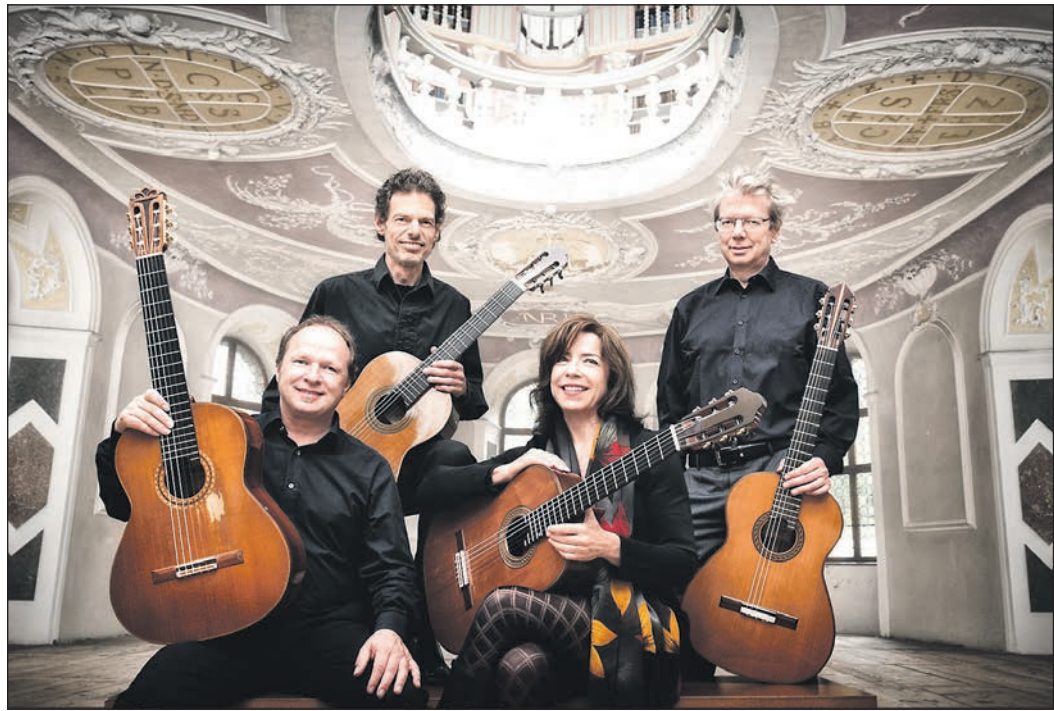
Das „Amadeus Guitar Duo“ und das Gitarrenduo „Gruber & Maklar“ spielen ebenfalls bei der Konzertreihe.