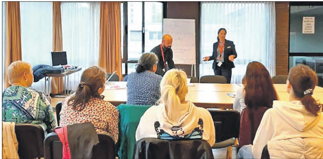
Gut besucht ist die Informationsveranstaltung für arbeitssuchende Frauen mit Migrationshintergrund.