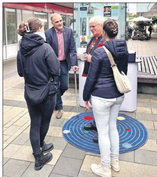
Bürgermeister Alexander Immisch besucht das Team des Ehrenamts-Punktes.

Für Fragen zum Projekt „Ehrenamts-Punkt“ kann gerne Kontakt zum Team aufgenommen werden unter der E-Mail-Adresse ehrenamt@schwalbach.de oder unter Telefon 06196-804192.