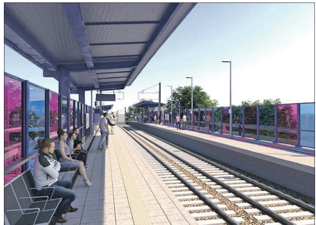
Visualisierung der RTW-Haltestelle Eschborn Süd. Die Stadtverordnetenversammlung beschließt Überdachungen nach DB-Standard und zusätzliche Wetterschutzwände für möglichst hohen Reisekomfort auf dem Brückenbauwerk.

Alle Informationen zum Gesamtprojekt gibt es auf www.eschborn.de/rtw oder www.regionaltangente-west.de .