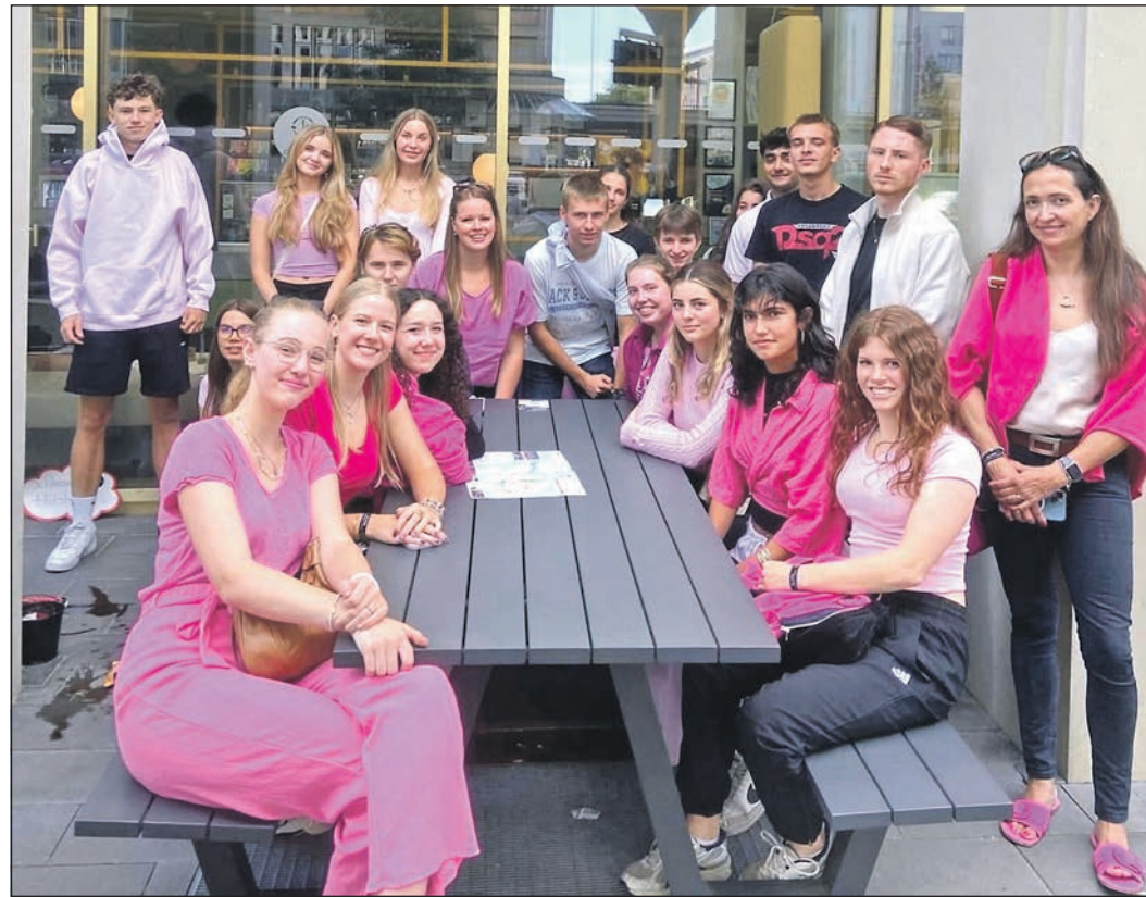
Schüler der Heinrich-von-Kleist-Schule stellen in Bremen beim Schultheater-Festival ihr Stück „Pink! Die Maschine steht still“ vor.