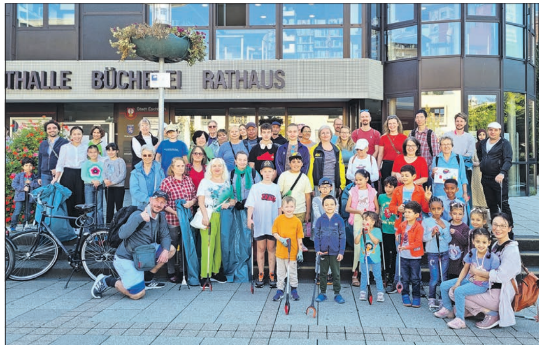
Eine starke Truppe beteiligt sich an der Müllsammelaktion zum „World Cleanup Day“ auch in Eschborn.

Durch die Sammelaktion rund um den Rathausplatz, in der Hanny-Franke-Anlage und in der Nähe vom Globus kamen über 20 gefüllte Müllsäcke zusammen.