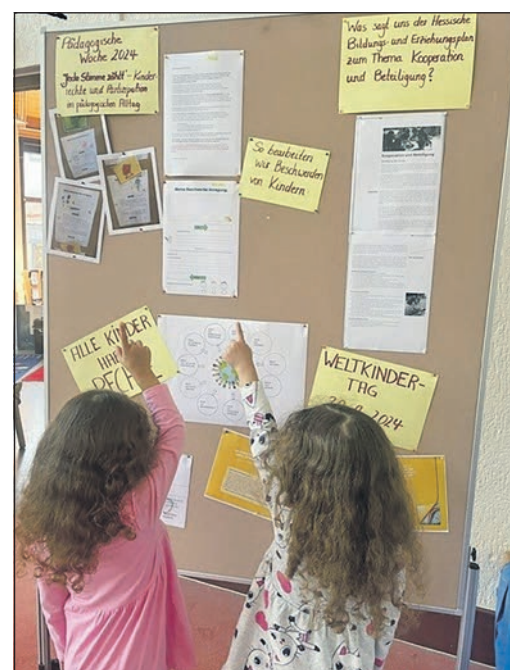
Beim Sommerfest der Kita „Weingärten“ informiert eine Stellwand zum Thema Kinderrechte und Beschwerdeführung von Kindern.

Da die Schulkinder, die die Einrichtung bereits verlassen haben, das Fest mitgeplant haben und die zweite Gruppe von neuen Kindern die Einrichtung ab November besucht, hatte die Kita „Weingärten“ einfach alle in ein „offenes Haus“ eingeladen, um gemeinsam zu feiern. Es war ein tolles Fest!