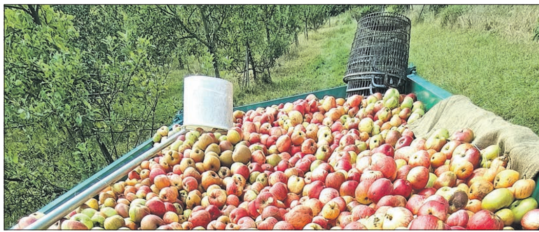
Ein voller Anhänger mit Äpfeln fasst rund drei Tonnen.