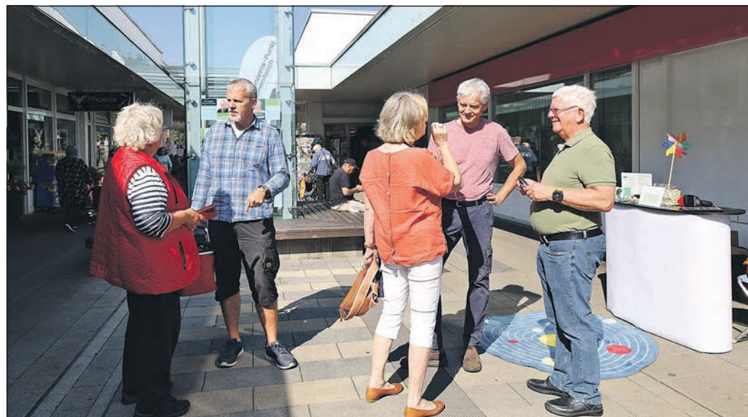
Der neue Arbeitskreis „Smart Energy“ stellt sich mit einem Informationsstand auf dem Wochenmarkt vor und beantwortet Fragen zur Energiewende.

Mit einem „Ehrenamts-Punkt“ beim gut besuchten Freitagsmarkt auf dem Marktplatz können sich Schwalbacher Vereine und Arbeitskreise der Öffentlichkeit vorstellen. Bürgerschaftlich Engagierte, die diese Möglichkeit nutzen möchten, können sich an ehrenamt@schwalbach.de wenden.