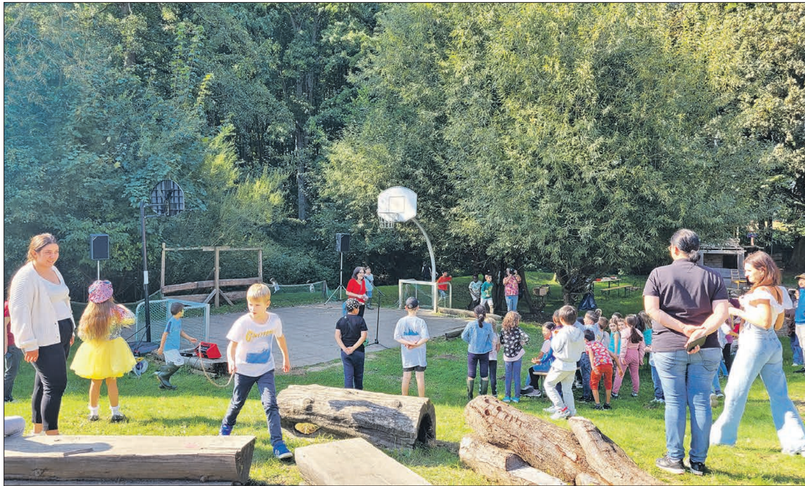
Beim Fest auf dem Abenteuerspielplatz zum Weltkindertag kommen Groß und Klein voll auf ihre Kosten. Ein abwechslungsreiches Programm begeistert die Gäste mit Musik, verschiedenen Darbietungen und vielem mehr.