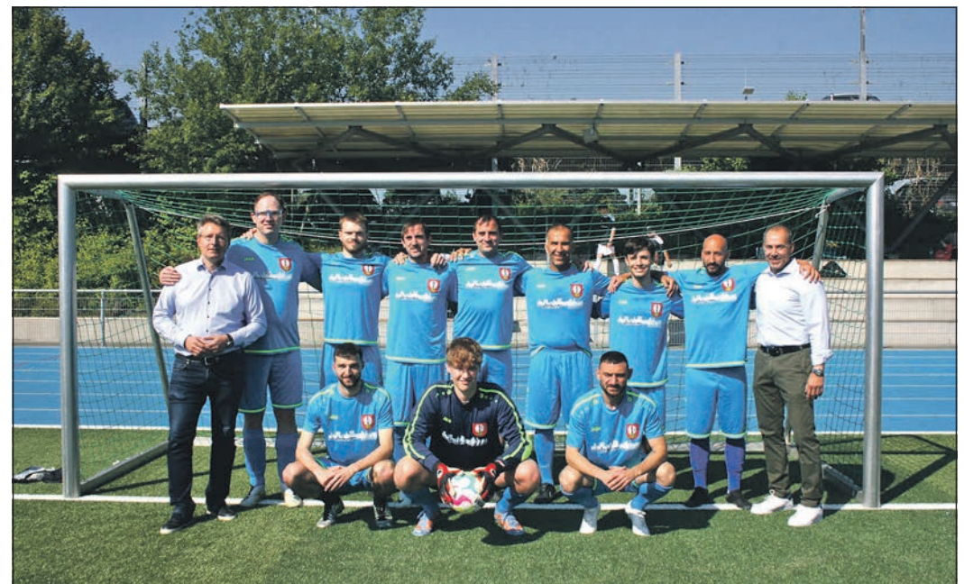
Beim 3. Kleinfeldturnier siegt die Mannschaft des Gastgebers, der Stadt.

Turnierplatzierungen: 1. Stadt Eschborn, 2. BSG Stadt Bad Soden, 3. BSG Sportpresse, 4. BSG Stadt Hattersheim, 5. SGK Bad Homburg 2, 6. BSG Main-Taunus-Kreis, 7. BSG Hochtaunuskreis und 8. BSG Iocto.