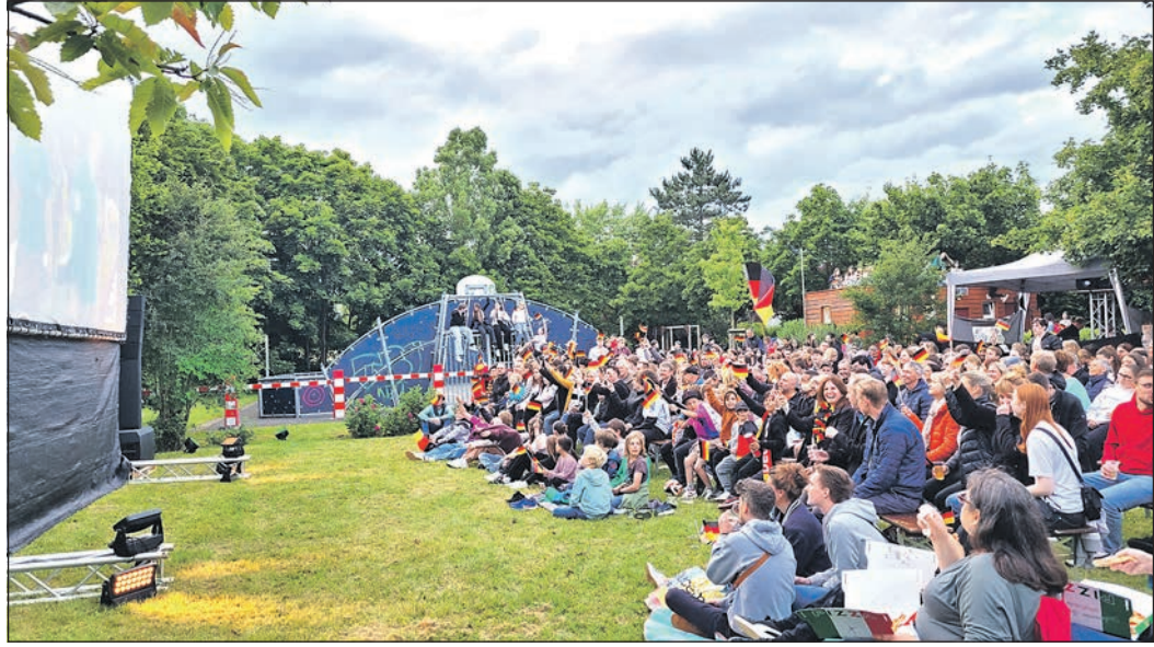
Der zweite Sommerempfang der Stadt Eschborn ist gut besucht gewesen. Im Anschluss haben viele das Eröffnungsspiel der Europameisterschaft Deutschland gegen Schottland auf der großen Leinwand verfolgt.