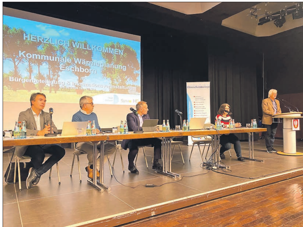
Großes Interesse herrscht an den Ausführungen zur kommunalen Wärmeplanung.

Interessierte finden die Vorträge zur Veranstaltung im Internet unter www.eschborn.de .