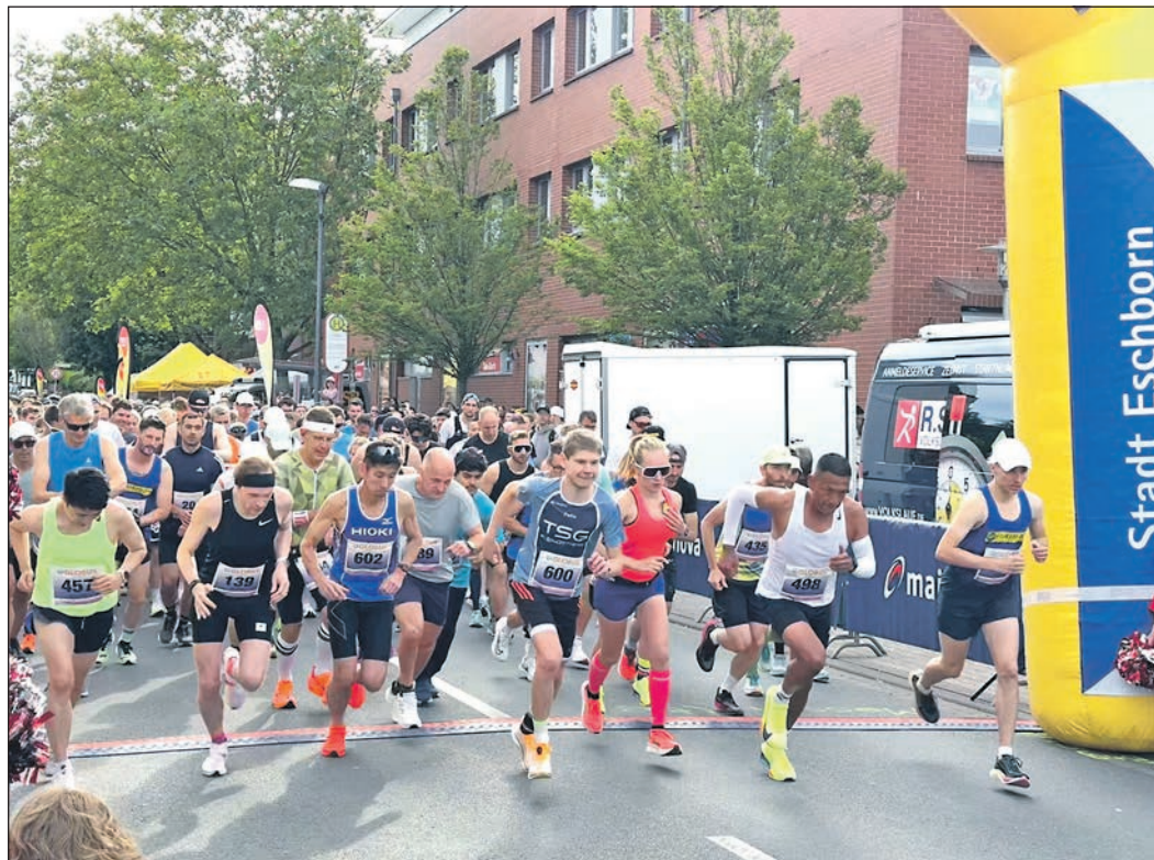
Start des Halbmarathons beim 11. Eschathlon.