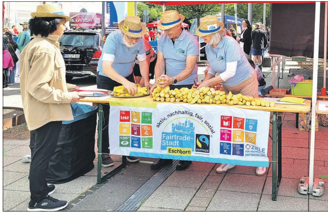
Auch die Steuerungsgruppe „Fair Trade“ ist beim Eschathlon vertreten gewesen und hat zwölf Kisten fair gehandelter Bananen verteilt.