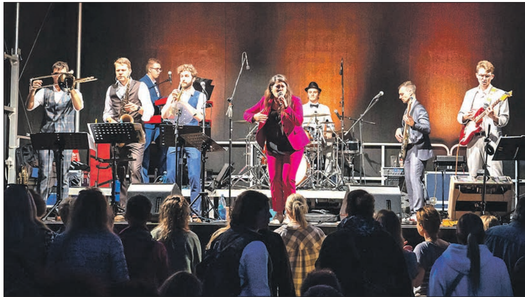
Das Eschborn K präsentiert ein Konzert mit der achtköpfigen Soulband „The Funk and the Curious“. Foto: „The Funk and the Curious“