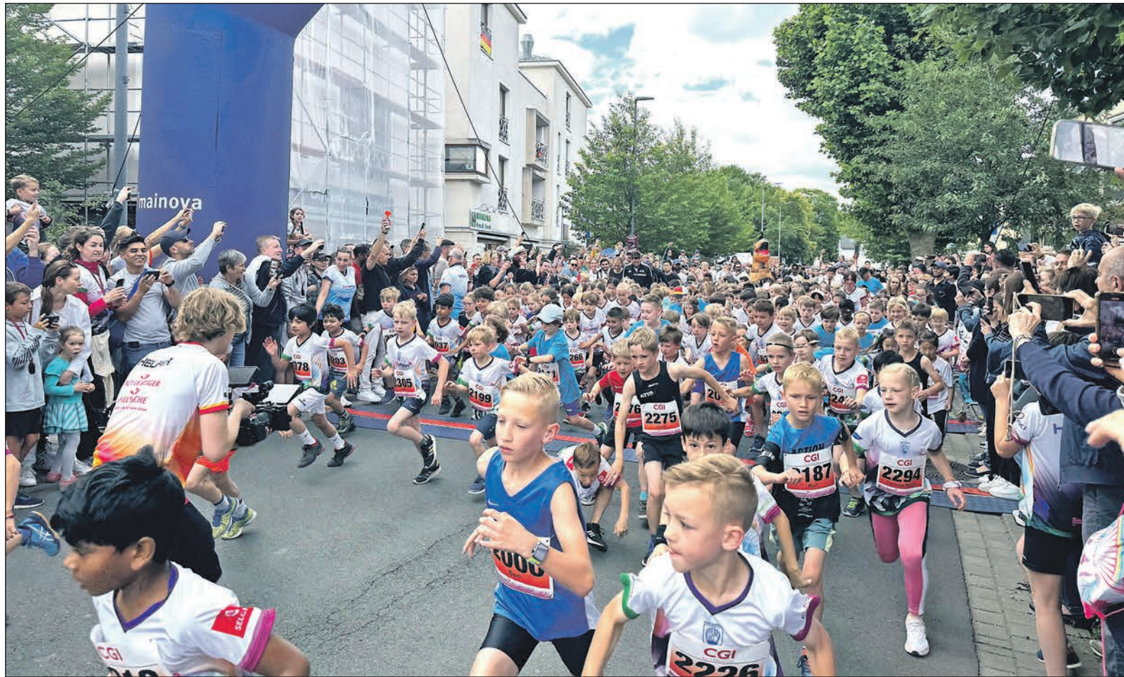
Der diesjährige 11. Eschathlon hat alle Teilnehmerrekorde gebrochen, und viele Laufdisziplinen sind schon lange vorher ausgebucht gewesen. Hier gehen die Mädchen und Jungen nach dem Startschuss auf die 1,5 Kilometer lange Strecke.