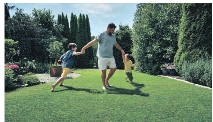
Wenn der Rasen besonders beansprucht wird, sollte der Rasen erneut mit Nährstoffen versorgt werden.

werden durch Mikroorganismen im Boden abgebaut, sodass die Nährstoffe kontinuierlich über drei Monate abgegeben werden, ohne den Rasen zu verbrennen. Ein regelmäßiger Schnitt hemmt unerwünschte Wildkräuter und fördert das Wachstum des Rasens.