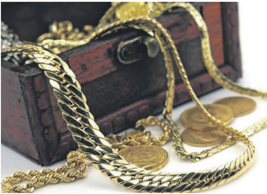
Goldschmuck und Goldmünzen

Experten für Schmuck, Diamanten, Luxusuhren und Bernstein vom 15.04. – 20.04.2024 zu Gast bei Scheurenbrand & Seiler in Bad Homburg