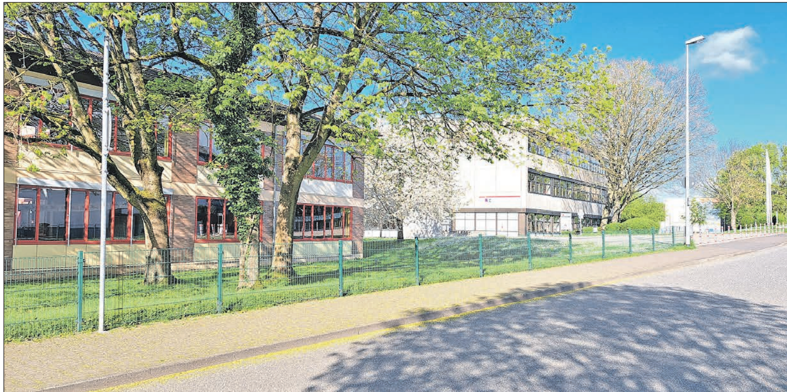
Am Straßenrand des Dörnwegs zwischen Heinrich-von-Kleist- und Hartmutschule befindet sich die neu eingerichtete Elterntaxihaltestelle, um Kinder schnell aussteigen zu lassen.