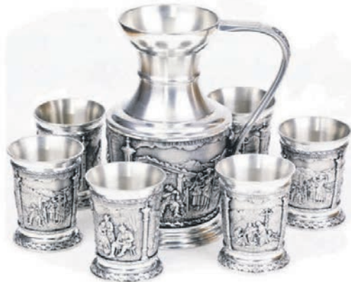
Zinnkrug und Zinnbecher