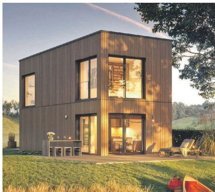
Zwei Vollgeschosse mit Flachdach vereint dieser kompakte Hausentwurf.

(DJD). Viele Menschen, die den Bau eines Eigenheims planen, interessieren sich heute für kompaktere Hausentwürfe. „Kleinere, gut durchdachte Lösungen erleben eine Renaissance. Als solide gebautes Eigenheim können sie alle Ansprüche an Nachhaltigkeit und eine sparsame Heiztechnik erfüllen“, erklärt Wolfgang Weber vom Fertighausanbieter WeberHaus. Viel Wohnkomfort als alleinstehendes Eigenheim auf wenig Grundfläche bietet etwa die Baureihe Option mit 55 bis 70 Quadratmetern. Aber auch für Familien mit Kindern, die etwas mehr Platz benötigen, sind effiziente Lösungen verfügbar - mit Wohnflächen um die 100 Quadratmeter. Mit dem praktischen Hausfinder etwa unter www.weberhaus.de lassen sich mit wenigen Eingaben Häuser suchen, die zu den eigenen Anforderungen passen.