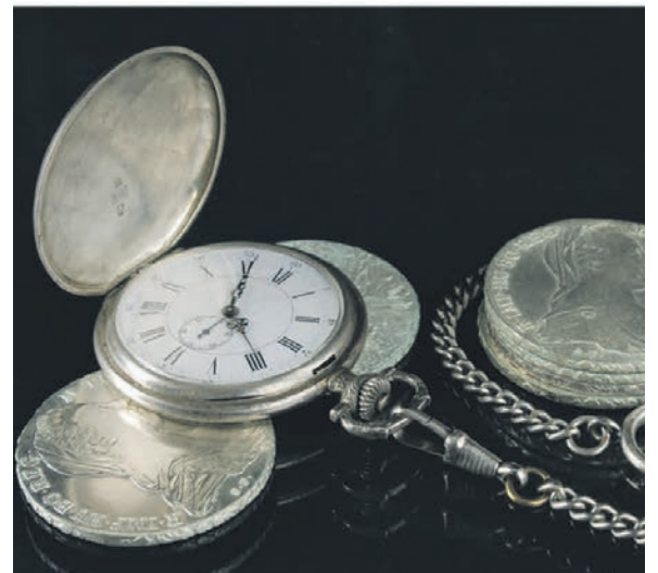
Taschenuhr und Silbermünzen

Bares für Wa(h)res bei Scheurenbrand & Seiler Louisenstraße 48 61348 Bad Homburg Tel. 06172-8 56 99 57