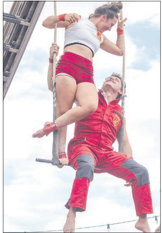
Hoch oben auf dem „FeuerWer“ Trapez.

Walkacts wie die „FeuerWer?“, „The Retrolettas“ und die „Go on Parade“ sorgen für gute Laune. Höhepunkt am Samstagabend ist die Lasershow, bei der die trommelnden Jungs