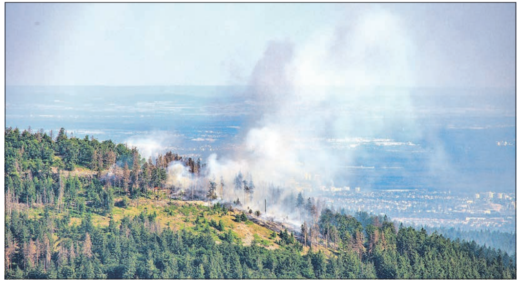
Am 12. Juni 2023 stehen 40 000 Quadratmeter Wald auf dem Altkönig in Flammen.

wie müssen sich Rettungskräfte neu organisieren? Welche Aufgaben kommen auf Gesellschaft, Politik und Verwaltungen zu? Antworten hierauf will der Fachkongress „Waldbrände – Eine Gefahr für die Zukunft unserer Wälder!“ liefern, der am Samstag, 20. April, von 14 bis etwa 17 Uhr in der Stadthalle Kronberg, Berliner Platz, stattfindet. Die Schutzgemeinschaft Deutscher Wald hat drei namhafte Referenten eingeladen, die langjährige – teilweise internationale – Erfahrungen zur Bekämpfung von Waldbränden mitbringen. Anschließend gibt es eine Podiumsdiskussion mit Fragen aus dem Publikum. Weitere Informationen stehen im Internet unter www.sdw-hessen.de . Eingeladen sind alle waldinteressierten Bürger, aber vor allem Einsatzkräfte, die im Juni 2023 am Altkönig engagiert waren. Der Eintritt zur Tagung ist frei. Die Veranstalter bitten ausdrücklich um eine Anmeldung per E-Mail an kontakt@sdwhessen.de . Die Teilnehmerzahl ist begrenzt.