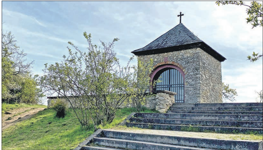
Die Wanderung führt an der St.-Anna-Kapelle in Flörsheim vorbei.