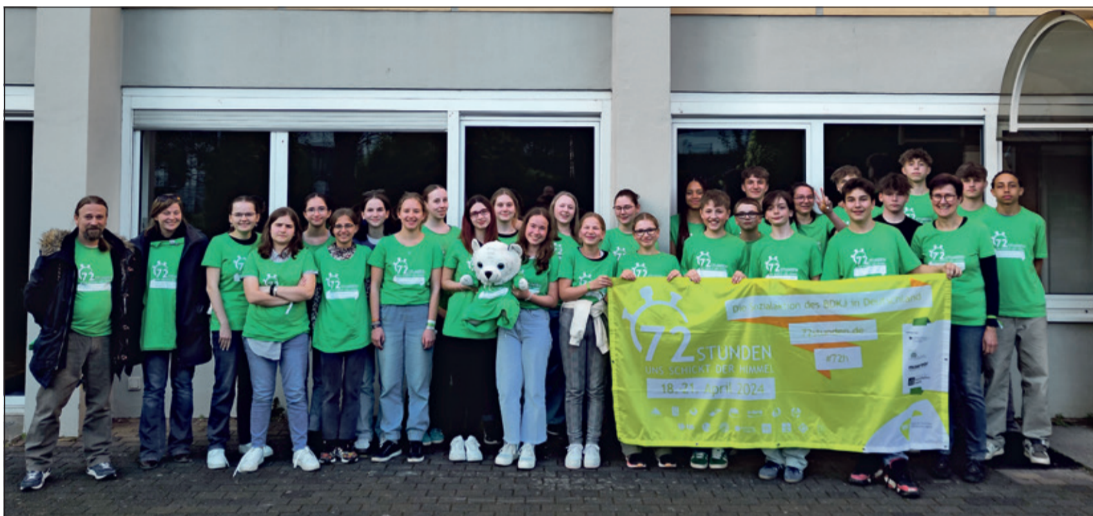
Die Aktionsgruppe „Heilig Geist Jugend“ legte sich mächtig ins Zeug und schenkte Bad Soden ein tolles Apfelfest.