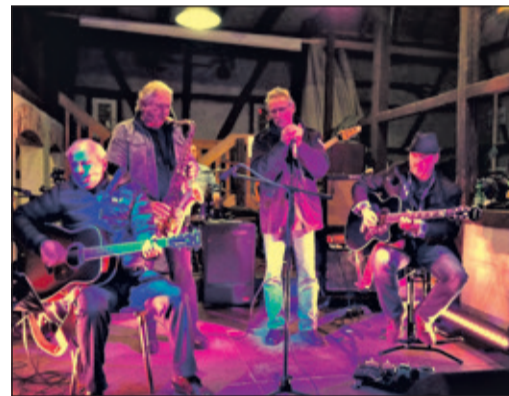
Auf der Bühne an diesem Abend stehen auch die Musiker der Bad Sodener Band BluesHaus.

Bad Soden (bs) – Bluesfans sollten sich den 11. Mai im Kalender anstreichen: Dann stehen die Bad Sodener Band BluesHaus Unlimited sowie die Matchbox Blues Band an der Kulturscheune (Zum Quellenpark 42) auf der Bühne.