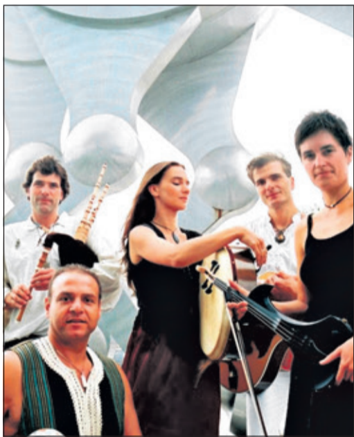
Dhalia's Lane gastiert am 27. April an der Kulturscheune.

Bad Soden (bs) – Fans der grünen Insel freuen sich schon lange drauf: endlich Frühling, endlich wieder ein Irischer Abend an der Kulturscheune! Erwartet wird am Samstag, 27. April, ab 18 Uhr die Gruppe Dhalia's Lane.