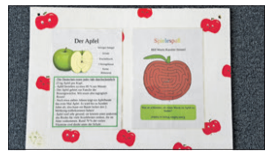
Eine der Holztafeln des Apfel-Lehrpfades