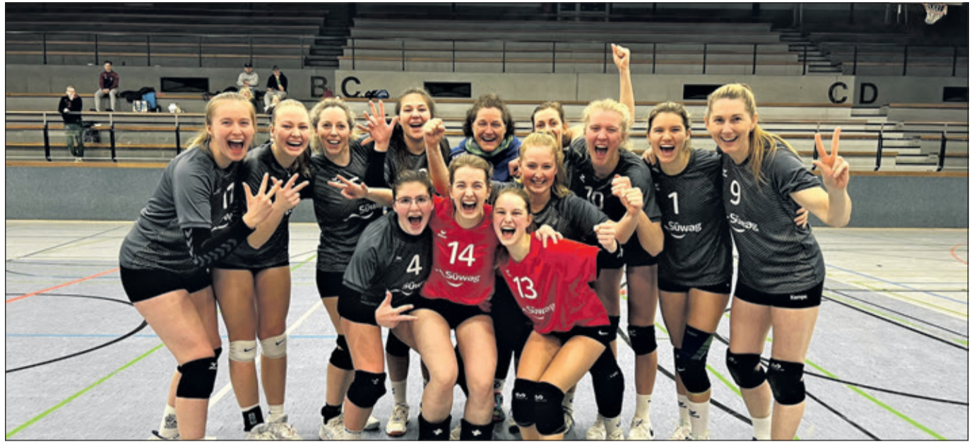
Die TG Bad Soden 2 feiert beim vorletzten Spiel nicht nur ihren Auswärtssieg, sondern auch die vorzeitig feststehende Meisterschaft in der Landesliga Süd.

Bad Soden (bs) – Die zweite Damenmannschaft der TG Bad Soden – Volleyball hat das Unglaubliche möglich gemacht und konnte sich den Aufstieg in die Oberliga sichern.