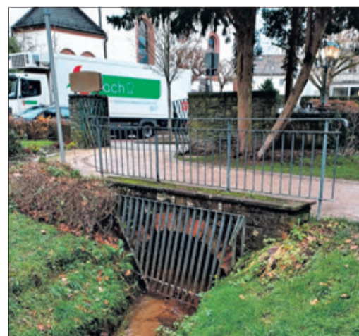
Eine neue Rechenanlage hier soll dazu beitragen, künftiges Hochwasser zu vermeiden.

Bad Soden (bs) – Die Stadt Bad Soden am Taunus unternimmt große Anstrengungen, damit sich Schäden wie nach den Überflutungen in den Sommern 2020 und 2023 nicht wiederholen. So wurden kürzlich bereits Probebohrungen für die Erweiterung des Rückhaltebeckens Niederdorfbach vorgenommen. Nun wird die Rechenanlage am Sulzbach im Quellenpark erneuert.