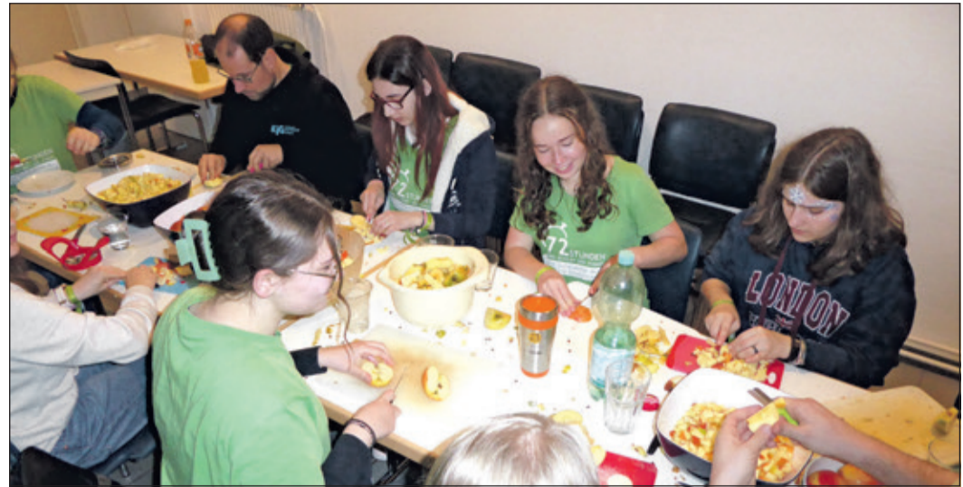
Mindestens 40 kg Äpfel mussten für den frischen Saft kleingeschnitten werden.