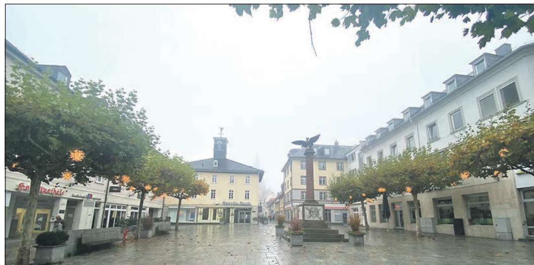
Die Bäume, die den Waisenhausplatz säumen sind in diesem Jahr festlich geschmückt. Die Leuchtelemente zaubern Weihnachtsstimmung auch an trübigen Tagen.

Die neue Weihnachtsbeleuchtung wird am Donnerstag, 21. November, mit Beginn der Weihnachtsstadt offiziell eingeschaltet und bleibt bis zum Ende der Weihnachtszeit. In den kommenden Jahren soll das Konzept auf weitere Plätze ausgeweitet werden.