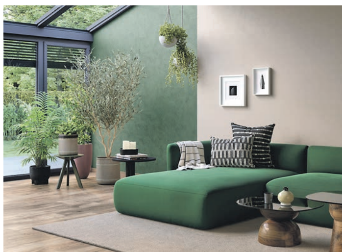
Clever kombinieren: Eine Mischung aus Grün und vergrautem Rosa kann eine sehr beruhigende und erfrischende Atmosphäre schaffen.

Farben und ihrer Wirkung kommt es zudem auf die richtige Dosierung an. Rottöne sind zum Beispiel sehr anregend und beeinflussen uns stark, weil Rot eine dominante Farbe ist. Empfehlenswert ist es daher, Rot nur partiell einzusetzen. Bei der Gestaltung der eigenen vier Wände kommt es also stets auf die richtige Balance an. Wohngesunde Farben ohne Konservierungsmittel etwa aus dem Vita-Sortiment von Brillux unterstützen eine nachhaltige Gestaltung. Eine fachkundige Beratung und Ausführung gibt es beim Fachhandwerk vor Ort, Inspiration und einen Fachbetriebsfinder gibt es auf www.brillux.de/zuhause .