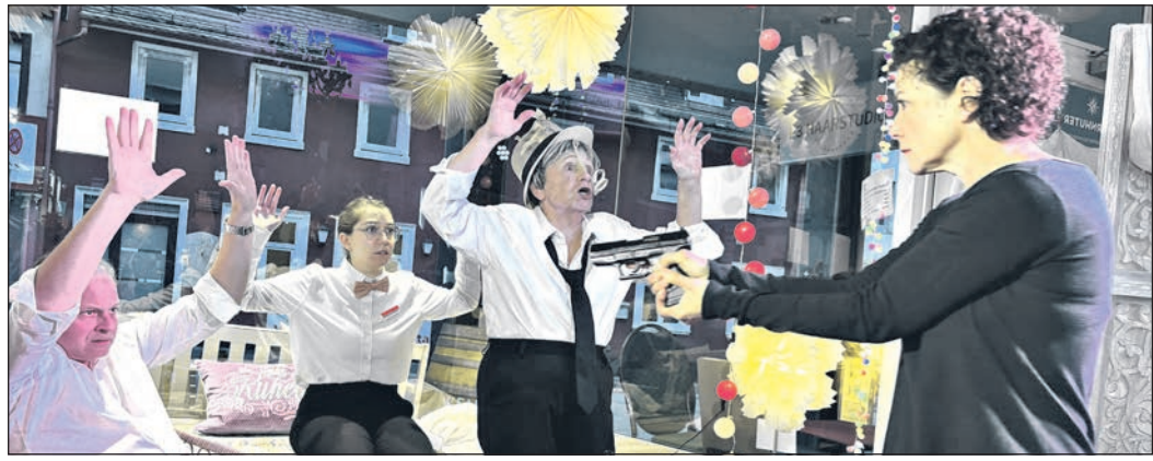
Hände hoch! Den Verbrechern ist es trotz Zeugenschutzprogramm gelungen den Zeugen zu finden.