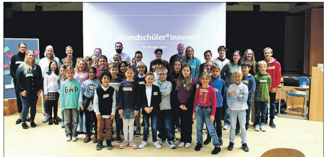
Sie haben ihre Ideen eingebracht und angeregt miteinander diskutiert: Die Mitglieder des ersten Grundschulerrats im Hochtaunuskreis.

Der Kreisschülerrat freut sich über das große Interesse und das positive Feedback der Schüler und Lehrer und plant, den Grundschulerrat fortan regelmäßig abzuhalten, um die Stimme der jüngsten Schüler weiter zu stärken.