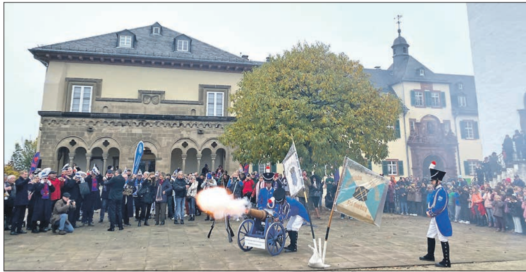
Die elf Salutschüsse mit der die närrische Kampagne in Bad Homburg eingeläutet wird, ist bis in die Louisenstraße zu hören.