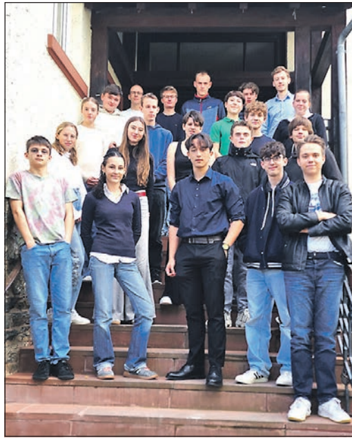
Sie haben ganz viel vor, und wollen die Interessen der Jugendlichen im Kreis vertreten – die Mitglieder des neu gegründeten Jugendrats.

Der Jugendrat Hochtaunuskreis hat sich zum Ziel gesetzt, die Anliegen und Wünsche der Jugendlichen im Kreis zu vertreten und ihnen eine starke Stimme in politischen und gesell-