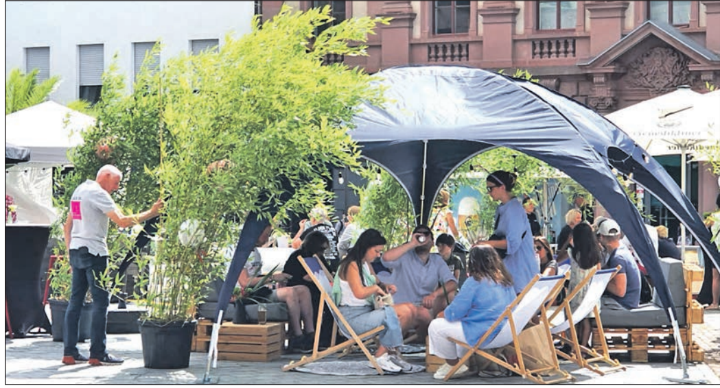
Entspannung pur mit Musik: Tagsüber werden den Besuchern bei „City Beatz“ Sitzgelegenheiten im Schutz der Sonne angeboten.