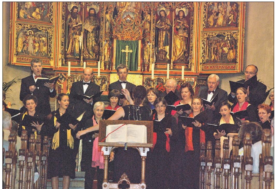
Die Sänger stehen an ihren Plätzen, die Dirigentin richtet ihr Gesicht zu ihnen und schwingt den Stab. Der Chorgesang hallt durch die Kirche.

in diesem Jahr auch Eintrittskarten ausschließlich für das Konzert in der Erlöserkirche zum Preis von 13 Euro – ermäßigt 11 Euro – an der Abendkasse der Erlöserkirche erworben werden. Diese Einnahmen fließen der Erlöserkirche zu. Der Reinerlös aus dem Verkauf der Kombitickets kommt den sozialen Projekten des Lions Clubs Bad Homburg Weißer Turm zugute. Die Lions unterstützen die Kinder- und Jugendarbeit im Hochtanauskreis, darunter viele dauerhafte Einrichtungen wie auch Einzelprojekte. Zu den unterstützten Einrichtungen zählen: Frankfurter Kinderhaus, Landgräflische Stiftung von 1721, Insl-Initiative Sprache, Verein für Natur und Psychomotorik, Tafel Hochtaunus, Verein Justament, Verein Kultur-Leben, Kinderschutzbund, Jugendchor und Jugendsinfonieorchester Hochtaunus und Kinder- und Jugendhospizdienst. Interessenten finden weitere Informationen, wie auch die Möglichkeit sich mit einer Spende zu beteiligen, im Internet unter https://lchgw.de/ . Außerdem verlost der „Lions Club Bad Homburg Weißer Turm“ und die Taunus Zeitung fünf Mal zwei Eintrittskarten für die Nacht der Chöre. Zur Teilnahme an der Verlosung muss bis zum Samstag, 31. August, eine E-Mail mit dem Stichwort „NdC“, unter Angabe ihrer Adresse und Telefonnummer an marketing@mediengruppe-frankfurt.de gesendet werden. Der Rechtsweg ist ausgeschlossen.