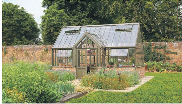
Die Struktur der Gewächshäuser ist klar, geordnet, praktisch und vor allem von langer Lebensdauer, Wind und Wetter können den Häusern über Jahrzehnte nichts anhaben.

geplant. Unter www.britishstyle.info finden sich viele Inspirationen.