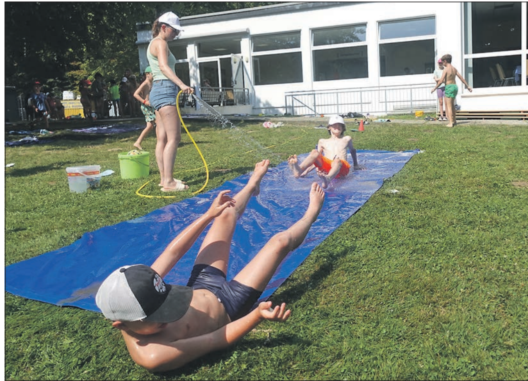
Bei der Sommerolympiade dürfen sich die Kinder der Sommerferienspiele über eine selbstgebaute Wasserrutsche freuen.

viani, welcher in seiner Kindheit selbst ein Teil der Sommerferienspiele war, lobte beim Besuch des Hochtaunus-Verlags zum Abschied die Spiele folgendermaßen: „Schön kann so einfach sein.“