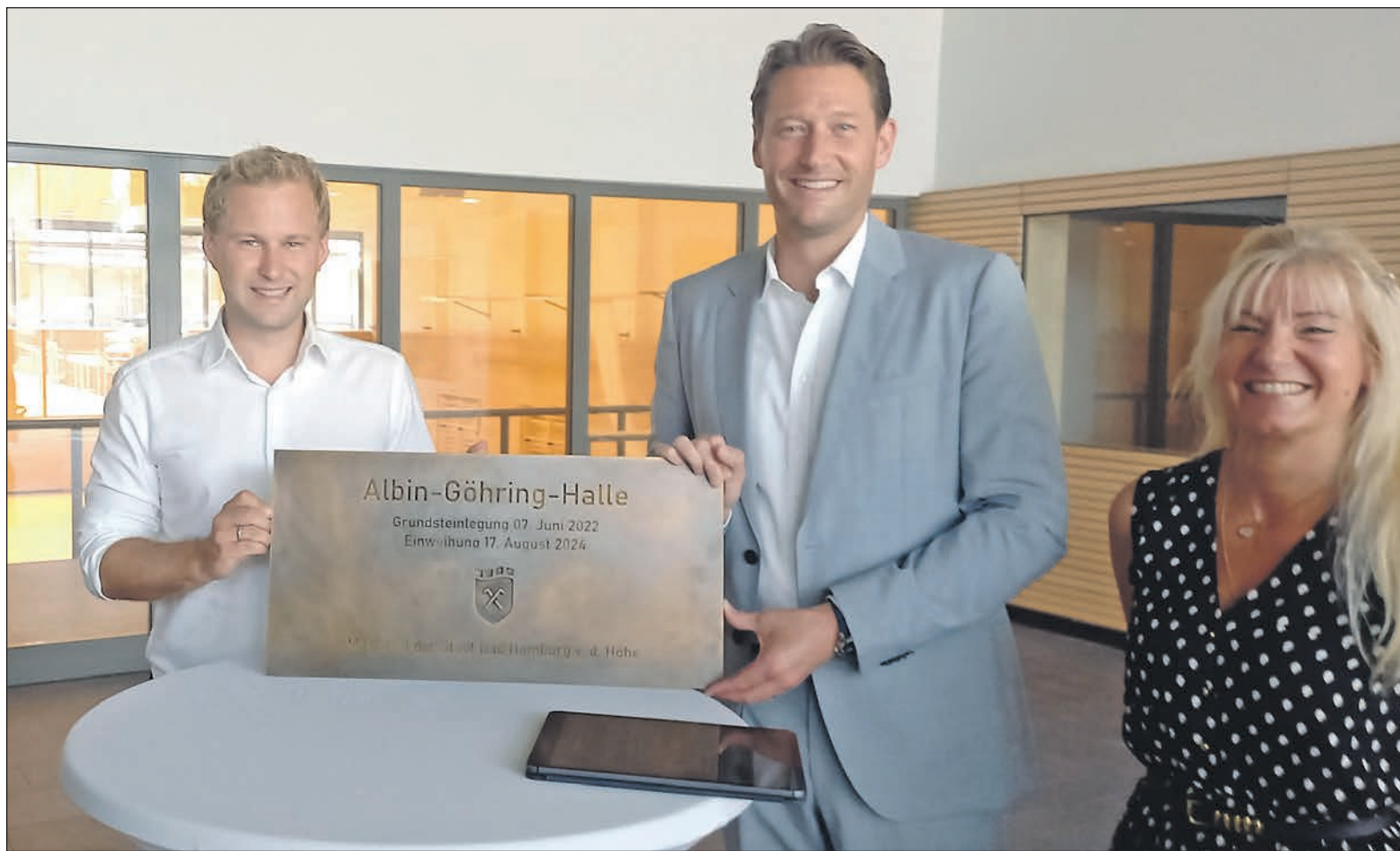
Bürgermeister Oliver Jedynak, Oberbürgermeister Alexander Hetjes und Ortsvorsteherin Yvonne Velten bei der Eröffnung der Albin-Göhring-Halle im Massenheimer Weg.