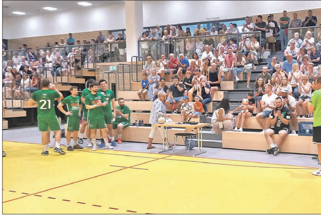
Das erste Match liefern sich das Handball-All-Stars-Team mit der Männerspielgemeinschaft Eschbach. Die Zuschauer verfolgen die Torejagd gespannt von der Tribüne aus.