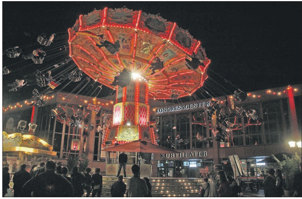
Vor dem Kurhaus sorgt der Wellenflieger für Vergnügen.