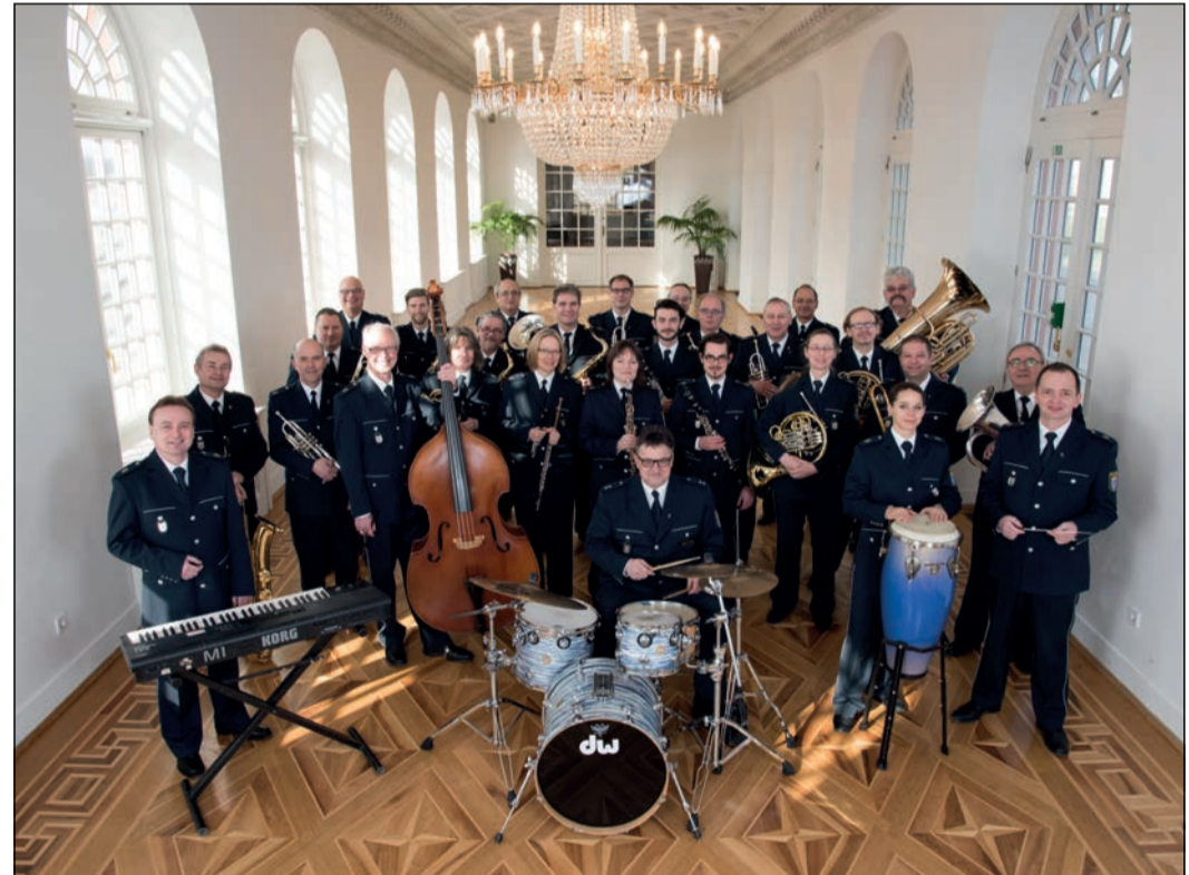
Das Hessische Landespolizei-Orchester in voller Montur und Pracht

Kronberg (kb) – Profis spielen zugunsten von jungen Musikern – das ist das Konzept des Benefizkonzerts, das der Lions Club Kronberg im Taunus am 5. November veranstaltet. Dazu haben die Lions das Hessische Landespolizei-Orchester (LPO) eingeladen. Das Orchester besteht aus Mitgliedern mit abgeschlossenem Musikstudium, deren instrumentale Vielseitigkeit sich auch in den umfangreichen Besetzungsmöglichkeiten widerspiegelt. Neben dem großen Bläserorchester, einer Big Band und einer Combo stehen auch verschiedene Kammermusikbesetzungen sowie eine vollstümliche Besetzung zur Verfügung. Im Konzert wird sich das LPO mit einem facettenreichen Programm präsentieren, das den Bogen spannt von sinfonischer Blasmusik mit „Flashing Winds“ über die schönsten Melodien aus den Musicals „Porgy and Bess“ von George Gershwin und dem „Phantom der Oper“ von Andrew Lloyd Webber bis hin zu