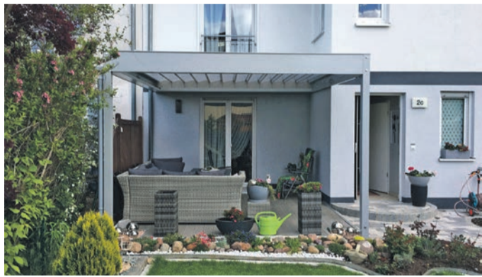
Ein FLEDMEX® Lamellendach passt immer, egal ob Dachterrasse, kleiner Balkon oder großer Sommergarten. Möglich wird diese Flexibilität durch die hauseigene Fertigung, dank der die Systeme stets passgenau auf individuelle Kundenwünsche zugeschnitten werden können.

Flexibilität ist Trumpf – Ob Sommergarten, Balkon oder Dachterrasse – mit passgenauen Lamellendächern wird jeder Ort zur Wohlfühloase