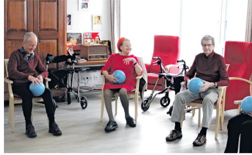
Weitere sportliche Besucherinnen und Besucher der Tagespflege