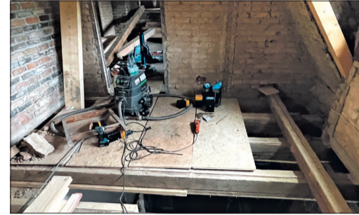
Eindringendes Wasser hat Balken und Decken stark beschädigt, die aufwändig erneuert werden mussten.

Die Probleme mit der Deutschen Bahn sind Thema bei Roth, seitdem er mit der aufwändigen Sanierung des Projekts begonnen hat.