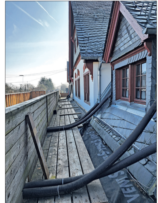
Dachwasser wird über provisorisch angebrachte Rohre abgeleitet, das kann keine Dauerlösung sein.

Bahnsteigerhöhung zur Rede, die bei der Sanierung der gusseisernen Säulen und des Vordachs berücksichtigt werden müssen. Im Anbau des Bahnhofs befindet sich das Bäckereigeschäft, im Bereich dahinter die Backstube, aufgrund von Leitungen und Fundamenten der Bahn kann dieser Bereich nicht unterkellert werden und der ursprüngliche Bauantrag muss umgeplant werden. „Für den restlichen Keller bleibt die Stehhöhe von 1,75 Metern, also ein Kriechkeller, der aufgrund der Tatsache, dass der Bahnhof im Überschwemmungsgebiet des Winkelbachs und Westerbachs liegt, nicht für die Gastronomie genutzt werden kann. Ursprünglich sollten hier die Sanitäranlagen untergebracht werden, aufgrund der besonderen Situation muss nun auch hier umgeplant werden“, erläutert Roth. Trotz mancher Rückschläge zeigt er sich zuversichtlich. „Wenn wir mit der DB alles einvernehmlich geklärt haben, geht es zügig voran, zumindest im Innenbereich. Und für den Außenbereich lässt sich sicher auch eine Lösung finden, die Kooperation mit dem Bauamt ist konstruktiv und zielführend.“ Die DB InfraGo wirbt auf ihrer Plattform damit, dass eine starke Schiene starke Bahnhöfe braucht. Denn sie seien das Zugangstor zur nachhaltigen Mobilität und