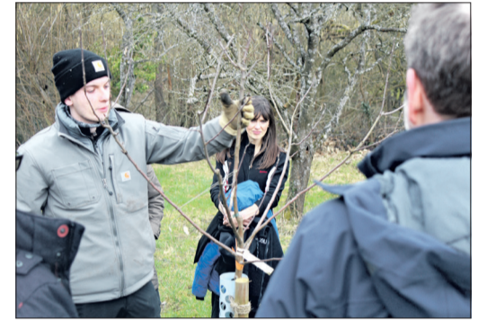
Ein junger Baum wird in Augenschein genommen.

Um diesem vorzubeugen, braucht der Baum unter anderem ständige Bewässerung, aber auch im Inneren mehr Schatten als früher, so dass mittlerweile ein Stückweit behutsamer geschnitten wird. Man erfährt noch vieles mehr während des Kurses – sicherlich genug, um es erst einmal bei Kaffee, Apfelsaft, heißem „Schobben“ und frisch gebackenen Plätzchen in der Nachbarschaft der Erlebnisobstwiese „sacken zu lassen“ und dann im Anschluss selbst anzuwenden. Dafür hatten Mitglieder des OGV gesorgt.