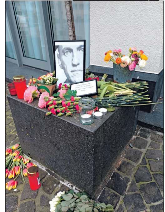
Eine kleine Gedenkstätte für einen der mutigsten Menschen unserer Zeit: Alexei Nawalny