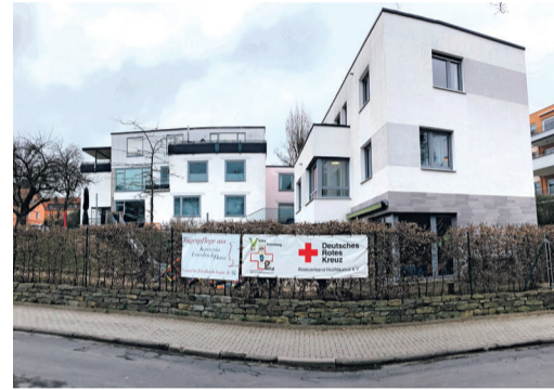
Das Gebäude des Deutschen Roten Kreuzes mit Tagespflegeeinrichtung und Kita