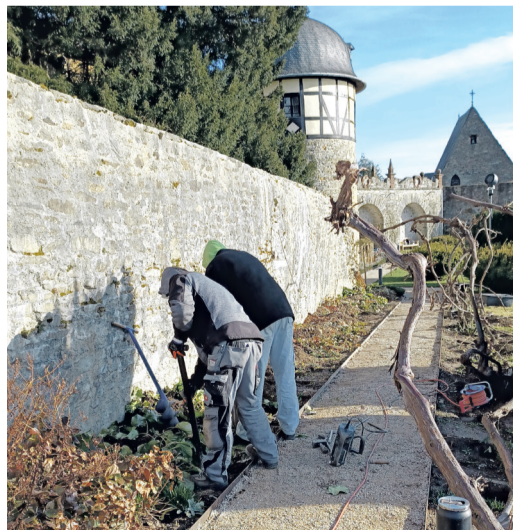
Fleißige Helfer kümmern sich um die Reben.