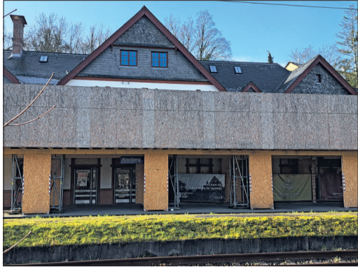
Der Arbeits- und Schutzzaun um das Bahnhofs-Vordach bietet auf Dauer keine Sicherheit mehr.

Kronberg (hmz) – Der äußere Eindruck, dass es bei der Sanierung des Bahnhofsgebäudes nicht recht vorangeht, trägt. Im Innenbereich geht es schrittweise in enger Abstimmung mit dem Denkmalschutz wei-