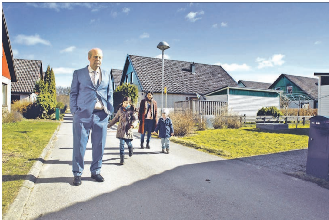
Im Rahmen der Reihe „Filme aus aller Welt“ zeigen die Deutsch-Ausländische Gemeinschaft Schwalbach und der Kulturkreis „Ein Mann namens Ove“.

Die Karten kosten im Vorverkauf 15 Euro, ermäßigt sechs Euro und an der Abendkasse 20 Euro. Tickets gibt es über den Main-Taunus-Kundenservice unter Telefon 06192-2010 oder per E-Mail an kultur@mtk.org. Weiterhin online über: www.frankfurt-ticket.de . Adresse des Landratsamts Hofheim: Am Kreishaus 1-5, 65719 Hofheim. Die Öffnungszeiten der Jahreskunstausstellung „Von hier nach da“ finden sich unter www.mtk.org/Kunstsammlung-3402.htm .