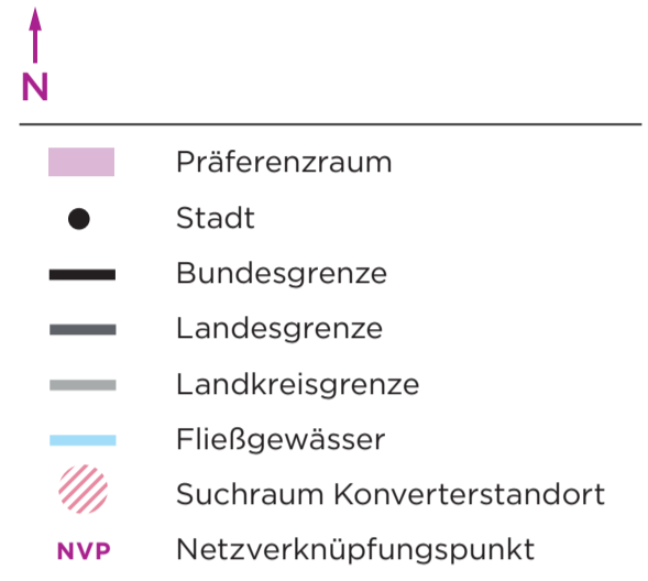
Schematische Darstellung