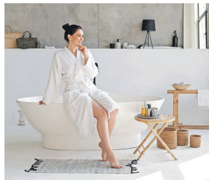
Die meisten Menschen haben eine klare Vorstellung von ihrem Traumbad, wissen aber nicht, mit welchen Kosten sie für eine Modernisierung rechnen müssen.

(DJD). Das Bad gehört zu den wichtigsten Räumen im Haus. Wer sich auf die Suche nach einem Traumbad macht, wird bei Badausstellern und im Internet schnell fündig. Doch welche Ausstattung passt wirklich in mein Bad - und wie viel kann und will ich mir leisten? Eine gute erste Annäherung an das erforderliche Budget und die Einrichtungswünsche bieten Badrechner im Internet. Mit wenigen Eingaben erhält man einen Richtpreis, an dem man sich orientieren kann. Unter www.die-badgestalter.de/bad-rechner ist ein solches Tool neben einer Vielzahl weiterer Informationen sowie Adressen von Sanitär-Fachbetrieben zu finden. Wenn der grobe Rahmen für das Wunschbad steht, sollte die konkrete Planung mit einem Spezialisten, zum Beispiel einem Betrieb von „Die Bad- und Heizungsgestalter“ durchgeführt werden.