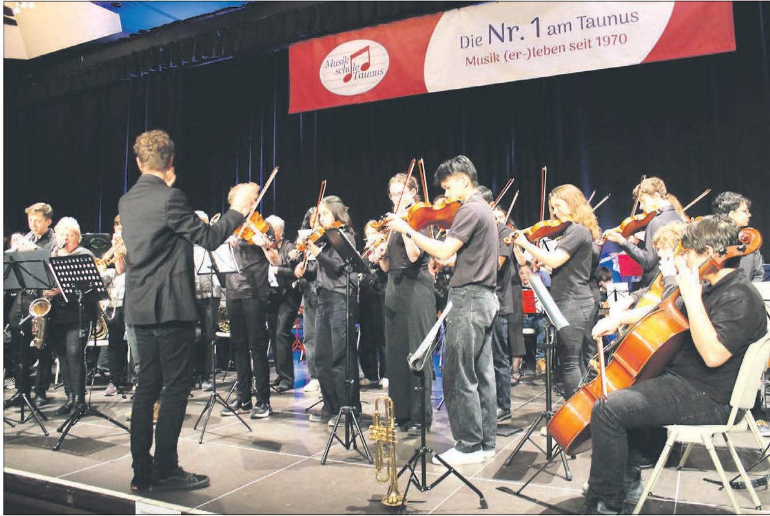
Das Jahreskonzert der Musikschule Taunus ist mit fast 100 beteiligten Schülern aus Eschborn und den umliegenden Gemeinden ein voller Erfolg – sowohl die Ensembles als auch die Solisten überzeugen das begeisterte Publikum.