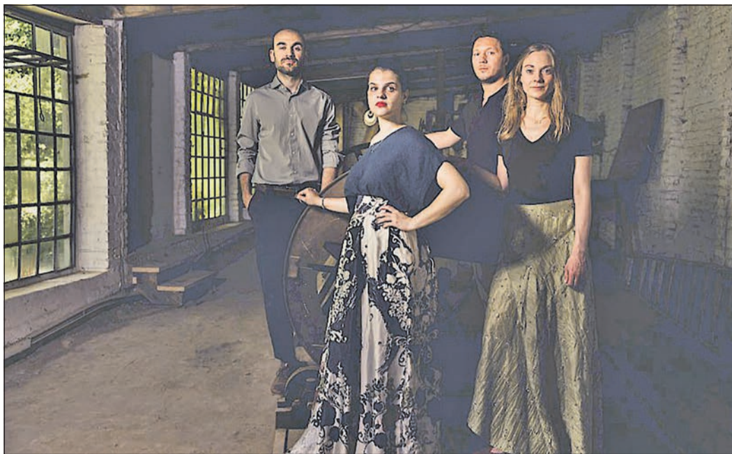
Das Ensemble „Eliá“ präsentiert ein klanglich vielfarbiges Konzert im Landratsamt in Hofheim.