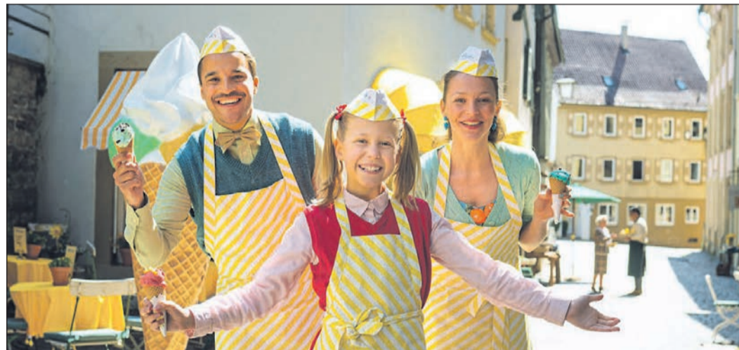
In der Reihe „Kino4Kids“ wird „Lucy ist jetzt Gangster“ gezeigt. Foto/Plakat: wildbunch

tigt sich mit den Fragen: Was ist Künstliche Intelligenz? Was ist Generative Künstliche Intelligenz? Was ist maschinelles Lernen? Was sind „Large Language Models“ (LLM)? Was bedeutet „Prompting“, und wieso kann eine Generative Künstliche Intelligenz „halluzinieren“? Der Abend mit dem Informatiker, Coach und Wirtschaftspsychologen Kay Schulz richtet sich bewusst an Menschen, die die Begriffe in den Medien sehen und hören, sich aber keinen Reim darauf machen können. Die Anmeldung erfolgt unter der Kursnummer 241-1-71 über das Kursprogramm oder an der Abendkasse. Den Film „Eren“ zeigt das Eschborn K zum Weltfrauentag am Freitag, 8. März, um 20.15 Uhr. Seit über 30 Jahren kämpft die Rechtsanwältin Eren Keskin in der Türkei gegen die staatliche Verfolgung von Andersdenkenden, gegen Folter und sexualisierte Gewalt. Die Regisseurin Maria Binder hat sie bei ihrem Kampf um Menschenrechte begleitet. Gegen die Trägerin des Amnesty-Menschenrechtspreises liegen 140 Strafverfahren vor, meistens wegen „Beleidigung des Türkentums“. das K zeigt den Film in Kooperation mit Amnesty International. Gäste zum Talk sind Georg Schäfer (AI) und Roland Zenk (Arbeitskreis Flüchtlinge in Eschborn). Weitere Informationen zu den Programmen des Eschborn K im Internet unter www.eschborn-k.de .