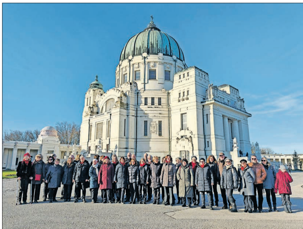
Der Eschborner Chor „singfonie“ bei seiner Reise nach Wien auf dem Zentralfriedhof vor der Lueger-Kirche, in der er einen Gottesdienst musikalisch begleitet hat.