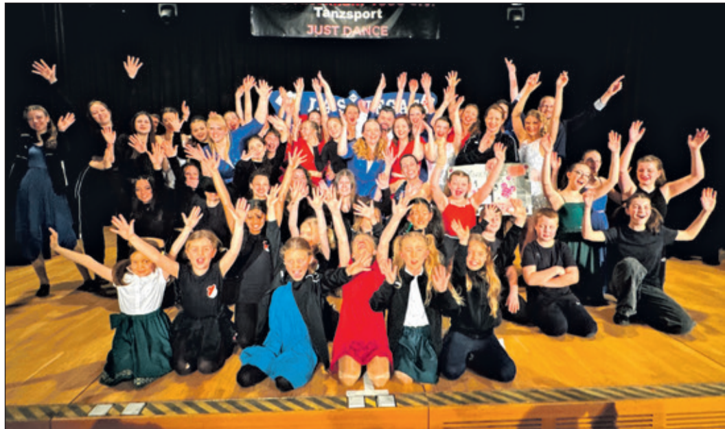
Die „Diamonds Deluxe“ mit ihrem atemberaubenden Las Vegas-Showtanz