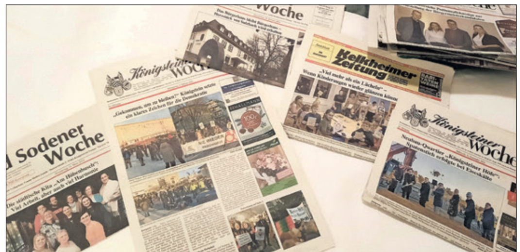
Eine Zeitung zu füllen und zu gestalten, ist mit viel Arbeit, Zeit – aber auch Spaß an der Freude – verbunden ...

und sterbende Menschen in ihrer häuslichen Umgebung oder im Pflegeheim an. Uli Fink, der Präsident des Lions Club Bad Soden-Vortaunus, äußerte sich dazu wie folgt: „Wir sind sehr dankbar, dass wir das Hospiz weiterhin unterstützen können. Mit dieser Spende möchten wir dazu beitragen, dass Menschen am Ende ihres Lebens eine würdevolle, schmerzfreie und individuelle Betreuung und Pflege erhalten können – und das in unserer Gemeinde.“ Weitere Informationen erhalten Interessierte unter: www.lions-club-vortaunus.de .