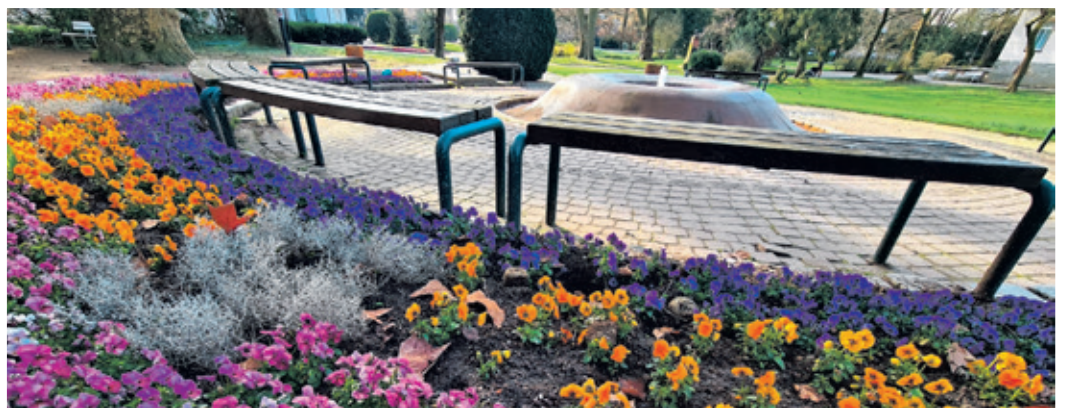
Frühlingsblüher machen im Alten Kurpark schon Lust auf die wärmeren Monate.

Aktuell durchgeführt werden Staudenpflanzungen an der Bushaltestelle Altenhain und in der Straße Am Honigbirnbaum.