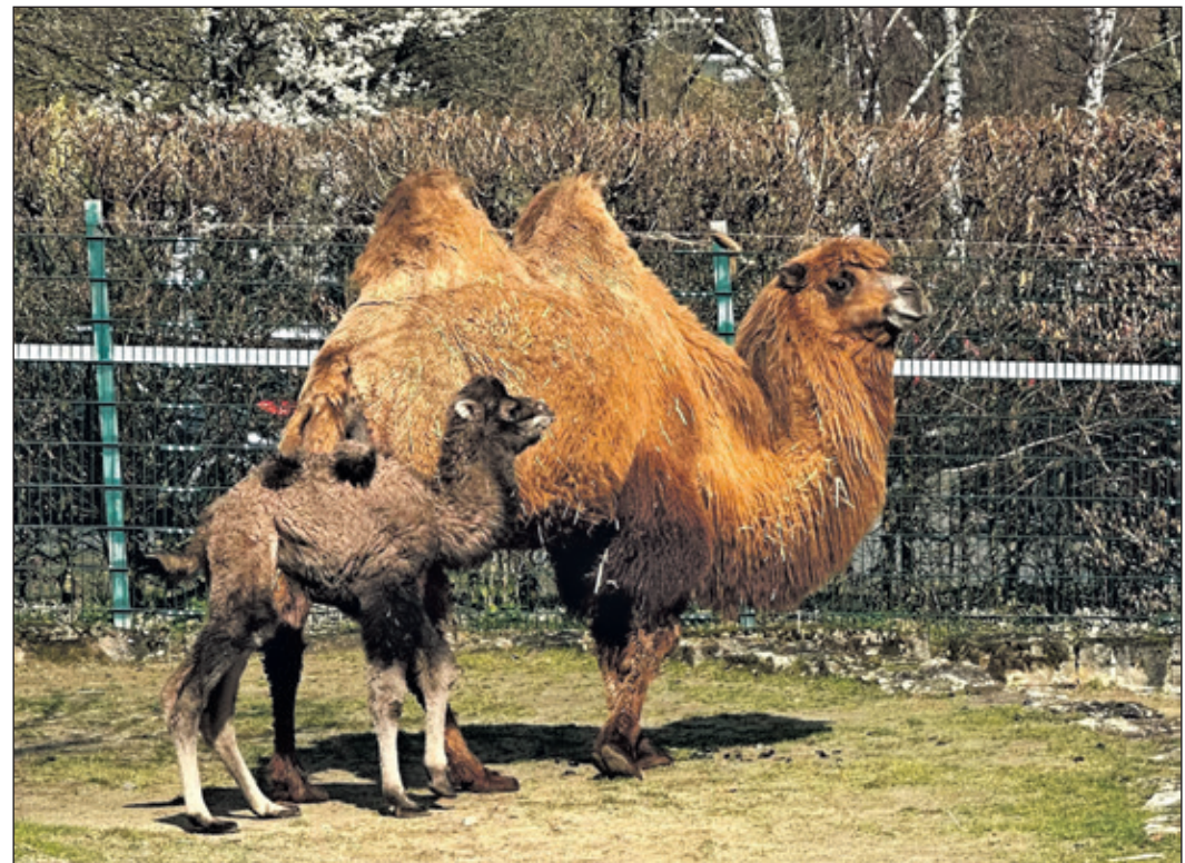
Trampeltier-Nachwuchs „Ella-Marie“ im Opel-Zoo, vier Tage alt, mit Muttertier „Emily“