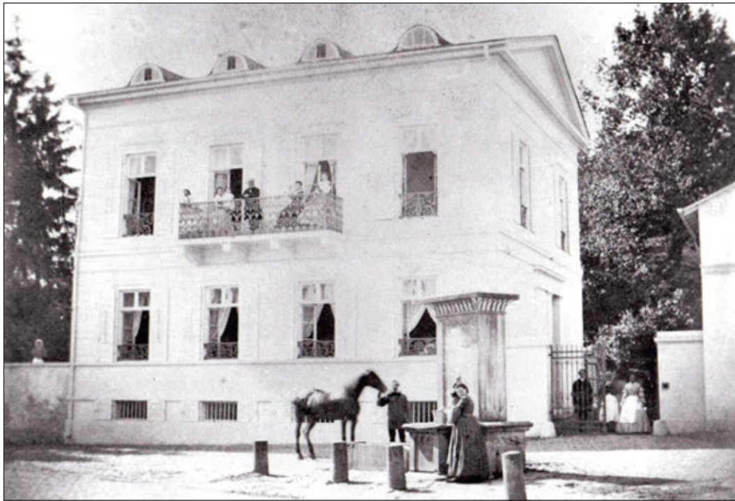
Fotografie des Hauses Reiss aus dem 19. Jahrhundert. Die vermutlich älteste Aufnahme des Hauses. Das Dienstpersonal am Eingang, Familie Reiss auf dem Balkon.