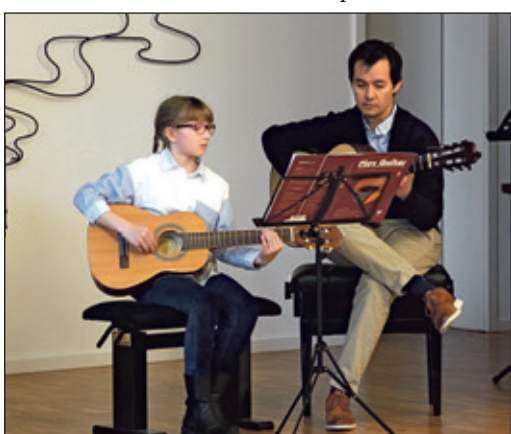
Die jüngsten Schülerinnen und Schüler spielen mit ihren Lehrern vor Publikum.