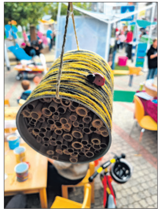
An den bunten Ständen des Herbstmarktes gibt es Angebote für die großen und kleinen Besucher.