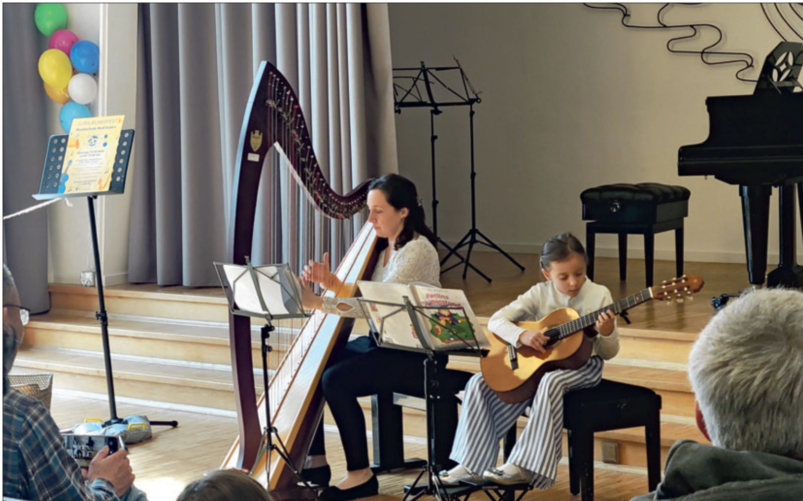
Zarte Harfenklänge, gekonnte Griffe an der Gitarre: Die Freie Musikschule Bad Soden e.V. feierte 20 Jahre Jubiläum.