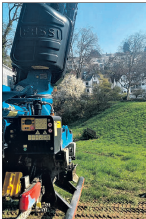
Läuft alles nach Plan, starten am Niederdorfsbach im kommenden Jahr die Arbeiten zur Erweiterung des Rückhaltebeckens.

Bad Soden (bs) – Schweres Gerät ist aufgeföhren am Regenrückhaltebecken im Zuge des Niederdorfsbachs – etwa parallel der Königsteiner Straße zwischen der Kernstadt und Neuenhain. Das dortige Regenrückhaltebecken soll deutlich erweitert werden und so für mehr Schutz vor Hochwasser sorgen. Dafür werden jetzt Bodenproben genommen. In den vergangenen Tagen haben Mitarbeiter einer Fachfirma Bohrpunkte eingemessen, seit Mittwoch dann mit einer großen Maschine Kernbohrungen in einigen Metern Tiefe vorgenommen. Und in den entsprechenden Archiven wurden Unterlagen gewälzt, um zu prüfen, ob sich an dieser Stelle gegebenenfalls noch Kampfmittel aus dem Zweiten Weltkrieg befinden. Wenn all diese Bodenerkundungen und Recherchen nichts Auffälliges ergeben, sind die Planungen ein gutes Stück weiter. Dann könnte die Baugenehmigung im kommenden Jahr erteilt werden, hofft der zuständige Abwasserverband Main-Taunus. Bis dahin sollen weitere umfangreiche Abwägungen im Hinblick auf Umwelt-, Natur- und Artenschutz erfolgen.