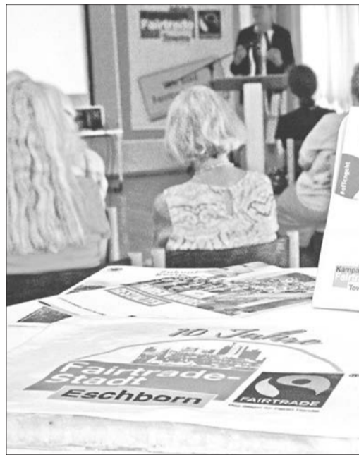
Seit zehn Jahren trägt Eschborn das Siegel „Fairtrade Stadt“.

Im Anschluss an seinen Vortrag konnten dann Peru-Puro-Produkte probiert und gekauft werden, außerdem gab es Blechkuchen mit regionalen und saisonalen Früchten von Tottis Marmelädchen.