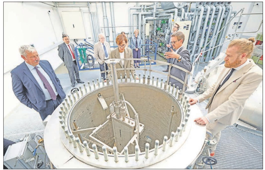
Bundesforschungsministerin Bettina Stark-Watzinger (Mitte) besucht weltweit einzigartige Forschungsanlage bei traditionellem hessischen Auftrags-Forschungsunternehmen in Eschborn.