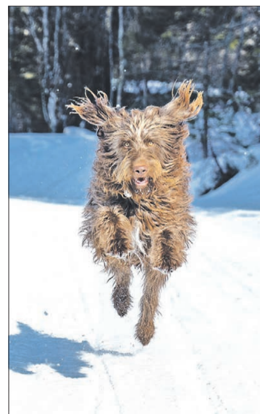
Beim Casting für die Rettungshundestaffel werden verschiedene Charaktereigenschaften der Hunde getestet.

Eine Anmeldung zum Casting im Internet unter www.rhs-rm.de ist zwingend erforderlich. Dort gibt es auch weitere Informationen. Zuschauer sind beim Casting willkommen.