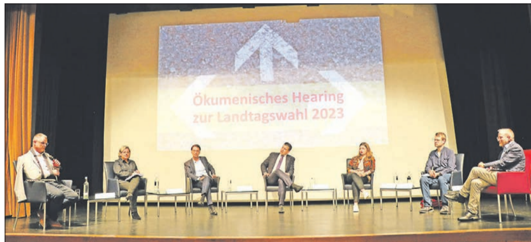
Die Direktkandidaten des Wahlkreises 32 im Gespräch mit den Wählern.

Initiatoren der Veranstaltung waren der Katholische Bezirk Main-Taunus, das Evangelische Dekanat Kronberg, der Caritasverband Main-Taunus, die Katholische Erwachsenenbildung Main-Taunus sowie die Regionale Diakonie Main-Taunus.