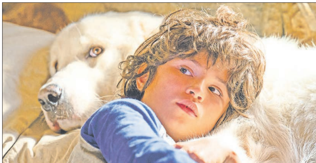
Das Eschborn K zeigt im Rahmen von „Kino-4-Kids“ den Film „Belle und Sebastian – Ein Sommer voller Abenteuer“.

Weitere Informationen finden Interessierte im Internet unter www.eschborn-k.de .