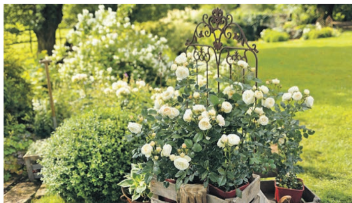
Rosen lieben die Sonne und belohnen Gartenfreunde mit üppiger Blüte.