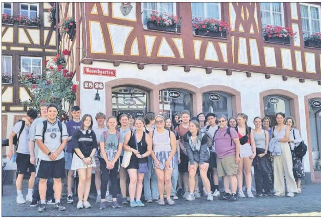
Deutsch-amerikanische Freundschaftspflege bei einem Besuch in Mainz.