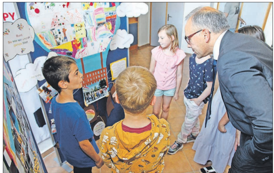
Die Kinder der Kita Rosenweg führen Bürgermeister Adnan Shaikh durch ihr interaktives Bilderrätsel.

Trotz der Vielfalt der Kommunikationsmedien hatten die unterschiedlichen Projekte eines gemeinsam: den selbstbestimmten und selbstbewussten Umgang mit Medien und Performance. „Die Eschbornale war auch in diesem Jahr eine fantastische Gelegenheit für die Kinder der städtischen Kinderbetreuungseinrichtungen, ihre Medienkompetenz zu verbessern und ihre eigene Kreativität selbstbestimmt und selbstwirksam auszudrücken“, freute sich die Erste Stadträtin und Dezernentin für Kinderbetreuung Bärbel Grade.