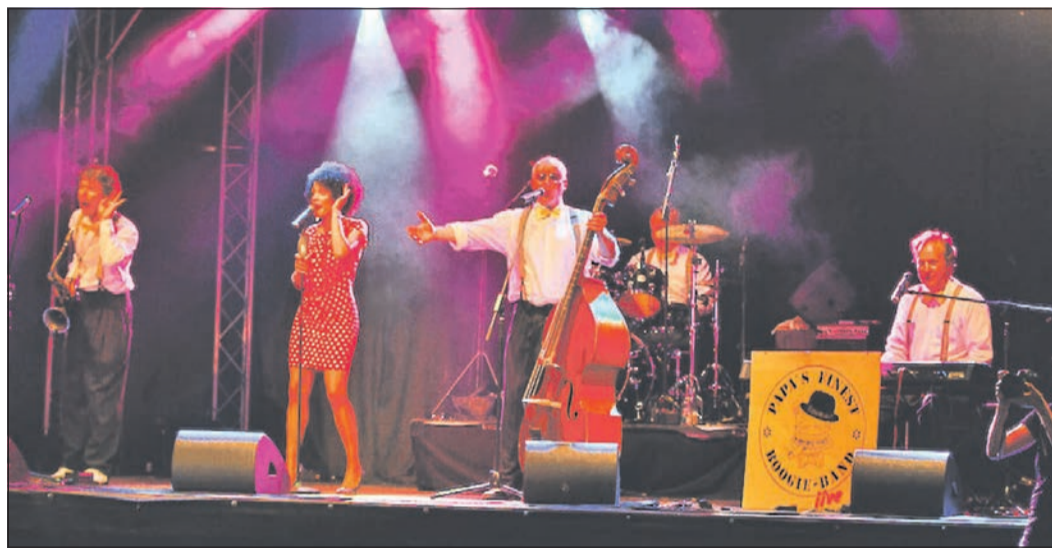
Die „Papa’s Finest Boogie-Band“ lädt die Besucher zum Mitswingen bei ihrem Auftritt im Bürgerzentrum Niederhöchstadt ein.

Sitzgelegenheiten sind vorhanden. Der Eintritt ist frei. Bei sehr schlechtem Wetter findet das Sommertheater in der Stadthalle statt.