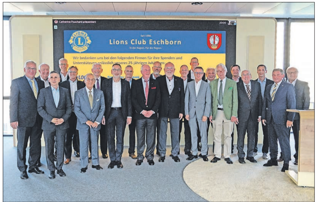
Viele Teilnehmer sind gekommen, um dem Lions Club in Eschborn zum 25-jährigen Bestehen zu gratulieren.