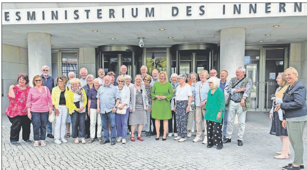
Die DAGS besucht Ministerin Faeser (Mitte) im Bundesministerium des Innern.

An den darauffolgenden Tagen gab es Einblicke in die dunkleren Kapitel der deutschen Geschichte: Im „Berlin Story Bunker“ war eine detaillierte Bild- und Textdokumentation über die Entstehung des Nationalsozialismus, die Verbrechen jener Zeit und das Ende – auch vieler Berliner – bei der Flutung des Bunkers am 2. Mai 1945 zu sehen. Auch die Gedenkstätte Berliner Mauer sowie das Stasigefängnis in Hohenschönhausen wurden besucht. Dort wurde der mehrere Jahre in Schwalbach wohnhafte, vielfach ausgezeichnete Autor Klaus Kordon, mit Werken wie „Schwarzer