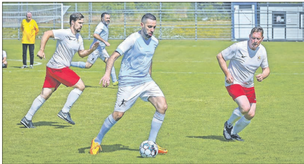
Spannende Spiele und Zweikämpfe gibt es beim zweiten Kleinfeldturnier der Stadt Eschborn auf der Heinrich-Graf-Sportanlage.

Fische Anfängliche Disharmonien lösen sich ab der Wochenmitte in Wohlgefallen auf. Jetzt können Sie sich voll und ganz den Dingen widmen, die Ihnen wichtig sind. 20. 2. – 20. 3.