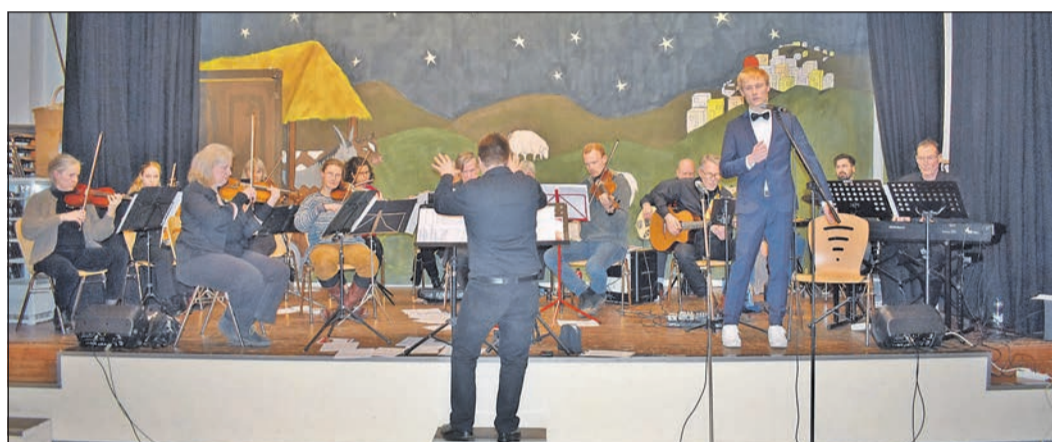
Ein kurzweiliges Programm begeistert die Zuschauer beim Adventskonzert der Musikschule Taunus, darunter auch die eigens zu diesem Anlass formierte „Musikschulband“, in der Lehrende und Lernende gemeinsam spielen.