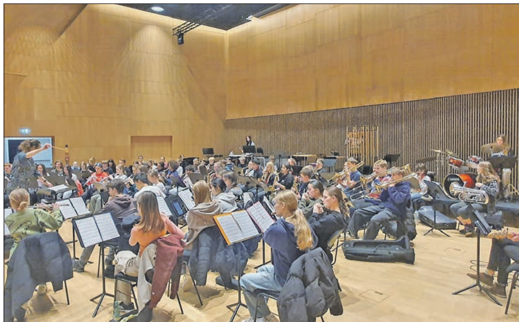
Intensive Probearbeit der Schüler der Heinrich-von-Kleist-Schule in der Musikakademie Schloss Weikersheim.