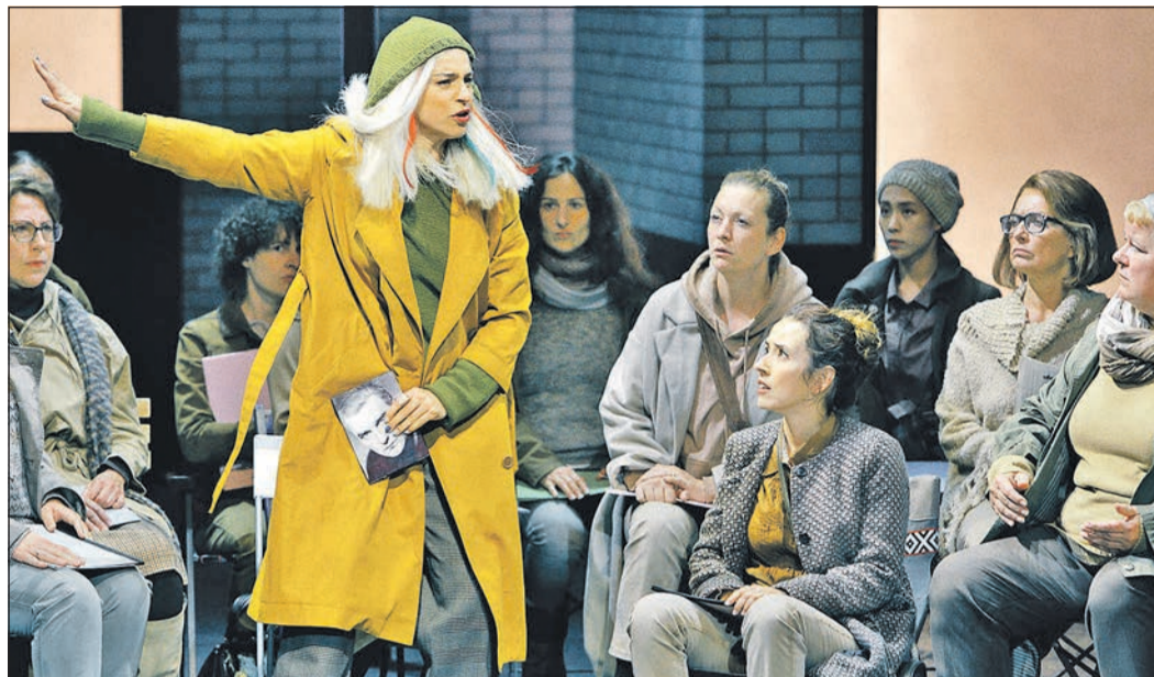
Das Eschborn K zeigt die Aufzeichnung der Inszenierung zur Eröffnung der Bayreuther Festspiele 2021 der Oper „Der fliegende Holländer“.