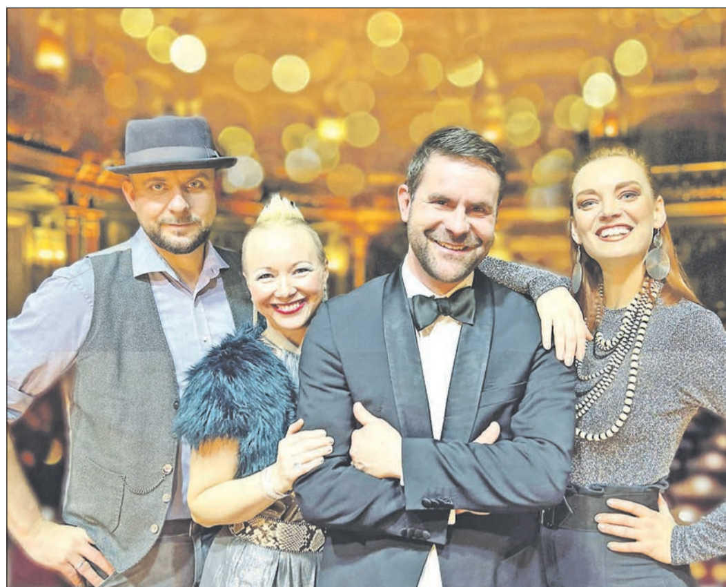
Das weihnachtliche A-cappella-Konzert „Joy To The World“ von „ONAIR“ in der Reihe „Andere Töne“ am Donnerstag, 14. Dezember, um 19 Uhr im Bürgerzentrum Niederhöhnstadt ist ausverkauft. Das Kulturamt bittet darum, von Anrufen für Kartenbestellungen für diese Veranstaltung abzusehen.