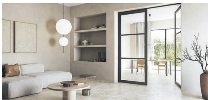
Fliesen in Natursteinoptik, warme Wandfarben und natürliche Wohntextilien ergänzen sich zu einem naturschönen Wohnambiente, das Ruhe und Gelassenheit vermittelt.

(DJD). Die Farben, Formen und Texturen der Natur sind eine unerschöpfliche Quelle der Inspiration für die Gestaltung von Wohnräumen mit einer harmonischen und beruhigenden Atmosphäre. Fliesen in Holz- und Natursteinoptik bringen diesen zeitlosen Charakter in alle Wohnbereiche. Für exklusive Eleganz steht Marmoroptik, die Opulenz mit natürlicher Anmutung verbindet. Vintage-Fliesen mit traditionellen Motiven in neuem Look, Terrazzo- oder Terrakottaoptiken bringen einen Hauch von mediterranem Landhaus in die eigene Wohnung. Allen keramischen Belägen gemeinsam ist dabei ihre hohe Pflegeleichtigkeit und Haltbarkeit. Besonders umweltfreundlich produziert werden Fliesen in Deutschland. Unter www.deutsche-fliese.de gibt es dazu viele weitere Informationen und spannende Einrichtungsinspirationen.