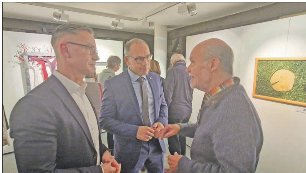
Die „Werkstatt 93“ feiert in diesem Jahr ihr 30-jähriges Bestehen mit der Ausstellung unter dem Titel „Das Ungewöhnliche“. Bei der Vernissage werden auch Fachgespräche geführt, hier mit Bürgermeister Adnan Shaikh (Mitte).

Die „Werkstatt 93“ feiert in diesem Jahr ihr 30-jähriges Bestehen mit der Ausstellung unter dem Titel „Das Ungewöhnliche“. Gezeigt werden unter anderem Gemälde, Fotos, Installationen und Kalligrafien von 14 Mitgliedern der Gruppe. Die Ausstellung ist noch bis zum 18. Februar zu den üblichen Öffnungszeiten des Museums zu besichtigen. Zwischen Weihnachten und Neujahr ist das Haus allerdings geschlossen.