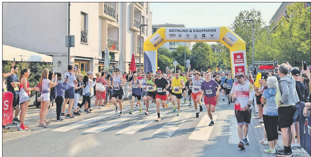
Startschuss und Teilnehmerrekord beim 10. Eschathlon-Jubiläumslauf.

Anstatt sich im trauten Heim zu verschansen, sollten Sie endlich einmal wieder ein vergnügliches Treffen im Freundes- und Bekanntenkreis organisieren. Das bereitet allen Spaß! 20. 2. – 20. 3.