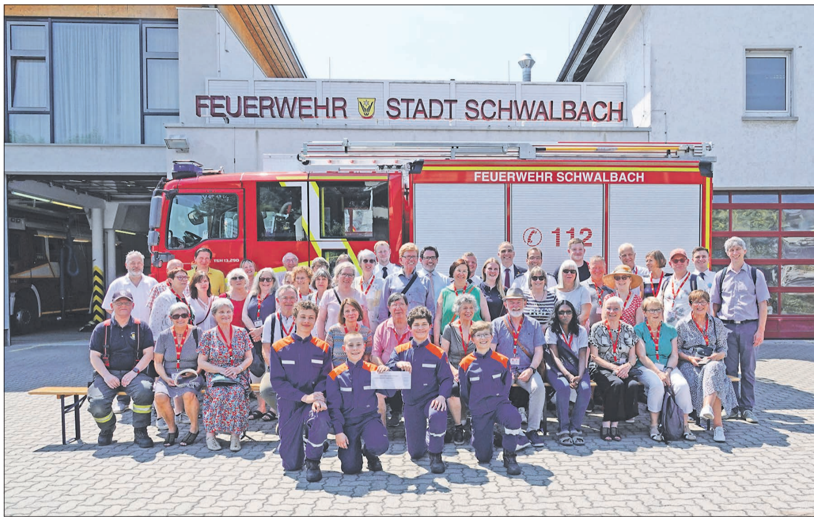
Die französischen Gäste und ihre Gastgeber bei der Freiwilligen Feuerwehr der Stadt mit der Scheckübergabe.

Schwalbacher Woche unter taunus-nachrichten.de ... und zusätzliche Artikel im Internet