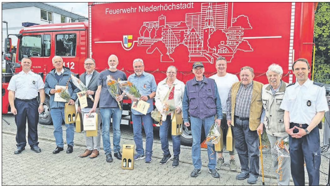
Die Feuerwehr ehrt und beschenkt die langjährigen Fördermitglieder reich für ihre treue Unterstützung.