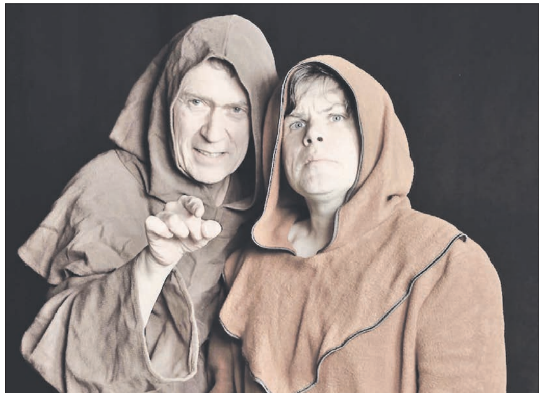
„Die Dramatische Bühne“ zeigt „Der Name der Rose“ als Theaterstück im Rahmen des „Summertime“-Programms.