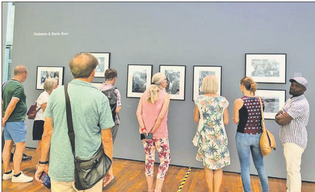
Aussagekräftige Fotos der Ausstellung locken viele Besucher an.

130 Arbeiten sind in der Fotoausstellung in der Deutschen Börse zu sehen. Die Ausstellung strukturiert sich auf der Basis des gleichnamigen Buches. Für weitere Führungen kann man sich im Internet unter www.deutscheboersephotographyfoundation.org anmelden.