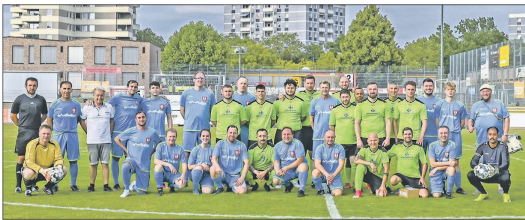
Die Fußballmannschaft der städtischen Körperschaften Eschborn besiegt den 1. FC Renault Frankfurt in einem spannenden und torreichen Freundschaftsspiel.