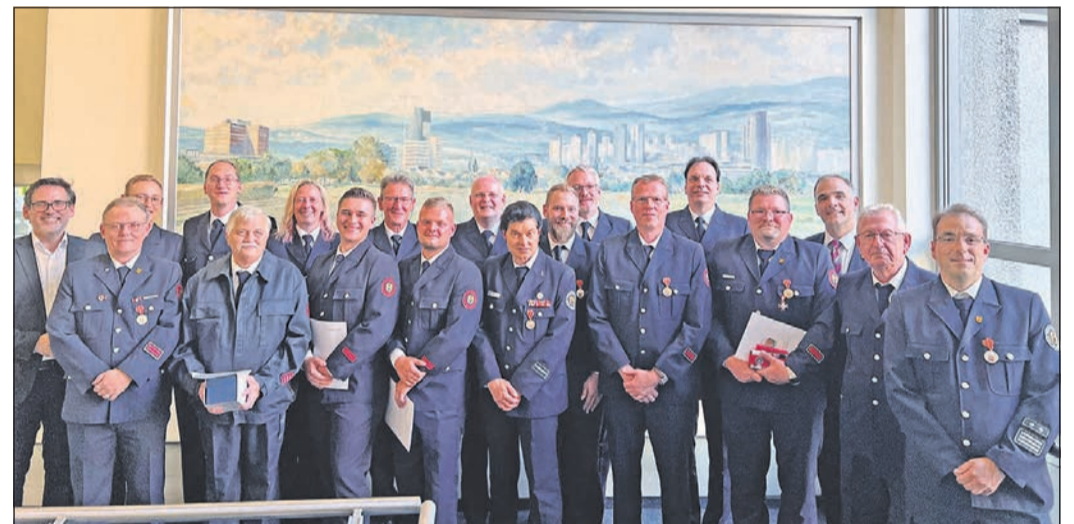
Alle Geehrten der Einsatzabteilung der Feuerwehr Schwalbach.

Am Schluss wurden noch einige Ehrungen vorgenommen für das „Goldene Brandschutzverdienstzeichen“, die Nassauische Feuerwehrmedaille in Gold und Silber sowie das Silberne Brandschutzehrenzeichen.“