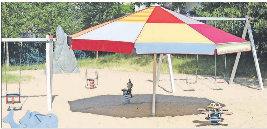
Die Stadt hat auf mehreren Spielplätzen Sonnenschirme aufgestellt, damit auch im Sommer unbesorgt dort gespielt werden kann.