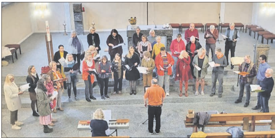
Der Gospelchor St. Nikolaus tritt am 9. Juli mit fünf anderen Chören im Bürgerzentrum Niederhöchststadt auf.