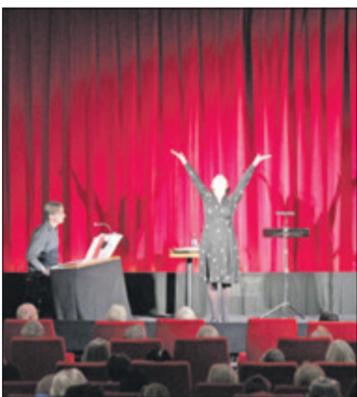
Gelungener Spagat zwischen Freude und Trauer