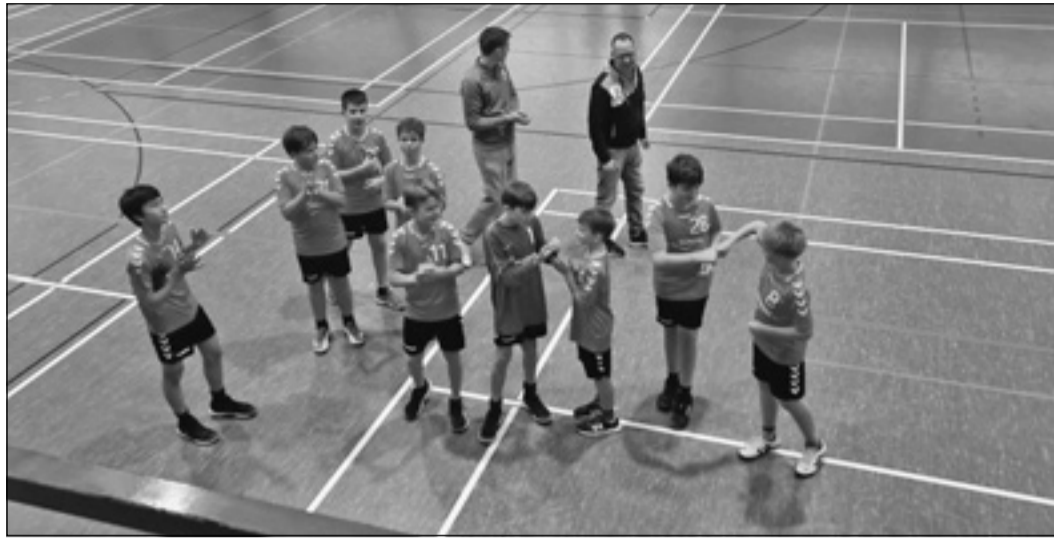
Die glücklichen Sieger der HSG Steinbach/Kronberg/Glashütten