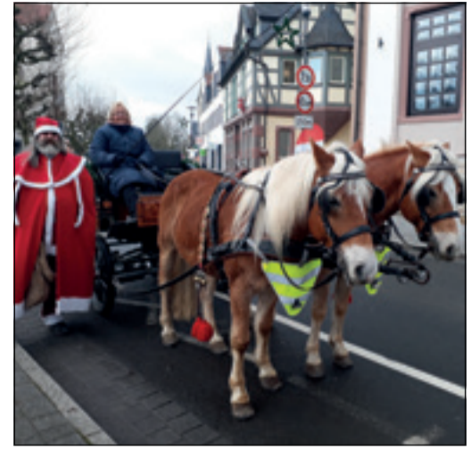
Mit der Kutsche durch das weihnachtlich anmutende Kronberg