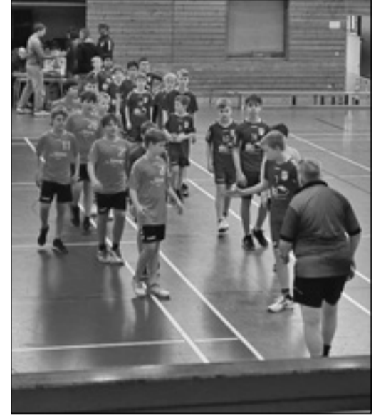
D-Jugend beim Einlauf in die Halle