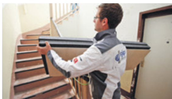
Handlich im Format, praktisch in der Verarbeitung: Die Rigidur Dachbodenelemente 032 TF (500 x 1.500 mm) bestehen aus einer hoch wärmedämmenden, graphit-veredelten EPS-Dämmlage und einer robusten Oberlage aus Gipsfaserplatten.

(epr) Es gab wohl nie einen geeigneteren Zeitpunkt, in die energetische Qualität von Bestandsgebäuden zu investieren. Denn das Wohnen in Altbauten hat seinen Charme, kann aber auch leicht zu einem teuren Vergnügen werden, wie mitunter ein Blick auf die Heizkostenabrechnung