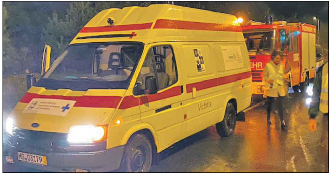
Der Rettungswagen mit medizinischer Ausstattung steht nun der ukrainischen Bevölkerung zur Verfügung.

bis zum Soldaten, von der Krankenschwester zur Unternehmerin. Sogar viele Verwundete, die gerade eine Prothese angepasst bekommen haben, wollten zurück an die Front. Die gesamte Bevölkerung lebt täglich mit der AlarmApp, die sämtliche Raketenabschüsse registriert und öfter in der Woche die Bevölkerung in die Bunker schickt“, schilderte Völcker seine Eindrücke. Die Übergabe der Fahrzeuge am Hilfsgüterlager Lviv wurde vom lokalen Rundfunk und Fernsehen begleitet. Im weiteren Verlauf des Tages besichtigten die Unterstützer das Lviv Regional Hospital of War Veterans and Repressed U.Lipi, fuhren zum Ort des Raketeinschlags vom 7. Juli, sprachen mit Betroffenen und besichtigten einen Bunker. Der Tag endete mit einem gemeinsamen Abendessen mit dem Vorstand des Rotary Clubs Lviv International, mit den Bürgermeistern von Zhovkva und Mykolajiw und Vertretern der Stadt Lviv. Im weiteren Verlauf des Aufenthalts standen die Besichtigung der Altstadt von Lviv und des „Unbroken“ Krankenhauses in Lviv, dem größten Zentrum für Prothesen und Rehabilitation in der Ukraine, ebenso auf dem Programm wie der Besuch inklusive Bunker der Gesamtschule Zhovkva. Dort traf man acht Lehrerinnen. Damit noch nicht genug. Es folgten eine Kirchenbesichtigung und geschichtliche Führung in Zhovkva sowie eine private Einladung eines Rotarier zum Dinner. Am nächsten Tag starte-