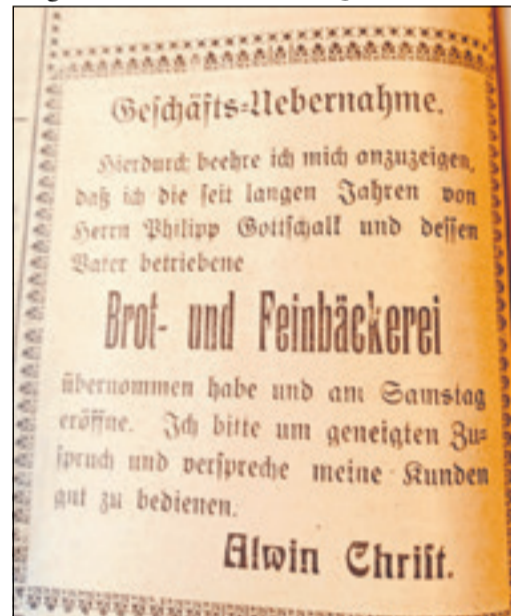
Anzeige aus dem Cronberger Anzeiger vom 29. November im Jahr 1923

Geld leihen, das sukzessive zurückzahlen war. Nach dem Kauf wurde der Betrieb im Jahr 1928 grundlegend umgestaltet. So wurde in der bisherigen Scheune die neue Backstube eingerichtet. Auf einem der Querbalken steht