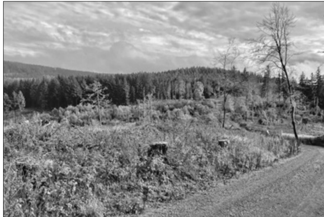
Historische Hünnerstraße auf der Wasserscheide zwischen der Weil und dem Emsbach

nach Venedig und dann sogar per venezianischer Galeere ins Heilige Land. Eine länger währende Kreuzzug-Unternehmung von Oppenheim bis nach Jerusalem. Als fünfte und letzte Route, etwa von Mainz bis Eisenach, unterwegs auf der „Kurzen“ und „Langen Hessen“. Wobei letztere auch