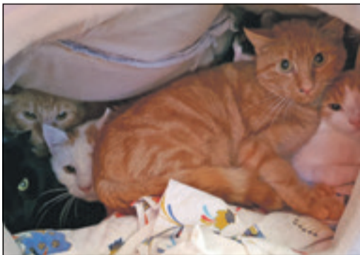
Kein Archivfoto – das sind vier Katzen, die im Text erwähnt werden.