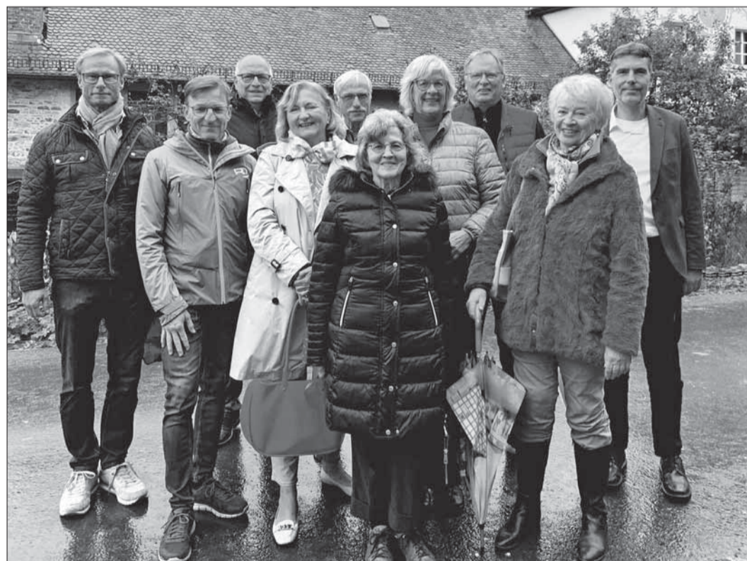
Selbst im Regen fröhlich – Verantwortliche, Restaurator und Unterstützer

Ob der Nikolaus wieder zu Besuch sein wird, kann man nur vor Ort in Erfahrung bringen.