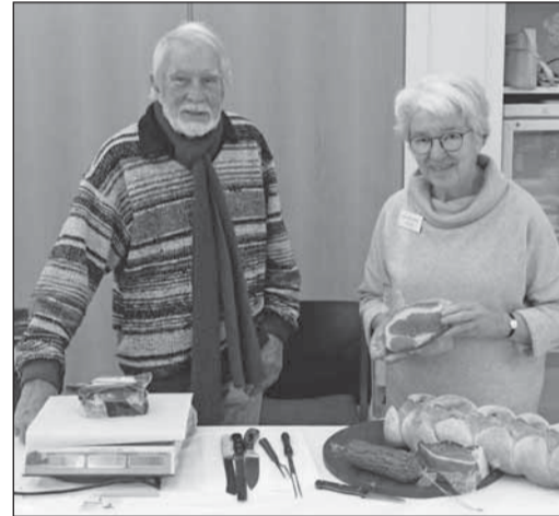
Dieses Paar zeigt großes Engagement und reist jedes Jahr aus dem Schwarzwald an.

Trotz der vielen Helfer freut sich der Verein „Bürger helfen Bürgern“ über neue Mitglieder und jeder kann selbst entscheiden, wie er sich einbringt – egal ob Einkaufen für erkrankte Mitbürger, Fahrdienste, Spazierengehen mit Senioren oder tatkräftiges Anpacken beim Basar – jede helfende Hand ist willkommen. Auch über Spenden würden sich die Mitglieder sehr freuen, das ganze Jahr über werden Geldspenden, aber natürlich auch Sachspenden jeglicher Art, angenommen. Ungewöhnliches kann ebenfalls gespendet werden, wenn jemand zum Beispiel die Ernte seines Obstbaums nicht braucht, kann man auch diese zum Einkochen zur Verfügung stellen – schon ab Januar fangen die Mitwirkenden an, den Weihnachtsbasar vorzubereiten.