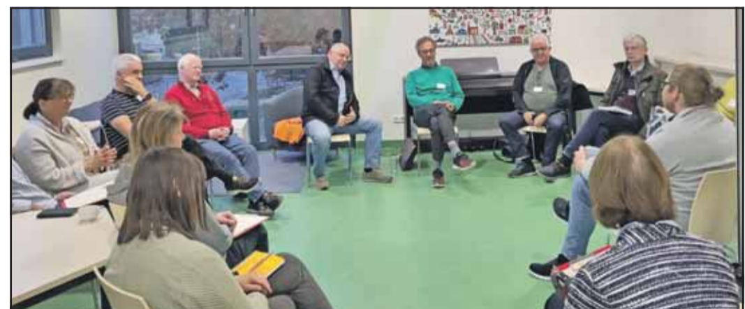
Mehr als 60 Kirchenvorsteherinnen und Kirchenvorsteher nutzten den Nachmittag in offener und konstruktiver Atmosphäre für intensive Gespräche.

Königstein (kw) – Alle Kirchenvorsteherinnen und -vorsteher im Evangelischen Dekanat Kronberg waren zu einem Kirchenvorstandstag nach Hofheim-Langenhain eingeladen. Unter dem Titel „ekhn2023 in Form bringen“ gab es dieses Mal ein von der Regionalen Ehrenamtsakademie organisiertes Barcamp. Dabei gab es keine vorgegebene Agenda, sondern die Teilnehmenden brachten selbst Themen ein, zu denen sie sich mit den anderen Kirchengemeinden austauschen wollten. Dabei ging es speziell um den Zukunftsprozess „ekhn2023“. Mehr als 60 Kirchenvorstände nutzten den Nachmittag im Kinder- und Familienhaus Langenhain in offener und konstruktiver Atmosphäre für intensive Gespräche. Zu ihren selbstgewählten Themen zählten zum Beispiel Gemeindebild der Zukunft, Motivation der Gemeinde (für den Zukunfts-