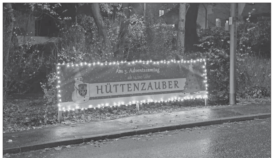
Mit einem beleuchteten Banner lädt der HBV zum Hüttenzauber ein.