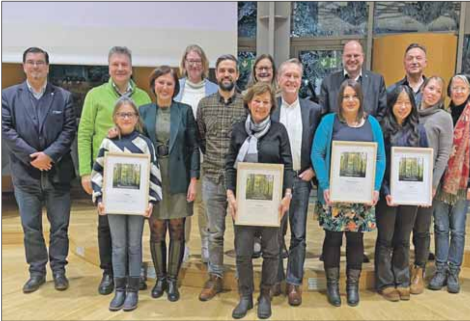
So sehen Sieger aus: Zum Abschluss gab es noch ein Siegerfoto mit allen Beteiligten.