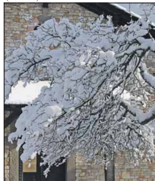
Winterimpressionen auf der Saalburg.

tagen um 14 Uhr öffentliche Kastellführungen. Für Feiern von Firmen und Privatleuten sind die historischen Räume des Kastells, gerade auch in der Vorweihnachtszeit, begehrte Orte für Veranstaltungen. Anmeldungen für Führungen und Veranstaltungen unter Tel. 06175/9374-20 (Frau Krieger) oder /9374-0 (Zentrale).