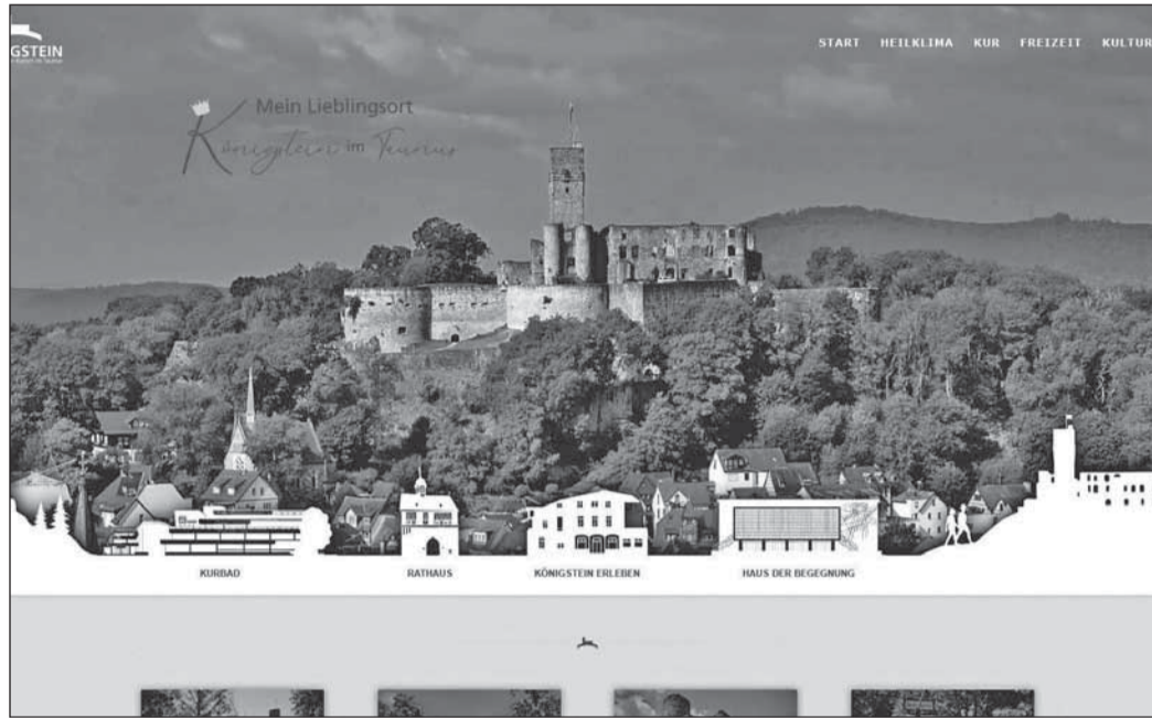
Die Startseite zeigt das unverwechselbare Wahrzeichen Königsteins.