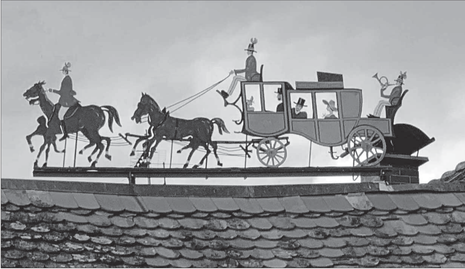
Die edlen Gäste auf dem Weg zum Schlosse, vor ihnen die Jagdgesellschaft. In dem herrschaftlichen Gemäuer gab es nach der Jagd einen großen Ball. So kommt es auch, dass die Dachreiter, seit sie den Dachfirst schmücken, in Richtung des Schlosses ausgerichtet sind.