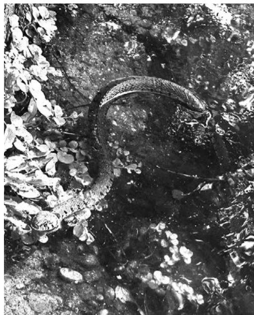
sollte es in Ruhe lassen und sich entfernen, empfiehlt der städtische Umweltschutzbeauftragte.