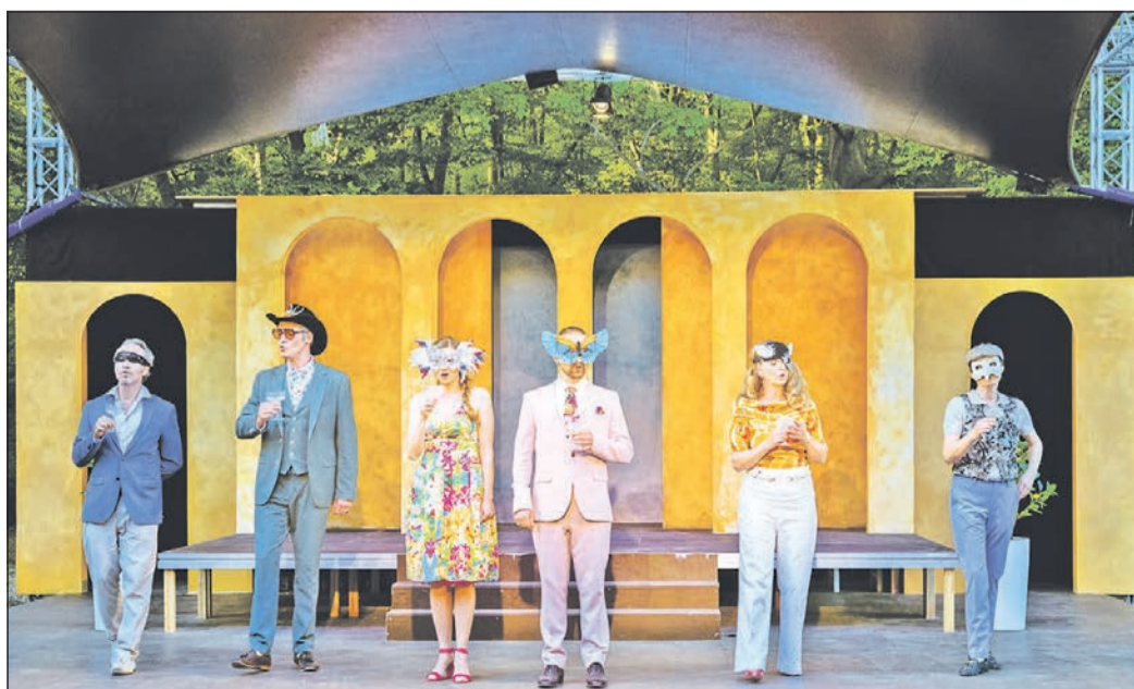
„Viel Lärm um nichts“, Shakespeares beliebte Komödie, wird im Rahmen der Theatersaison im Oktober gezeigt.

Den Anfang macht das „Bridges Kammerorchester“, gefolgt vom „Fidelio Ensemble“, dem Neujahrskonzert mit dem in Eschborn beliebten Salonorchester „Cappuccino“ und dem erstklassigen Vokalsextett „voice-made“.