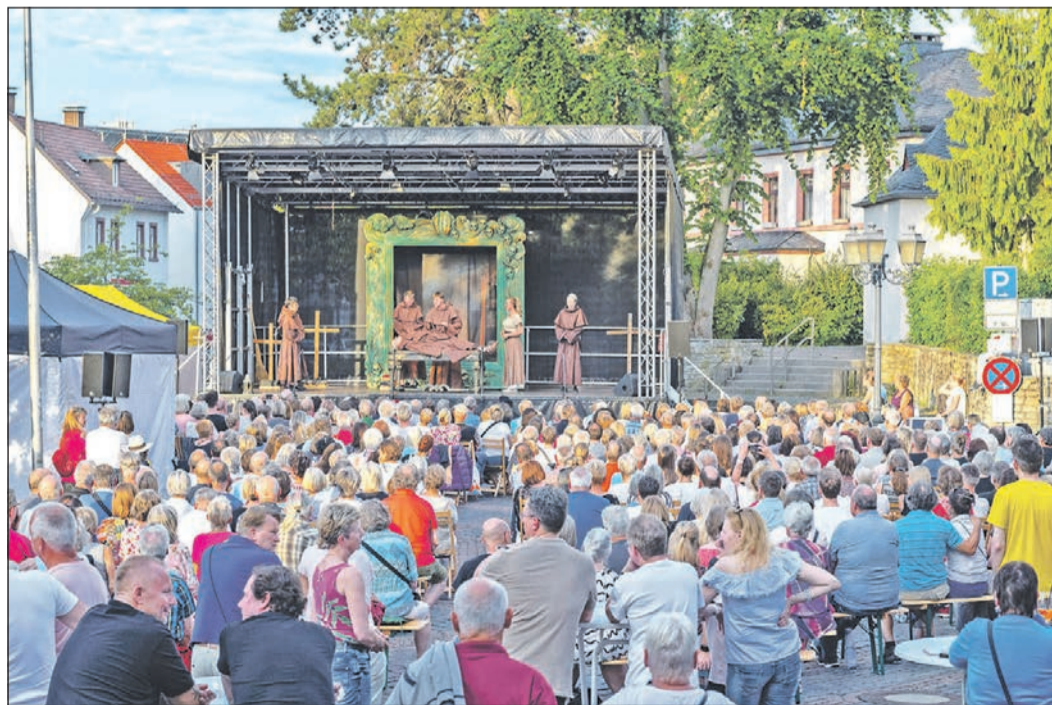
Das Kulturreferat der Stadt Eschborn hat mit 27 Veranstaltungen diesen Sommer wieder ein fantastisches „Summertime“-Programm auf die Beine gestellt – von Theater über Konzerte bis hin zum Open-Air-Kino und vielem mehr. Die Veranstaltungen sind wie hier bei der Dramatischen Bühne gut besucht gewesen.

Der Verein bittet um unverbindliche Anmeldung unter Telefon 06196-42006 oder per E-Mail an info@gemischter-chor-eschborn.de . Weitere Informationen zu den Angeboten und Aktivitäten des Vereins gibt es auf der Homepage unter www.gemischter-chor-eschborn.de .