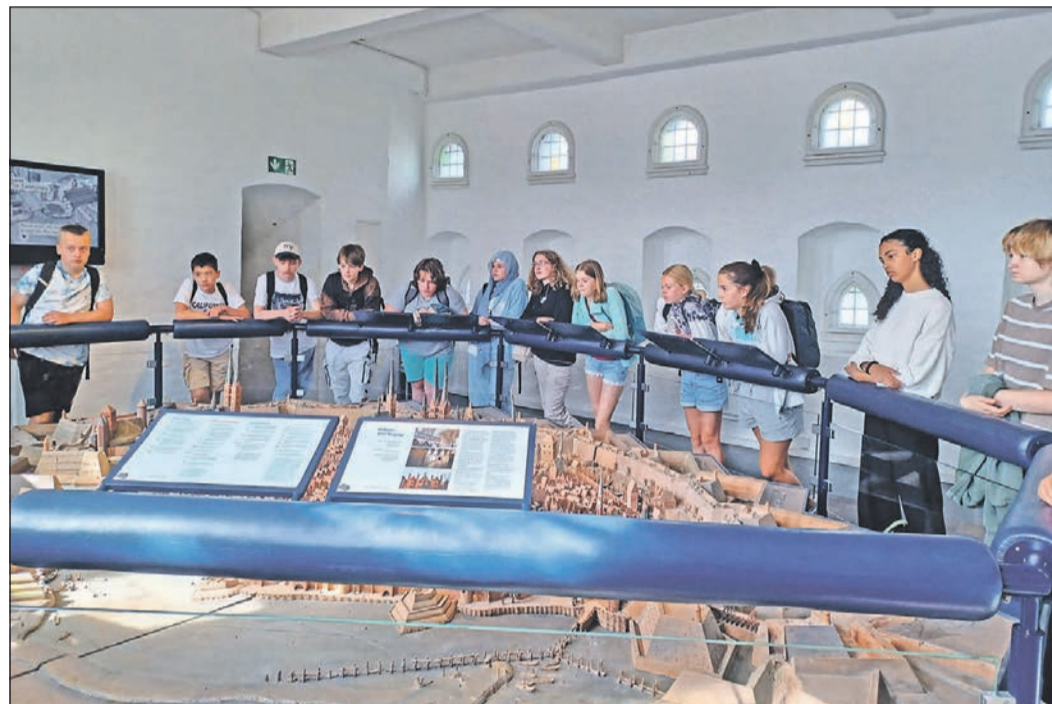
Beim Besuch des Museums Holstentor erfahren die Jugendlichen viel über die historische Bedeutung der Hansestadt Lübeck.