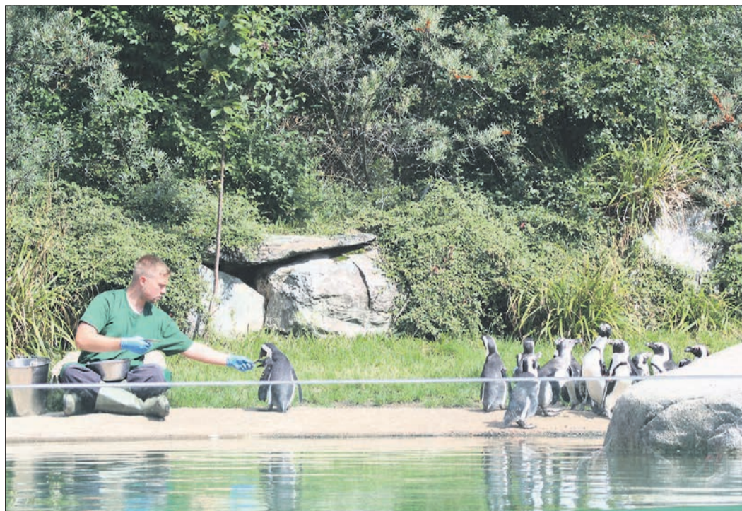
Pinguine begeistern einfach alle. Besonders bei der Fütterung, die man hier einfach so verfolgen kann, zaubern die kleinen, watschelnden Lebewesen ein Lächeln auf die Gesichter der Besucher.

Möchte man die Madagaskar-Voliere mit Kattas und Roten Varis genauer entdecken und dabei einen Zoopädagogen an der Seite haben, bieten die Pädagogen dreimal täglich