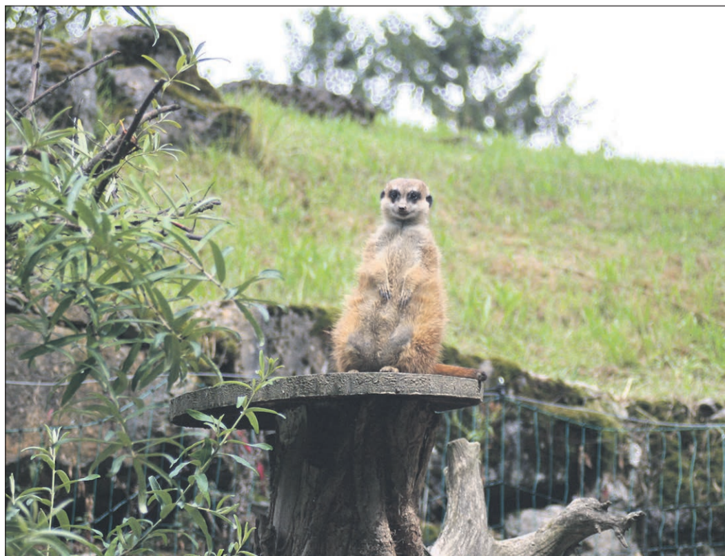
Das Wächter-Erdmännchen behält immer alles im Blick. In dieser Position wechseln sich die Erdmännchen ab und schützen so die ganze Familie mitsamt der Jungtiere.

berg direkt zum Tierpark. In der Sommerzeit ist der Zoo täglich von 9 bis 18 Uhr geöffnet. Die Tickets sind allerdings im höheren Segment. Tickets für Erwachsene kosten 17 Euro, Kinder bis 14 Jahre zahlen noch 9,50 Euro. Die Mitnahme eines Hundes ist für zwei Euro möglich. Gruppenermäßigungen sind grundsätzlich möglich.