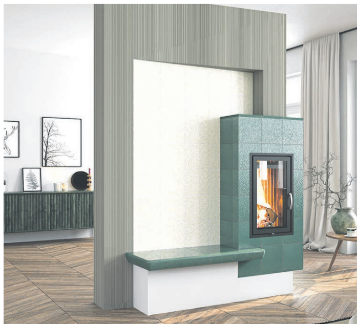
Ein moderner Kachelofen nutzt den regenerativen Energieträger Holz sehr effizient, um behagliche Wärme zu spenden.

(DJD). Nach heftigen Diskussionen innerhalb der Ampel-Koalition steht der Zeitplan für das neue Gebäudeenergiegesetz (GEG) nun auf der Kippe, die meisten Experten rechnen nicht mehr mit einer schnellen Verabschiedung des Gesetzes durch Bundestag und Bundesrat. Sollte es dabei bleiben, dass neue Heizungen ab 2024 zu 65 Prozent mit erneuerbaren Energien betrieben werden müssen, können Holzfeuerstätten dazu beitragen und in Verbindung mit anderen regenerativen Energiequellen einen wichtigen Teil der Energie liefern. Angesichts der aktuellen Unsicherheiten sollten Hausbesitzer, die eine Holzheizung besitzen oder einbauen wollen, auf jeden Fall den Rat vom Fachbetrieb einholen, um auf der sicheren Seite zu sein. Adressen in der Nähe findet man unter www.kachelofenwelt.de .