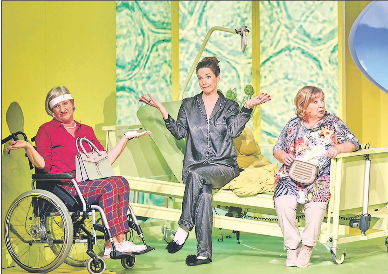
Das Musiktheater „Himmlische Zeiten“ gastiert zu Beginn der neuen Theatersaison in der Eschborner Stadthalle und präsentiert das Stück mit viel Musik, Witz und Schlagfertigkeit.