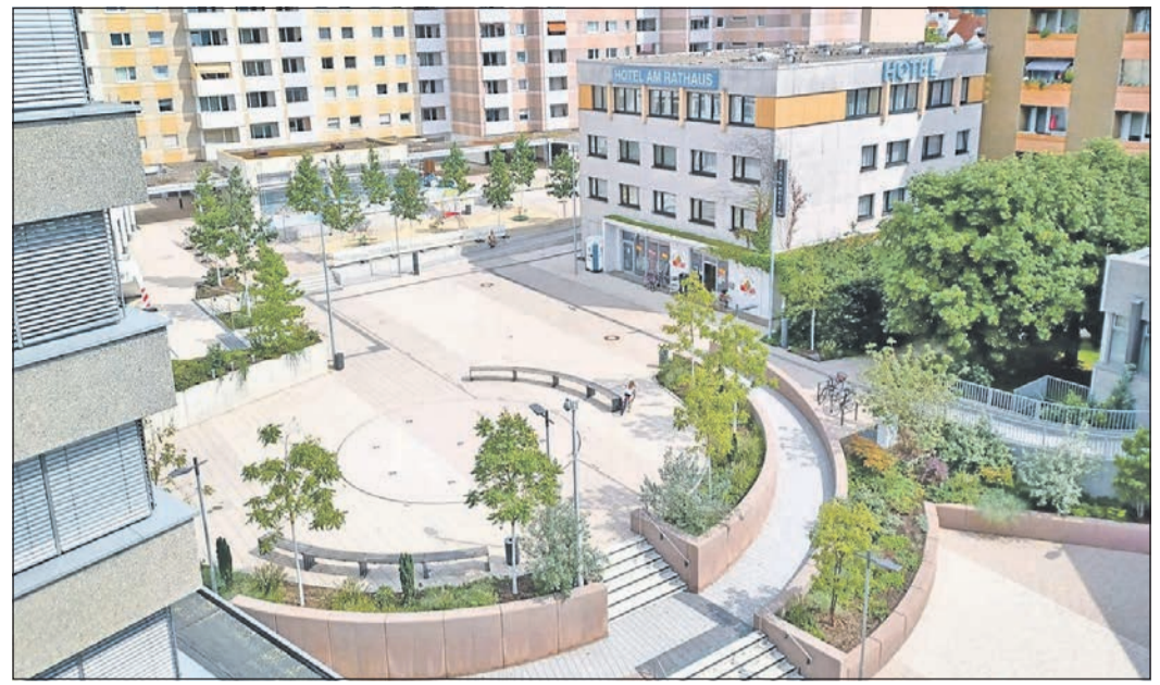
Der untere Marktplatz ist nach seiner Neugestaltung seit Mitte August nun wieder für die Passanten freigegeben. Die offizielle Übergabe des Platzes an die Öffentlichkeit erfolgt beim Interkulturellen Marktplatzfest am kommenden Sonntag.

Die „Woche der offenen Chöre“ wird im Rahmen des Förderprogramms „Kultur in ländlichen Räumen“ durchgeführt, gefördert von der Beauftragten der Bundesregierung für Kultur und Medien aufgrund eines Beschlusses des Deutschen Bundestags.