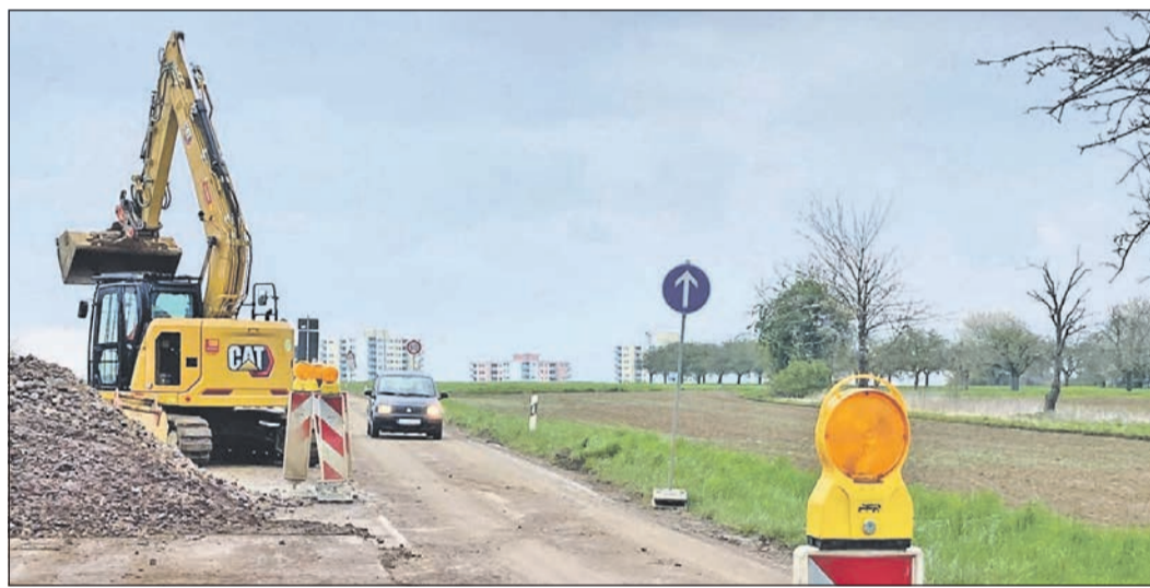
Langsam nähert sich das Ende der Baumaßnahme am Radweg zwischen Niederhöchststadt und Steinbach.