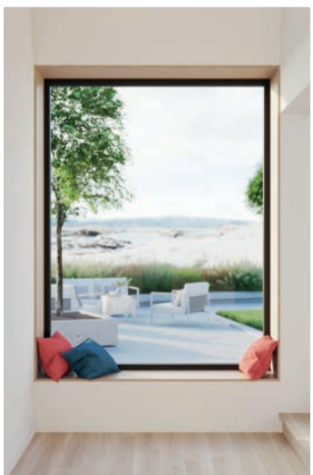
Hybrid ist schlank wie Zweifach-Isolierglas, dämmt aber mehr als doppelt so viel Wärme und schützt gleichzeitig effektiv vor dem Straßenlärm.

weise aufwendig, der Glastausch ist oft günstiger, schneller und nachhaltiger. Die Modernisierung mit Fineo Vakuumglas wird staatlich gefördert: Die Bedingungen unter www.bafa.de/beg , mehr zu Fineo auf www.fineoglass.eu .