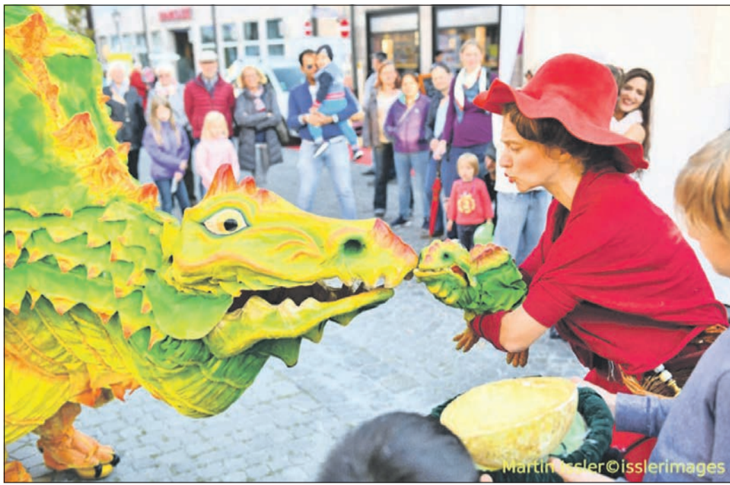
Beim diesjährigen Eschenfest am 13. und 14. Mai begeistern auch verschiedene „Walk-Acts“ wie „Onil der Drache“ die Besucher.