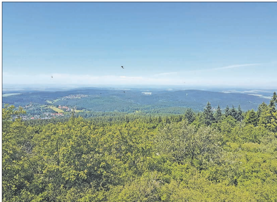
Wunderschöne Ausblicke über den Naturpark Taunus eröffnen sich den Wanderern bei den zahlreichen Touren.