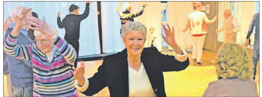
Viel Freude macht das Projekt „Wir tanzen weiter“ für Menschen mit und ohne Demenz. Dies geht jetzt in die dritte Runde, und die Anmeldung startet.

wichtiges und sehr bedeutsames Projekt für die Integration von Menschen mit Demenz. Die Andreasgemeinde freut sich, dass sie dafür die Tanzschule Pelzer in Bad Soden gewinnen konnte. Jeder ist eingeladen, sei es aus stationären Einrichtungen oder aus dem privaten Umfeld – in Begleitung von Ehepartnern, Pflegern, ehrenamtlichen Helfern oder Freunden. Getanzt wird jeweils freitags, am 5. Mai, 2. Juni und 7. Juli. Einlass ist um 13.30 Uhr und Tanzzeit von 13.45 bis 14.45 Uhr – unter der professionellen Leitung des Tanzlehrers und Unterstützung der Demenzbegleiterinnen – in der Tanzschule Pelzer, Zum Quellenpark 31, 65812 Bad Soden. Die Kosten betragen neun Euro pro Person. Eine Anmeldung ist erforderlich. Anmeldung unter Telefon 06173-7828730 oder per E-Mail an demenzberatung@andreasgemeinde.de . Infos gibt es im Internet unter www.andreasgemeinde.de/gemeindeleben/demenzzentrum .